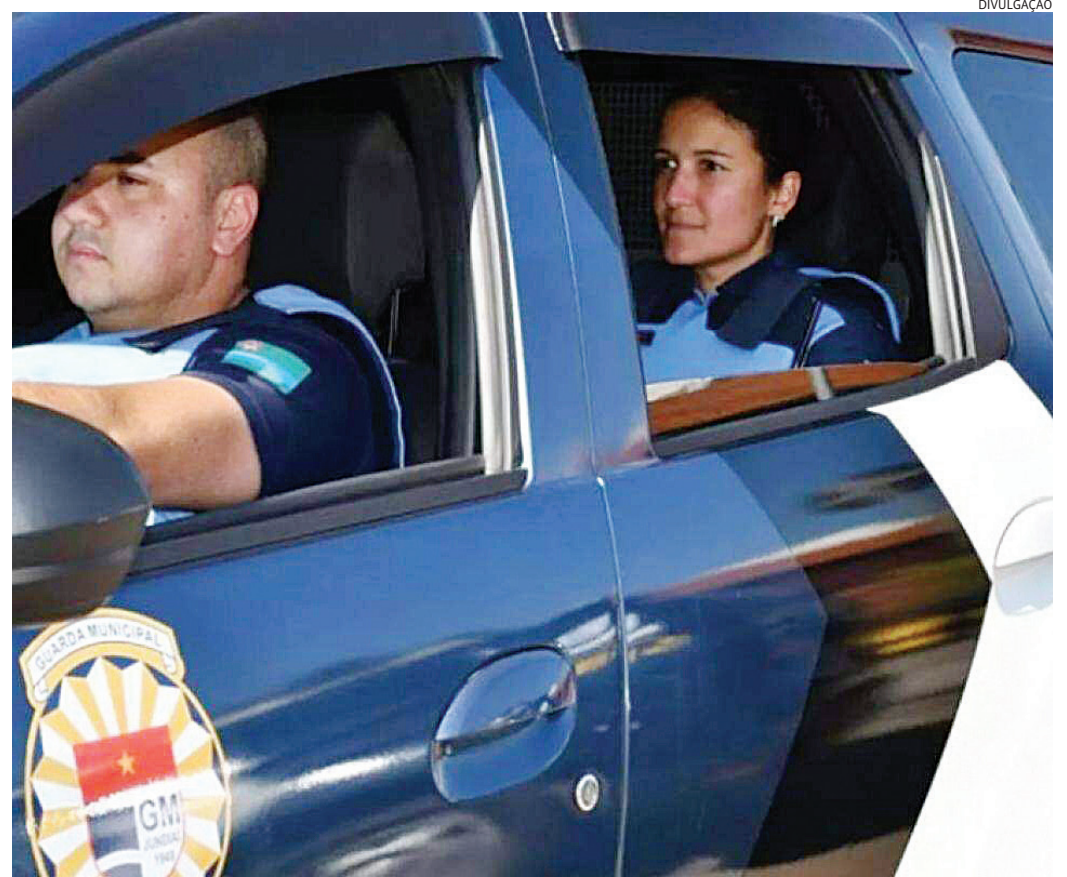
Os dados do Guardiã Maria da Penha mostram que a GM já recebeu neste ano 850 medidas protetivas

De acordo com painel estatístico do Conselho Nacional de Justiça (CNJ), Jundiaí teve um descumprimento de medida protetiva da Lei Maria da Penha que chegou à esfera jurídica neste ano, no período de ja-