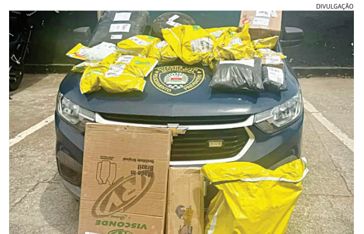
Os produtos foram recuperados e devolvidos à vítima