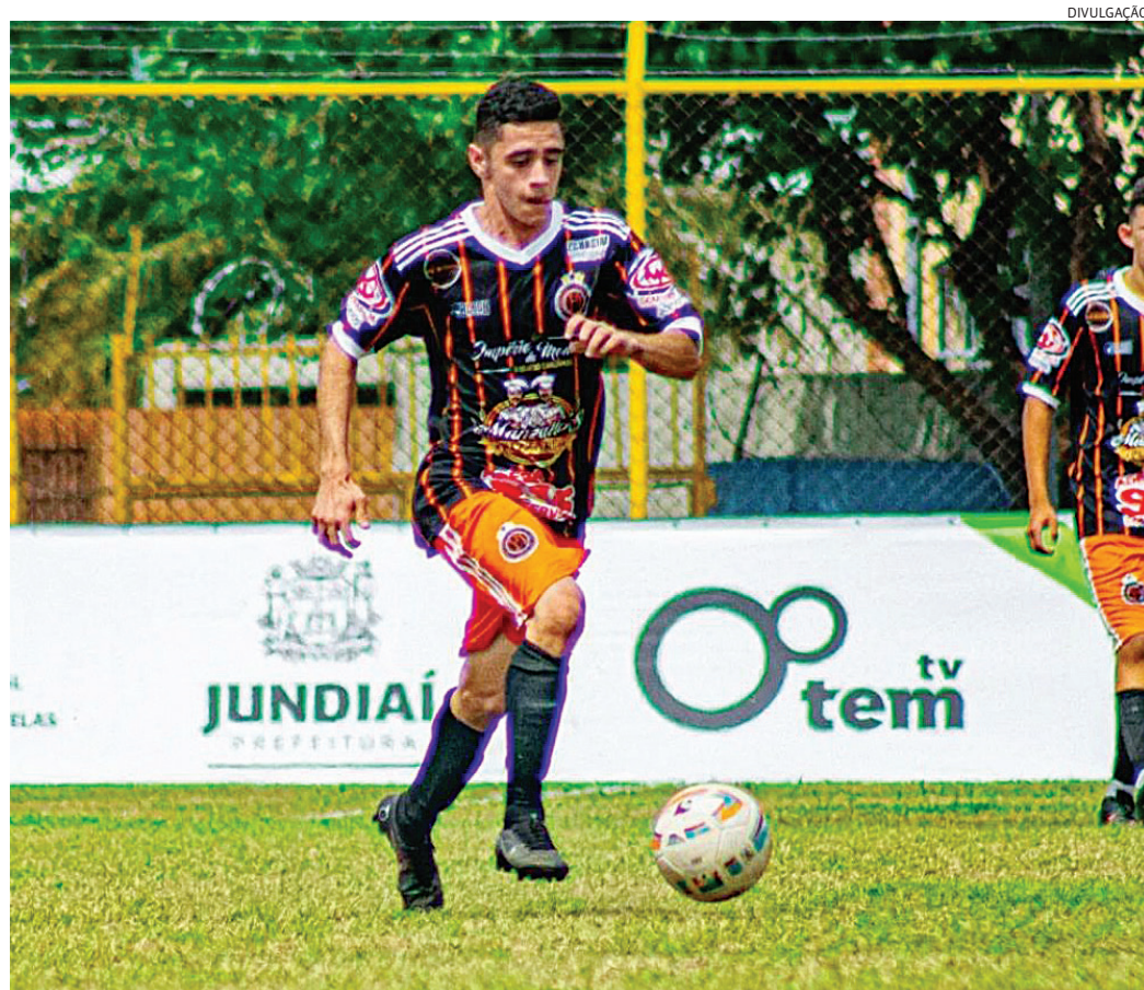
O jundiaieense joga futebol há mais de 12 anos e disputou a última Taça das Favelas

“Minha paixão pelo futebol começou desde pequeno, quando assistia