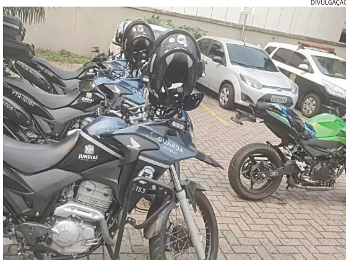
A motocicleta foi recuperada e devolvida à vítima