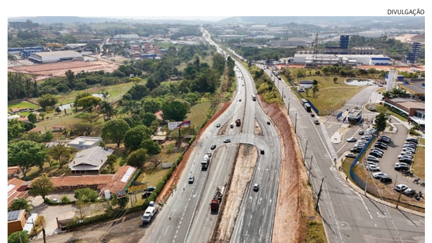
Intervenção amplia uma faixa de rolamento em 500 metros, além de novo acesso

Desde o dia 1º de outubro, o novo retorno na rodovia Hermenegildo Tonolli, próximo ao Distrito Industrial FazGran, está em operação. O dispositivo foi construído em uma parceria entre a Prefeitura de Jundiáí e o Departamento de Estradas de Rodagem (DER). Cidades 5