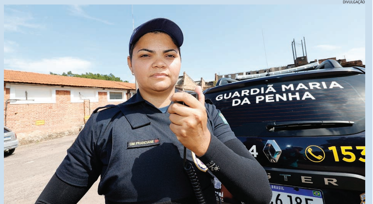
Patrulha Guardiã Maria da Penha, da GM Jundiáí, existe há cinco anos, para acompanhar mulheres vítimas de violência doméstica

Os atendimentos a mulheres vítimas de violência doméstica, que têm medida protetiva contra seus agressores, aumentaram 37% em Jundiáí em setembro, na comparação ao mesmo mês do ano passado. O índice é da Patrulha Guardiã Maria da Penha, da Guarda Municipal de Jundiáí, que acompanha atualmente 180 medidas protetivas ativas encaminhadas pelo Ministério Público. De janeiro a setembro, foram acompanhadas mais de 850 medidas protetivas. Cidades 4