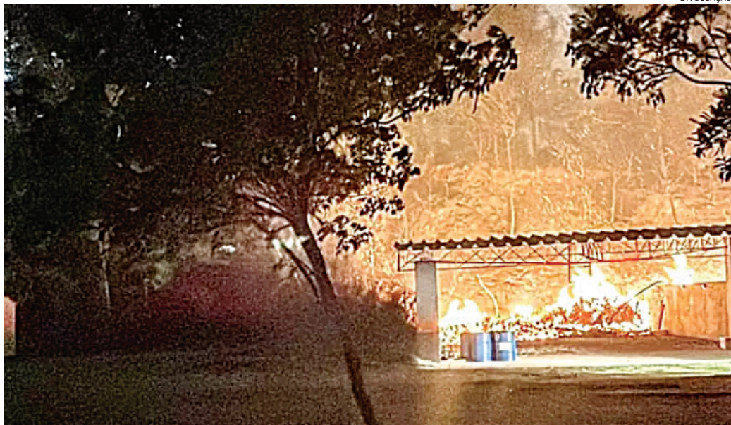
O fogo se alastrou rapidamente e chegou a atingir o estande da GM também, mas os guardas conseguiram apagar

As chamas se alastraram rapidamente e chegaram ao estande da Guarda, sendo que o fogo foi contido pelos agentes que chegaram rapidamente - guardas da Divi-