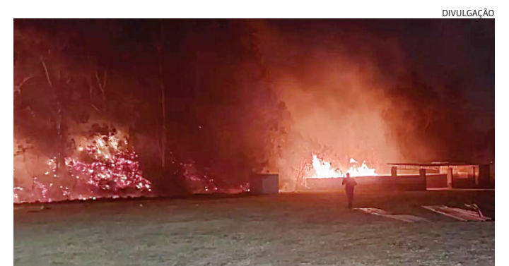
O estande da PM foi destruído, e o da GM teve pequenos prejuízos