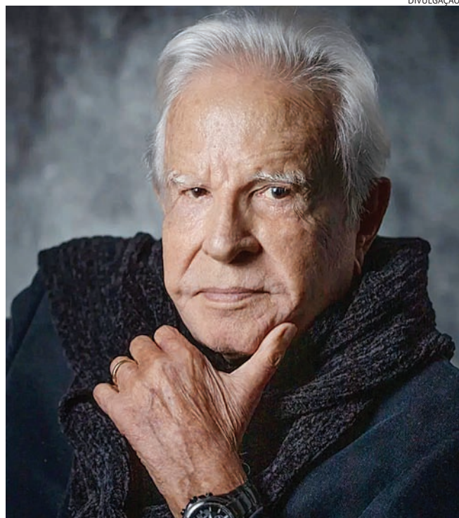
Cid foi um dos personagens mais icônicos do jornalismo

O jornalista iniciou a carreira no rádio em 1944, depois de ser descoberto por um amigo que o incentivou a fazer um teste de locução na Rádio Difusora de Taubaté. Nos anos seguintes, entre 1944 e 1949, ele narrou comerciais até se mudar para São Paulo, onde trabalhou na Rádio Bandeirantes e na Propago Publicidade.