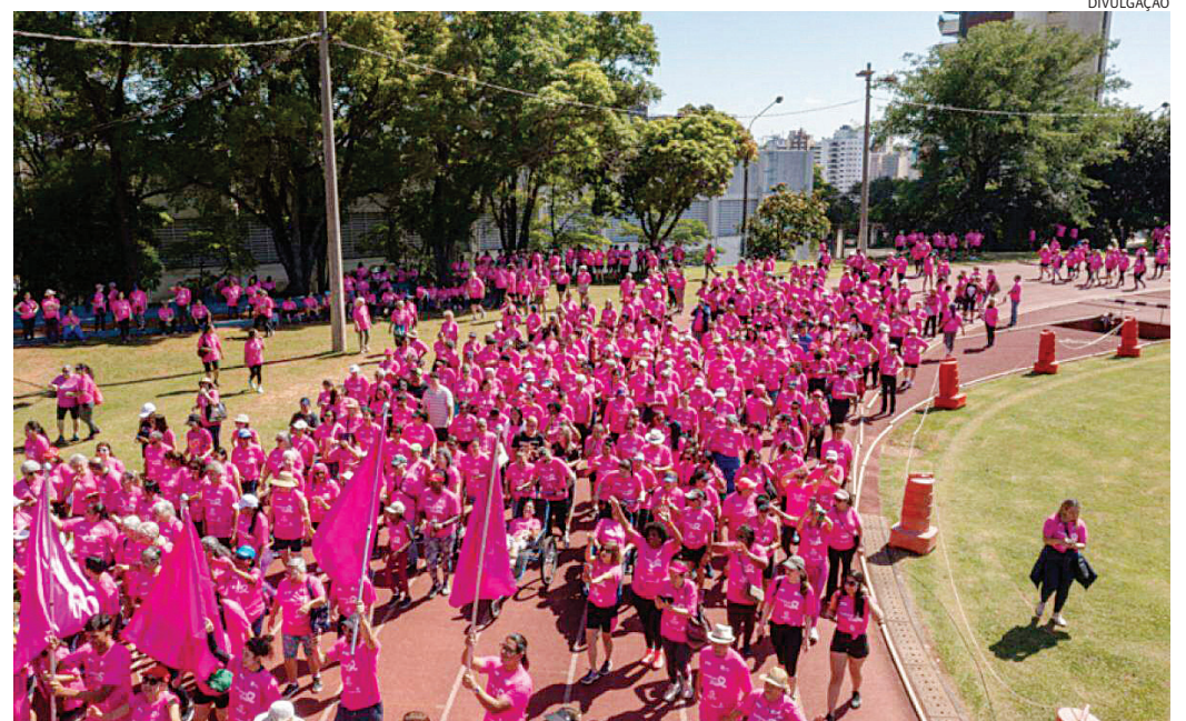
No dia 13 de outubro, Jundiaí se veste de rosa na luta contra o câncer de mama