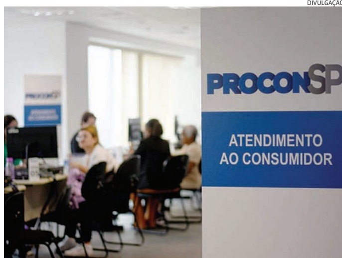
Levantamento apontou que eles sentem dificuldade em contatar empresas

A maioria dos participantes da enquete, 91,28%, afirmou que acessa a internet e aplicativos. Dentre os que não acces-