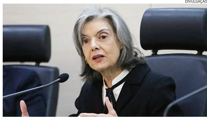
Ministra do TSE, Cármen Lúcia, conchama os eleitores a votarem no domingo

A três dias da eleição, o Datafolha aponta um cenário embola-