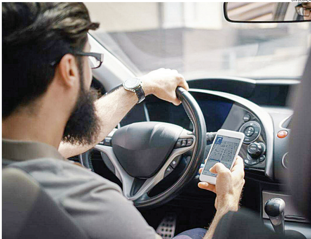
Quando um condutor dirige utilizando o telefone celular, seus reflexos ficam menos ágeis

De acordo com o Departamento Estadual de Trânsito de São Paulo (Detran-SP), as multas de trânsito referentes ao uso do celular podem ser aplicadas pelas três esferas de órgãos atuadores: municipal, estadual e federal. As autuações estaduais pertencem ao Detran-SP. Em Jundiaí, ao todo, o órgão aplicou, de janeiro a agosto deste ano,