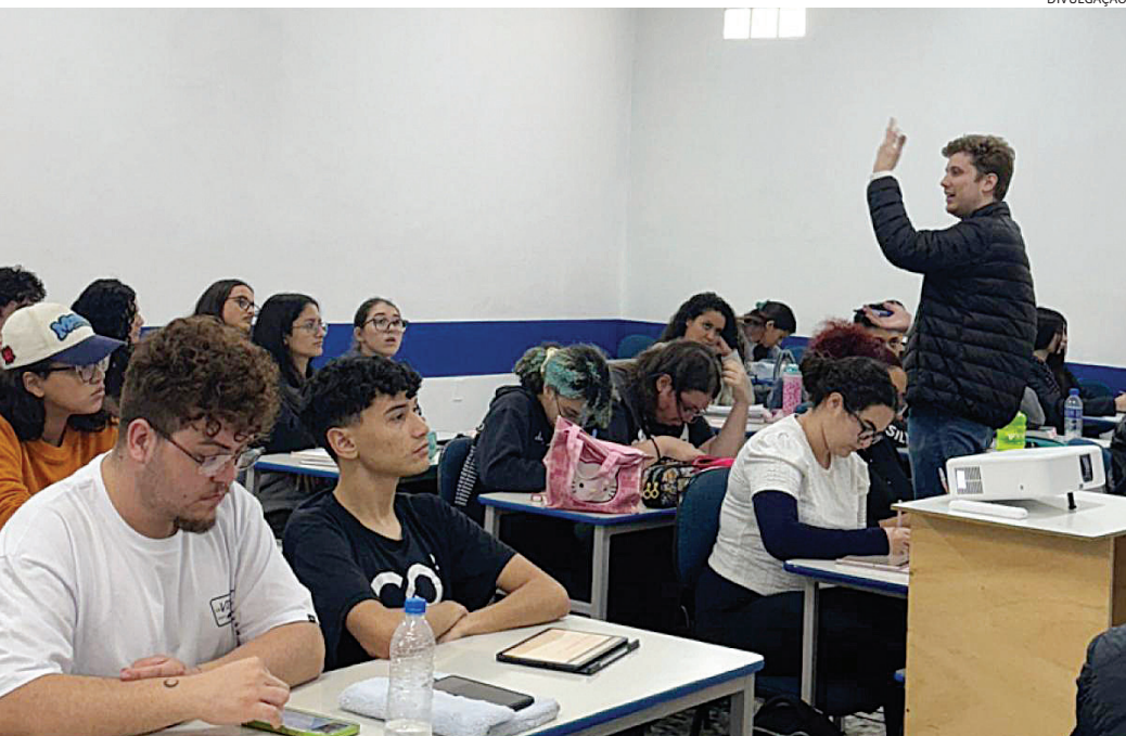
O cursinho registrou 40 aprovações para importantes vestibulares