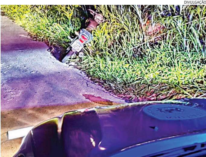
A motocicleta foi devolvida ao proprietário após o registro da ocorrência