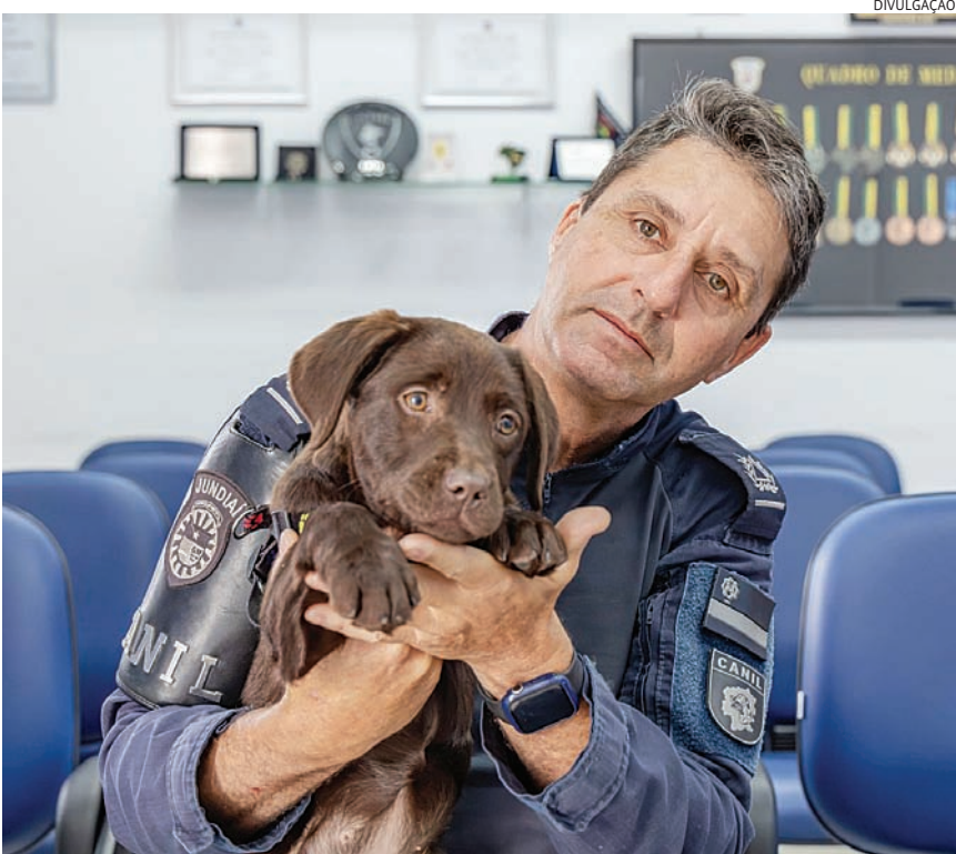
O canil da GM será um dos destaques da programação de aniversário

Nos dias seguintes, outras entregas importantes serão realizadas, entre elas, a Casa Família – Emergências e Calamidades Climáticas, o Jardim Sensorial no Parque do Cerrado (Vetor Oeste), a Vila de Oportunidades no Espaço Expressa e a UBS Rio Branco. Já no dia 14, data do aniversário, o dia será de eventos no Parque da Cidade, com a presença do Canil da Guarda Municipal, atividades esportivas e atrações culturais, além da entrega de novas viaturas à