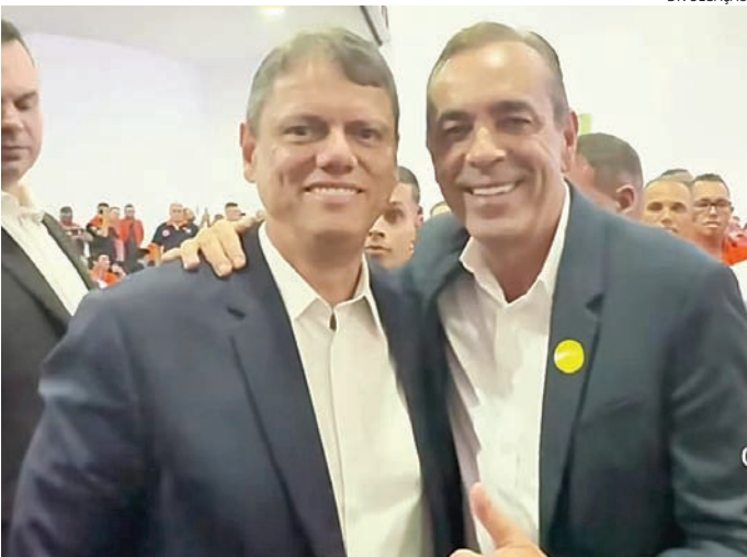
Rodolfo e Tarcísio em evento no Palácio dos Bandeirantes, em São Paulo

O presidente Luiz Inácio Lula da Silva pediu nesta quinta-feira (4) que o Conselho de Desenvolvimento Econômico e Social Sustentável (Conselhão) discuta medidas para viabilizar a redução da jornada de trabalho no país. Ele defende o fim do modelo 6 por 1. Lula afirmou que os avanços tecnológicos aumentaram a produtividade, mas não melhoraram a qualidade do trabalho. Questionou ainda por que a jornada não foi reduzida diante desse cenário e disse que a mudança de 44 para 40 horas semanais não traria prejuízo significativo. Segundo ele, vários países já adotaram modelos mais curtos.