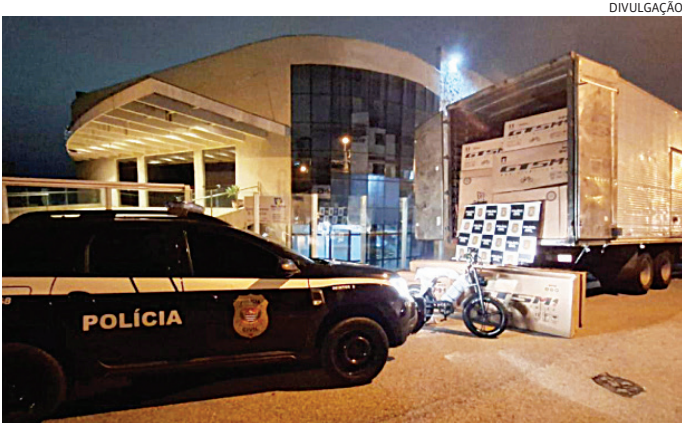
As bicicletas haviam sido roubadas em Itu quatro horas antes

Uma carga com 60 bicicletas elétricas e convencionais, avaliada em R$ 200 mil, roubada por criminosos durante um assalto em Itu por volta das 22 horas desta quarta-feira (3), foi recuperada por policiais da Delegacia de Investigações Gerais (DIG) de Jundiaí em um galpão em Itupeva, na madrugada desta quinta-feira (4). Três pessoas foram presas. No início da madrugada, a delegacia especializada recebeu informações de que dois caminhões, carregados com as bicicletas roubadas, estariam em um local em Itupeva. Equipes foram enviadas à área e, por volta das 2h30, conseguiram localizar os veículos e três pessoas dentro deles.