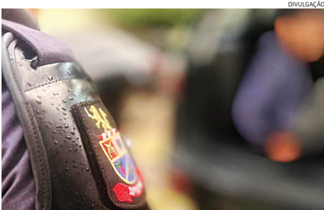
O suspeito tentou fugir, mas foi alcançado e preso

reram em direção a uma área de mata, mas um deles foi alcançado e detido. Em uma sacola dispensada pelo suspeito momentos antes, os policiais localizaram diversas porções de drogas. O homem foi conduzido à delegacia, onde foi preso em flagrante. Seu comparecimento será investigado pela Polícia Civil. As drogas apreendidas foram encaminhadas à autoridade policial.