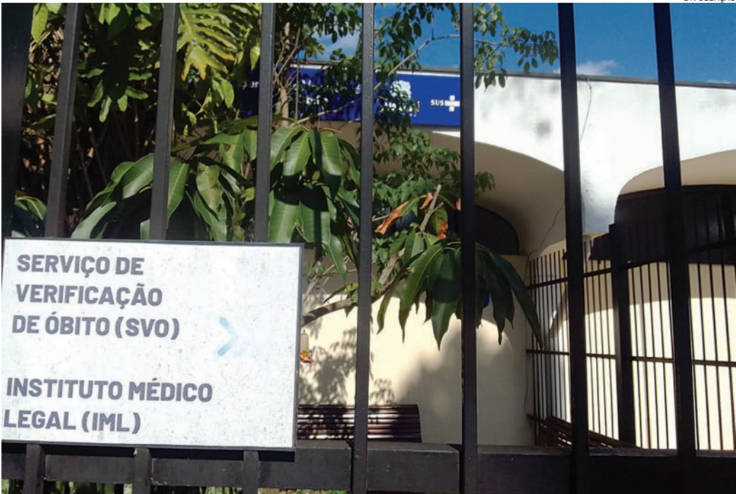
Os corpos foram levados para o IML para exames necroscópicos

Jundiaí registrou, na tarde desta quarta-feira (3), a quarta vítima fatal em acidentes de moto na cidade em apenas cinco dias. O caso mais recente envolveu um motociclista que, após um acidente ocorrido no dia 1º, na rodovia Anhanguera, entre Franco da Rocha e Jundiaí, faleceu nesta quarta-feira no Hospital São Vicente de Paula, onde estava internado. O acidente foi registrado como queda acidental e morte suspeita, e está sendo investigado pela Polícia Civil. O óbito foi registrado pelo tio da vítima no Plantão Policial, após comunicação do hospital, dois dias depois do ocorrido. O corpo foi encaminhado ao Instituto Médico Legal (IML) para exames necroscópicos e posterior liberação para sepultamento.