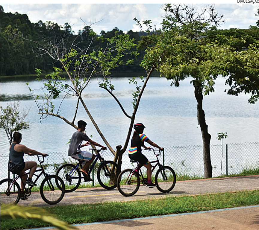
No dia 14 terá caminhada no Parque da Cidade e várias atividades

PROGRAMAÇÃO Dia 5: 10h - Inauguração do Espaço Jundiaí Feito à Mão na avenida Manoela Lacerda de Vergueiro, 655 - Anhangabaú