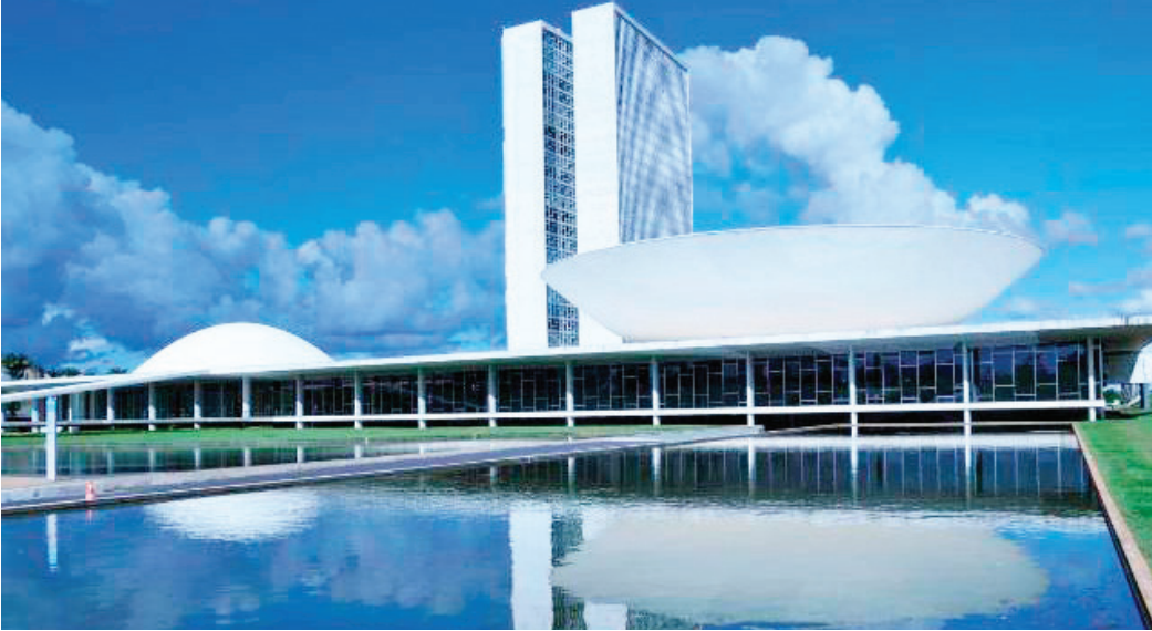
Em crise com o Legislativo, governo começa a criticar as emendas impositivas do Congresso

Em reação, Alcolumbre marcou para 10 de dezembro a sabatina de Messias no Senado, dando pouco tempo