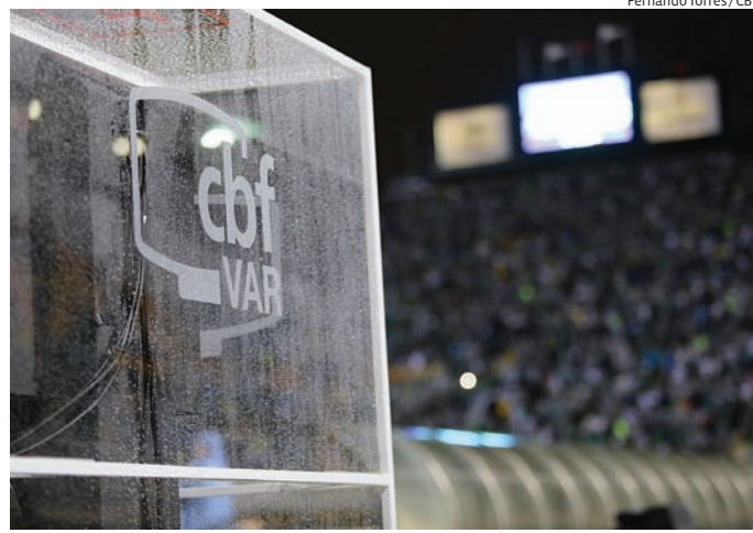
Há ainda um incômodo com a atuação de alguns árbitros experientes