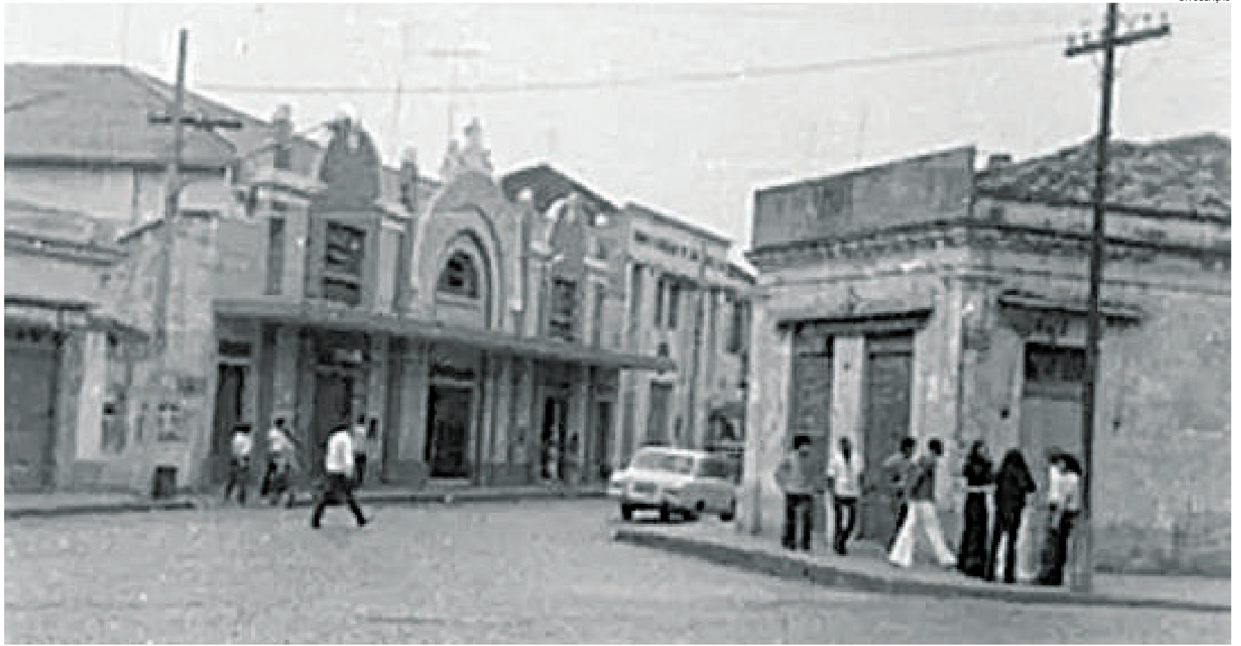
Com 98 anos, o Cine República foi inaugurado em 1926 e manteve funcionamento até a década de 1970, quando o local passou a abrigar outros negócios

Por não haver a proteção do tombamento, o local sofre com investidas comerciais. Em reunião do dia 5 de julho deste ano, o Compac discutiu o pedido de demolição feito pelo proprietário do prédio onde outrora funcionou o Cine