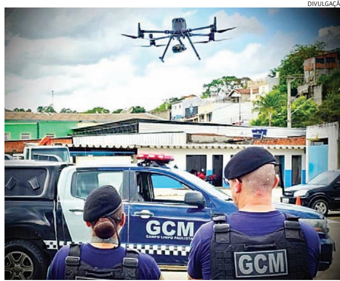
Foi possível ver onde os criminosos deixaram as drogas