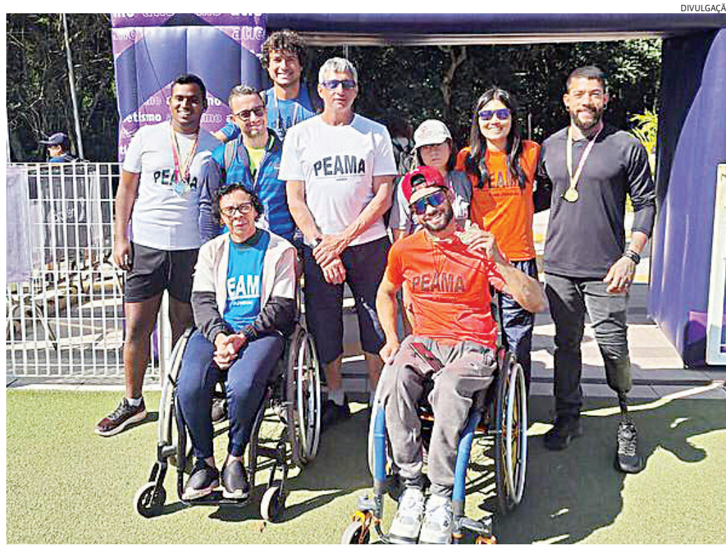
Jundiaí estará representada por 25 atletas do Peama na natação e atletismo

Os 25 paratletas que estão representando Jundiaí na competição são: