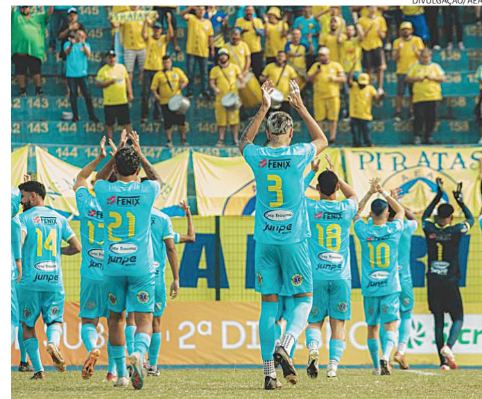
Fora das quatro linhas, a esperança da AEA em subir de divisão continua

Das 17 equipes que disputaram a 5ª Divisão nesta temporada, apenas o Paulista e o Colorado, finalistas da competição, conquistaram o acesso para o Paulista A4. Se houver desistência do Penapolense em disputar o torneio na próxima temporada, uma terceira vaga é cogitada e a AEA, que parou na semifinal, aparece como favorita.