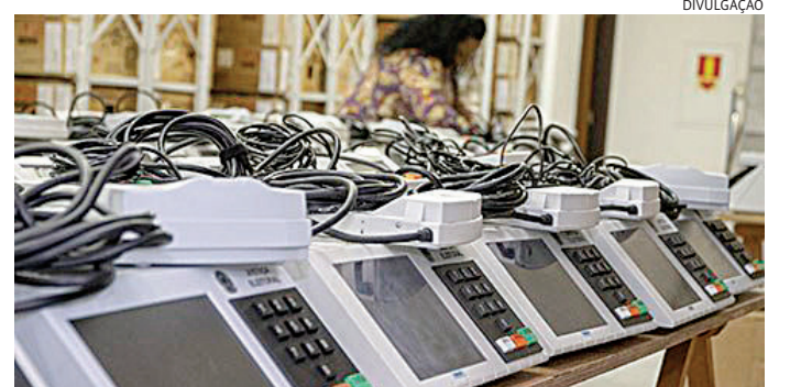
Inserção de dados deve ser feita até 4/10, antevéspera das eleições

Qualquer cidadão deverá apresentar documento oficial com foto se quiser acompanhar a cerimônia em qualquer cartório eleitoral. Dúvidas devem ser dirigidas ao Juízo Eleitoral.