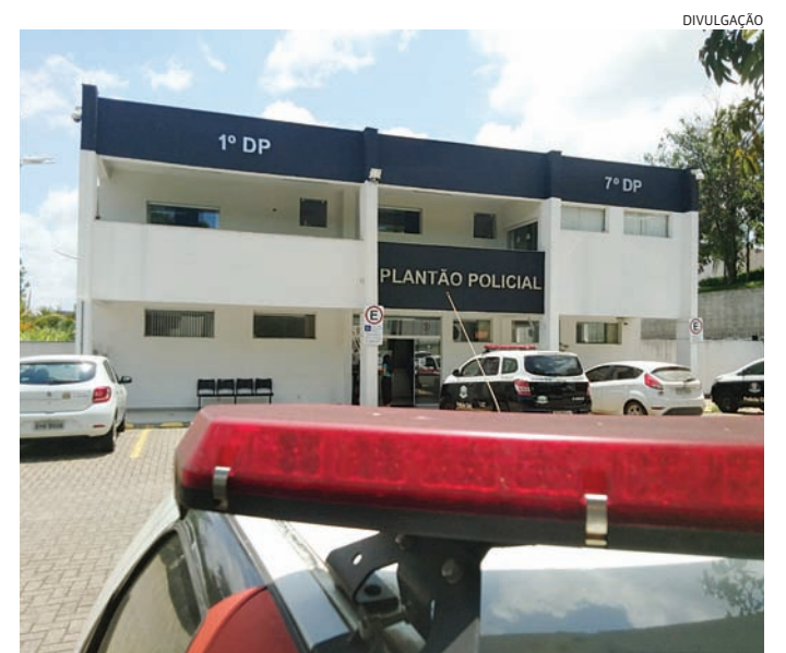
Os PMS contaram com a ajuda da mãe do criminoso para pegá-lo

Em revista pessoal, nada de ilícito foi encontrado. Porém, em consulta aos seus dados, os policiais confirmaram o mandato de prisão, conduzindo-o ao Plantão Policial, onde o delegado Anselmo Carvalho Santalena deu cumprimento do mandato e o recolheu à carceragem, ficando o golpista à disposição da Justiça.