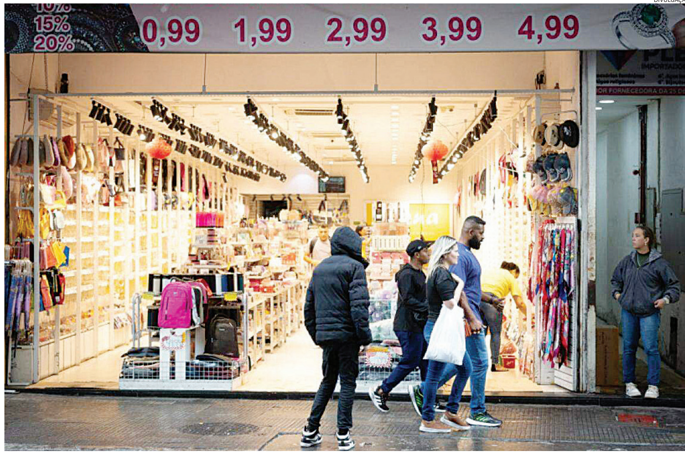
Empresas que não realizaram suas obrigações tributárias passam primeiro pelo processo de suspensão da inscrição estadual

Nos termos do 9º da Portaria CAT 95/06, os contribuintes terão o prazo de 15 dias, contados da data da publicação no DOE, para regularizar sua situação cadastral e apresentar reclamação ao chefe do Posto Fiscal de sua vinculação visando o restabelecimento da eficácia da inscrição. Da decisão