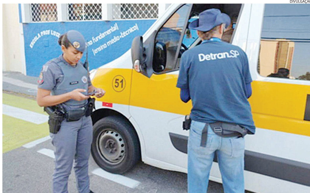
Ao todo, 40 veículos escolares foram abordados, dos quais 11 tiveram o motorista autuado