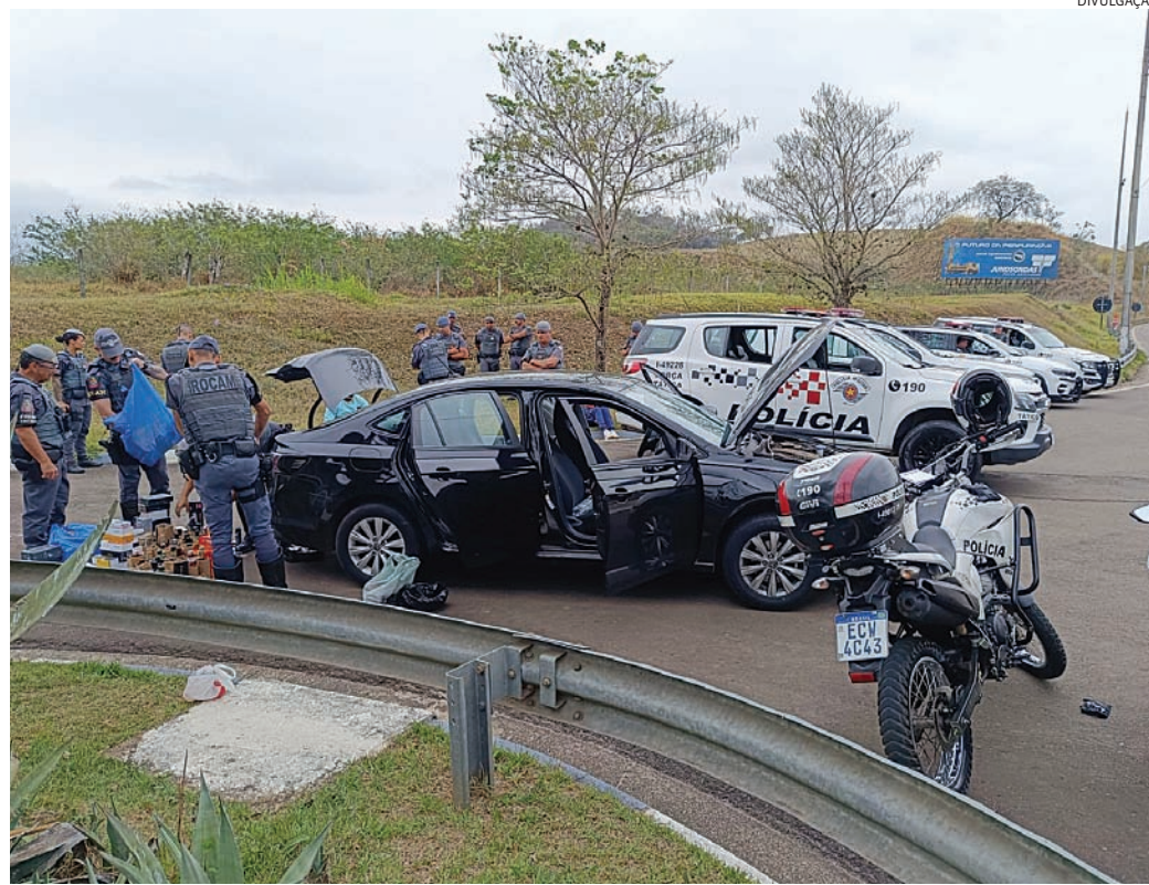
Os muambeiros foram presos na rodovia Dom Gabriel Paulino Couto

As equipes de Força Tática receberam denúncia anônima de que um veículo estava se aproximando de Jundiaí, depois de seus três ocupantes terem estado no Paraguai, onde compraram mercadorias para revender em Jundiaí e região, tanto fisicamente quanto pela internet. Com autorização do Comando de Força Patrulha (CFP), as equipes se posicionaram no km 76