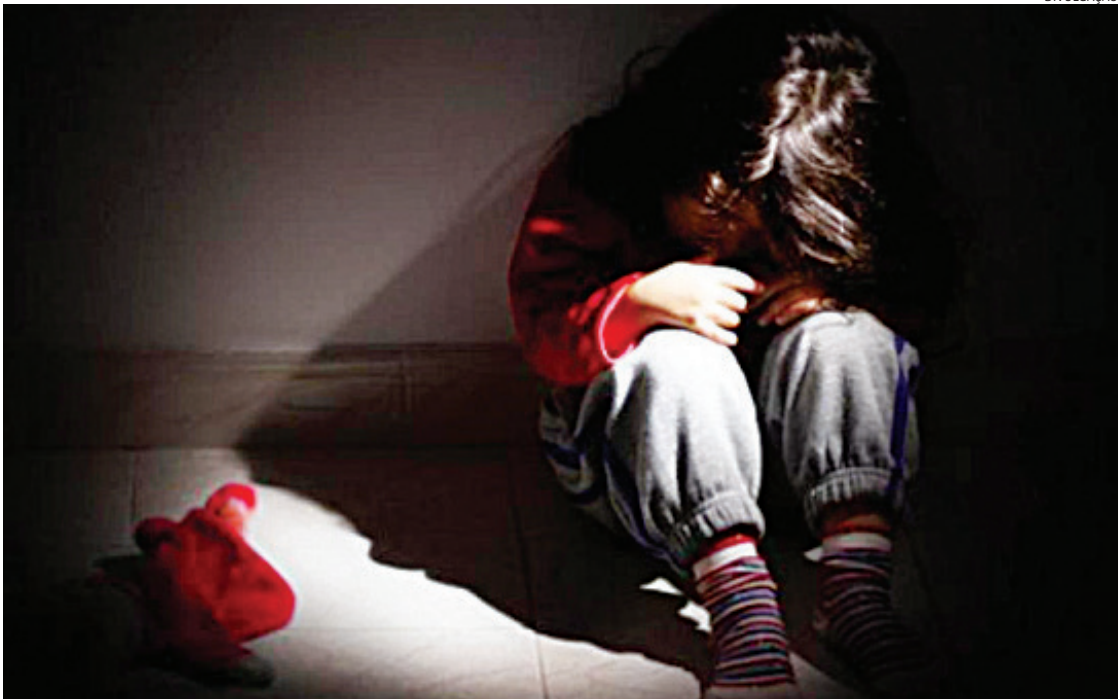
A criança e a mãe estão recebendo auxílio de uma rede de apoio

Um suspeito de estuprar uma criança de 8 anos foi capturado por policiais da Delegacia de Defesa da Mulher (DDM), em Itatiba, nesta sexta-feira (7). De acordo com a polícia, ele tinha planos de fugir para outro estado. Em Julho deste ano a mãe da criança denunciou o homem à polícia por violentar sua filha. O caso começou a ser investigado e, depois de cinco meses de oitivas - inclusive escutas especializadas com a vítima -, foram reunidas provas da autoria do suspeito. Foi então solicitado à Justiça um mandado de prisão, que os policiais cumpriram nesta sexta-feira. Ainda de acordo com a DDM, ele estava se preparando para fugir de Itatiba e seu objetivo era se esconder em outro estado. O suspeito foi conduzido à delegacia e posteriormente para o Centro de Triagem de Campo Limpo Paulista, onde ficou para aguardar a audiência de custódia. A criança e a mãe estão recebendo auxílio de uma rede de apoio.