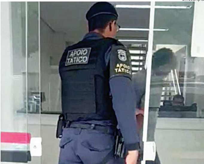
O bandido foi preso pelo Apoio Tático e conduzido ao DP