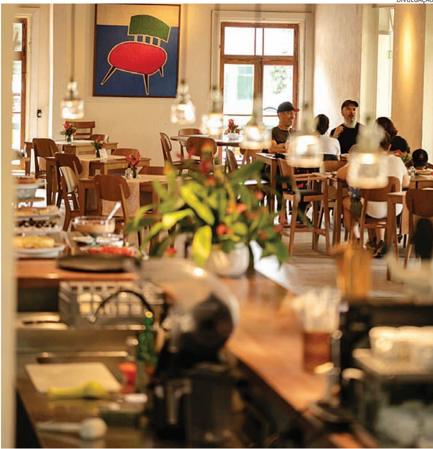
Espaço oferece opções de comida e lazer para todas as idades

Neste ano, o Governo do Estado de São Paulo, por meio da Secretaria de Turismo e Viagens (Setur-SP), repassou R$ 306,9 mil a Jundiaí, que integra o programa de Municípios de Interesse Turístico (MIT), para obras de infraestrutura voltadas ao setor.