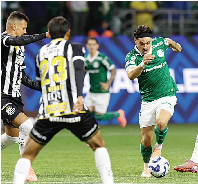
Líder isolado, o Palmeiras tenta manter a distância do Flamengo

Líder isolado, o Palmeiras tenta manter a distância para o vice-líder Flamengo. O Verdão tem 68 pontos e vem de vitória no clássico contra o Santos, por 2 a 0, no Allianz Parque, na última quinta-feira (6). O Rubro-Negro, por sua vez, tem