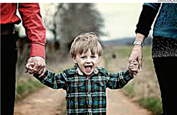
71% dos núcleos familiares de Jundiaí não têm nenhum filho de até 10 anos

Essas também são as faixas etárias com mais pessoas na cidade, respectivamente. E isso mostra a inversão da pirâmide etária na cidade, com a redução de crianças e o