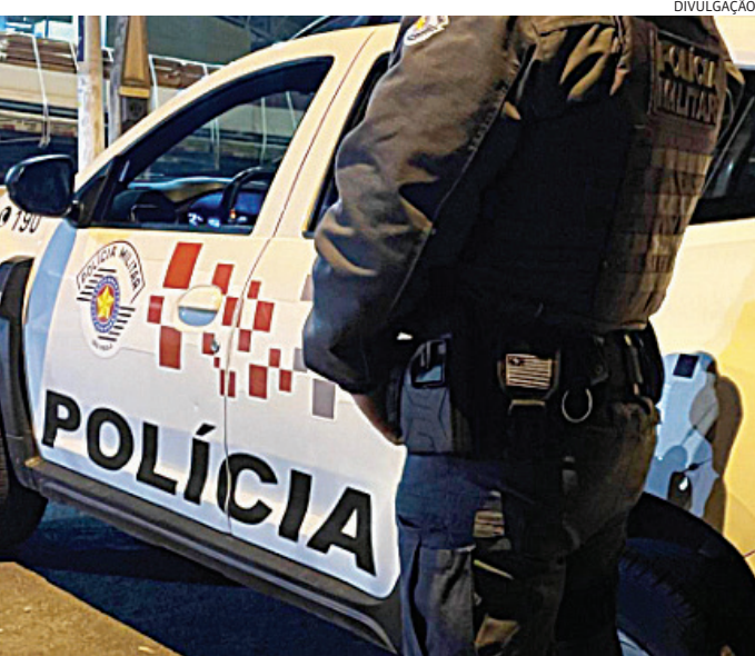
Os PMs prenderam o pai caloteiro e o levaram para o DP

Ao perceber que seria abordado, ele correu para uma área de mata para fugir, mas foi perseguido e detido. Em consulta aos seus dados pessoais, foi constatado que se tratava de traficante procurado pela Justiça. O criminoso foi conduzido ao Plantão Policial, onde foi dado cumprimento ao mandado de prisão.