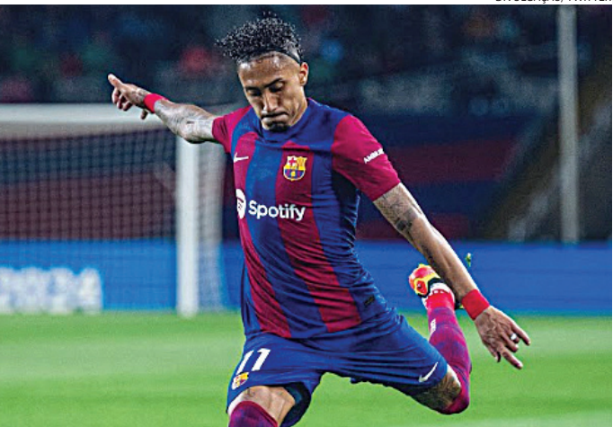
Raphinha é o único brasileiro na lista do troféu principal

Harry Kane (Bayern de Munique), Mbappé (Real Madrid), Cole Palmer (Chelsea) e Mohamed Salah (Liverpool) completam a lista.