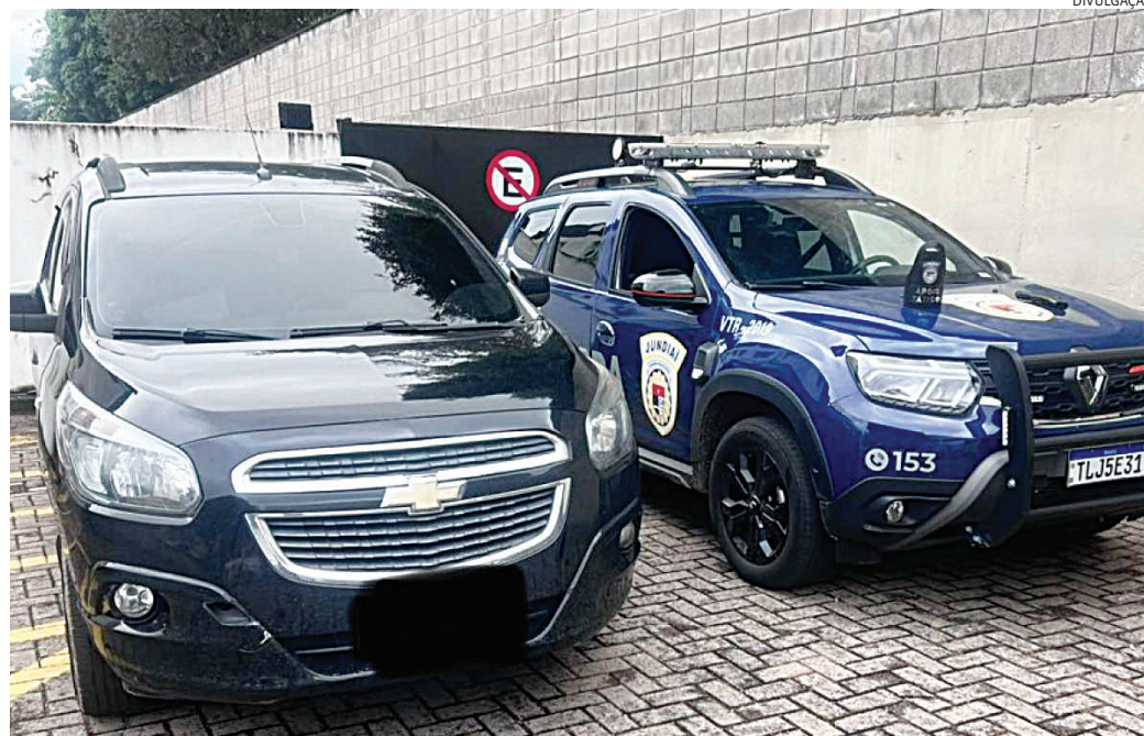
Registros de radares auxiliaram na identificação do veículo

veículo e a placa em mãos, equipes da corporação realizaram patrulhamento e localizaram o Chevrolet Spin nas proximidades das avenidas Osvaldo Cruz e Ozanan, além da rua Doutor Eloy Chaves,