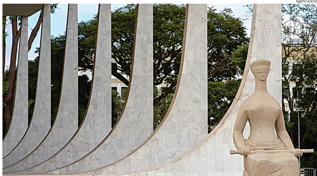
A tese final deverá ser consolidada em sessão prevista para a próxima quarta-feira (17)

A Corte definiu ainda que as novas regras passam a valer a partir de 27 de junho de 2025, data da publicação da ata do julgamento. A tese final deverá ser consolidada em sessão prevista para a próxima quarta-feira (17), servindo de referência para processos em tramita-