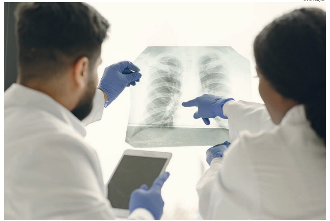
Em Jundiaí, só este ano foram 37 casos diagnosticados

O médico diz que “as medidas de prevenção são semelhantes às recomendadas para gripes e resfriados, ou seja, evitar ambientes fechados e com pouca ventilação, cobrir a boca e o nariz com a parte interna do cotovelo ao tossir ou espirrar, higienizar