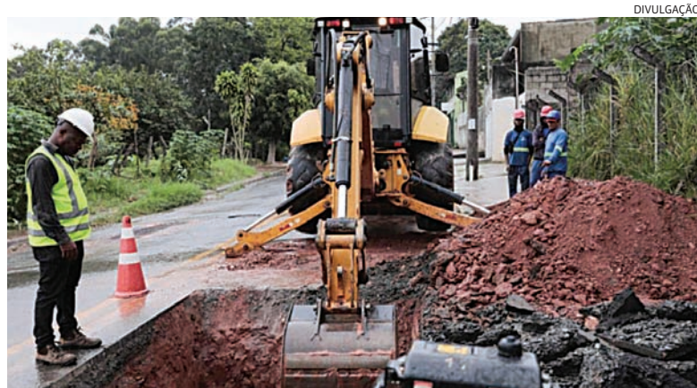
A estrutura beneficiará cerca de 6,5 mil famílias e tem conclusão prevista para 2027

A DAE Jundiaí segue avançando com a obra da Adutora do Castanho, projeto que vai reforçar o abastecimento de água na região entre o Jardim do Lago e o Santa Gertrudes. Com investimento de R$ 18,2 milhões e 6,9 quilômetros de extensão, a estrutura beneficiará cerca de 6,5 mil famílias e tem conclusão prevista para fevereiro de 2027. A intervenção contempla a implantação de uma nova adutora em ferro fundido com trechos de 500 e 300 milímetros de diâmetro. Cidades 5