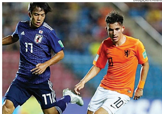
Seleções entram em campo pela primeira rodada da Copa do Mundo

Do outro lado, o Japão chega embalado pelo crescimento apresentado nas últimas edições da Copa do Mundo. A seleção asiática busca confirmar sua evolução internacional e repetir as boas campanhas que a