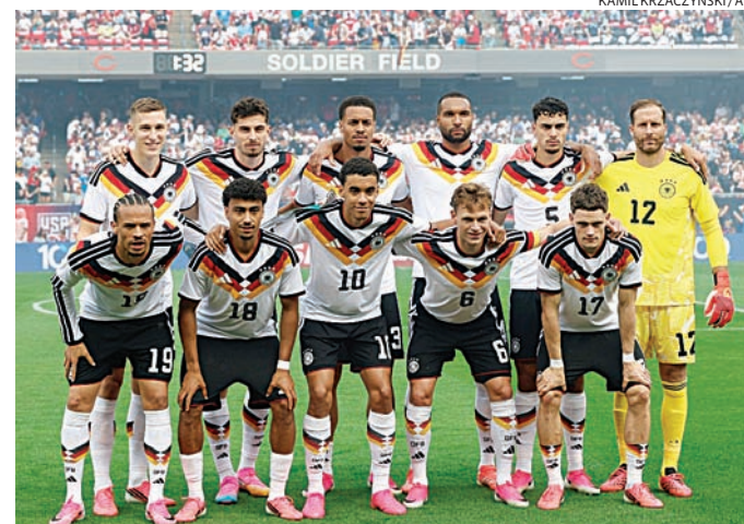
Favorita na partida, seleção alemã inicia caminhada na Copa do Mundo

Pela primeira vez em uma Copa do Mundo, Curaçao vive um momento histórico. A classificação representou um marco para o país caribenho, que busca aproveitar a vitrine do torneio para mostrar sua evolução para o cenário futebolístico.