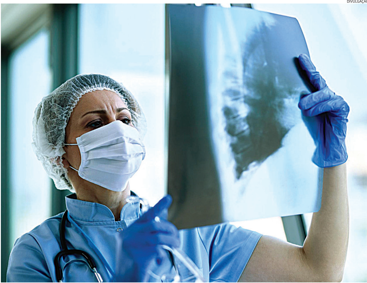
Com a proximidade do inverno os índices tendem a aumentar

Tosse persistente e febre são sintomas que podem passar despercebidos, pois são, de certa forma, genéricos quando o assunto é doença no sistema respiratório. Esses sintomas, porém, podem esconder uma doença perigosa: a tuberculose. Só este ano a Região Metropolitana de Jundiaí (RMJ) registrou 88 casos entre janeiro e maio. Foram 37 em Jundiaí, 19 em Várzea Paulista, 14 em Campo Limpo Paulista, seis em Cabreúva, seis também em Jarinu, quatro em Itupeva e dois em Louveira.