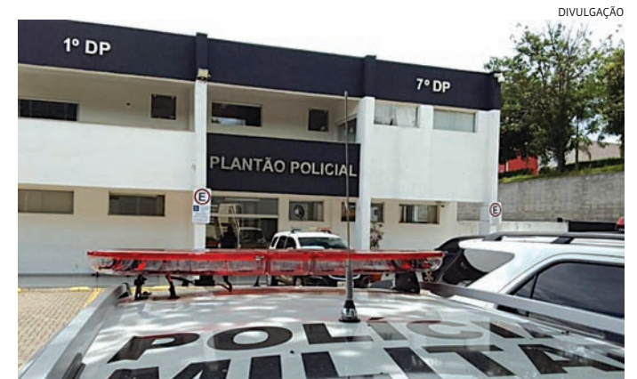
Ele foi conduzido à delegacia, onde a ordem judicial foi cumprida

Durante a qualificação dos envolvidos e consulta aos sistemas policiais, os mi-