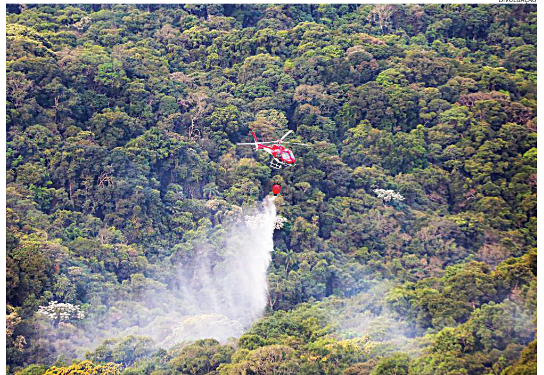
São pelo menos 600 municípios que aderiram ao Plano de Contingência para Estiagem

Entre as principais inovações da Operação SP Sem Fogo 2026 está o novo Painel de Inteligência SP Sem Fogo, pla-