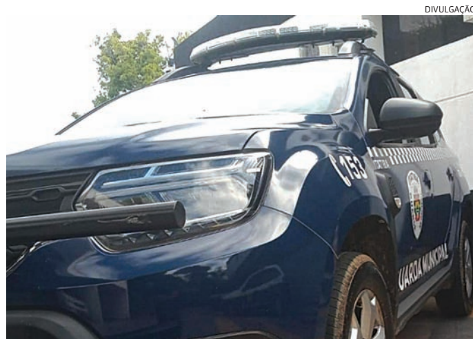
Os guardas constataram que havia dois mandados de prisão

Durante a consulta, os guardas constataram que havia dois mandados de prisão em aberto contra ele, sendo um pelo crime de furto e outro por recep-