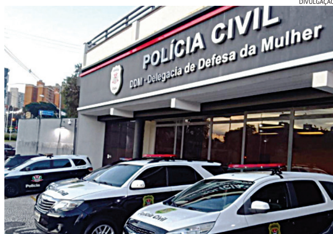
O ex-marido foi preso pela quebra de medida protetiva

Diante dos fatos, a delegada Camila Duarte Pina determinou diligências imediatas para localizar o suspeito. Os policiais realizaram buscas e o encontraram em um bar,