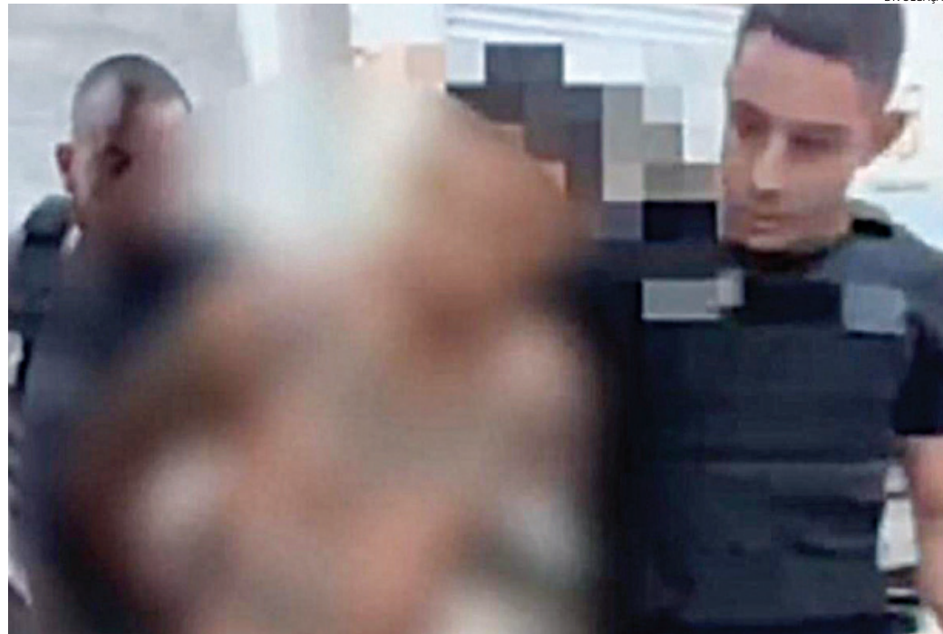
O suspeito foi preso em flagrante pelos policiais civis

A adolescente procurou a delegacia acompanhada da mãe para denunciar as agressões. Segundo relato, ela foi até a casa do namorado no sábado (11), onde permaneceu até esta segunda-feira, período em que sofreu violência física após uma discussão inicial. De acordo com o depoimento, o agressor utilizou inclusive um cabo de vassoura para atacá-la. A vítima sofreu ferimentos no braço e na cabeça.