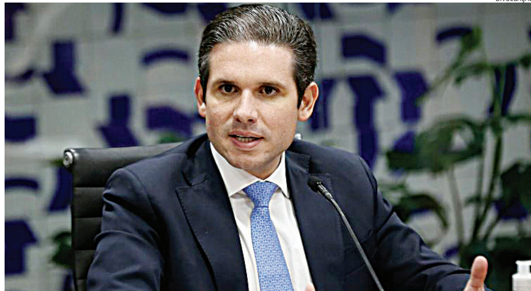
Motta queria o protagonismo sobre o projeto do fim da escala 6x1

Na última semana, Motta disse que foi informado pelo então líder do governo, José Guimarães, que o gover-