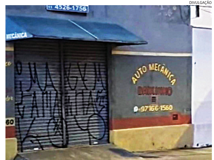
'Não posso e não vou mexer com isso agora', disse o comerciante, revoltado

Assim que as imagens forem reunidas, o material será entregue à polícia para investigação do caso.