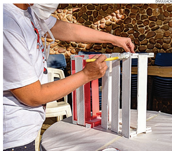
Maioria de jovens atendidos pelo CAPS está entre 14 e 18 anos

A especialista destaca que os jovens estão entre os mais afetados. Segundo ela, alguns fatores são preponderantes para isso, como o processo incompleto da maturação cerebral, es-