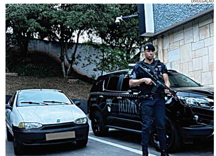
O veículo foi recuperado e devolvido à vítima