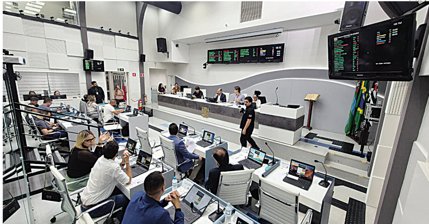
Pauta teve dois debates voltados à causa animal em alusão ao Abril Laranja

O PL altera a legislação vigente e estabelece diretrizes como castração, vacinação, identificação e fiscalização mais rigorosa. A medida também prevê o cadastramento dos animais e a indicação de responsáveis comunitários. A justificativa do PL dizia que ausência