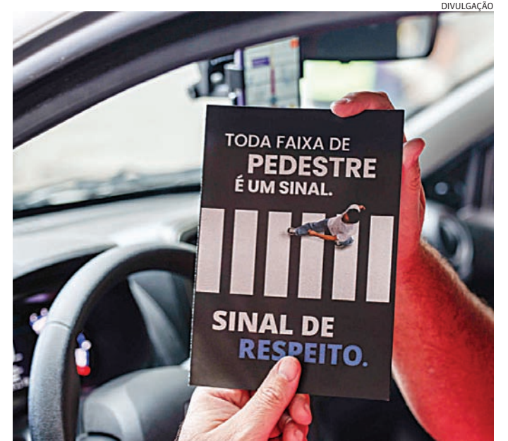
Os temas serão voltados para profissionais de segurança e RH