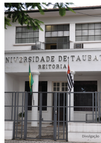
Extensão. Unitau possui diversos projetos

APOIO. Após crise de demissão durante pandemia, projeto Novos Rumos, da Universidade de Taubaté, oferece acolhimento psicológico e orientação para quem busca uma nova oportunidade de trabalho.