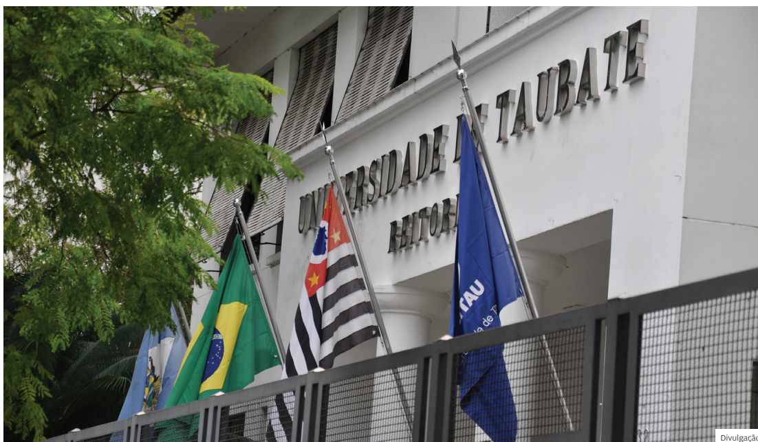
Extensão. Unitau oferece atendimento à população através de programas de extensão

Dentre as atividades de extensão exercidas pela Universidade, o maior foco está nas ações para promoção da saúde, como por exemplo, com o trabalho desenvolvido nas cinco clínicas de saúde, que junto ao EAJ (Escritório de