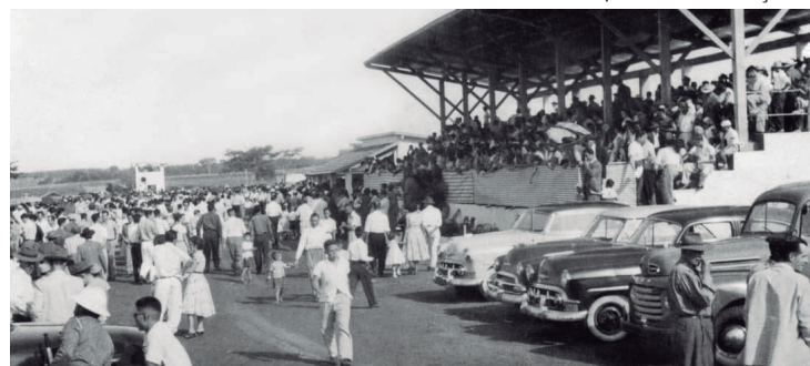
O antigo Jockey Club da Noroeste, popularmente conhecido como Hipódromo do Guatambu, que funcionou entre os anos de 1955 e 1956