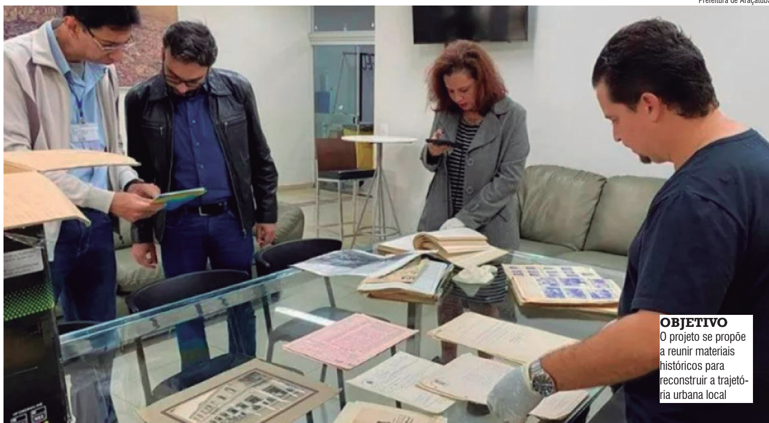
Prefeitura de Araçatuba

A solicitação foi direcionada à presidência da Câmara e busca informações sobre a existência de arquivos históricos digitalizados, além da possibilidade de consulta presencial e