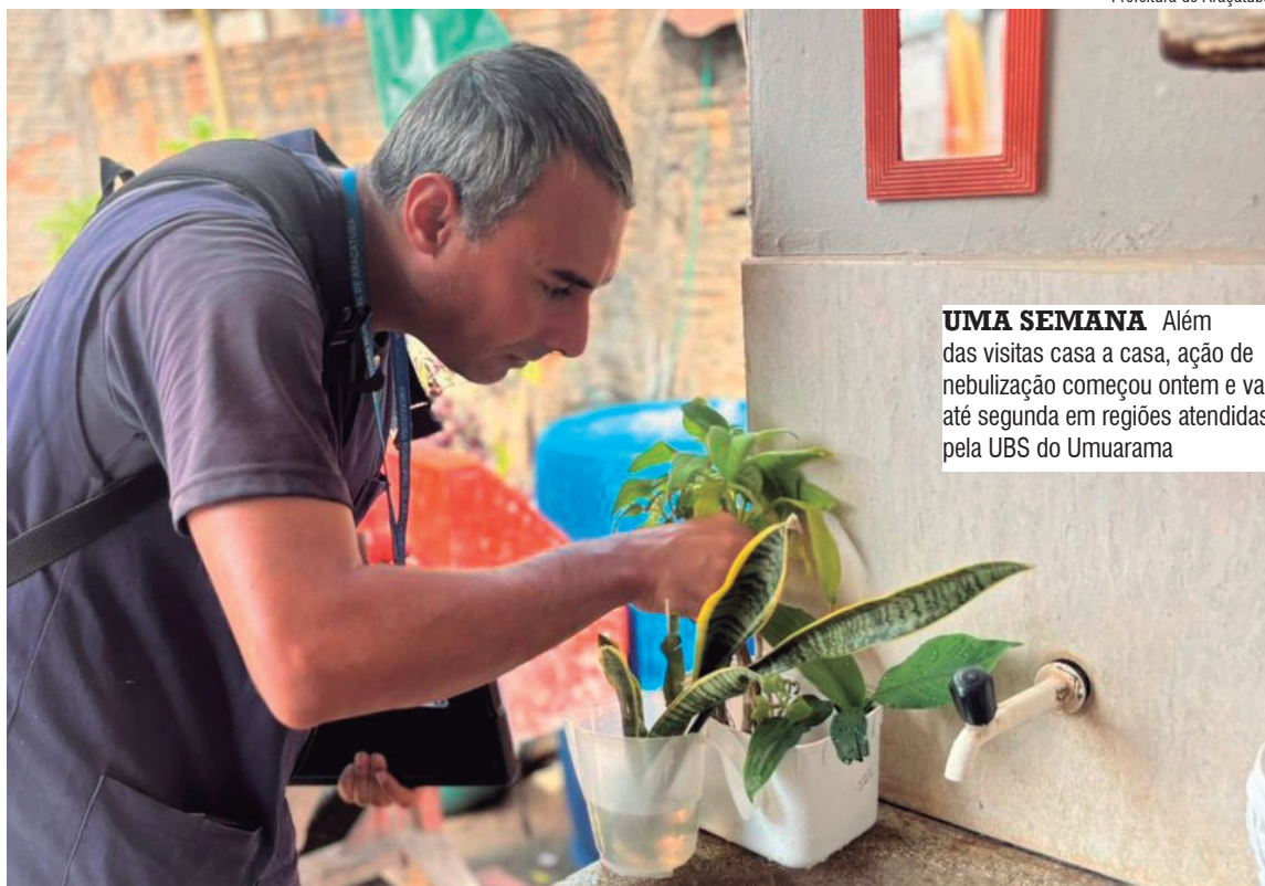
UMA SEMANA Além das visitas casa a casa, ação de nebulização começou ontem e vai até segunda em regiões atendidas pela UBS do Umarama

O levantamento foi realizado entre os dias 4 e 13 de maio. Ao todo, foram vistoriados 4.138 imóveis em 836 quarteirões. Os