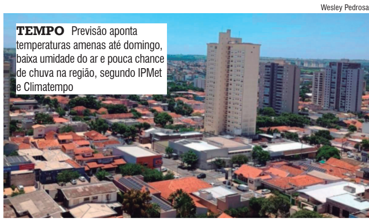
TEMPO Previsão aponta temperaturas amenas até domingo, baixa umidade do ar e pouca chance de chuva na região, segundo IPMet e Climatempo

Apesar da presença de instabilidades atmosféricas, os meteo-