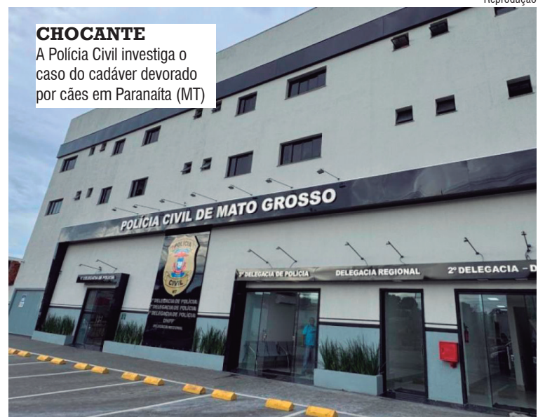
CHOCANTE A Polícia Civil investiga o caso do cadáver devorado por cães em Paranaíba (MT)

A área foi isolada para o trabalho da Perícia Oficial e Identificação Técnica (Politec). Depois da análise no local, o corpo foi encaminhado ao Instituto Médico Legal (IML) para exame de necropsia. A Polícia Civil investiga o caso. As informações são do site MidiaNews.