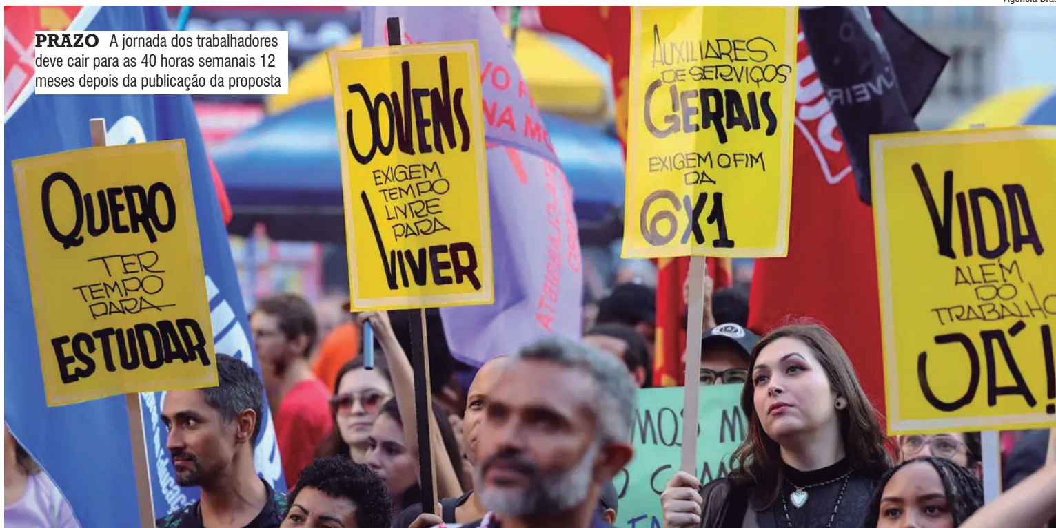
PRAZO A jornada dos trabalhadores deve cair para as 40 horas semanais 12 meses depois da publicação da proposta

A jornada dos trabalhadores deve cair para as 40 horas semanais 12 meses depois da publicação da proposta. A medida ainda precisa ser aprovada na Câmara e no Senado. A decisão foi anunciada pelo presidente da Câmara, deputado Hugo Motta (Republicanos-PB), acompanhado dos ministros do Trabalho, Luiz Marinho, e das Relações Institucionais, José Guimarães.