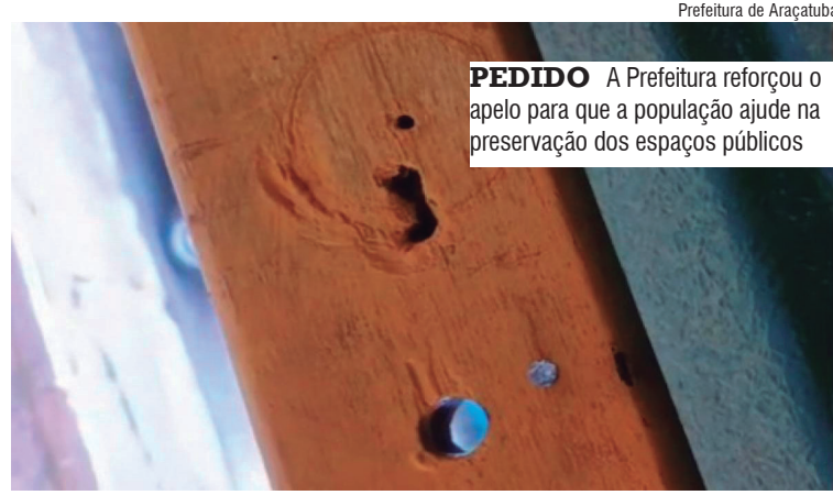
PEDIDO A Prefeitura reforçou o apelo para que a população ajude na preservação dos espaços públicos

Em outra gravação, servidores da Secretaria Municipal de Obras e Serviços Públicos (Sosp) aparecem realizando uma