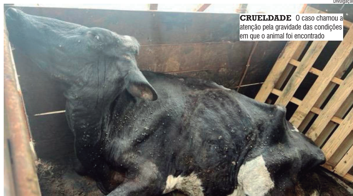
CRUELDADE O caso chamou a atenção pela gravidade das condições em que o animal foi encontrado

Além da atuação por maus-tratos, a Defesa Agropecuária também aplicou penalidades pela ausência da Guia de Trânsito Animal (GTA), documento obrigatório para o transporte de animais. Já a Polícia Militar Rodoviária lavrou autos de infração devido às más condições de conservação do veículo utilizado no transporte.