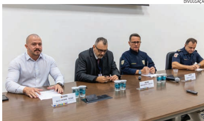
Reunião debateu ações integradas contra criminalidade na RMJ