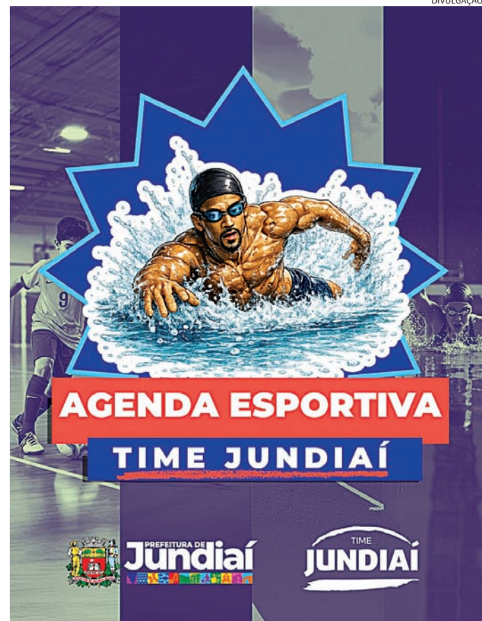
Agenda reúne disputas estaduais e regionais em várias modalidades

conterá com eventos institucionais em Jundiaí, como a Jornada da Inteligência Esportiva e as Olimpíadas do Comando Militar do Sudeste. Segundo a organização,