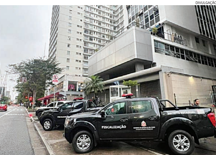
Operação conta com participação da Secretaria da Fazenda e Planejamento de SP

A apuração identificou três grupos empresariais distintos, que teriam se uti-