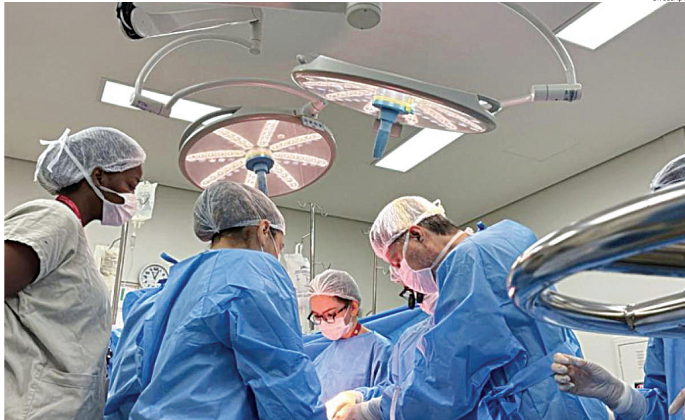
Os destaques de 2024 e 2025 foram para as doações de fígados e rins

São Paulo concentra a maior rede transplantadora do país e lidera a realização de transplantes no Brasil. No último ano, a