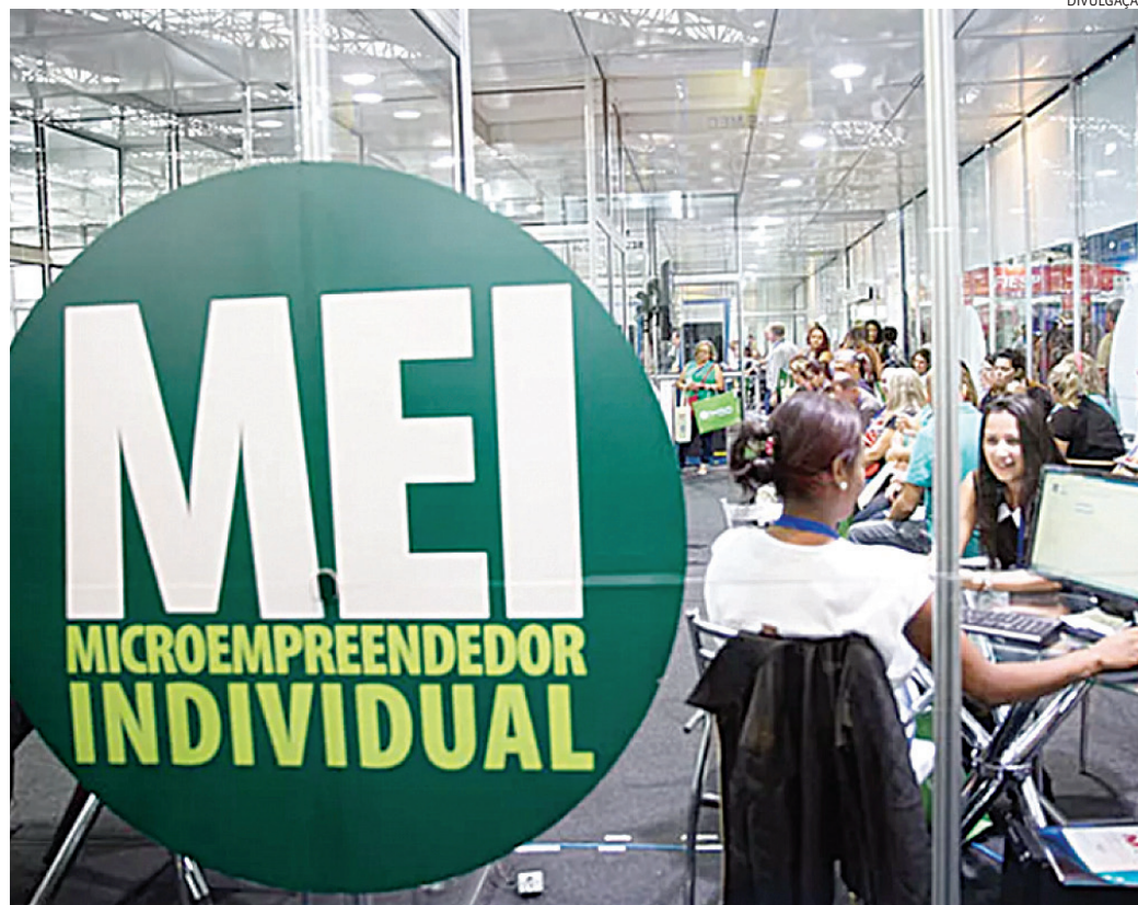
Ação contará com atendimentos, orientações e atividades gratuitas