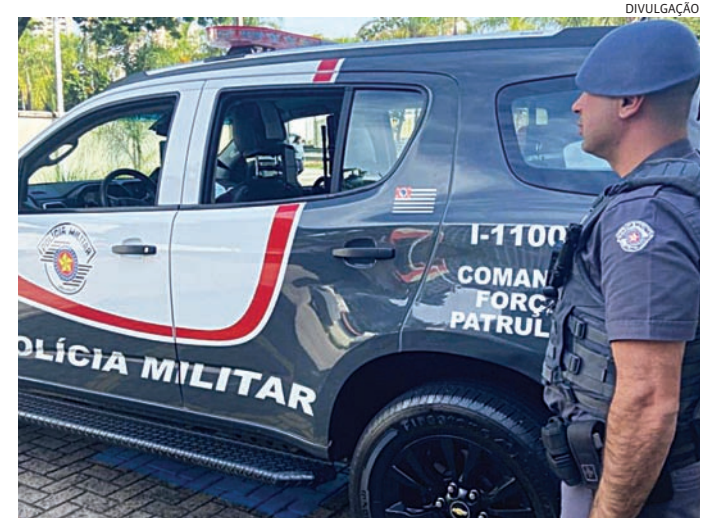
Ele permaneceu preso e à disposição da Justiça

Em consulta ao sistema policial, foi confirmada a existência do mandado de prisão em aberto.