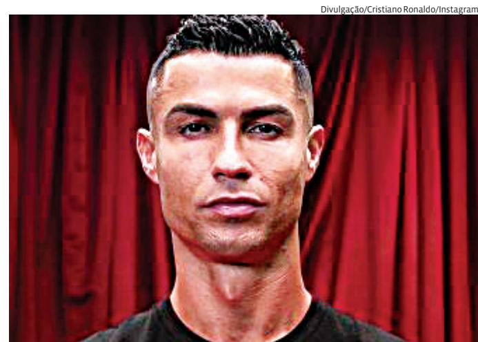
Empresa é responsável pela operação da CazéTV no Brasil