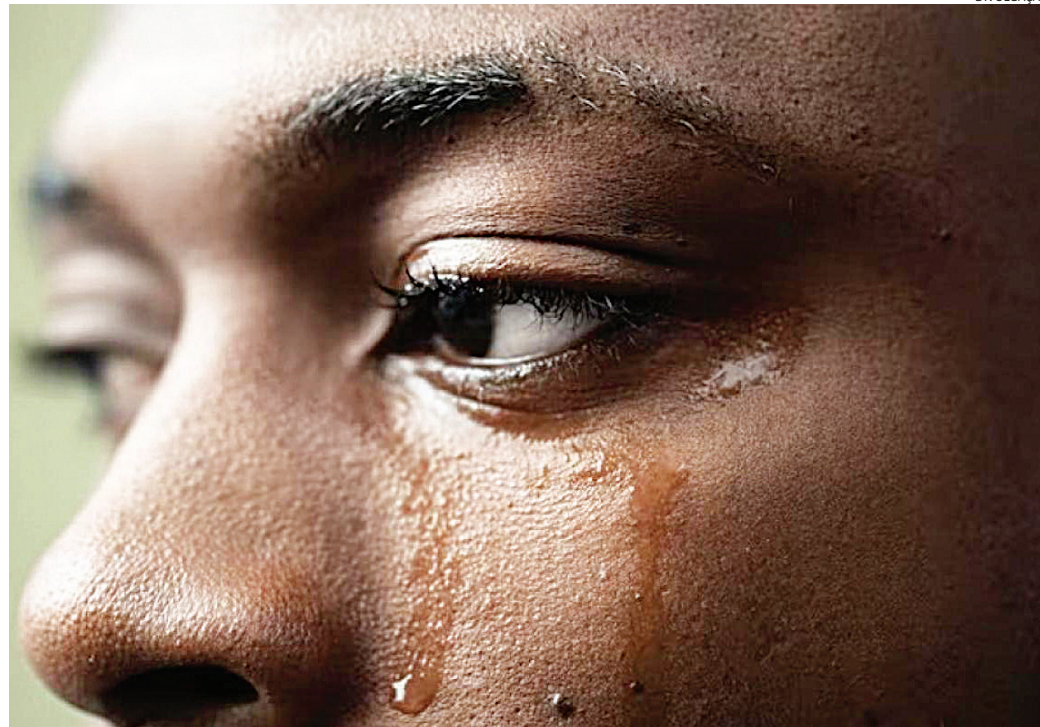
A vítima foi atacada com relação à sua cor e sua nacionalidade

Na decisão, o juiz reconheceu a gravidade do crime, mas entendeu que não havia elementos que justificassem a manutenção da prisão preventiva, destacando a ausência de violência física ou grave ameaça. “Embora inegavelmente reprovável e de acentuado peso social, o fato não apresenta gravidade concreta excepcional, pautada em violência de ordem física