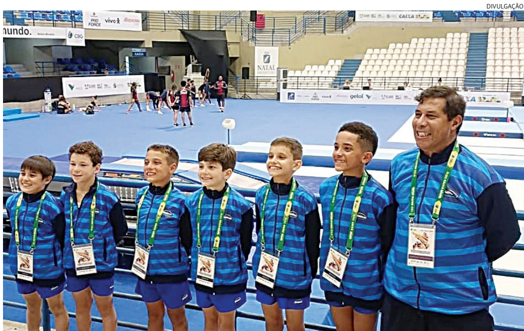
Equipe participa do Campeonato Brasileiro por Idades da categoria de Ginástica com Trampolim