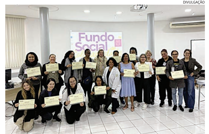
Serão oferecidos cursos de beleza, gastronomia e computação

As inscrições devem ser realizadas de forma on-line. Leia mais na versão on-line do JJ (jj.com.br)