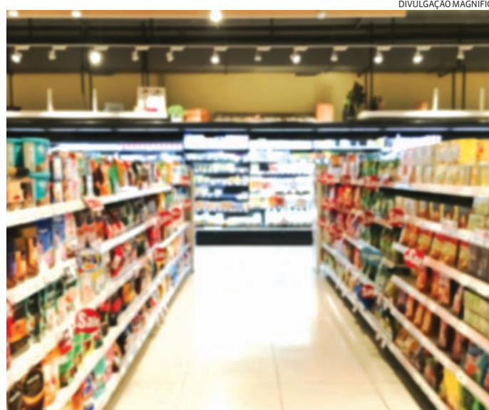
A diferença de preço na gôndola e nos caixas são os mais visíveis

No primeiro dia da operação, os agentes visitaram diversos estabelecimentos e também reforçaram orientações sobre práticas que contribuem para uma experiência de compra mais segura