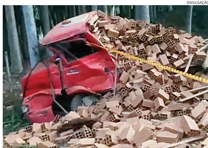
Os dois ocupantes do caminhão saíram ilesos

A Polícia Militar Rodoviária foi acionada para atendimento de sinistro de acidente com vítima fatal no km 96 da pista Sul da rodovia. No local, ficou apurado que um caminhão carregado com tijolos seguia no sentido sul da rodovia e, por motivos a serem esclarecidos, foi atingido frontalmente pela carreta que seguia no sentido contrário.