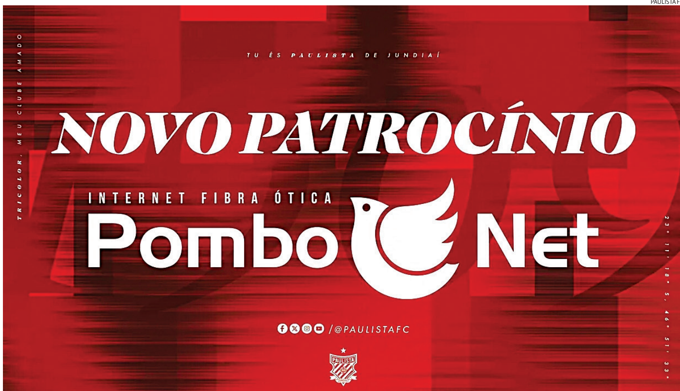
Segundo o Paulista, a parceria faz parte do processo de fortalecimento institucional e financeiro da equipe

A participação acionária do português não teve valores divulgados oficialmente. A LiveMode afirmou que a parceria deve fortalecer projetos ligados à produção de conteúdo esportivo e novas oportunidades comerciais no mercado internacional.