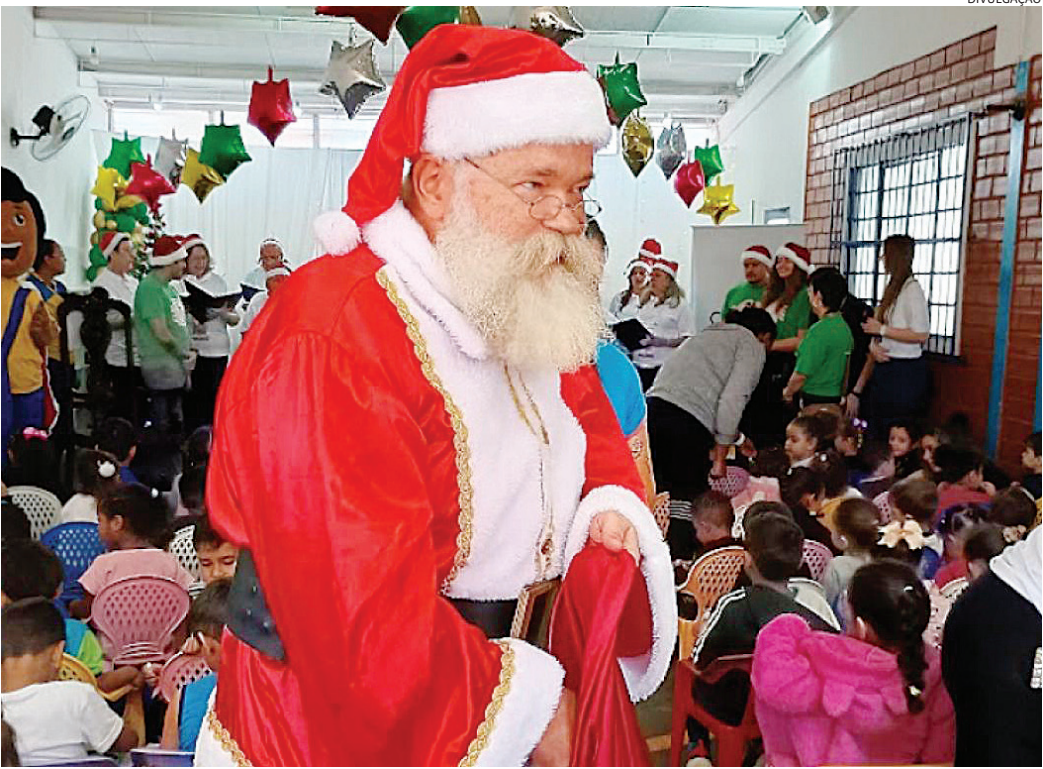
Em Jundiaí, o recebimento e adoção das cartinhas serão na agência da rua Petronilha Antunes

Para ajudar é simples. Os Correios recebem as cartinhas de crianças que enviam seus pedidos diretamente ao Papai Noel e, também, de estudantes das escolas da rede pública (até o 5º ano do ensino fundamental) e de instituições parceiras. Após serem li-