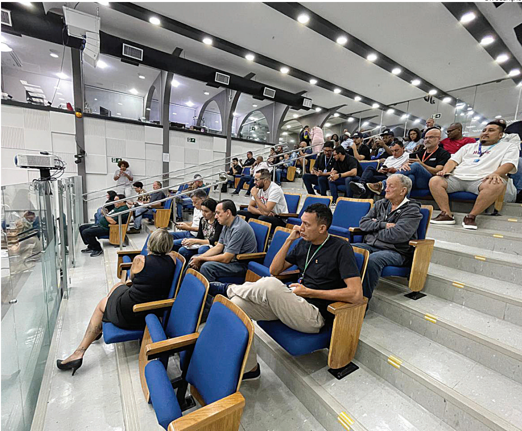
Câmara recebeu público abaixo da média para uma sessão que transcorreu de forma tranquila

O projeto visa reconhecer a importância histórica e cultural da data e valorizar o movimento negro local. “Quando temos o dia e a marcha, queremos reconhecer a história. É também um ato de valorizar a cultura afro-brasileira, sistematicamente apagada ao longo dos séculos. Precisamos ressaltar a importância da população negra na