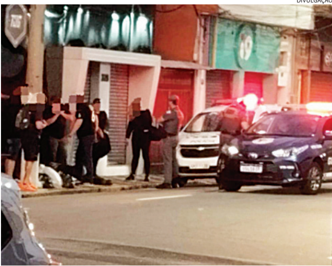
O agressor foi contido por populares até a chegada da polícia

Quando os agentes chegaram o agressor estava deitado na calçada.