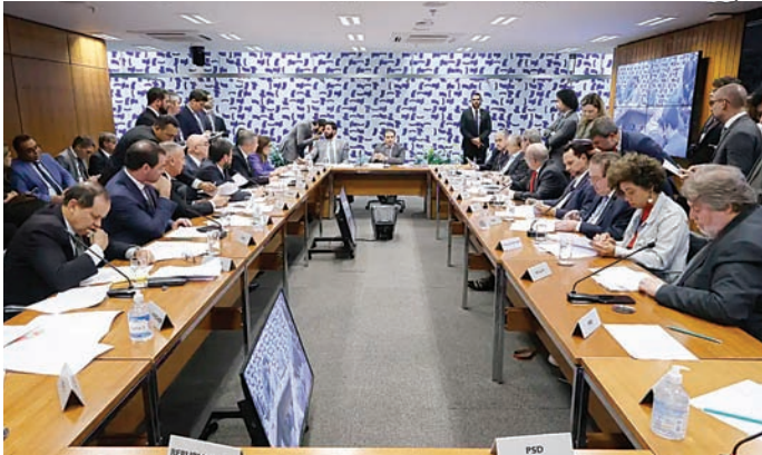
Defensores da PF pedem que sua atuação não seja modificada

Após as críticas, Derrite recuou e apresentou novo texto retirando a exigência de pedido do governador para investigações conjuntas entre as polícias. Porém, o relator,