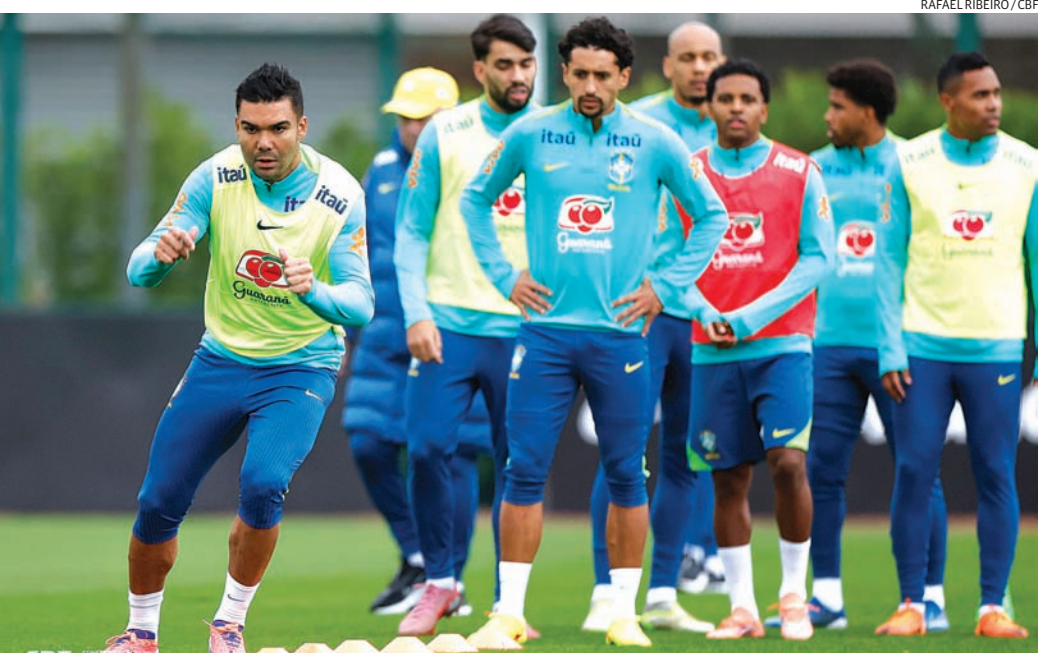
RAFAEL RIBEIRO / CBF

Local: Decathlon Stadium, em Lille (FRA).