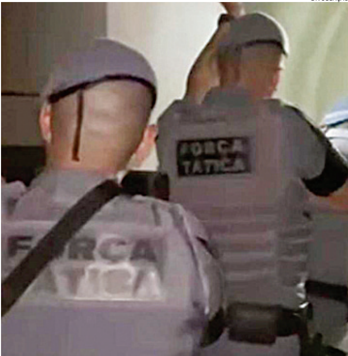
Momento em que os PMS entraram no apartamento ‘casa bomba’

onde toda a droga estava armazenada. O caso foi apresentado no Plantão Policial e será investigado pela Polícia Civil.