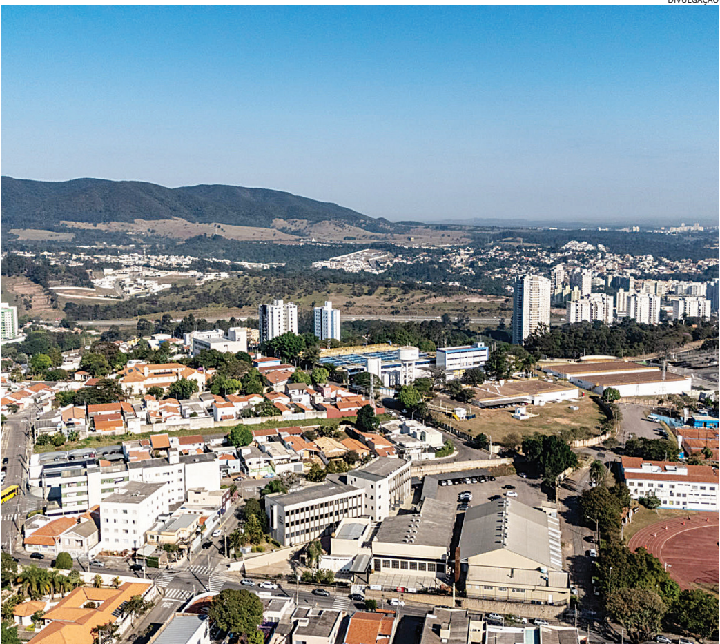
Mesmo com números abaixo em relação ao ano passado, cenário segue sendo favorável para os municípios

do houve 583 registros, o município mantém desempenho expressivo na geração de novos negócios. Somente neste ano, segundo a Secretaria de Finanças, 6.415 CNPJs foram instituídos no município. “Os números mostram a vitalidade do ambiente empreendedor de Jundiaí, que continua atraindo novos negócios e fortalecendo a economia local. Mesmo em um cenário de oscilação econômica nacional, o município mantém índices consistentes de abertura de empresas, resultado das políticas públicas voltadas ao fomento do empreendedorismo e da