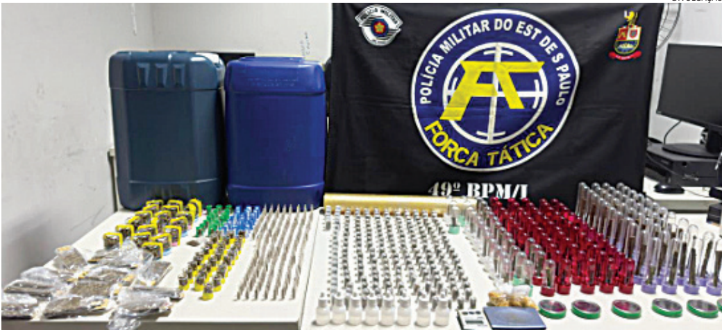
As drogas foram apresentadas no DP para investigação da Polícia Civil

Durante patrulhamento próximo a um condomínio de prédios populares, os PMs avistaram um grupo de traficantes em uma ‘biqueira’. Todos correram ao avistarem