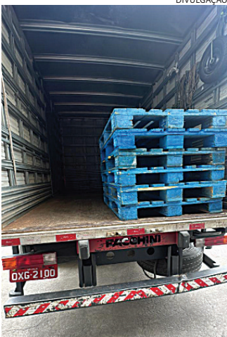
O caminhão é a fonte de renda e sustento da família

Segundo a filha do dono do caminhão (ele tem 67 anos), o veículo foi comprado com o dinheiro que ele recebeu ao sair da empresa onde trabalhou por mais de 30 anos. O caminhão é usado por ele e pelo filho e é a ferramenta de trabalho para o sustento da família. “Ele acabou de pagar o caminhão, não tem muito tempo, e aí