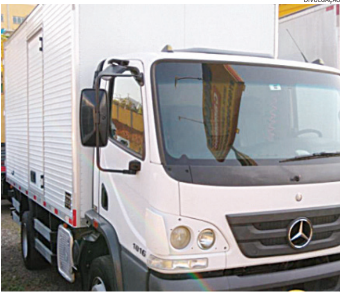
O veículo estava carregado com café quando foi roubado

Com medo de ser morto, ele se rendeu e foi colocado no carro, deitado no banco traseiro, enquanto que outro criminoso apareceu e levou o caminhão. A vítima permaneceu em poder dos ladrões por cerca de duas horas, rodando, até ser liberado na comunidade do Morro Doce, às margens da rodovia Anhanguera, em São Paulo.