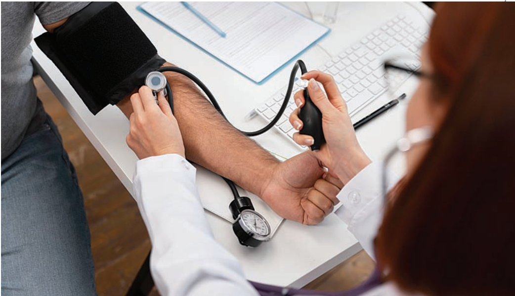
Ainda para novembro a expectativa é realizar mil atendimentos em Jundiaí