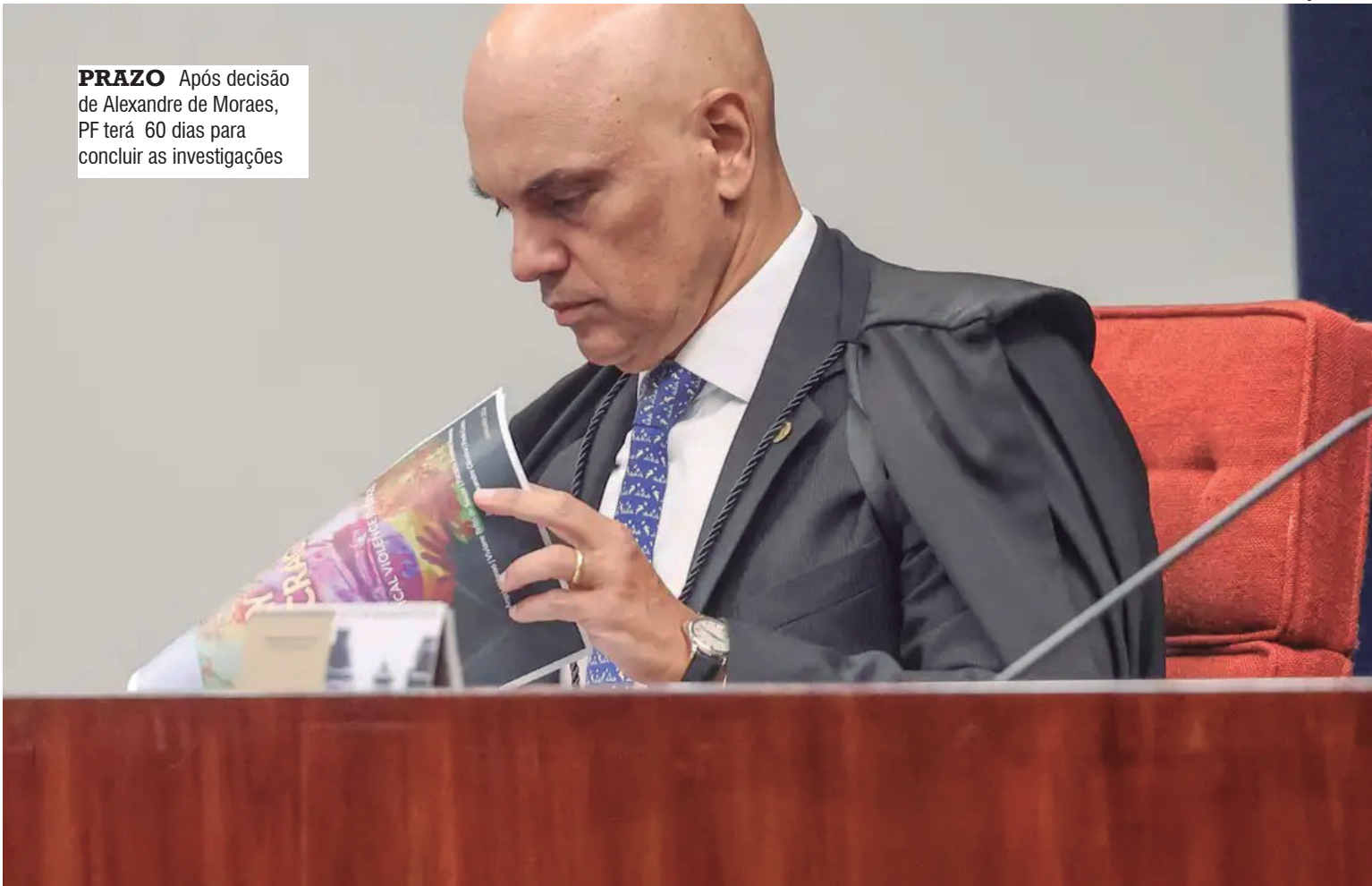
PRAZO Após decisão de Alexandre de Moraes, PF terá 60 dias para concluir as investigações

A abertura do inquérito havia sido pedida pela Polícia Federal, com aval da Procuradoria-Geral da República