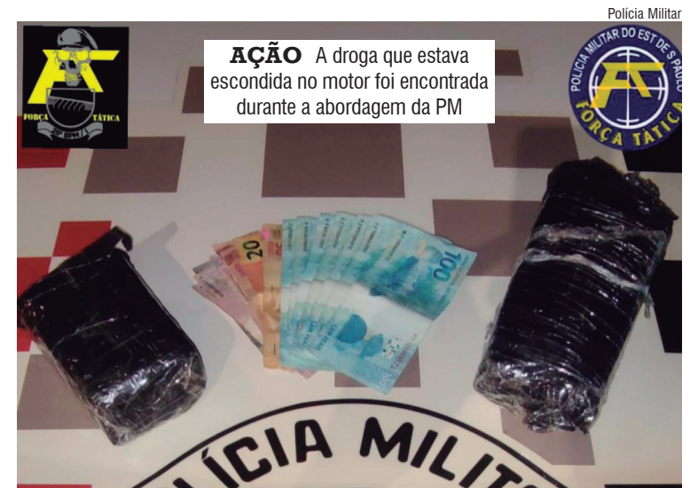
AÇÃO A droga que estava escondida no motor foi encontrada durante a abordagem da PM

Inicialmente, nada de irregular foi encontrado com o motorista. No entanto, diante da suspeita, os militares realizaram uma vistoria mais detalhada no automóvel e localizaram dois tijolos de maconha escondidos no