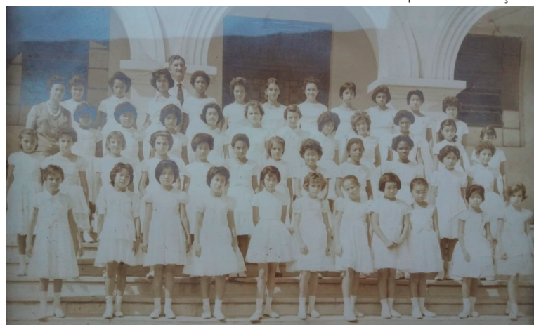
Formatura do 4º ano da atual Escola Estadual José Cândido em 1961