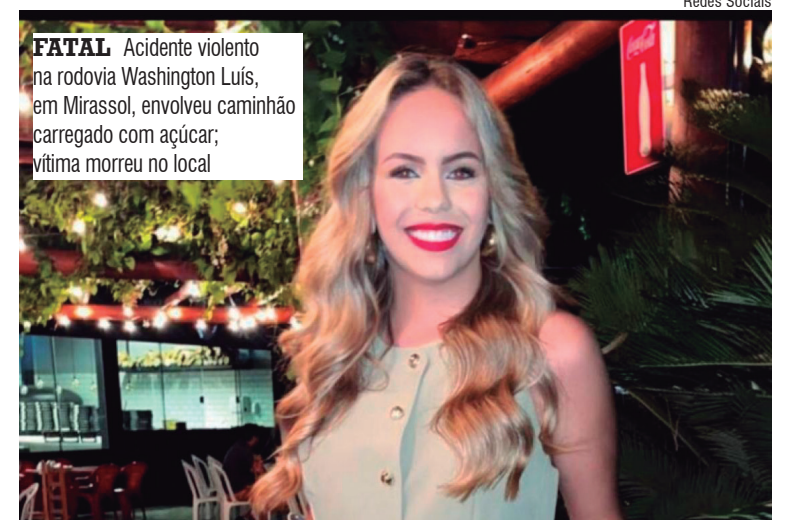
FATAL Acidente violento na rodovia Washington Luís, em Mirassol, envolveu caminhão carregado com açúcar; vítima morreu no local

A Polícia Científica realizou os trabalhos periciais para apurar as circunstâncias do acidente. O corpo da jovem foi encaminhado ao Instituto Médico Legal (IML) e, posteriormente, liberado para velório e sepultamento em sua cidade de origem. O caso será investigado para esclarecer as causas da colisão.