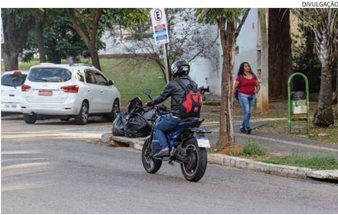
Prefeitura lança campanha 'Não deixe um acidente contar sua história'