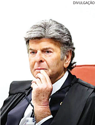
Fux foi o único ministro do STF a votar a favor de Bolsonaro

ex-presidente Jair Bolsonaro. A tentativa frustrou os planos dos aliados de Bolsonaro que, desde a última sexta-