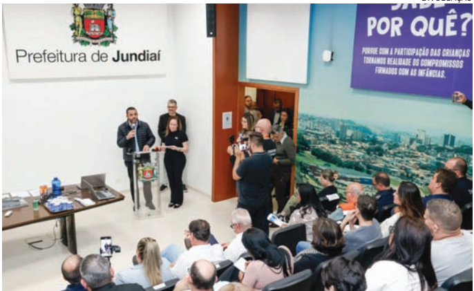
Velocidade, avanço do sinal e conversões proibidas são as principais causas