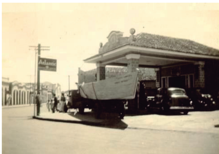
Antigo posto de combustível