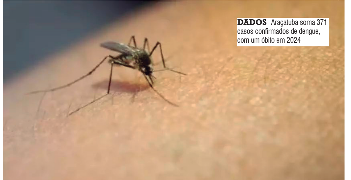
DADOS Araçatuba soma 371 casos confirmados de dengue, com um óbito em 2024

Como medida de prevenção, a Prefeitura de Araçatuba está intensificando as ações em escolas para o controle da dengue. A iniciativa visa identificar os possíveis criadouros do Aedes aegypti e elaborar estratégias de eliminação permanentes nesses locais.