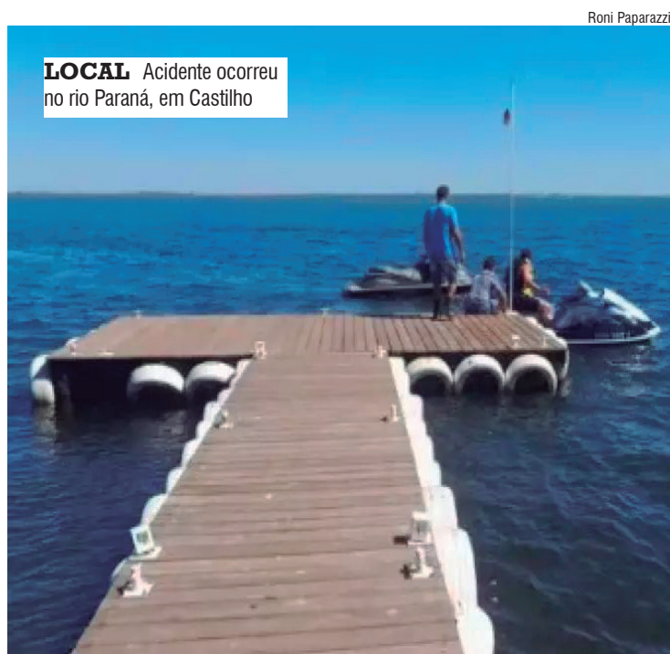
LOCAL Acidente ocorreu no rio Paraná, em Castilho

Testemunhas prestaram socorro aos homens, que foram encaminhados em estado grave ao Hospital Auxiliadora de Três Lagoas (MS). A causa do acidente está sob investigação.