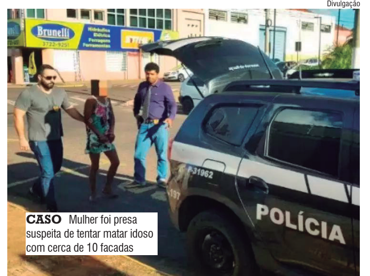
CASO Mulher foi presa suspeita de tentar matar idoso com cerca de 10 facadas

A prisão da mulher foi convertida em preventiva, sendo ela encaminhada para o presídio de Tupi Paulista. O caso foi registrado como tentativa de latrocínio e está sob investigação da Polícia Civil.