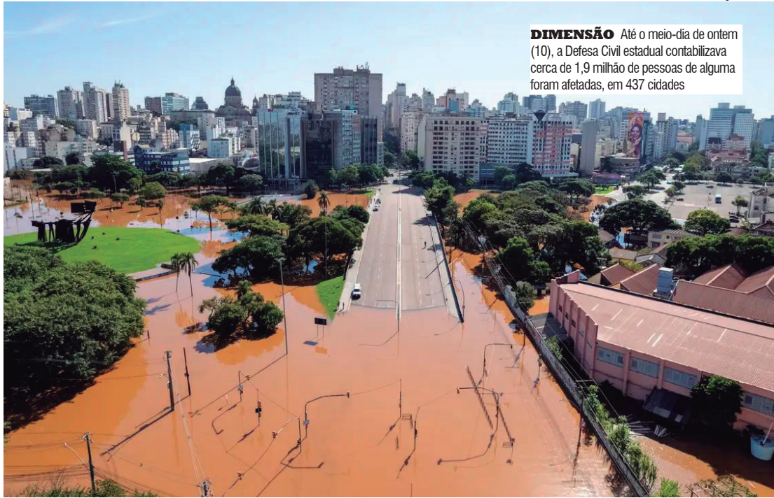
DIMENSÃO Até o meio-dia de ontem (10), a Defesa Civil estadual contabilizava cerca de 1,9 milhão de pessoas de alguma forma afetadas, em 437 cidades