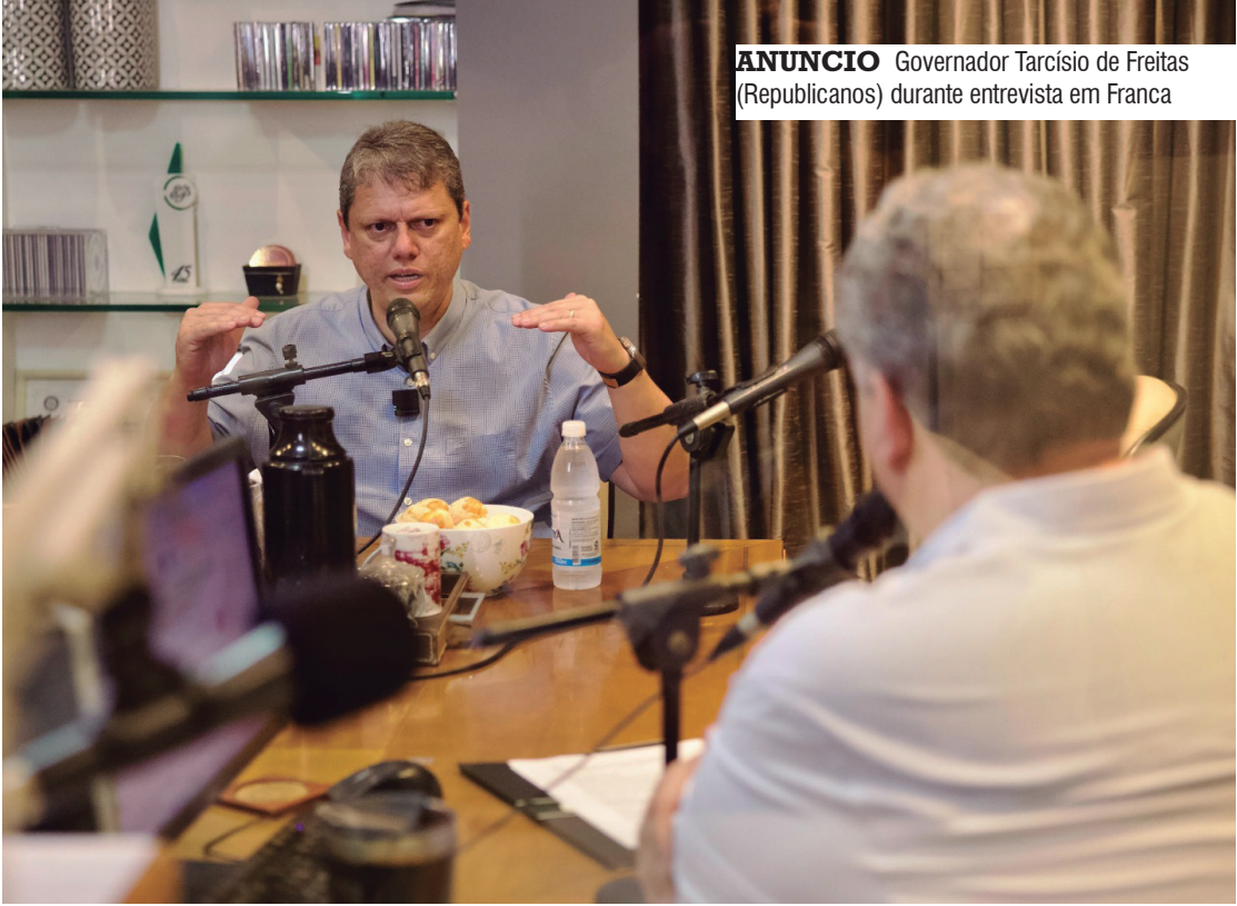
ANUNCIO Governador Tarcísio de Freitas (Republicanos) durante entrevista em Franca

O Conselho do Programa de Parcerias de Investimentos aprovou, em sua 14ª Reunião, realizada em 2 de dezembro de 2020, a qualificação para relicitação da Malha Oeste. Até hoje nada foi feito de efetivo.