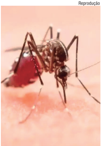
DADOS Birigui teve um aumento de casos positivos em 37% em comparação ao mesmo período de 2023

FIQUE ATENTO EM SUA CASA. SIGA ESSAS DICAS: 1. Atente-se aos vasos de plantas