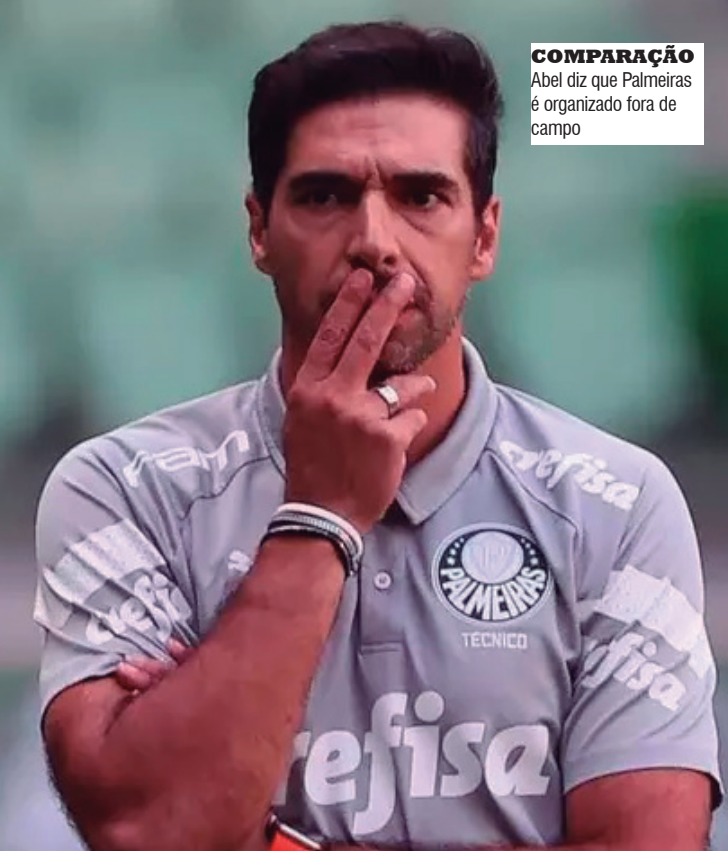
COMPARAÇÃO Abel diz que Palmeiras é organizado fora de campo

“Eu acho que o Palmeiras consegue competir com essa equipe (Flamengo) porque somos organizados, estruturados e jogamos juntos há mais tempo. Mas se formos competir com orçamento, com capacidade financeira, não tem como competir, porque eles têm três ou quatro vezes mais do que nós. Mas o Palmeiras faz muito com os recursos que tem. Somos competitivos porque somos organizados, e vamos continuar sendo competitivos”, afirmou o treinador.