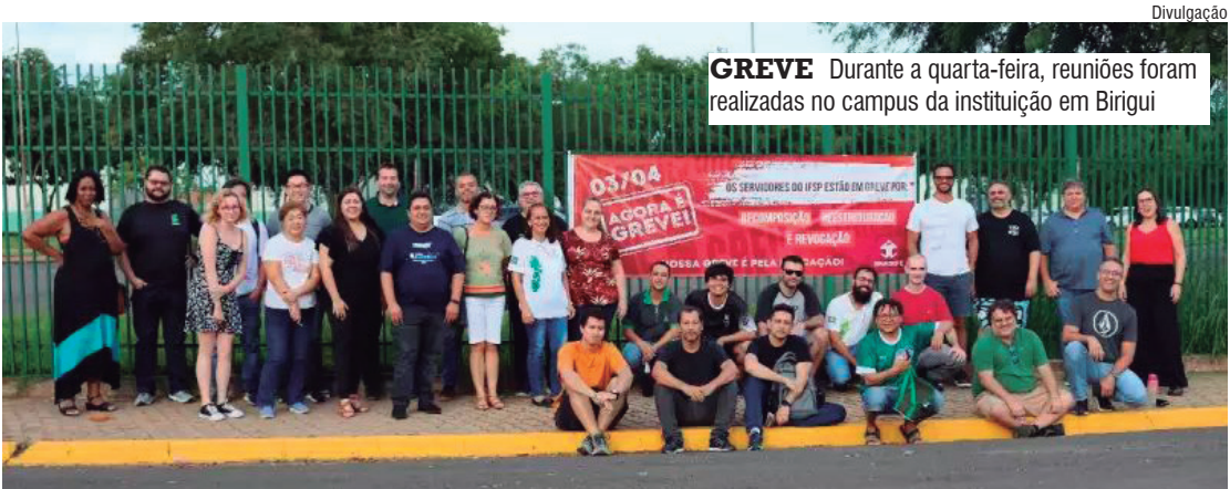
GREVE Durante a quarta-feira, reuniões foram realizadas no campus da instituição em Birigui