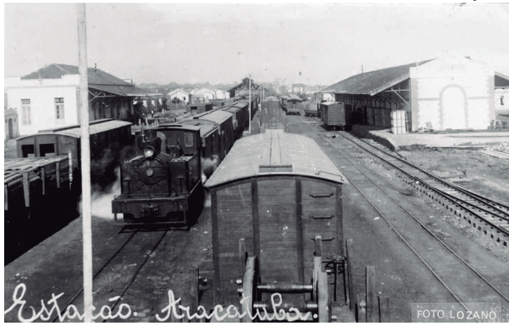
Segunda estação ferroviária de Araçatuba