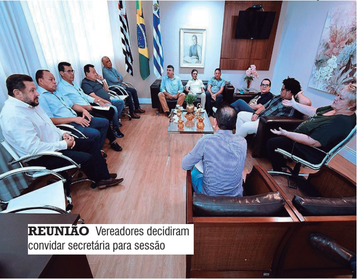
REUNIÃO Vereadores decidiram convidar secretária para sessão

prevista para a próxima segunda-feira (22), na 12ª sessão ordinária do ano. A responsável pela pasta da saúde deve prestar os esclarecimentos na fase do Grande Expediente da sessão ordinária, que deve ser transformada em informal.