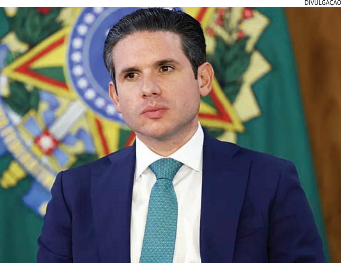
Motta segue visto como nome natural à recondução em 2027

enfraquecido em episódios como a anistia e a PEC da Blindagem, consolidando a avaliação de falta de articulação com a maioria da Casa e com os demais Poderes.