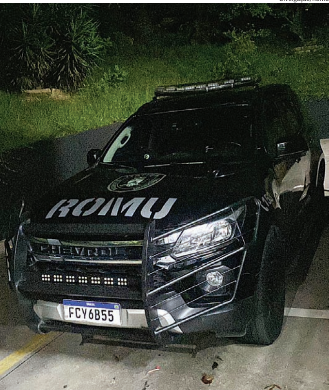
O suspeito tem passagens policiais anteriores por roubo

Diante dos fatos, o indivíduo foi preso e conduzido à delegacia. Toda a ação foi registrada por câmera corporal institucional. O suspeito tem passagens policiais anteriores por roubo.