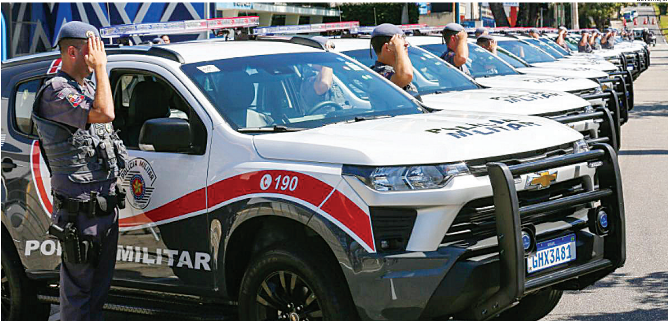
Prisões envolvem delitos como tentativa de estupro e homicídio, roubo e furto a residência