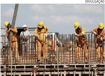
Trabalhadores com carteira assinada tiveram alta de 4,3%

O IBGE analisou ainda o percentual de trabalhadores por grupos de horas trabalhadas e por tempo sem trabalhar e procurando emprego.