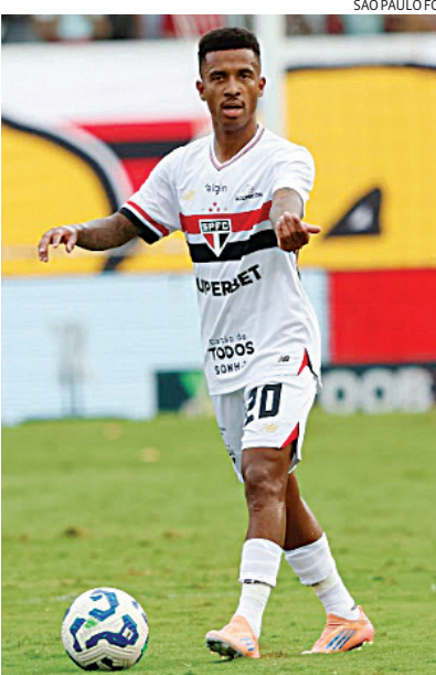
O Flamengo está interessado na contratação do volante tricolor