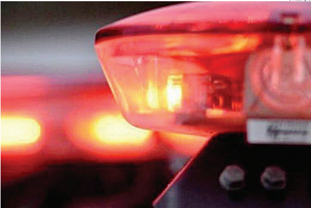
Criminosos passaram a efetuar disparos de arma de fogo contra os policiais, que reagiram em legítima defesa

Durante a tentativa de abordagem, os criminosos passaram a efetuar disparos de arma de fogo contra os policiais, configurando