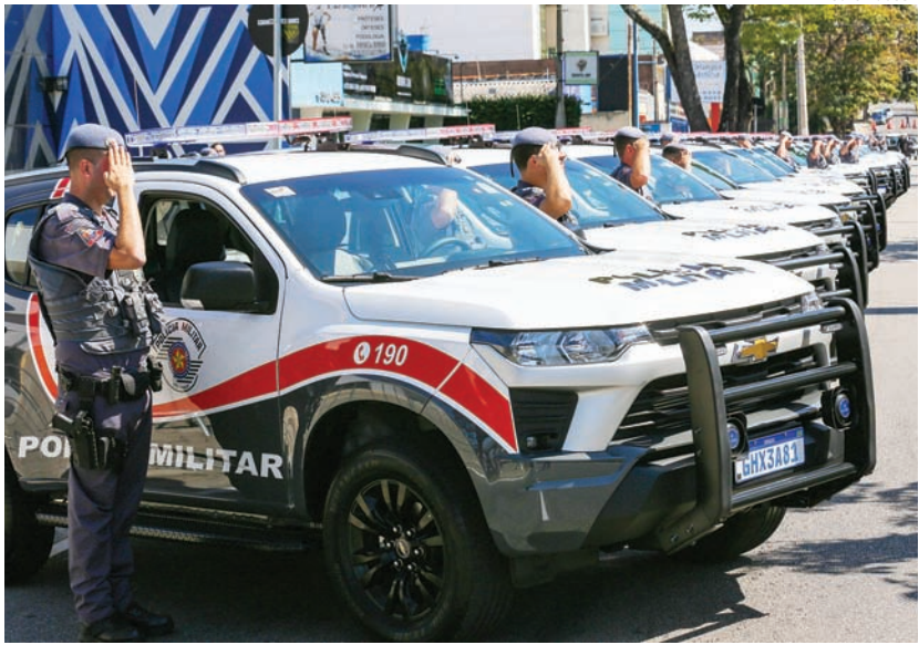
Governo de SP

O Grupo JJ deseja um feliz Ano Novo a todos!