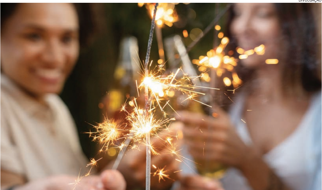
Especialista lembra que antes de estabelecer metas é preciso revisar o que ficou para trás