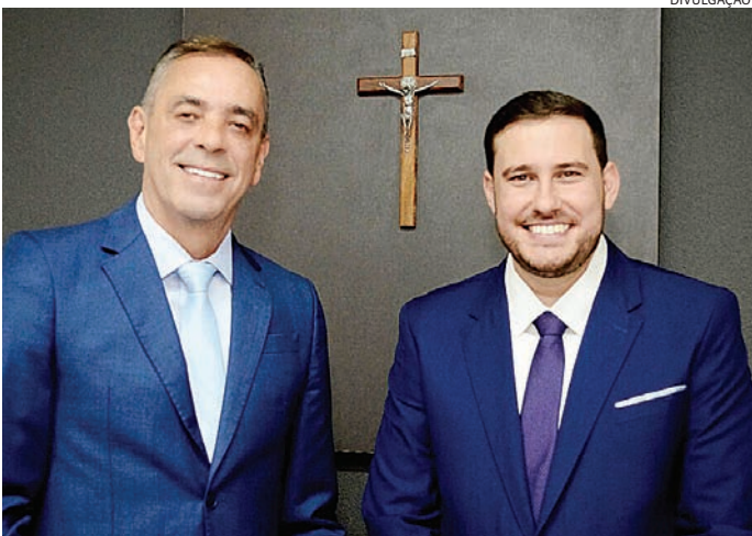
Várzea Paulista: investimentos em infraestrutura

A inclusão social também figura entre as prioridades para o próximo ano. Está prevista a implantação do Centro de Referência para pessoas com Transtorno do Espectro Autista (TEA), em imóvel na Vila Comercial, demanda surgida a partir do Clube de Mães Atípicas.