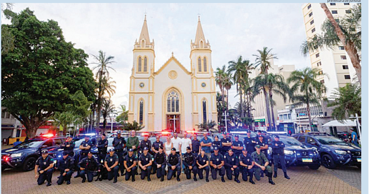
prefeitura de Jundiaí

lificação e o aumento do número de agentes municipais. Política 3