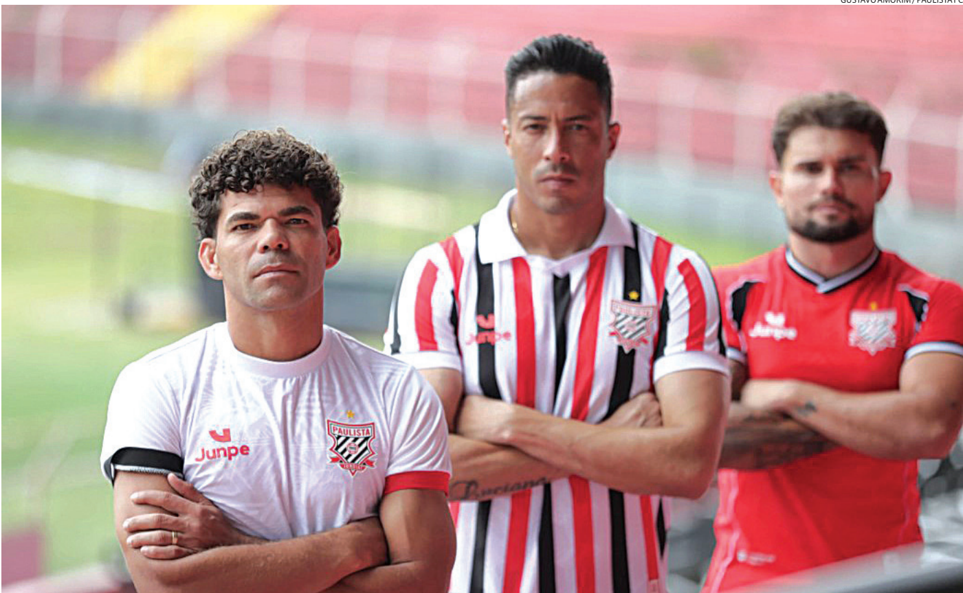
O Paulista inicia 2026 apostando na força do Jayme Cintra e na regularidade

O Galo terá uma sequência equilibrada de confrontos na primeira fase. Além da estreia em casa, enfrentará fora de seus domínios Rio Claro, Marília, Rio Branco, XV de Jaú, Rio Preto, União Suzano, União