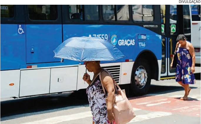
Calor traz desidratação e dilatação das veias, alertam médicos

A reportagem entrou em contato com as demais cidades da Região Metropolitana de Jundiaí para saber quais são os planos e perspectivas dos municípios para 2026, mas não recebeu retorno de Campo Limpo Paulista, Jarinu, Cabreúva e Louveira.