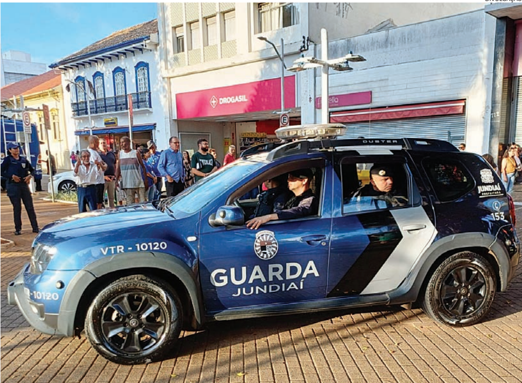
Nova viatura da Guarda Municipal de Jundiaí chega à Praça da Matriz

Ainda de acordo com o secretário, 2025 foi um período de desafios orçamentários, mas de conquistas efetivas. A integração operacional entre Guarda Municipal, Polícia Civil e Polícia Militar foi ampliada ao longo do ano, resultando em um monitoramento mais qualificado, compartilhamento de dados estratégicos e maior identificação de criminosos. O trabalho conjunto refletiu em queda de furtos, roubos e crimes violentos, conforme boletins oficiais divulgados ao longo do ano. A Secretaria