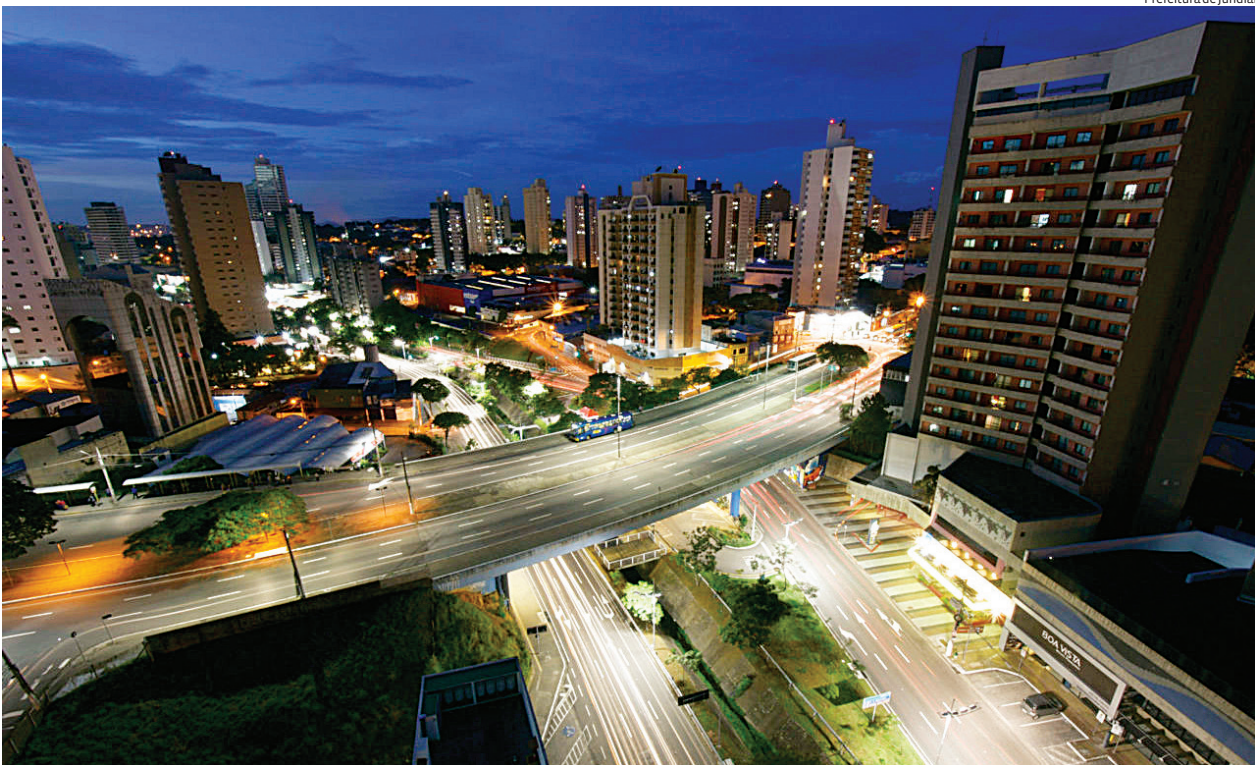
Prefeitura de Jundiaí

Em Jundiaí, 2026 será marcado por novas obras e a ampliação de atendimentos e de políticas públicas