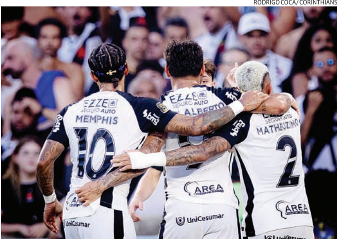
Com a Libertadores, o Timão terá cinco torneios no próximo ano

Isso significa mais jogos, deslocamentos e uma reestruturação logística. O clube, por exemplo, incluiu viagens internacionais no planejamento, algo que não estava presente na previsão inicial.