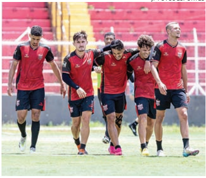
JP FOTOS ESPORTES

Com foco em mais um acesso de divisão, o Galo projeta uma temporada de consolidação e sucesso na Série A3 do Paulistão, que começa em janeiro. Esportes 8