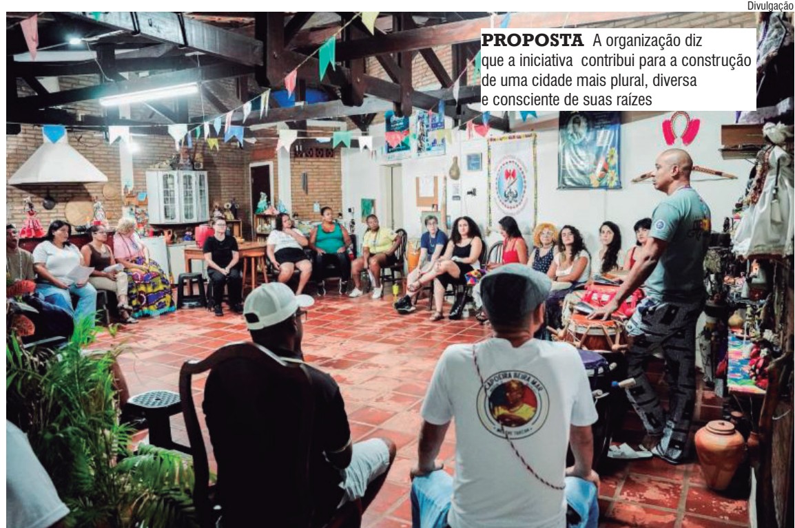
PROPOSTA A organização diz que a iniciativa contribui para a construção de uma cidade mais plural, diversa e consciente de suas raízes

Abriendo a programação, o projeto “Orin - Samba de Caboclo”, em sua 11ª edição, promove oficinas formativas de percussão, dança e cânticos ancestrais, culminando em um evento público que leva a manifestação tradicional para o espaço urbano. A proposta reforça o Samba de Caboclo como patrimônio imaterial vivo, ampliando o acesso da população às expressões culturais historicamente marginalizadas.