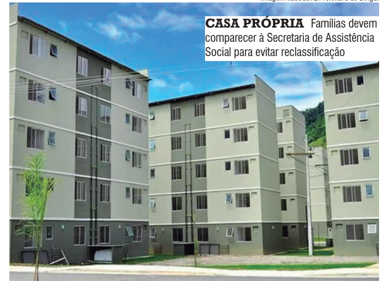
CASA PRÓPRIA Famílias devem comparecer à Secretaria de Assistência Social para evitar reclassificação

As unidades habitacionais já estão sendo construídas no Residencial Topázio, localizado