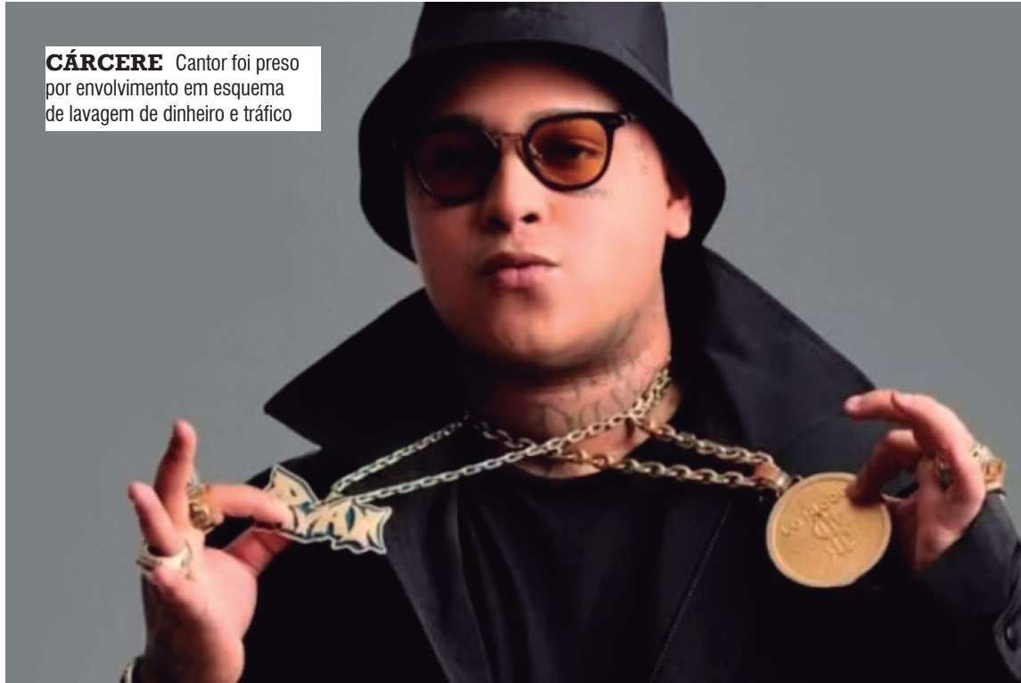
CÁRCERE Cantor foi preso por envolvimento em esquema de lavagem de dinheiro e tráfico

A investigação apontou que o grupo criminoso usava a indústria audiovisual e o showbusiness