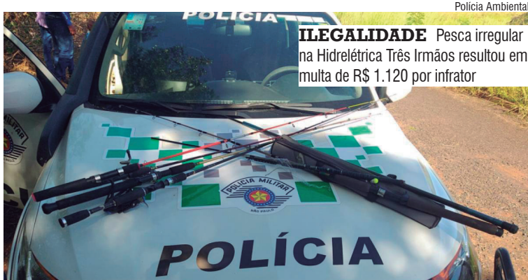
ILEGALIDADE Pesca irregular na Hidrelétrica Três Irmãos resultou em multa de R$ 1.120 por infrator

Após receber informações sobre a prática de pesca no local, a equipe se deslocou para a área da barragem, onde encontrou os infratores com seis quilos de pescado da espécie porquinho, que haviam capturado utilizando caniços e molinetes.