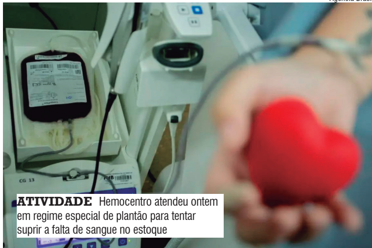
ATIVIDADE Hemocentro atendeu ontem em regime especial de plantão para tentar suprir a falta de sangue no estoque

O Hemocentro, que também atende a demanda de urgências e emergências, pede a colaboração da população para reverter esse quadro. Apesar do feriado prolongado do Dia