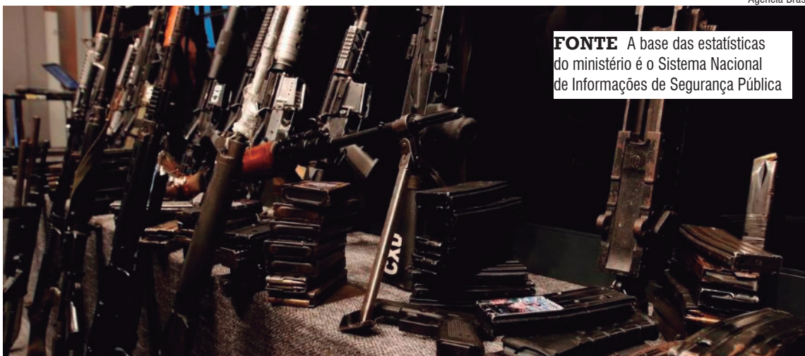
Agência Brasil FONTE A base das estatísticas do ministério é o Sistema Nacional de Informações de Segurança Pública

Os principais números do levantamento relacionados a homicídios dolosos informa que houve 7.289 casos em 2026, ante 12.719 em 2016 (queda