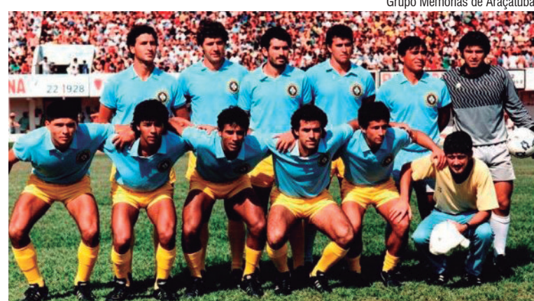
Grupo Memórias de Araçatuba