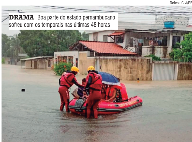
Defesa Civil/PE DRAMA Boa parte do estado pernambucano sofreu com os temporais nas últimas 48 horas

O estado também tem sofrido com os temporais nas últimas