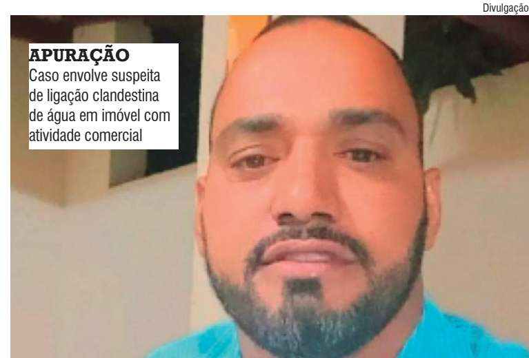
APURAÇÃO Caso envolve suspeita de ligação clandestina de água em imóvel com atividade comercial