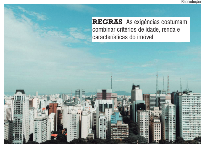
Reprodução REGRAS As exigências costumam combinar critérios de idade, renda e características do imóvel

O prazo para solicitar vai até o último dia útil do exercício ao qual se refere o benefício. O prazo máximo de análise é de até 360 dias. O serviço é gratuito. Caso o pedido seja negado, é possível consultar o motivo e apresentar recurso administrativo.