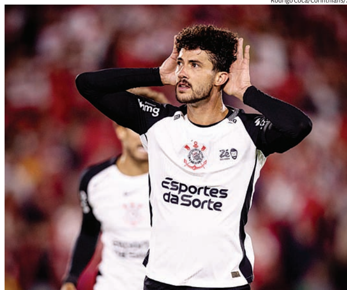
O Corinthians tenta aproveitar o fator casa para voltar a vencer

Do outro lado, o São Paulo chega pressionado após resultados irregulares e tenta somar pontos fora de casa em um dos jogos mais tradicionais do futebol bra-