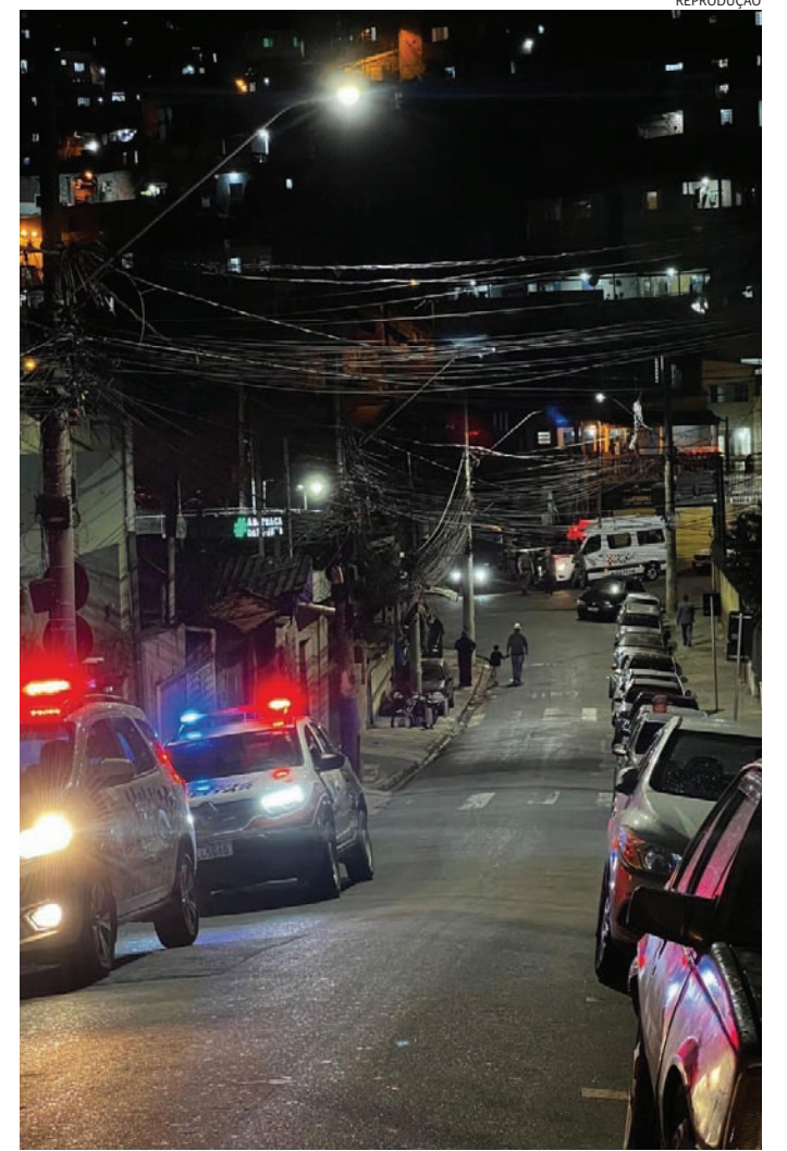
De fiscalização da poluição sonora ao impedimento do tráfico de drogas

Houve atenção especial à proteção de menores, coibindo a venda de álcool por meio da fiscalização dos comércios.