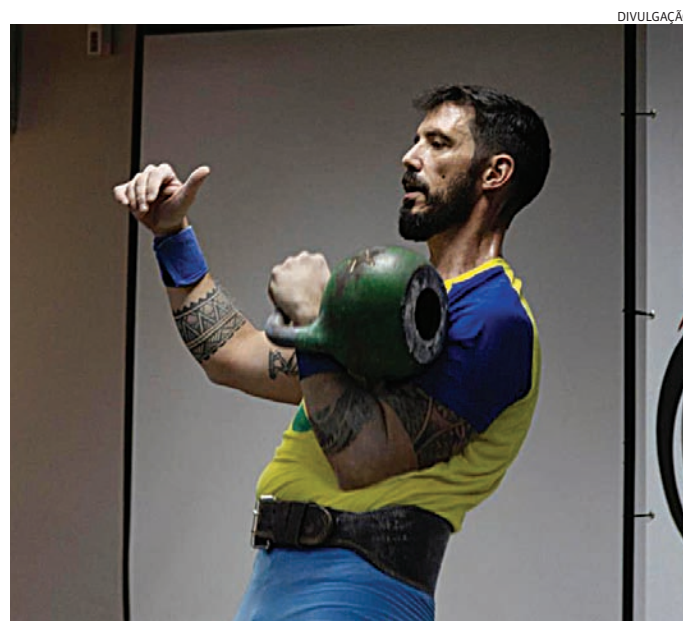
O Kettlebell ainda é pouco conhecido no Brasil

“Muitas pessoas conhecem o kettlebell apenas como ferramenta de treino funcional, sem saber que existe uma modalidade competitiva estrutura-