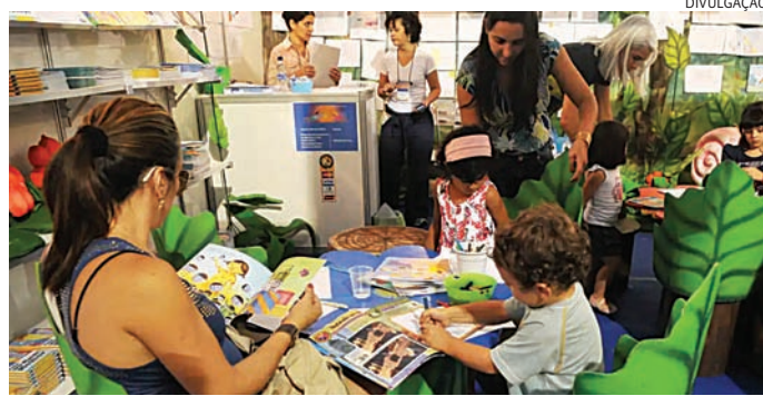
Pais estão lendo menos e crianças têm mais acesso às telas

O pesquisador entende que o ponto central é que a importância da leitura compartilhada ainda não está clara para a população como parte importante do processo de