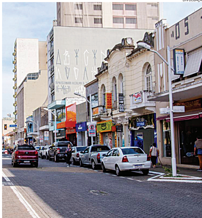
O valor das dívidas jundiaieenses saltou de R$ 1,12 bilhão para R$ 1,37 bi

Quando sai do controle para além da falta de uma educação financeira, há fatores que fragilizam a saúde financeira da população. Um dos assuntos mais recorrentes na Justiça envolvendo direito do consumidor e contratos de