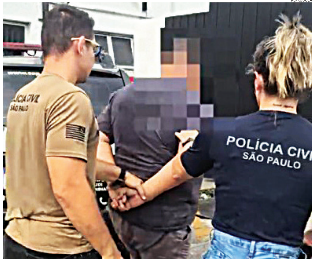
Policiais localizaram no celular do suspeito uma grande quantidade de arquivos criminosos

A ação foi resultado de um intenso trabalho de inteligência desenvolvido pelas equipes especializadas, que identificaram a possível existência de um indivíduo armazenando conteúdo relacionado à exploração sexual infantil no município.