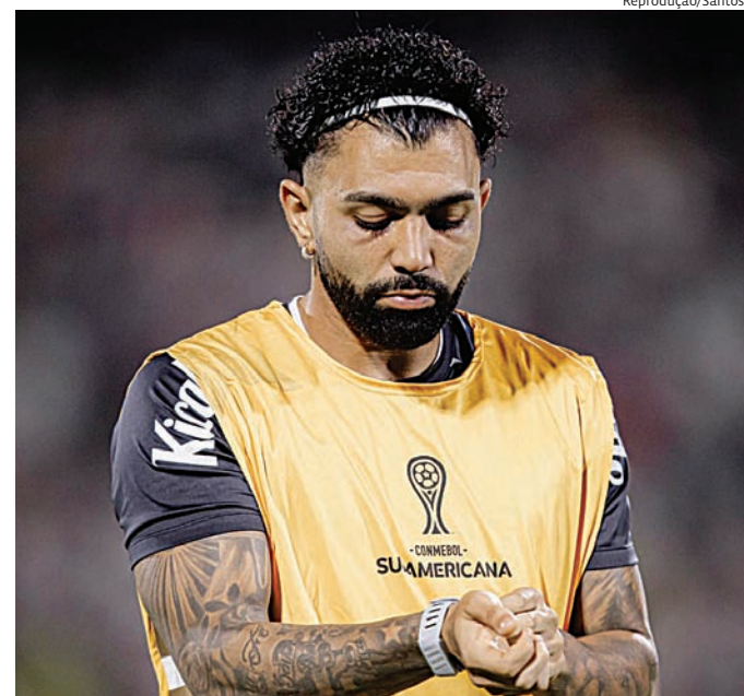
Peixe tenta reação diante do Massa Bruta pela Série A

Já o Red Bull Bragantino tenta manter a regularidade apresentada nas últimas rodadas. O time do interior paulista vem somando pontos importantes e aposta na organização defensiva e velocidade ofensiva para sur-