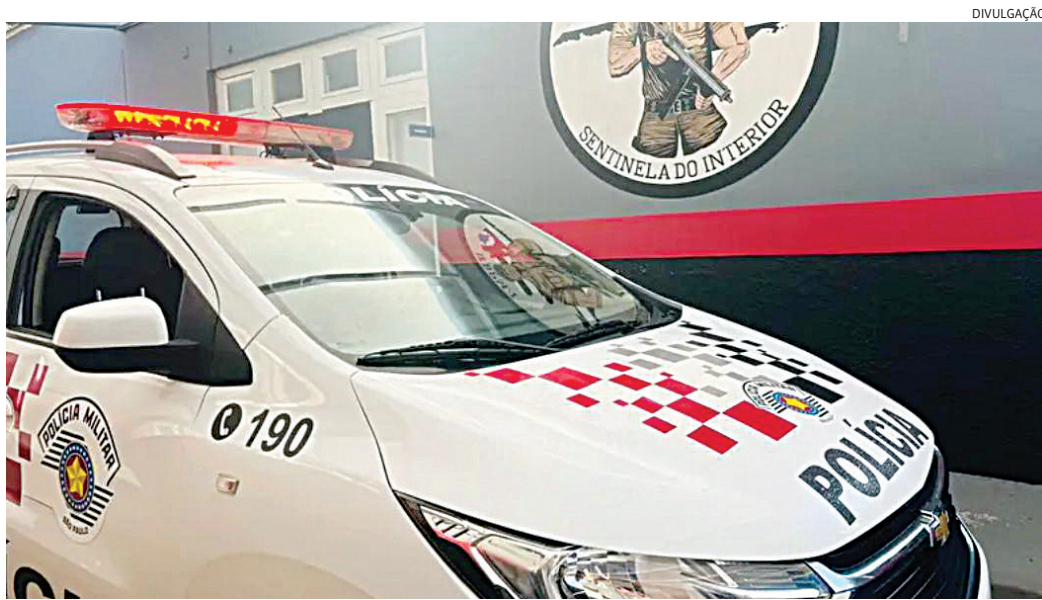
Ele e a profissional do sexo foram abordados saindo de um matagal