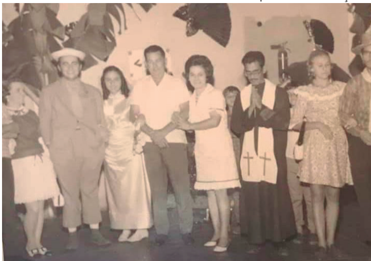
Festa junina do Clube do Corinthians