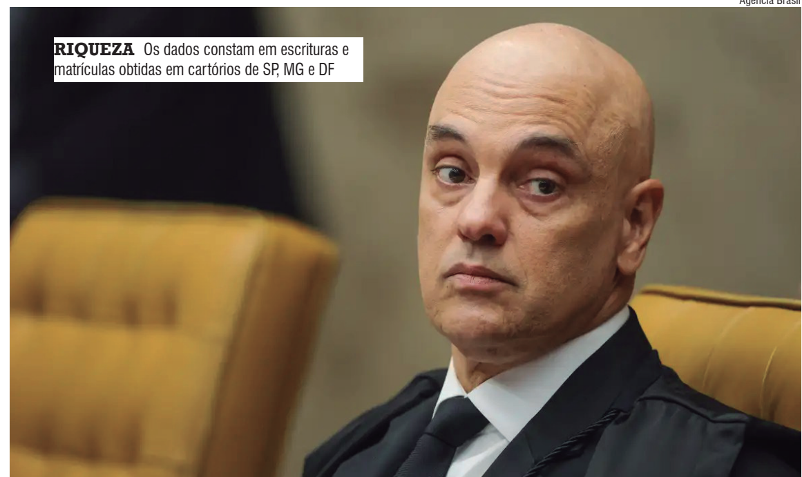
RIQUEZA Os dados constam em escrituras e matrículas obtidas em cartórios de SP, MG e DF