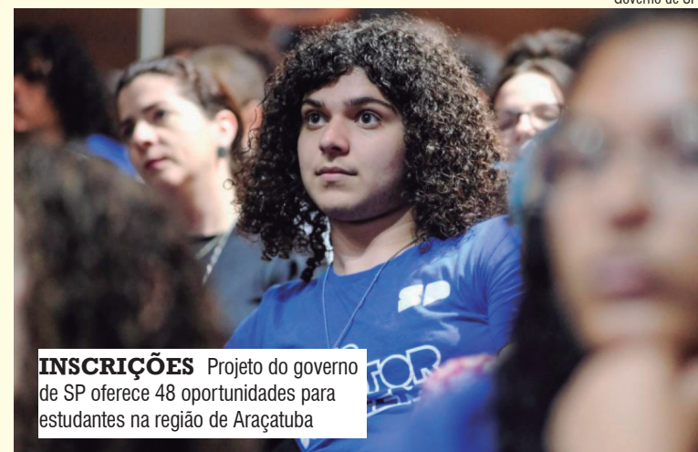
INSCRIÇÕES Projeto do governo de SP oferece 48 oportunidades para estudantes na região de Araçatuba

Atualmente, o programa já conta com 11,6 mil estagiários em todo o estado e a meta é alcançar 30 mil até o fim de 2026. Os selecionados serão encaminhados para empresas parceiras, considerando o perfil