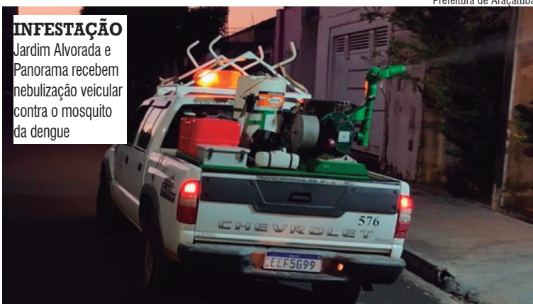
INFESTAÇÃO Jardim Alvorada e Panorama recebem nebulização veicular contra o mosquito da dengue

Desde o início do ano, Araçatuba contabiliza 942 casos confirmados de dengue, com uma morte registrada. Outros 4.827 foram descartados e 255 seguem em análise. Em relação à chikungunya, há 250 confir-