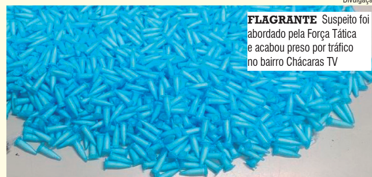
FLAGRANTE Suspeito foi abordado pela Força Tática e acabou preso por tráfico no bairro Chácaras TV

endido e das circunstâncias do flagrante, o suspeito foi levado à Central de Flagrantes da Polícia Judiciária. Após o registro da ocorrência, ele permaneceu preso e ficou à disposição da Justiça.