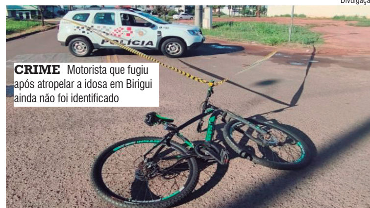
CRIME Motorista que fugiu após atropelar a idosa em Birigui ainda não foi identificado

Ao chegarem, os policiais encontraram a vítima caída, com sangramento na cabeça e fortes dores na região do pescoço. O socorro médico foi acionado com urgência. A mulher recebeu os primeiros atendimentos