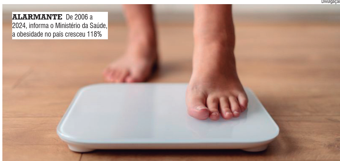
ALARMANTE De 2006 a 2024, informa o Ministério da Saúde, a obesidade no país cresceu 118%

Bechara afirma que o tratamento com canetas emagrecedoras, quando realizado com acompanhamento médico aliado à prática de atividades físicas e a uma alimentação equilibrada, contribui não apenas para a perda de peso, mas tam-