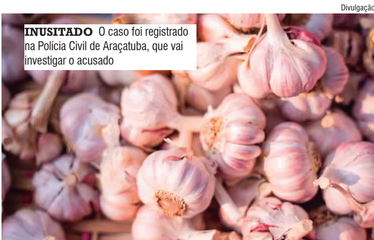
INUSITADO O caso foi registrado na Polícia Civil de Araçatuba, que vai investigar o acusado

A denúncia aponta que, durante aproximadamente seis meses de trabalho, o homem teria furtado cerca de 15 quilos de alho descascado por dia. O volume acumulado impressiona: aproximadamente 720 quilos do produto, gerando um prejuízo