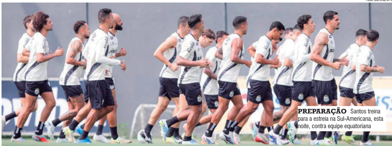
PREPARAÇÃO Santos treina para a estreia na Sul-Americana, esta noite, contra equipe equatoriana

Sonhando com um título ainda nesta temporada, o Santos estreia na competição conti-