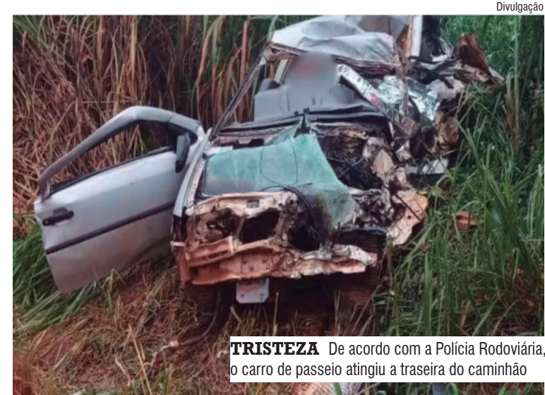
TRISTEZA De acordo com a Polícia Rodoviária, o carro de passeio atingiu a traseira do caminhão