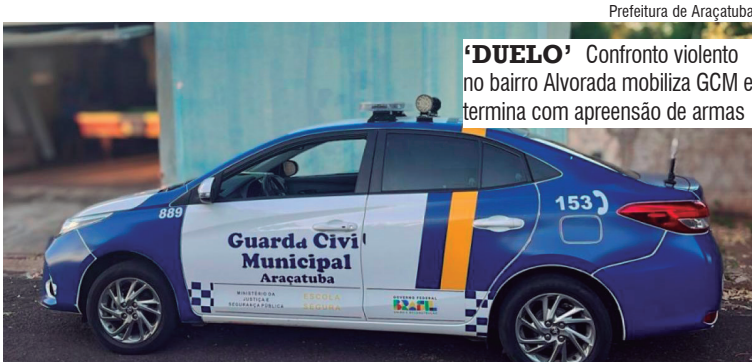
'DUELO' Confronto violento no bairro Alvorada mobiliza GCM e termina com apreensão de armas

Na abordagem, identificaram que um dos homens estava armado com uma faca de churrasco. O indivíduo de 50 anos já estava