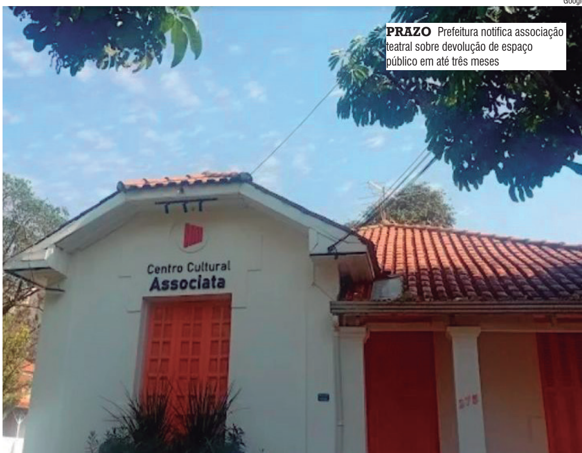
PRAZO Prefeitura notifica associação teatral sobre devolução de espaço público em até três meses

Em nota pública, a entidade afirmou que o Centro Cultural Associata tem papel voltado à promoção da cultura e ao acesso democrático às artes. Segundo a entidade, desde a inauguração do espaço, mais de 10 mil pessoas já foram atendidas em aproximadamente 900 atividades entre cursos, oficinas, ensaios e apresentações culturais.