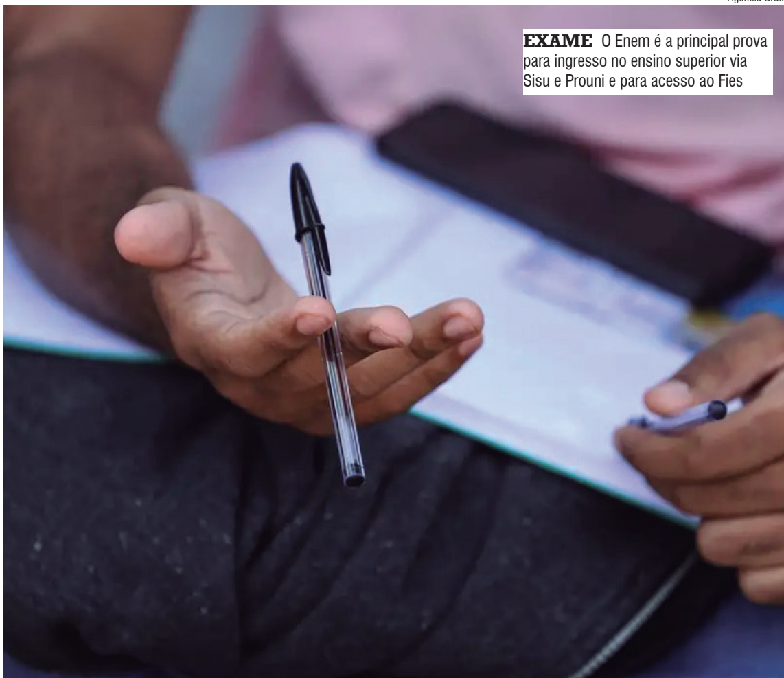
EXAME O Enem é a principal prova para ingresso no ensino superior via Sisu e Prouni e para acesso ao Fies

na inscrição do exame para: matriculados no 3º ano do ensino médio em escola pública, em 2026; estudantes que cursaram