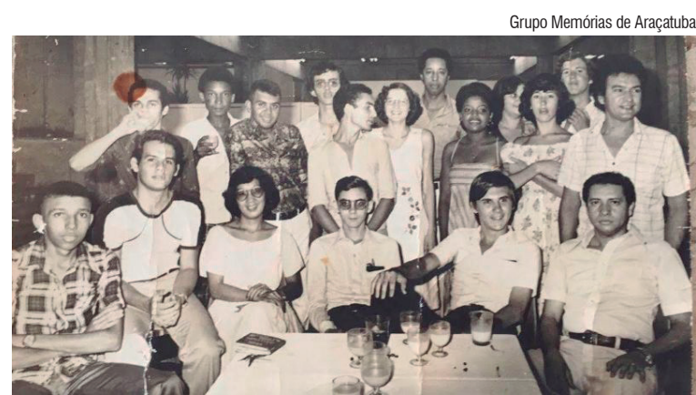
Grupo Memórias de Araçatuba