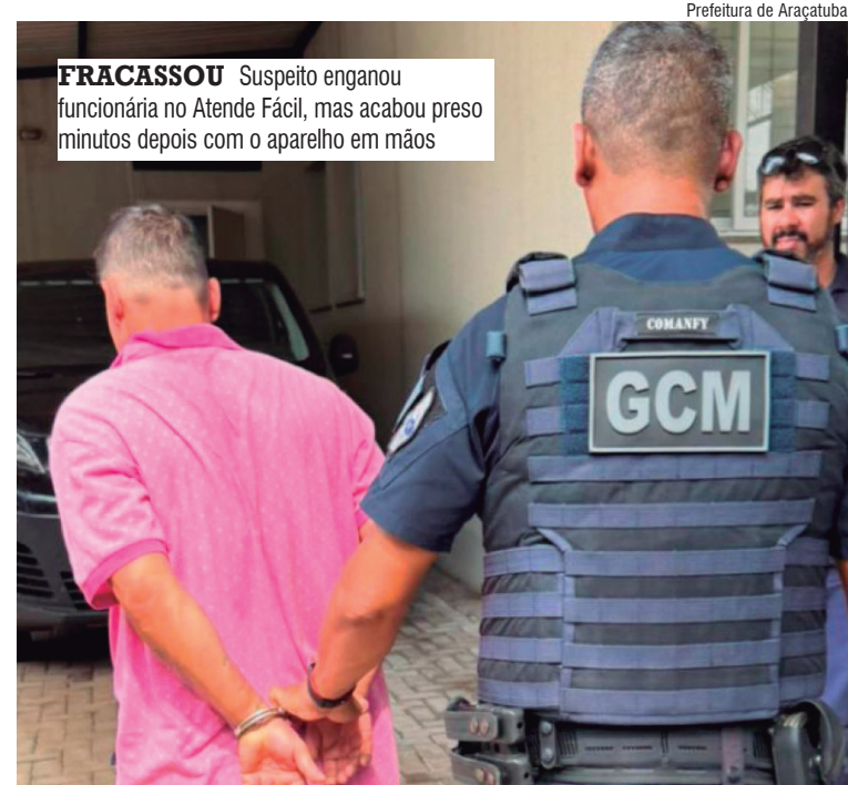
FRACASSOU Suspeito enganou funcionária no Atende Fácil, mas acabou preso minutos depois com o aparelho em mãos

No sistema do Banco Nacional de Mandados de Prisão, foi identificado mandado em aberto contra ele, expedido em 25 de março, pelo crime de lesão corporal. A mulher que estava com o suspeito foi qualificada e liberada no local após os procedimentos de rotina.