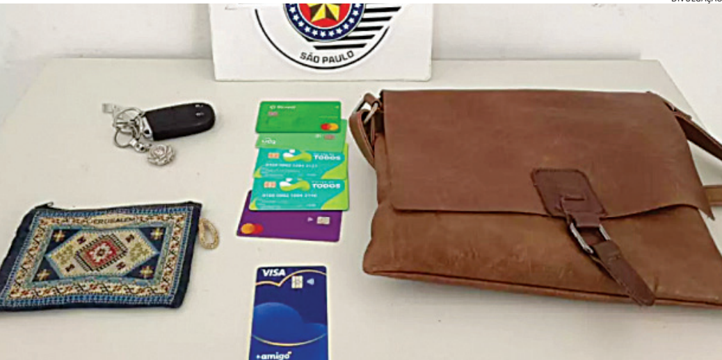
A bolsa com pertences foi recuperada pela PM e por populares

O Velório Municipal informou sobre 9 óbitos, autorizado pelas famílias.