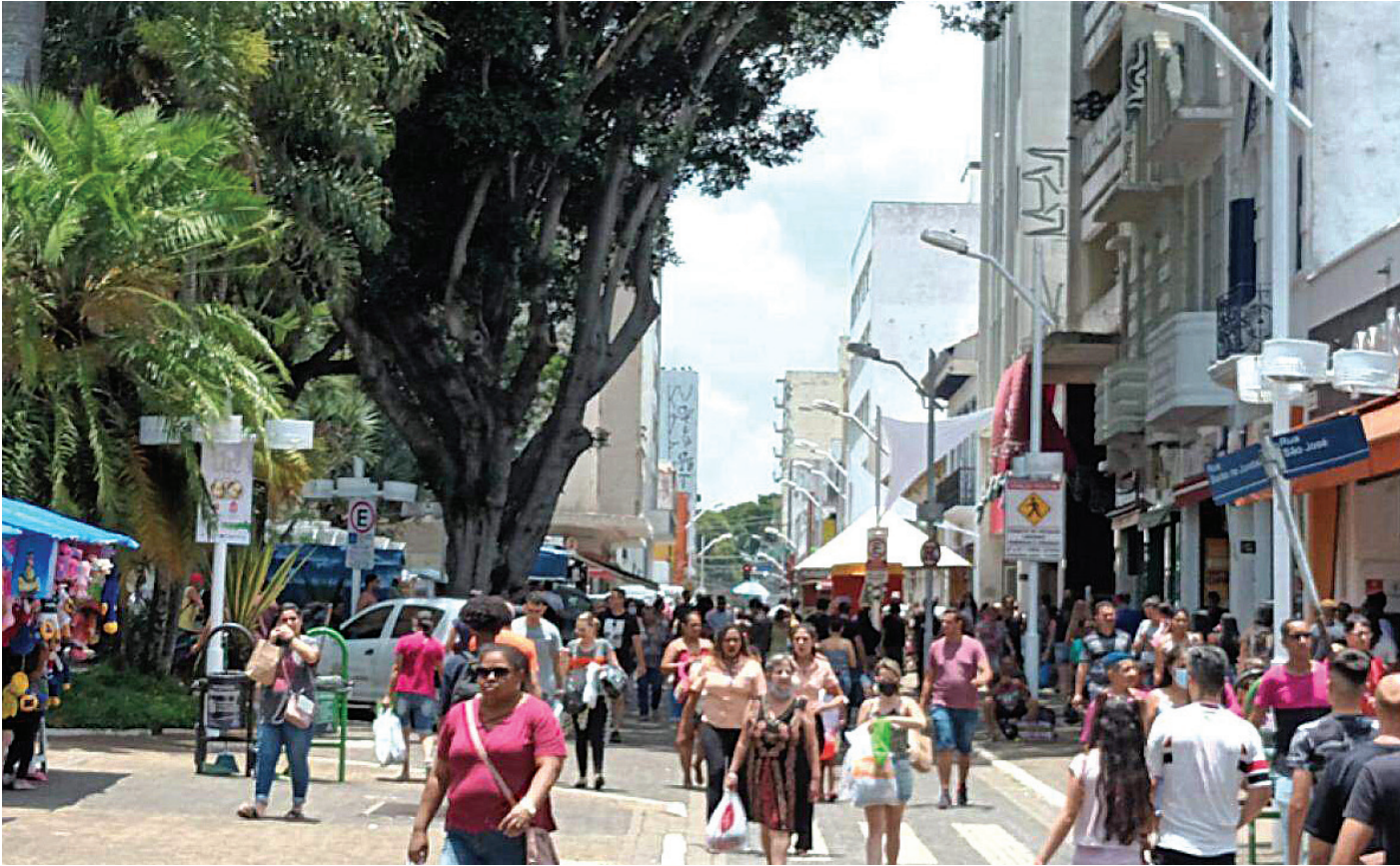
Além do horário estendido, consumidores contarão com opções gastronômicas diversas dos food trucks

nificativa para todos.” Entre os dias 16 e 26 de junho, a cotação dos ovos vermelhos caiu mais de 10,6% no atacado na região produtora de Santa Maria de Jetibá (ES), passando de R$ 207 para R$ 185 a caixa com 30 dúzias. No início do ano, em fevereiro, o produto custava R$ 276. Na Grande São Paulo, a valor dos ovos brancos diminuiu de R$ 179 para R$ 164 em dez dias, queda de 7,3%. Já os vermelhos, recuaram de R$ 199,95 para R$ 182 entre os dias 16 e 26 de junho.