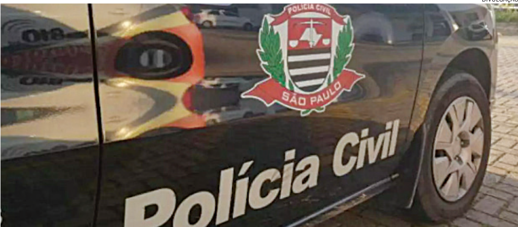
O caso será investigado pela Polícia Civil

também afirmou ter pedido socorro para a vítima, a instituições de segurança e saúde, públicas, e a uma empresa privada, o que também será investigado. O caso, registrado no Plantão Policial, deverá ficar sob responsabilidade da Delegacia de Investigações Gerais (DIG).