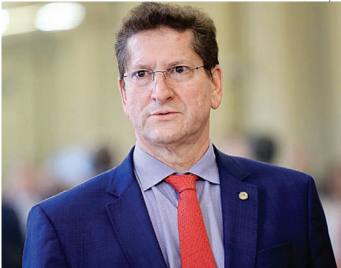
Segundo Jilmar Tatto, campanha unificou o PT e governo

principais alvos, em especial no varejo da rede social, onde o Legislativo aparece claramente identificado como “inimigo do povo”. O direcionamento político das redes segue o discurso e a ação de Lula, que nesta terça-feira (1º) disse enfrentar uma “rebelião” toda vez que tenta cobrar mais impostos de ricos. A declaração foi dada pouco depois de a AGU (Advocacia-Geral da União) ingressar no STF (Supremo Tribunal Federal) para tentar resgatar o decreto presidencial que elevou alíquotas do IOF -derrubado pelo Congresso com 383 votos na Câmara, incluindo a maior parte das bancadas dos centro-esquerdistas PDT e PSB. “Não é briga política, partidária. É a elite, junto com a direita e o cen-