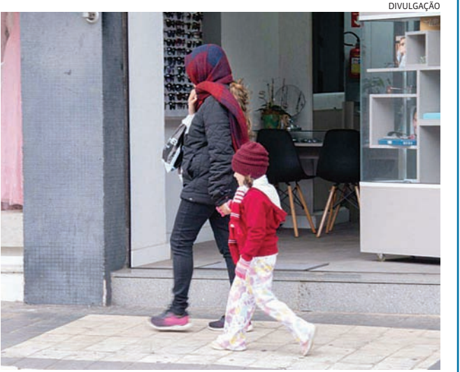
O frio em Jundiaí não dará trégua por enquanto

segundo o Inmet, mas sem previsão de chuva. A amplitude térmica, que é a diferença entre a temperatura mínima e a máxima ao longo de um mesmo dia, tende a continuar alta no domingo (6), quando as temperaturas devem ficar entre 6°C e 20°C. De acordo com o Clima tempo, a partir de segunda (7), os termômetros terão alguma elevação de mínimas, mas devem ficar, em média, entre 10°C e 20°C, sem indícios de chegada de mais chuva à cidade. Até a metade do mês, o tempo deve mudar pouco, com temperaturas mais amenas predominando e estiagem.