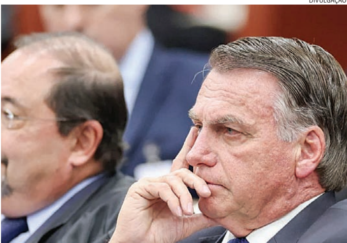
Por conta de uma esofagite, ex-presidente terá que manter repouso

A Câmara dos Deputados aprovou a liberação de crédito de R$ 520 milhões para ações de defesa civil em âmbito nacional. A Medida Provisória (MP) 1299/25 é uma resposta do governo federal em função dos diversos desastres