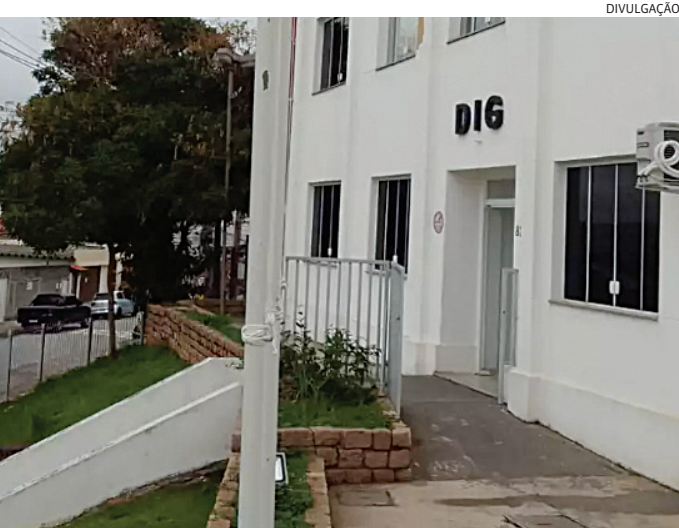
A investigação está sendo feita pela DIG

que além de não haver sinais de violência, a vítima era alcoólatra e pode ter ateadado fogo no próprio corpo, por acidente. A princípio, ele estaria acendendo uma fogueira. O caso foi registrado como morte suspeita.