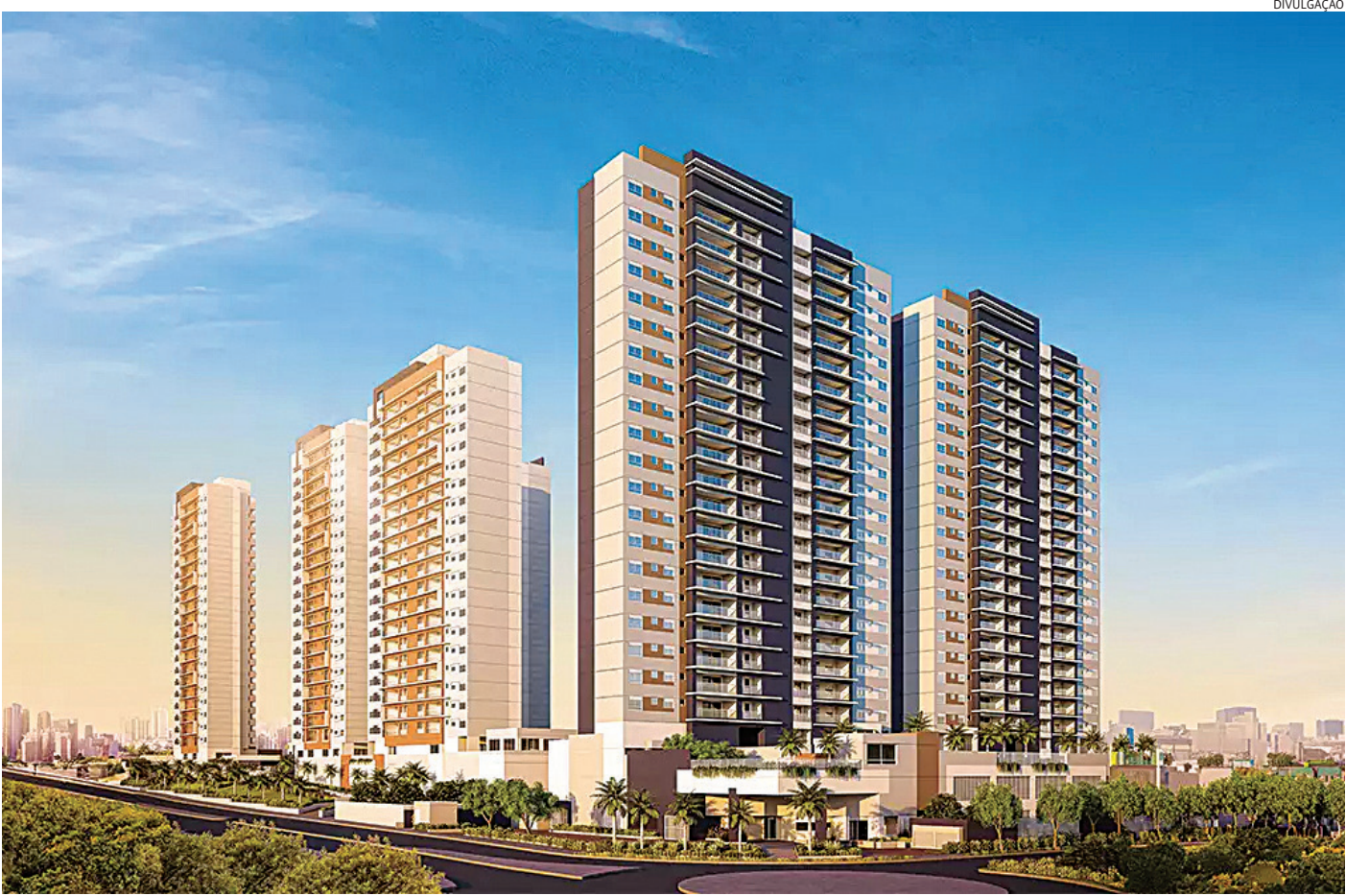
Os empreendimentos Epic Jundiaí e Mistral Jundiaí são dois projetos inovadores da Patriani, e prometem valorizar o bairro Jardim Botânico.

bém oferece uma infraestrutura completa de comércio e serviços, com opções modernas e convenientes para o dia a dia. Entre os destaques, estão: