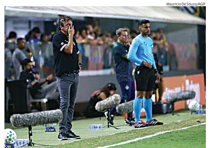
Santos visita o Bahia e São Paulo recebe o Mirassol no sábado

Os dois jogos movimentam o sábado dos clubes paulistas na Série A e podem ter impacto direto na parte de cima e também na zona intermediária da classificação. A rodada é tratada como decisiva para a consolidação das equipes na disputa nacional.