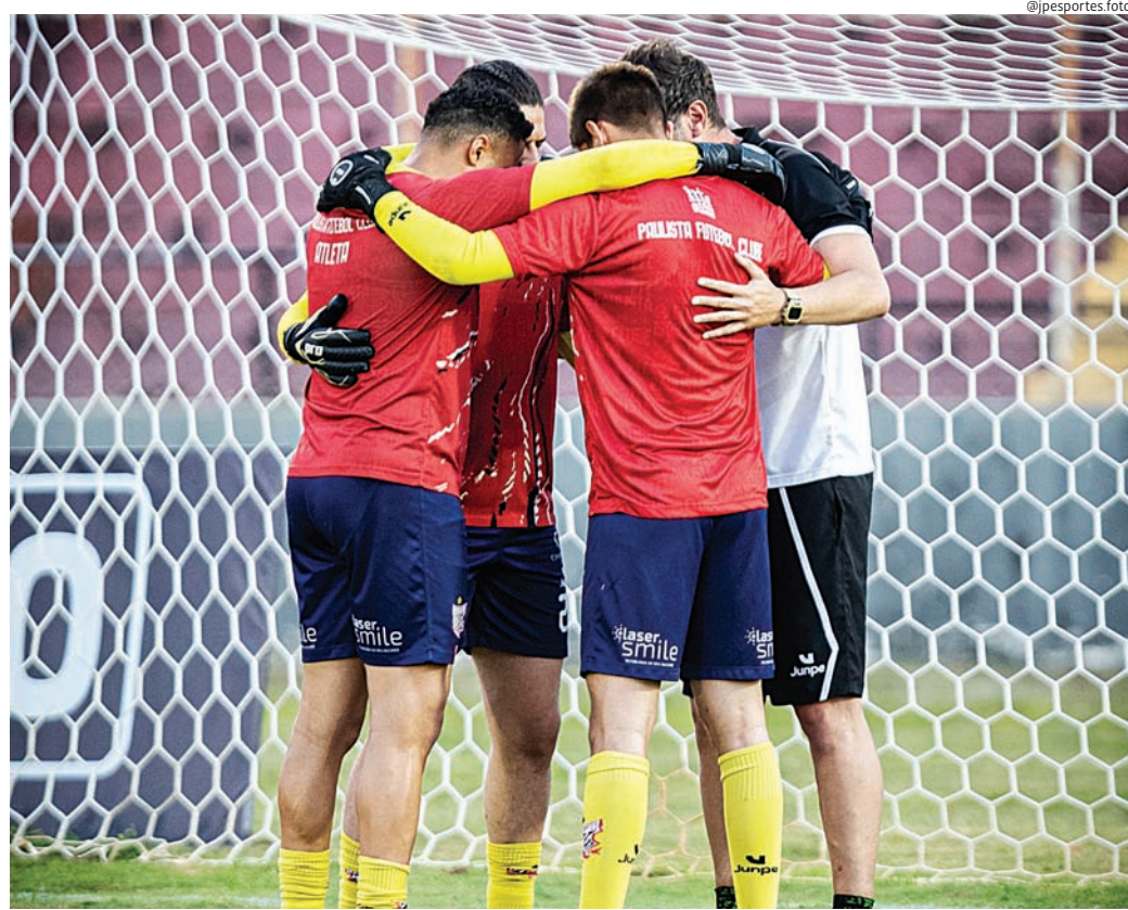
A chave reúne adversários tradicionais do futebol paulista e times que vêm de boas campanhas

Para o Paulista, a definição do grupo marca o início mais concreto do planejamento para o segundo semestre. A competição é tratada internamente como prioridade, tanto pela busca do título quanto pela possibilidade de escolher uma vaga nacional para 2027 — Copa do Brasil ou Série D, benefício destinado ao campeão, com o vice ficando com o vaga remanescente.