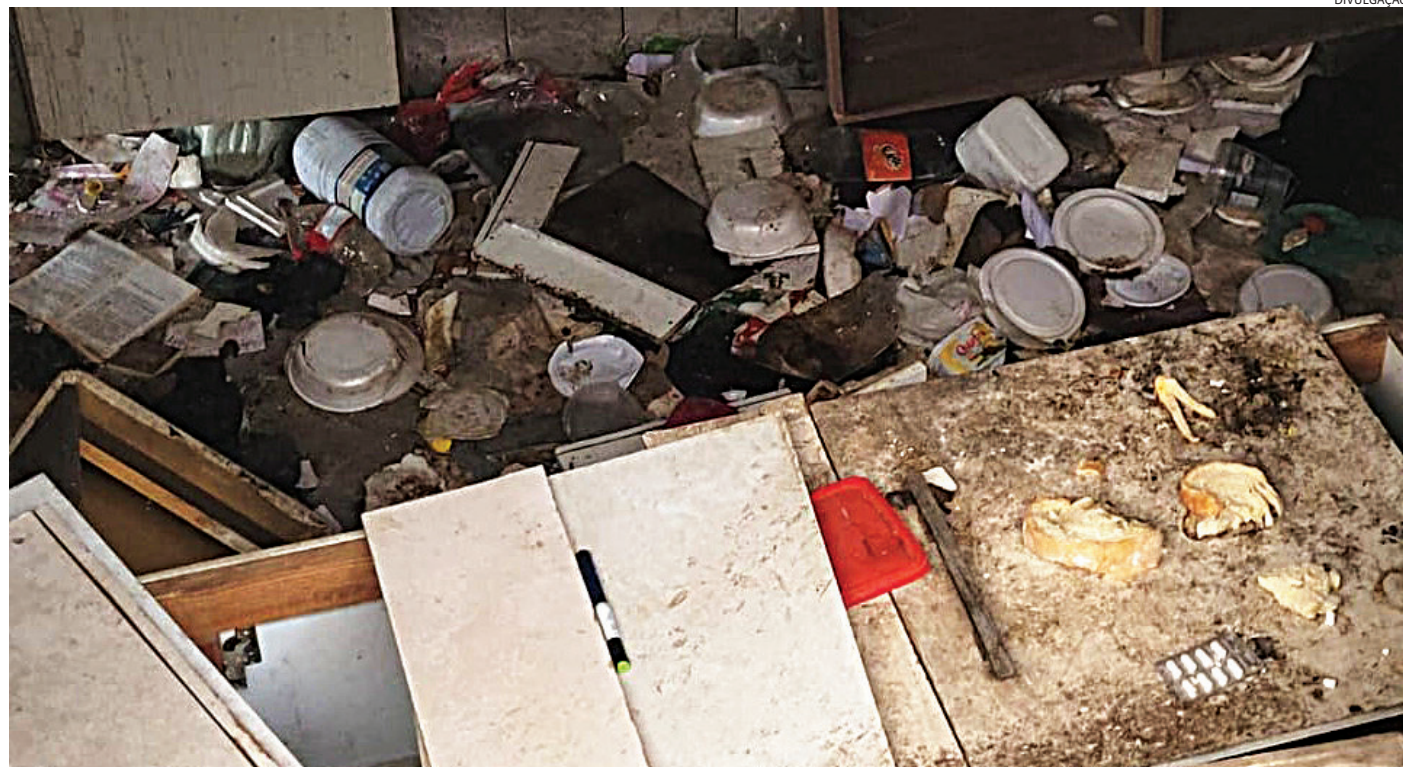
O lixo acumulado tem tirado o sono dos vizinhos que temem por doenças

Uma pessoa que mora na mesma rua descreve a situação como desesperadora, pois vem investindo em venenos para o controle de pragas que surgem, mas que não surtem mais efeito por causa da infestação no local. O último gasto, de R$ 200 em um quilo de veneno de rato, foi suficiente para apenas algumas semanas de controle, mas os restos de comida deixados no local continuam atrain-