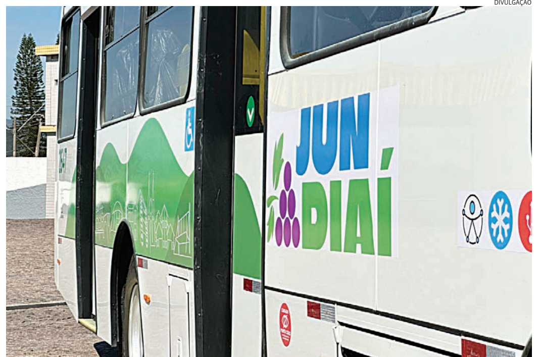
Os veículos terão predominância da cor branca, azul na parte superior e verde na inferior

Com a nova concessão, a idade máxima da frota será de 10 anos, com exceção dos veículos articulados. O