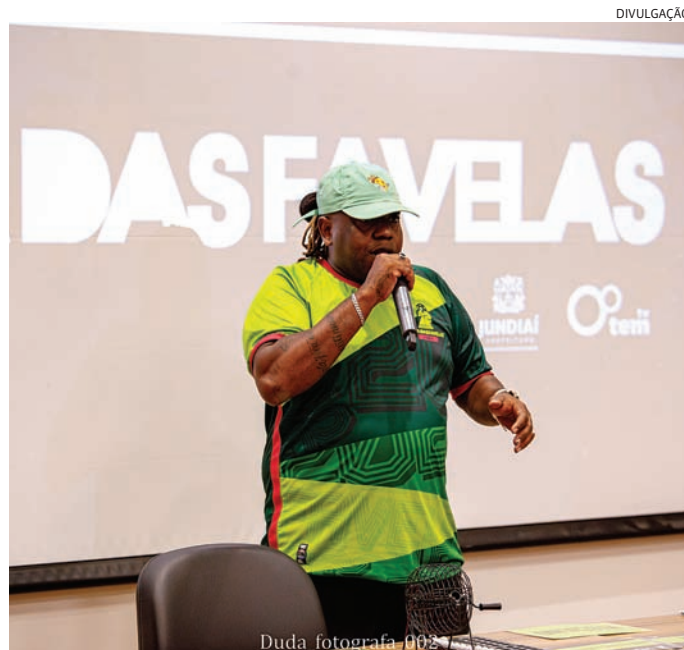
Oito partidas dos times masculinos serão no Dal Santo

A Taça das Favelas feminina só terá partidas nos dias 2 e 3 de maio. Confira a primeira rodada: