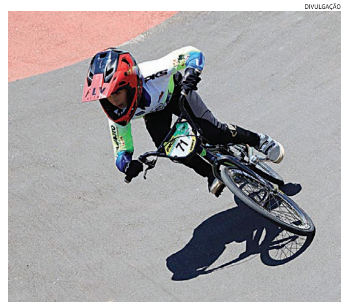
Programação reúne competições e ações do esporte local

No domingo, o cronograma segue com seletivas importantes em modalidades individuais. O taekwondo disputa vaga para o Grand Slam, em Salto, enquanto o karatê participa do JEESP no