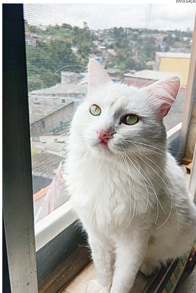
Os cães e gatos adultos são castrados, vermifugados e vacinados

O Instituto fornece orientações em relação aos primeiros cuidados e onde a pessoa pode adquirir ração, caminhas, entre outras instruções. Caso um filhote com menos de cinco meses seja adotado, ele só poderá ir para a casa do adotante no dia da feira com o compromisso de levá-lo para castrar no dia e horário pré-agendado.