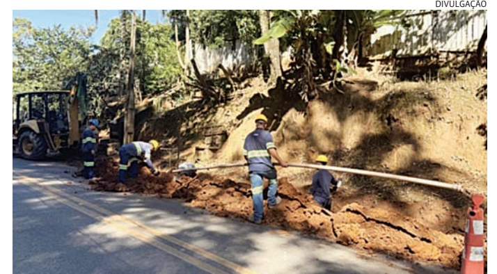
A obra deve beneficiar diretamente cerca de 100 famílias

Já para o segundo semestre deste ano, está previsto o