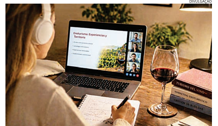
A iniciativa busca melhorar a qualidade dos serviços oferecidos

Também é necessário ter CNPJ ativo e regular, além de manter um estabelecimento vitivinícola aberto ao público, com foco em atividades ligadas ao enoturismo. Para esta etapa,