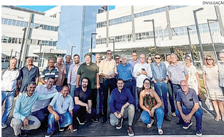
Comitiva de agentes políticos de Várzea Paulista em visita ao novo hospital