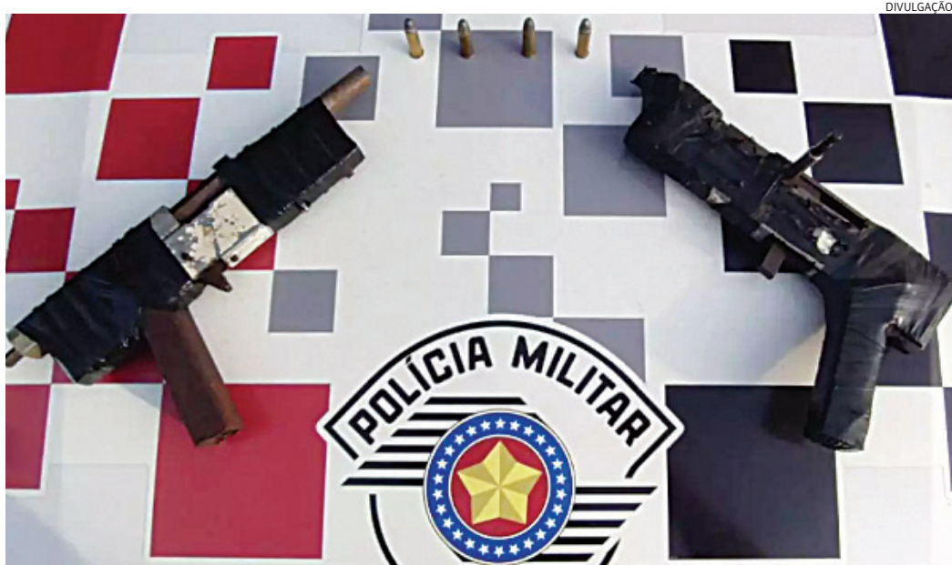
As armas foram apreendidas e o suspeito foi preso