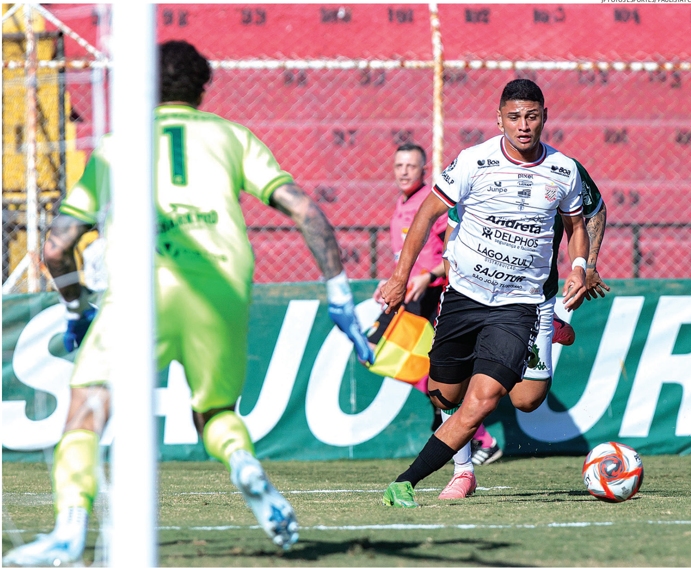
O duelo desta sexta-feira, em casa, pode carimbar a classificação

Vendo o copo meio cheio, o técnico Fausto Dias aprovou a atuação do time jundiaense, levando em conta que jogou contra um adversário que subiu à elite do futebol paulista. “Foi nosso jogo mais difícil da competição até aqui. Teve uma exigência muito grande de parte tática e técnica. [Primavera] é uma equipe que está chegando na elite do futebol, mas do nosso lado fizemos um jogo muito