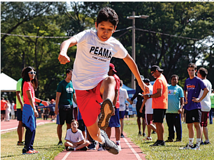
PEAMA é sucesso na formação de atletas e seres humanos em Jundiaí

Nesta segunda-feira (4), membros do Legislativo jundiaieense estiveram em Paraisópolis, na cidade de São Paulo, para conhecer o G10 Favelas — um bloco de líderes e empreendedores de impacto das favelas brasileiras. A visita teve o objetivo de conhecer projetos de combate à vulne-