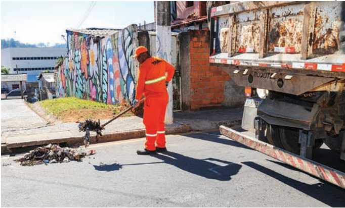
O objetivo da ação é garantir o bom funcionamento da captação

O objetivo da ação é garantir o bom funcionamento da rede de captação de águas pluviais, contribuindo para a prevenção de alagamentos e transtornos durante os períodos de chuva. “Esse tipo de serviço é essencial para manter as vias livres de acúmulo de água e garantir a segurança dos moradores. É um trabalho