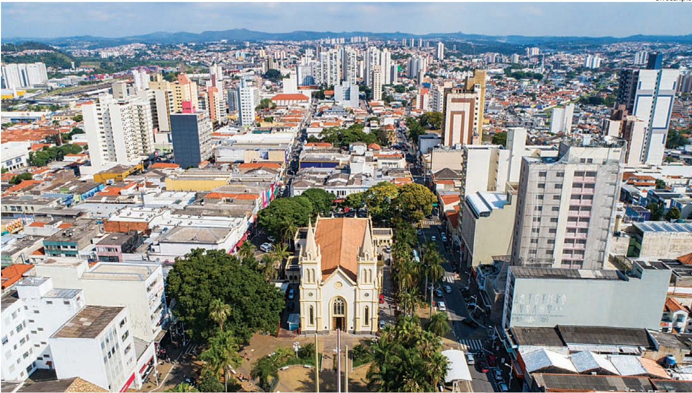
Centro de Jundiaí demanda atenção do poder público para voltar a ser atrativo