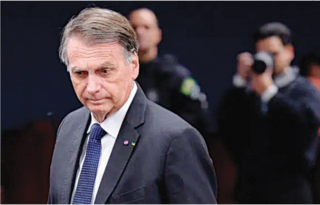
Bolsonaro usou redes sociais dos filhos para se pronunciar e vai ficar detido em casa

tentar coagir o Supremo Tribunal Federal.” Com isso, Moraes determinou que Bolsonaro cumpra prisão domiciliar em seu endereço residencial. A decisão inclui: • uso de tornozeleira eletrônica; • proibição de visitas, salvo por familiares próximos e advogados; • recolhimento de todos os celulares disponíveis no local. “O descumprimento das regras da prisão domiciliar ou qualquer uma das medidas cautelares implicará na sua revogação e na decretação imediata da prisão preventiva, nos termos do art. 312, 1º, do Código de Processo Penal”, ressalta o ministro.