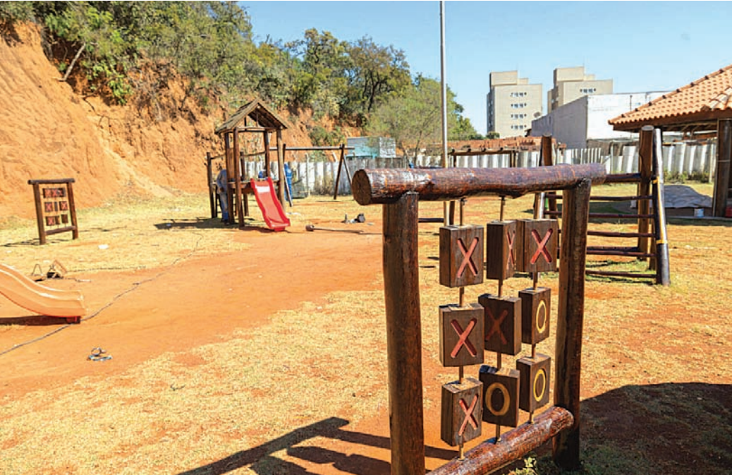
A área infantil está recebendo investimentos, com a substituição e conserto de brinquedos