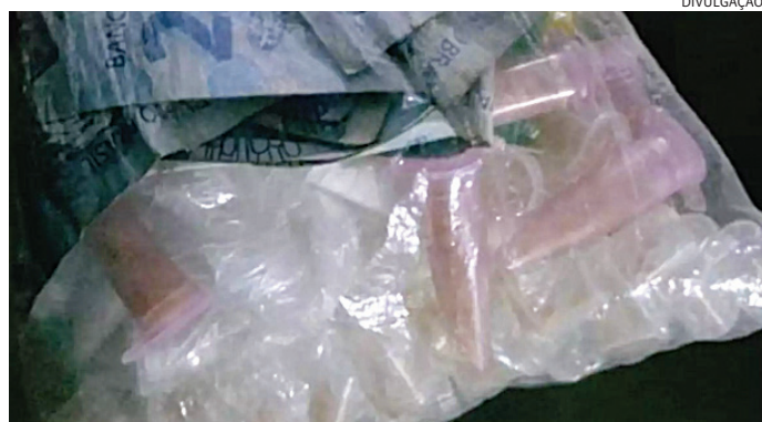
Um saco com pedras de crack foi apreendido pelos GMs

Os guardas da divisão especializada e também da patrulha comunitária faziam rondas pelo bairro, quando se depararam com dois homens em atitude suspeita. Foi feita abordagem e, com um deles, os agentes localizaram e apreenderam dezenas de por-