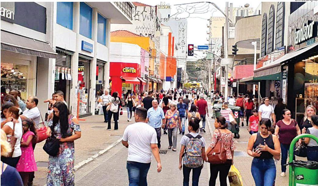
O horário estendido tem o objetivo de oferecer mais tempo de compra aos consumidores

ferença cortada, o que faz com que os preços tenham variação considerável, geralmente, para cima. No ano passado, entre julho e agosto, o botijão de gás comum, de 13 kg, era encontrado de R$ 92,99 a R$ 115 em Jundiaí, segundo levantamento da ANP. Na média, o preço era de R$ 107,29. Já neste ano, na última semana, os preços iam de de R$ 105,99 a R$ 125, média de R$ 113,85.