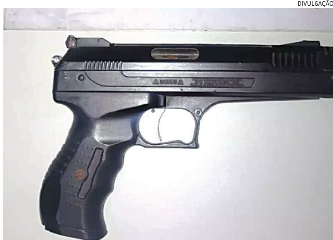
Com ele foi encontrado um simulacro de arma de fogo

Conduzido ao Plantão Policial, ele foi preso por porte ilegal de arma de e ameaça.