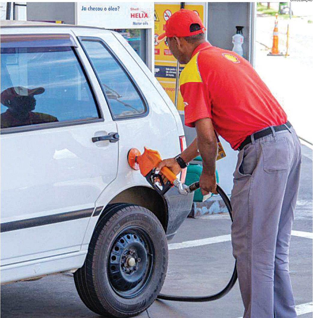
O preço dos combustíveis subiu em relação ao mesmo período do ano passado

ano, o etanol foi encontrado em Jundiaí por preços de R$ 3,69 a R$ 4,19 o litro. A variação é de 13,5%. Em um veículo com tanque de 55 litros, a diferença chega a R$ 27,5 por tanque. Já a gasolina comum é encontrada de R$ 5,49 a R$ 6,19, variação de 12,7%. Em um tanque de 55 litros também, a diferença é de R$ 38,5. Quanto ao diesel S10, considerando o uso em caminhão e um tanque de 200 litros, com preço de R$ 5,69 a R$ 6,29 na cidade no mesmo período, o combustível varia 10,5%. O abastecimento pode representar economia ou gasto extra de R$ 120 por tanque a depender de onde o caminhão é levado. O PREÇO DO GÁS VAI CAIR? Na sexta-feira (1º), a Petrobras anunciou redução