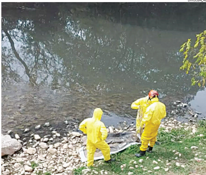
O cadáver foi encontrado pelo funcionário de uma empresa às margens do rio

A divulgação da tatuagem e da corrente tem como objetivo levar familiares a reconhecerem a vítima e assim comparecerem ao IML.