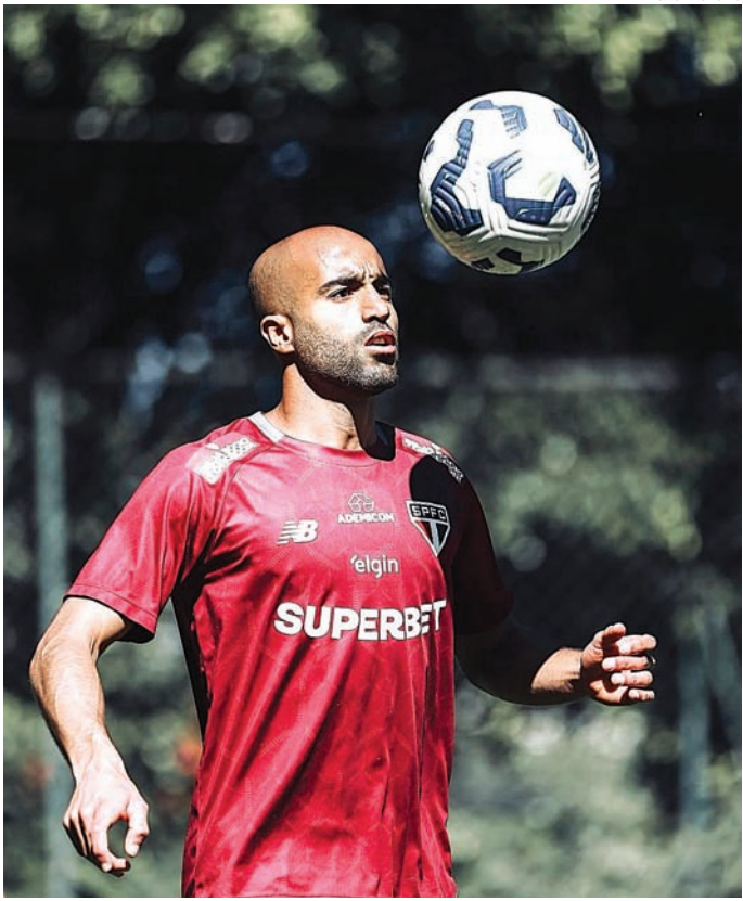
O jogador vem se recuperando de um estiramento no joelho

O São Paulo tem toda a cautela com o jogador que se recupera de um estiramento da cápsula posterior do joelho. O camisa 7 sofreu a le-