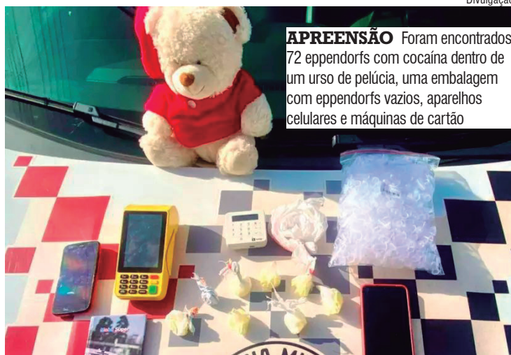
APREENSÃO Foram encontrados 72 eppendorfs com cocaína dentro de um urso de pelúcia, uma embalagem com eppendorfs vazios, aparelhos celulares e máquinas de cartão

Durante busca pessoal, localizaram na posse de uma adolescente de 14 anos oito eppendorfs com cocaína, 2 eppendorfs vazios e um aparelho celular. Indagada, ela declarou que estava ali vendendo o entorpecente a pedido de um homem, vendedor de 30 anos, morador do bairro Laranjeiras.