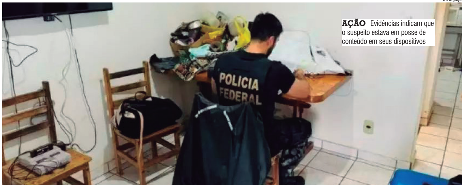
AÇÃO Evidências indicam que o suspeito estava em posse de conteúdo em seus dispositivos

O indivíduo detido poderá enfrentar acusações relacionadas à posse ou armazenamento de material de abuso sexual infantojuvenil.