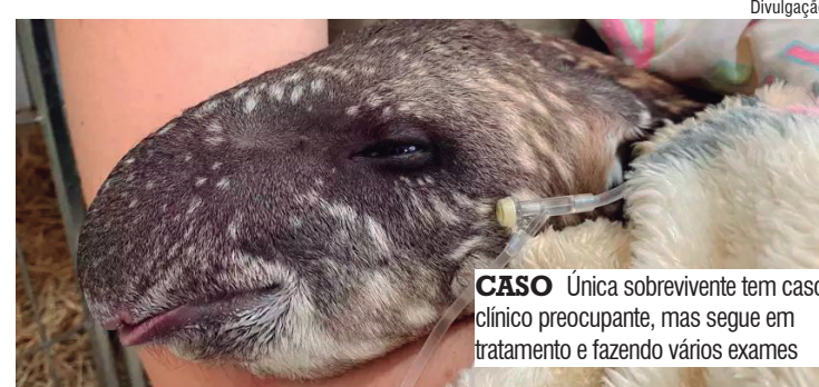
CASO Única sobrevivente tem caso clínico preocupante, mas segue em tratamento e fazendo vários exames

Durante o atendimento ao filhote, ainda sem ter o conhecimento dos outros indivíduos, os policiais que o levaram foram acionados de volta a Piacatu para novos resgates. Então, os dois animais, o macho em óbito e a fêmea com vida, foram localizados no acostamento. Mais uma vez a Associação Mata Ciliar foi acionada, sendo que desta vez, devido ao porte dos animais, houve a necessidade de se fazer o deslocamento de equipes de Bauru e Jundiá. Ambos os animais, e o filhote, prova-