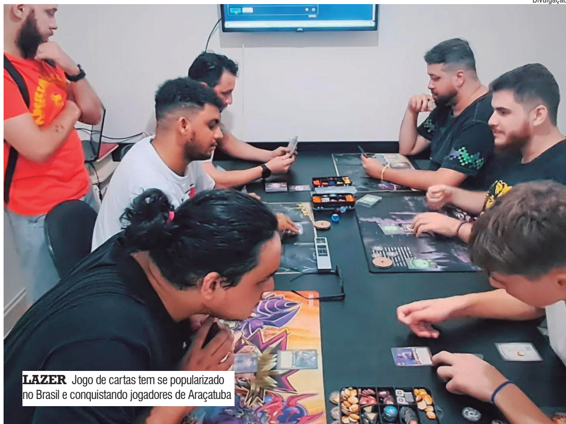
LAZER Jogo de cartas tem se popularizado no Brasil e conquistando jogadores de Araçatuba