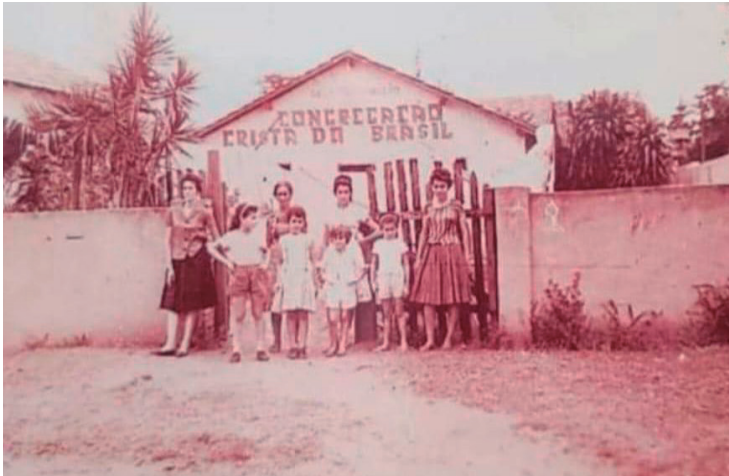
Primeira igreja da congregação cristã do Brasil em Araçatuba