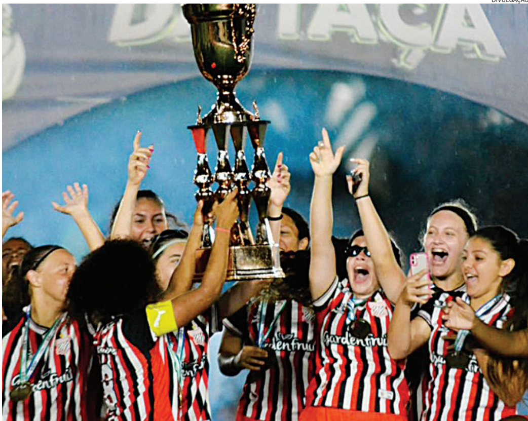
As atletas só ficaram sabendo que não foram inscritas na competição por meio das redes sociais

As atletas só ficaram sabendo que não foram inscritas à competição por meio das redes sociais da Federação Paulista de Futebol (FPF), quando a entidade publicou a divisão dos grupos e o Paulista não constava em nenhuma chave. “A gente foi pego de surpresa, a comissão técnica e as atletas. Durante um período eu fiquei um pouco afastada, por conta de uma cirurgia na perna, e as meninas viram pelo Instagram que tinham saído os grupos do Campeonato Paulista, e foi isso. Nós, como comissão técnica, e as atletas, está-