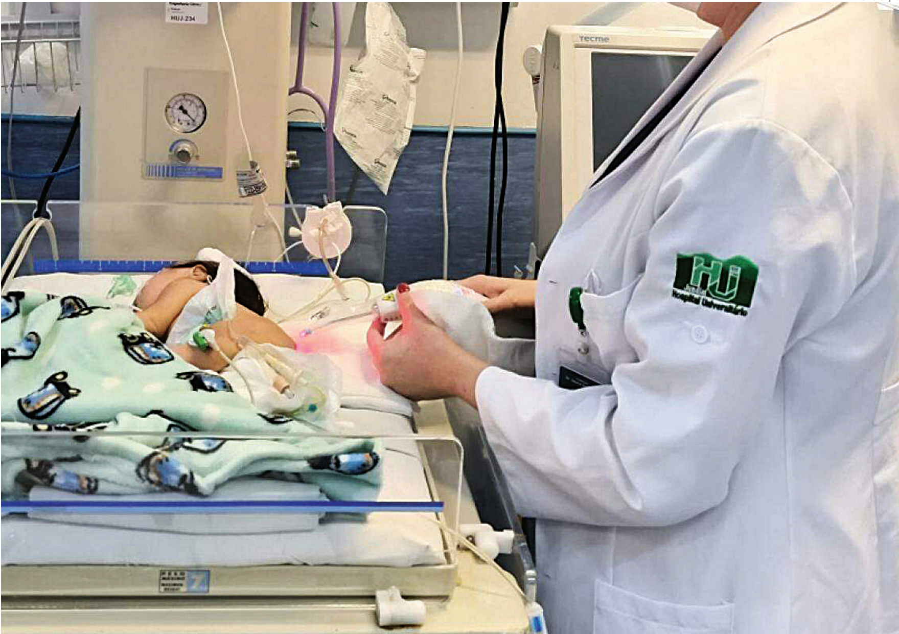
A laserterapia é usada para tratamento de assaduras em bebês e também para traumas mamilares em mães que amamentam