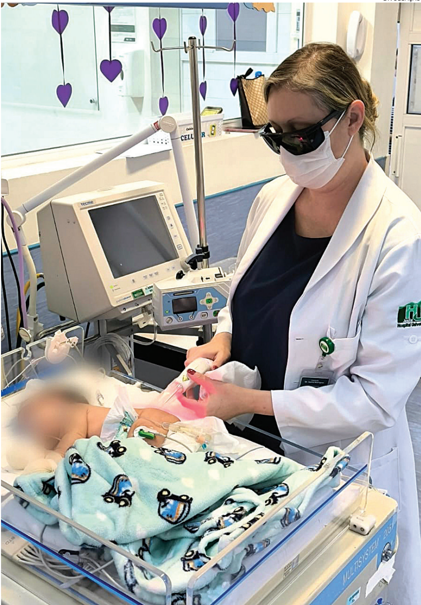
A laserterapia reduz a dor, acelera a cicatrização e diminui inflamação

O Hospital Universitário de Jundiaí (HU), ligado à Faculdade de Medicina de Jundiaí (FMJ), tem inovado no cuidado com a saúde materno-infantil ao utilizar a laserterapia no tratamento de assaduras em recém-nascidos e traumas mamilares em mulheres que estão amamentando. Cidades 4