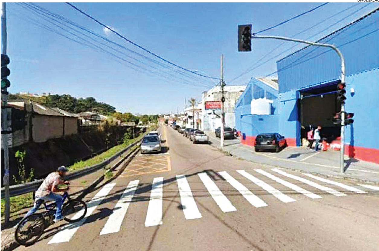
Obra viária na Ponte São João vai desafogar o trânsito sentido Centro

Em Jundiaí, quatro processos de desapropriações para projetos viários estão em andamento em 2025 com estimativa de custar R$ 15 milhões aos cofres públicos. Ao todo, são 58 propriedades só na avenida Luiz Zorzetti, principal ligação entre a Ponte São João e Colônia. As obras neste