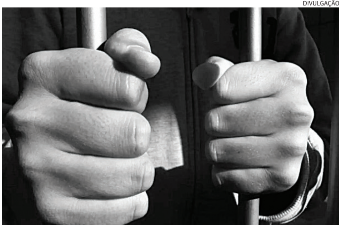
O assassino foi levado para o sistema prisional

Um homem de 59 anos, condenado a mais de 5 anos de prisão por matar seu genro em Jundiaí, em 2016, foi capturado em Mauá, nesta segunda-feira (11). A captura foi feita graças a um trabalho conjunto entre o setor de inteligência do 11º Batalhão da PM de Jundiaí, a Polícia Civil do 2º DP de Jundiaí e o 30º BPM/M de Mauá. O assassino, que durante esse tempo morou em