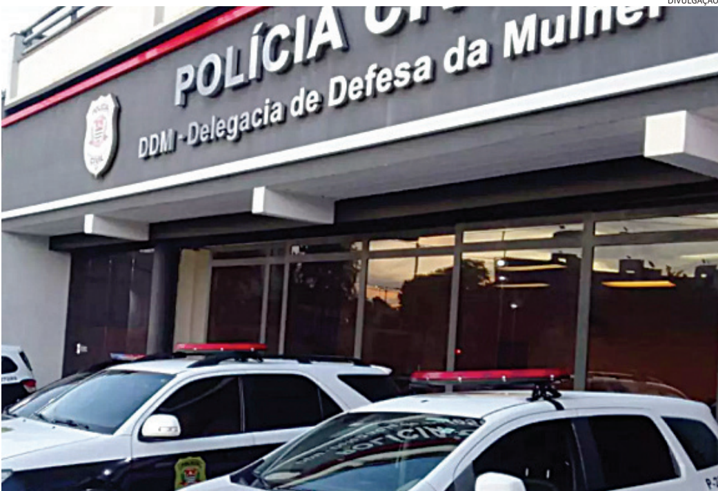
Ele foi levado para a DDM e depois para o Centro de Triagem