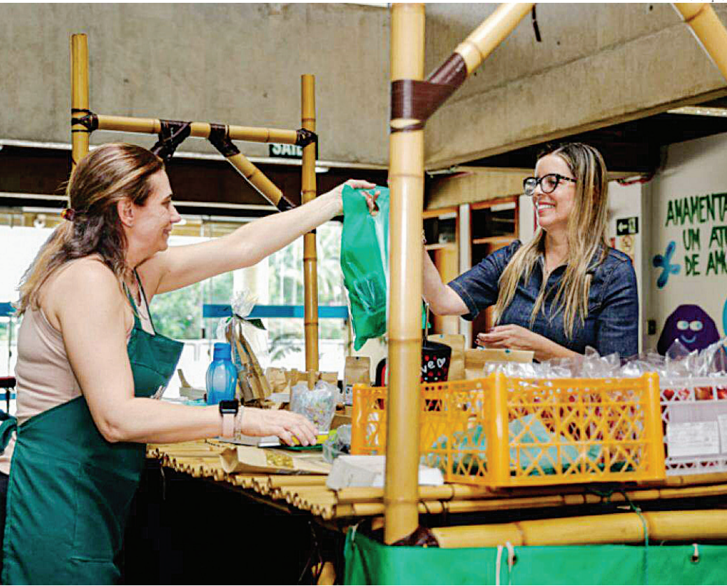
Para esta edição, foram confirmadas as participações de doze barracas