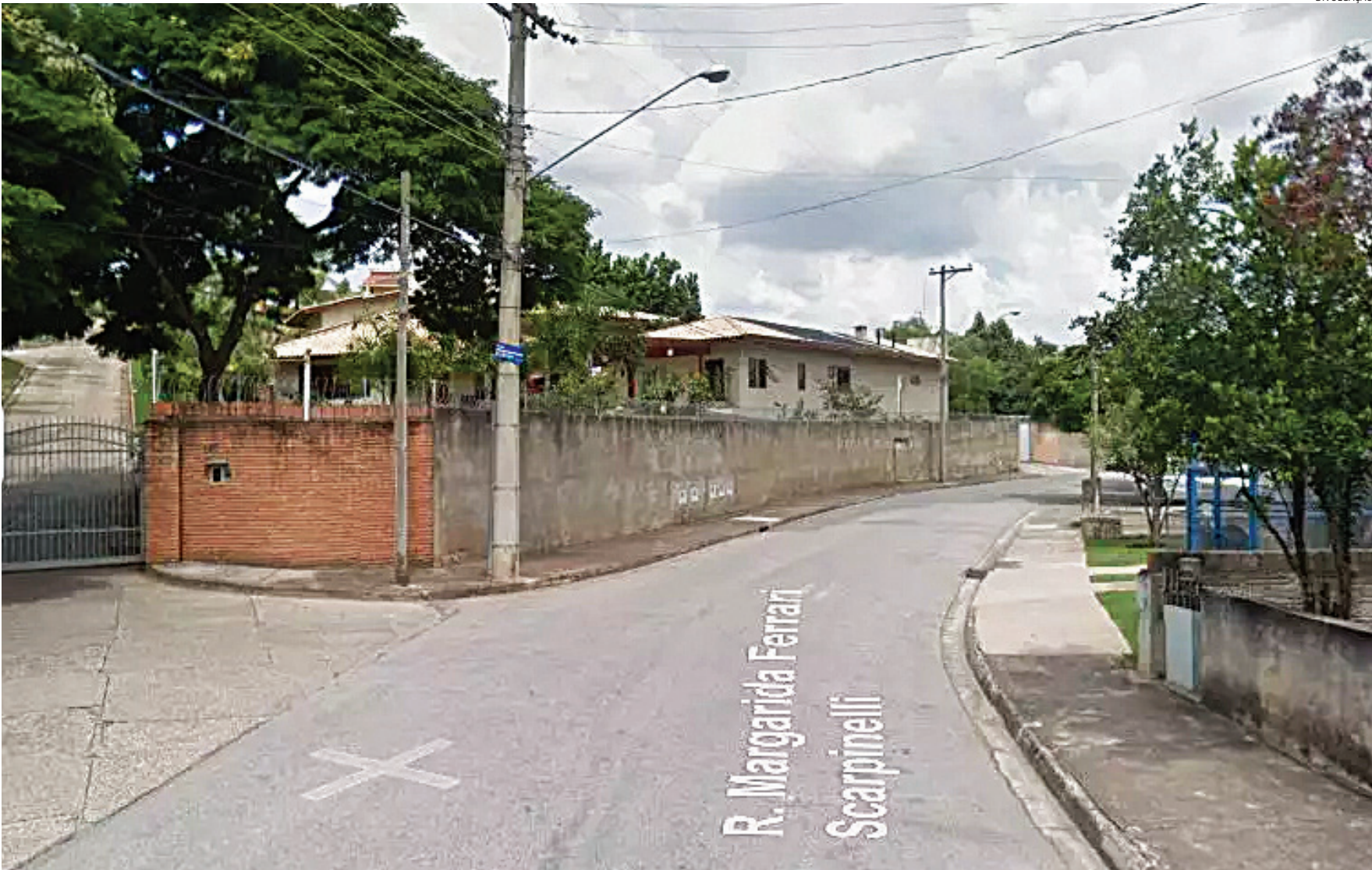
A rua Margarida Scarpinelli, no Medeiros, também está na lista de desapropriações

A obra deve desafogar o fluxo de trânsito no local que, segundo o Volume Di-