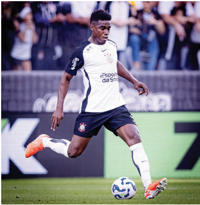
O time deve cerca de R$ 33 milhões ao time mexicano

O Santos Laguna acionou a Fifa em maio de 2024, após o fim do prazo que o Corinthians tinha para quitar a segunda parcela. Além dos 4,5 milhões de dólares restantes do negócio origi-