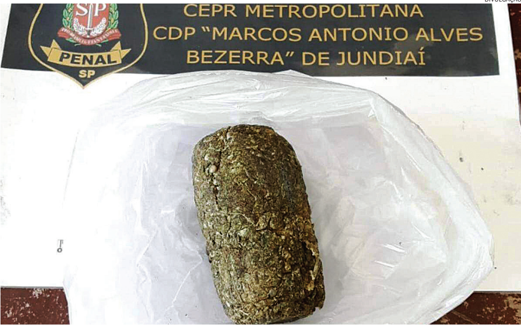
No embrulho foi encontrada porções com cerca de 116 gramas de substância análoga à maconha