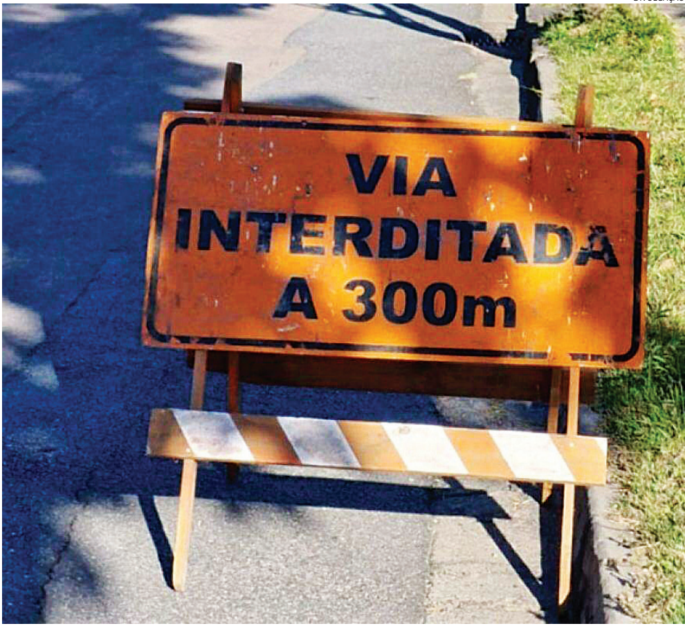
A interdição será total no trecho entre as ruas Água Branca e Três Corações

A UGMT orienta os condutores a redobrem a atenção, respeitem a sinalização e, sempre que possível, buscarem rotas alternativas para evitar congestionamentos.