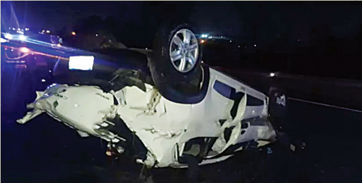
Equipes de resgate foram acionadas, mas ele não resistiu e morreu

nutos antes, mas ele ignorou o aviso. Um Golf acabou batendo no carro parado, que se deslocou e atingiu o estudante. Polícia 6