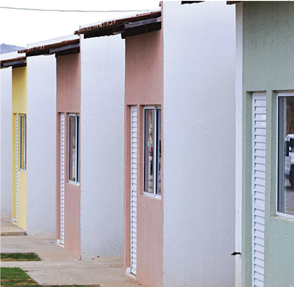
Serão 25 unidades habitacionais em cada município da região contemplado, totalizando 50

Em todo o país, mais de 2,7 mil municípios foram selecionados, resultando em mais de 60 mil unidades habitacionais. O investimento total previsto é de R$ 4,2 bilhões. Essa seleção beneficia famílias com renda mensal bruta de até R$ 2.850 e que moram em áreas urbanas de municípios com no máximo 50 mil habitantes.