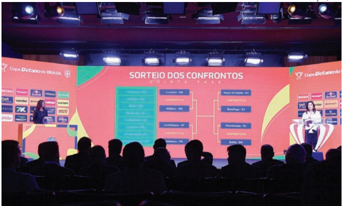
Tricampeão do torneio, o Corinthians encara o Athletico-PR

Quem passar do único confronto das quartas entre times da Série A e B do Campeonato Brasileiro encara o vencedor do clássico mineiro entre Cruzeiro, maior cam-