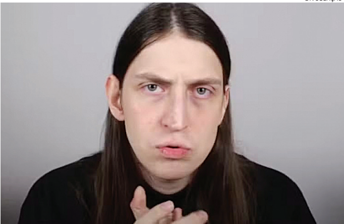
Somente após vídeo de Felca, deputados se movimentaram para projetos

Em resposta à viralização do vídeo do influenciador Felca, os líderes partidários da Câmara dos Deputados decidiram instalar, na próxima quarta-feira (20), uma comissão geral para discutir a sexualização de crianças e adolescentes nas redes sociais — com isso, as demais propostas ficaram em segundo plano. A ideia é que, em 30 dias, a comissão ouça especialistas e discuta projetos de proteção aos jovens no ambiente online — há cerca de 60 textos protocolados na Câmara nesse sentido. O considerado mais avançado, porém, é o PL 2628/2022, de autoria do senador Alessandro Vieira (MDB-SE), que já foi aprovado pelo Senado e já estava na pauta da Câmara na semana passada, para votação de requerimento de urgência. O consenso para vota-