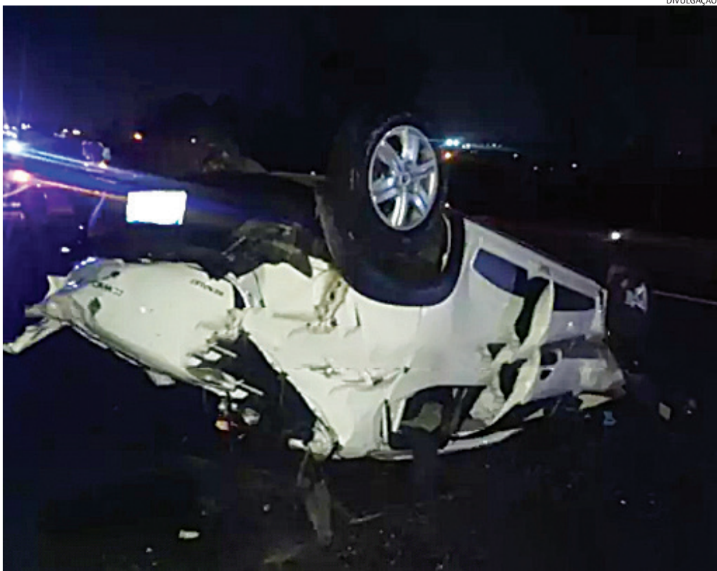
Por motivos que ainda serão apurados, o veículo colidiu na traseira de uma carreta

Um estudante de enfermagem, de 24 anos, morador do Jardim Tulipas, morreu atropelado pelo próprio carro no final da noite desta segunda-feira (11), na rodovia Anhanguera, em Jundiaí. De acordo com uma das testemunhas, a vítima foi avisada sobre o perigo de permanecer na pista após o acidente sofrido minutos antes, mas ele ignorou o aviso. A vítima transitava pela rodovia em seu veículo Kwid, retornando de Campinas - onde estuda enfermagem -, quando bateu na lateral de uma carreta e capotou. Após isso ele saiu do carro - que ficou imobilizado na pista -, e foi conversar com o motorista da carreta, que estava no acostamento.