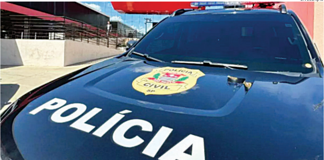
Pelo menos 15 pessoas foram presas durante a operação

nais contra ele, sendo que em um deles, foi concedida à ela uma medida protetiva de urgência com o afastamento do agressor. Ele, porém, retornou ao local, invadiu a casa, quebrou o celular dela para impedir que chamasse por ajuda, mas ela conseguiu avisar uma pessoa na rua. O filho foi conduzido à DDM, onde foram realizados os procedimentos de praxe e posteriormente transportado até o Centro de Triagem de Campo Limpo Paulista, onde permaneceu à disposição da justiça.