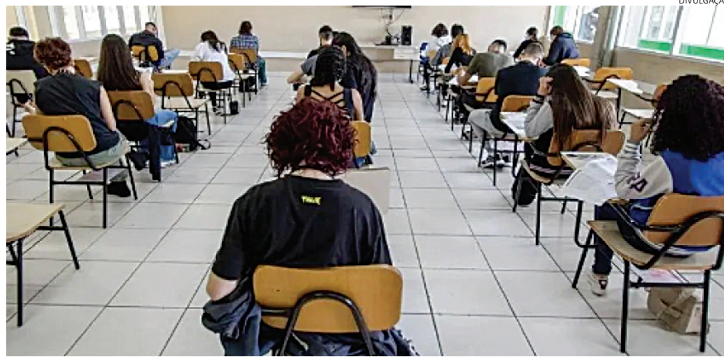
Procedimento instaurado pelo MPSP apura a oferta e o acesso ao ensino noturno na rede estadual de Jundiaí

A comunidade chegou a organizar um abaixo-assinado com mais de 2,5 mil assinaturas, mas a iniciativa não surtiu efeito. Na ocasião, a Secretaria da Educação do Estado justificou a medida, afirmando que a reorganização buscava otimizar a ocupação das salas de aula