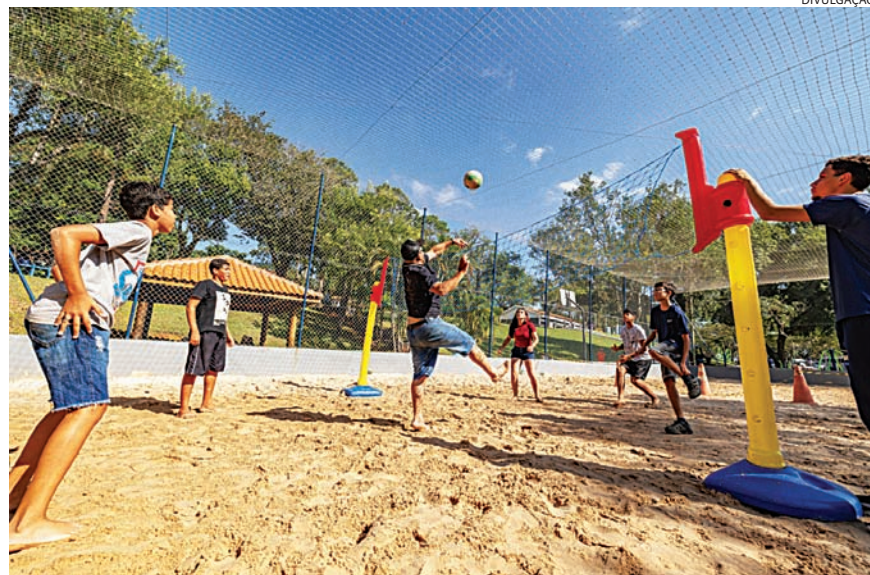
Os parques funcionam normalmente durante todo o período de Páscoa

O CAPS AD e o CAPS 3 permanecem abertos 24 horas, exclusivamente para acolhidos. As Unidades de Pronto Atendimento (PAs) funcionarão normalmente: a unidade da Ponte São João atende das 7h às 19h