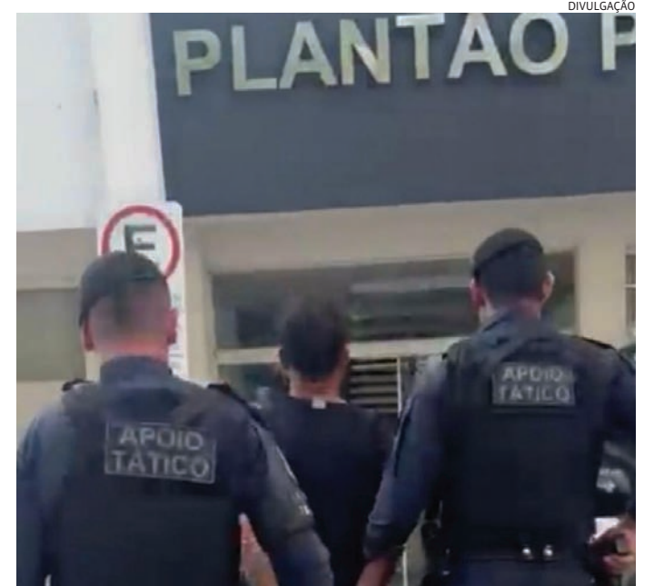
Ele foi conduzido ao DP, onde foi dado cumprimento ao mandado

Em consulta aos seus dados pessoais, os guardas descobriram um mandado de prisão em aberto. Ele foi conduzido ao Plantão Policial, onde foi dado cumprimento à ordem da Justiça.