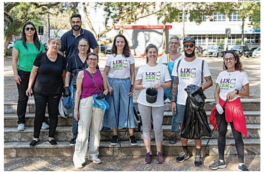
O Movimento Lixo Zero promove mutirões de limpeza e atividades de educação

tante área de preservação ambiental da região, além de oficinas de compostagem, incentivando práticas sustentáveis e a redução da geração de resíduos.