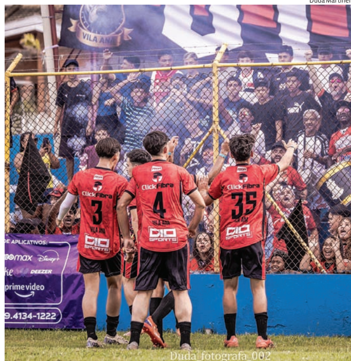
Decisões feminina e masculina movimentam o Dal Santo

As partidas terão transmissão ao vivo pela TV TEM e devem atrair grande público ao Dal Santo. Além