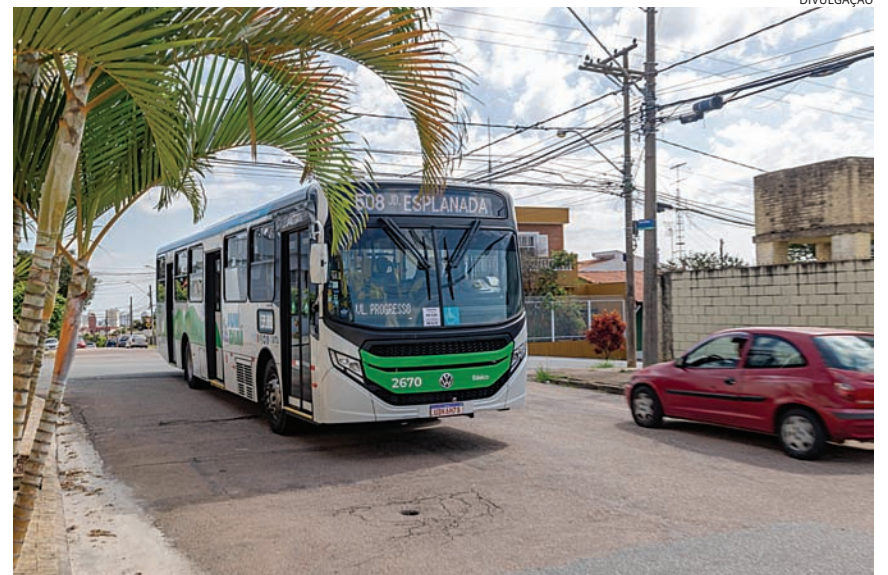
No feriado de ônibus circulam com horários de domingo

(portões fecham às 18h), assim como o PA do Retiro. Já as unidades da Hortolândia, PA Central e UPA Vetor Oeste funcionam 24 horas. O Hospital São Vicente de Paulo e o Hospital Universitário (HU) seguem com atendimento normal durante o feriado.