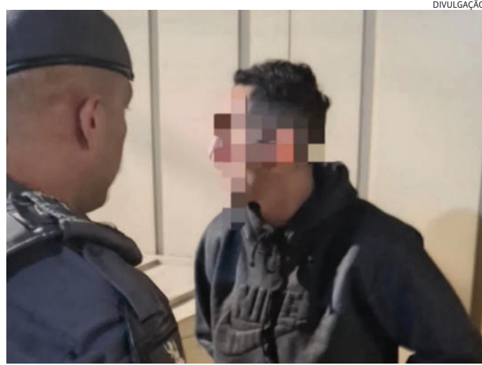
A pena é de detenção de 6 meses a 2 anos ou multa

Em consulta aos seus dados pessoais, constou mandado de prisão em aberto pelo artigo 331 do CP, que consiste em “desacatar funcionário público no exercício da função ou em razão dela”. A pena é de detenção