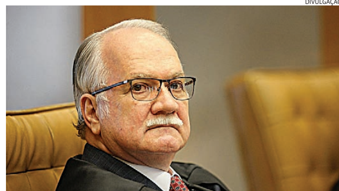
Presidente do STF, Edson Fachin, alerta magistratura brasileira

O congresso também é uma espécie de contraponto ao Fórum de Lisboa, o “Gilmarpalooza”. Segundo apurou a Folha de S.Paulo, o caso do Banco Master e o