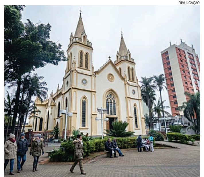
Segundo a previsão, o frio intenso deve chegar no domingo

Para o feriado de Corpus Christi, na quinta-feira (4), a previsão indica mínima de 13°C e máxima de 23°C. Na sexta-feira (5), os termômetros devem variar entre 12°C e 22°C. Já no sábado (6), a mínima prevista é de 10°C e a máxima de 22°C. No domingo (7), o frio se intensifica, com mínima de 9°C e