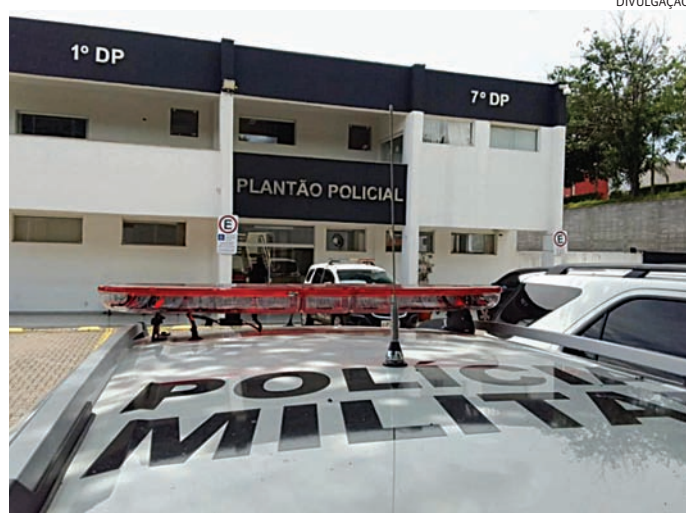
Ele recebeu voz de prisão e foi conduzido ao Plantão Policial

Em seguida, a enteada de 18 anos saiu da casa e contou aos policiais que o padrasto havia agredido a irmã e que ela tentou intervir para defendê-la. Nesse momento, segundo o relato, ele bateu