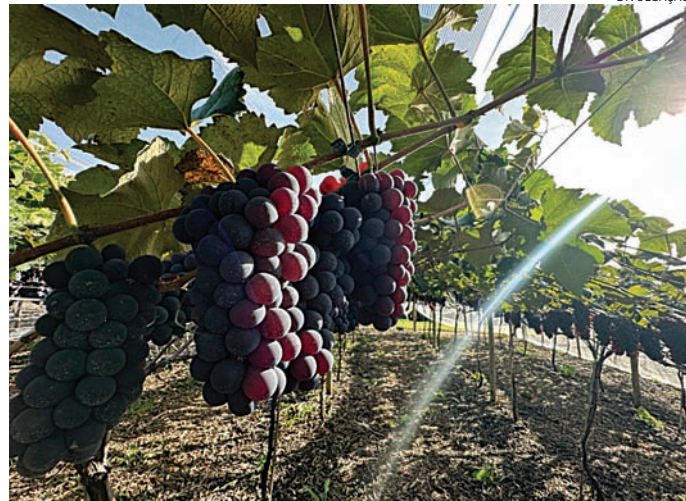
A expectativa é colher pelo menos 12 quilos de uva

O desempenho das videiras neste ciclo tem ficado acima do esperado. Na safra tradicional de verão, a produção média gira entre 10 e 12 quilos por planta. Neste ano, algumas áreas conduzidas para a sa-