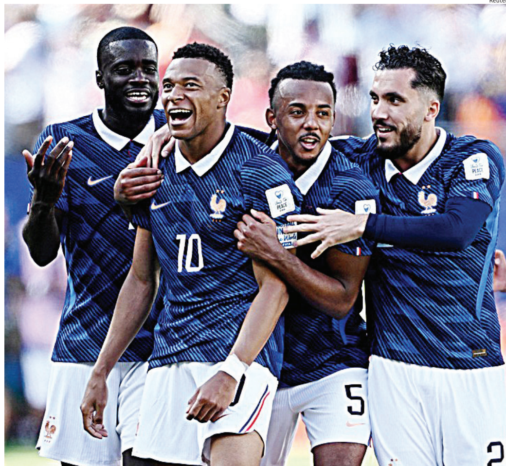
As duas partidas acontecem simultaneamente e definirão os classificados da chave para as oitavas de final

aberta, os confrontos ganham importância estratégica. Além da definição dos dois primeiros colocados, critérios como saldo de gols e gols marcados po-