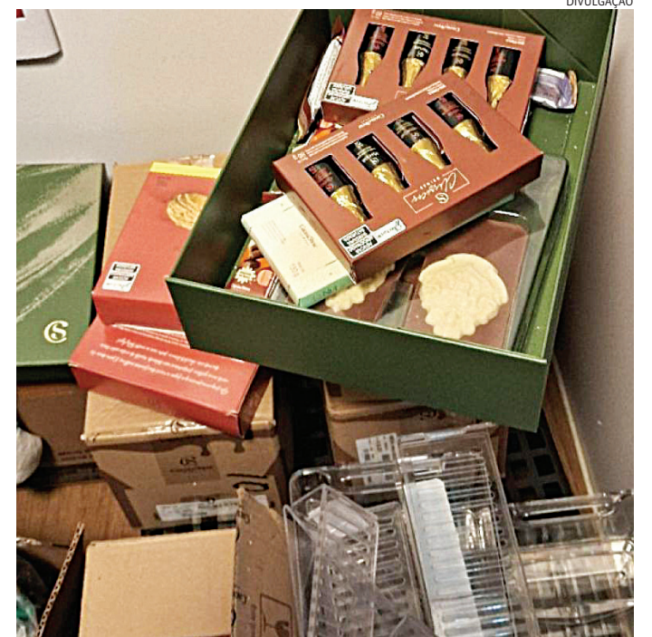
O suspeito tentava furtar chocolates da loja

Devido ao risco de fuga, foi necessário o uso de algemas. O indivíduo foi en-