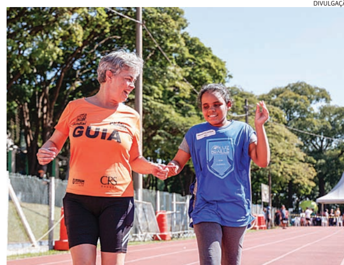
Evento gratuito será realizado no domingo no Mundo das Crianças

A expectativa é reunir alunos, familiares, professores, voluntários e moradores da cidade em uma celebração que destaca a inclusão, a convivência e a qualidade de vida proporcionadas pelo esporte adaptado.