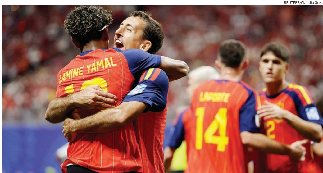
Espanha, Uruguai, Cabo Verde e Arábia Saudita jogam simultaneamente às 21h pela Copa

A expectativa é de uma rodada equilibrada e de muita tensão. Ao término das partidas, o Grupo G conhecerá seus classificados para a fase eliminatória e encerrará a participação das equipes que ficarem pelo caminho no Mundial.