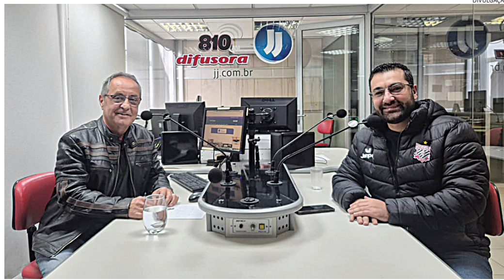
Faouaz: “a prioridade precisa ser Jundiaí e a nossa região”

O parlamentar argumentou que cidades e re-