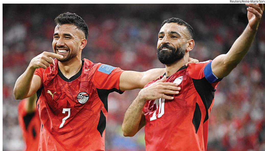
Bélgica, Irã, Egito e Nova Zelândia jogam à meia-noite pela Copa do Mundo