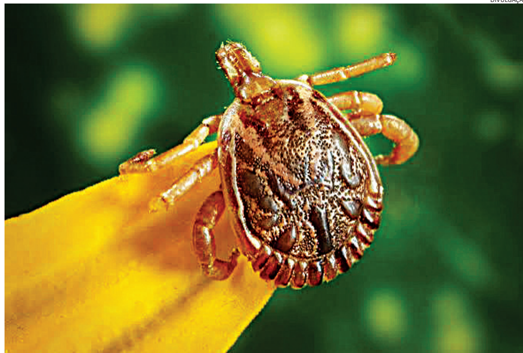
Em Várzea Paulista homem de 44 anos teve os sintomas e morreu

Em áreas próximas a rios, lagos, represas e outros corpos d'água, é comum a presença de capivaras e carrapatos, o que aumenta o risco de transmissão. Por isso, é fundamental adotar