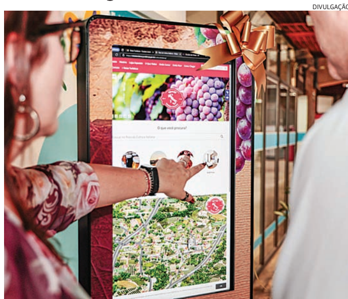
O case ‘Circuito das Frutas’ foi apresentado durante encontro regional