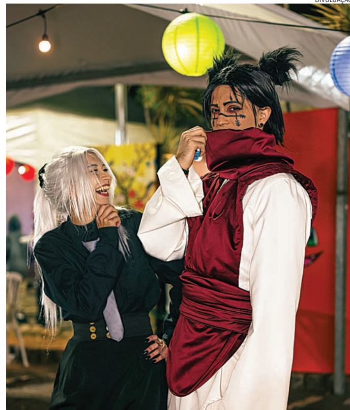
A gastronomia dos países será um dos diferenciais do evento

A gastronomia será um dos grandes destaques, com expositores especiais oferecendo pratos típicos que vão