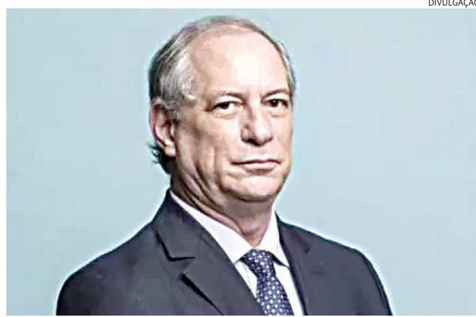
Ciro buscou apoio do PL para se candidatar a governador do CE

No anúncio em Fortaleza, estavam presentes os deputados estaduais Al-