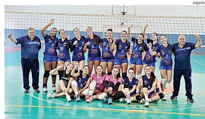
Equipe feminina de vôlei Sub-19 vence Americana por 3 sets a 0

O próximo compromisso do Time Jundiaí será no dia 12 de maio, às 17h, no ginásio do Bolão, diante de Piracicaba, pelos Jogos Abertos da Juventude. A equipe dedicou a vitória às mães e segue a preparação para a sequência da temporada estadual.