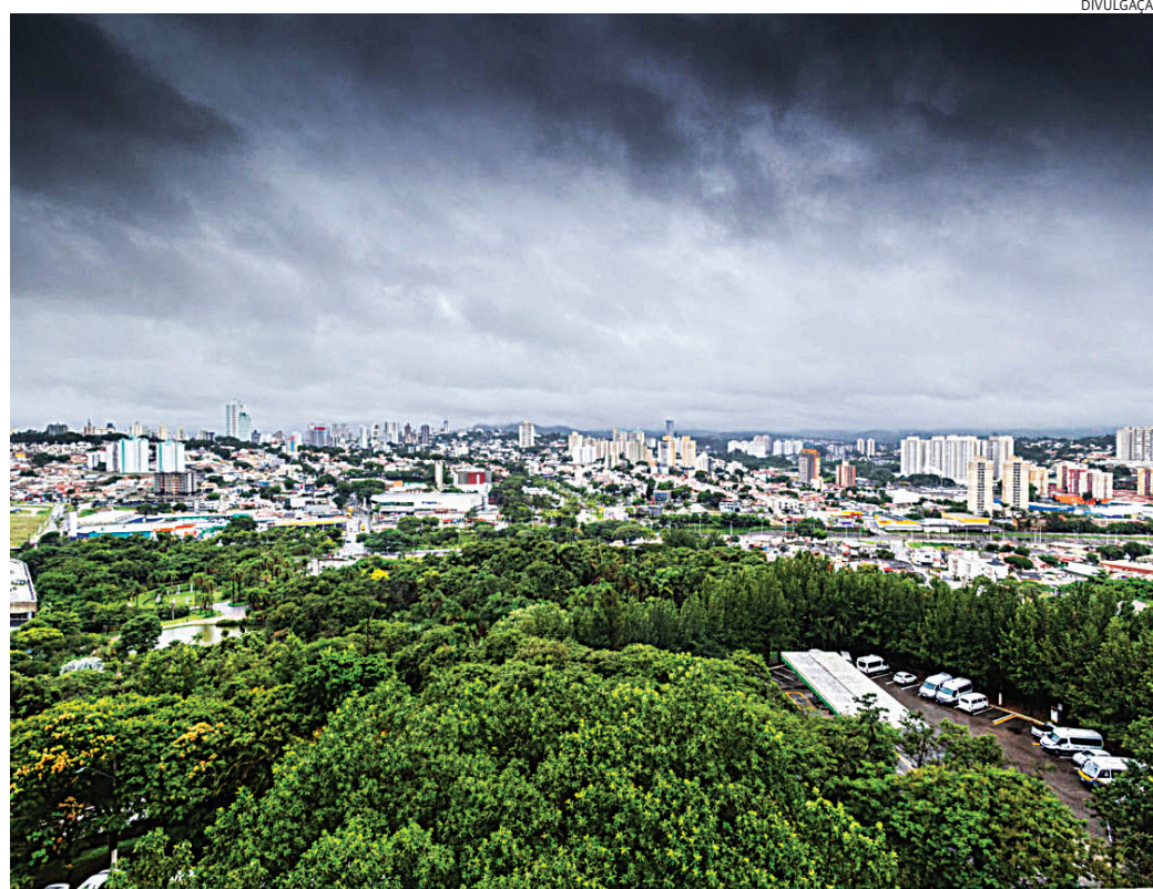
Segundo o Climatempo o domingo (17) deve ser de chuva

No estado de São Paulo, de acordo com o Climatempo, o ar polar começou a avançar no sábado pelas re-