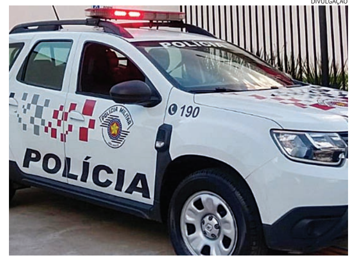
As partes foram conduzidas ao DP, onde foram ouvidas e liberadas

Ao chegar ao endereço, a equipe visualizou o marido em frente à residência, bastante alterado,