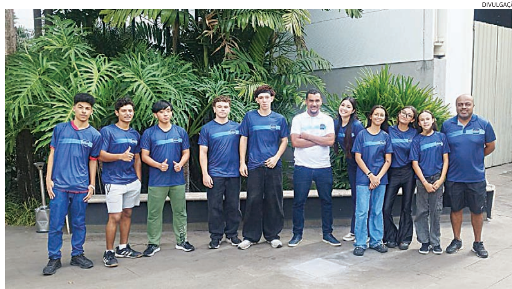
Equipe masculina vence todos os confrontos em Mogi Guaçu

Os resultados reforçam o desempenho do xadrez jundiaense nas categorias de base e mantêm a cidade entre os destaques da modalidade nas competições regionais do Estado de São Paulo.