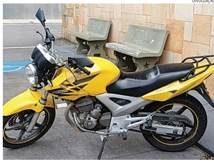
A moto foi apreendida para posterior devolução à vítima

Os guardas prosseguiram então com a averigua-