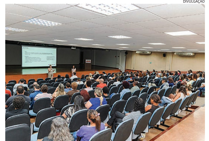
O documento é regulamentado pelo Ministério da Saúde

Com proposta intersectorial, a elaboração do Plano envolve diferentes áreas da administração municipal e da sociedade civil, reforçando a compreensão da saúde como um campo integrado às demais políticas públicas. A abertura oficial desse processo ocorreu na quinta-feira (23), no auditório da UNIP, reunindo vários representantes em diversas rodas de discussões temáticas.