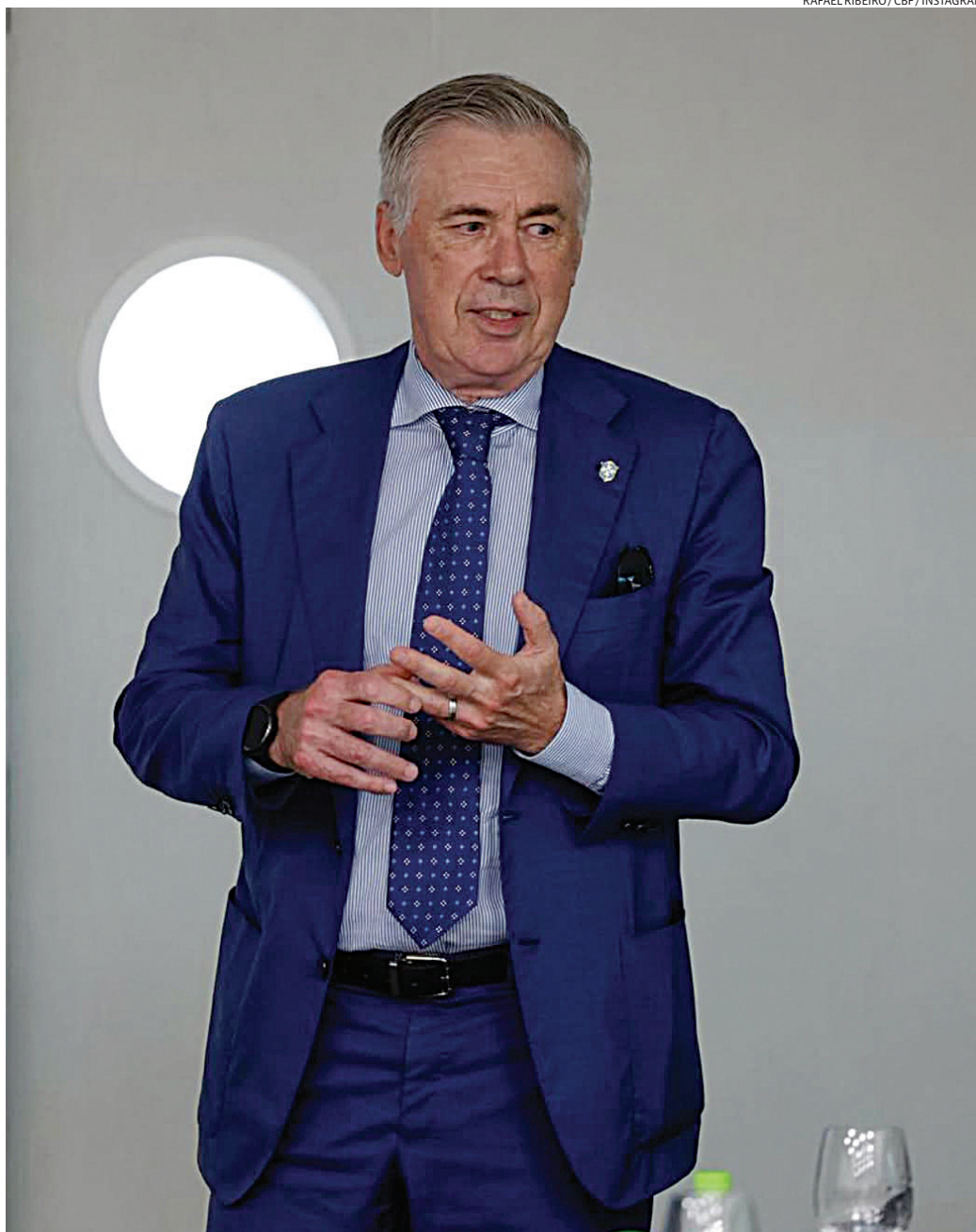
Por outro lado, o jovem Estêvão não deve aparecer na lista preliminar

A expectativa é de que a lista oficial da Seleção Brasileira seja divulgada nas próximas semanas. A preparação para a Copa inclui amistosos e treinamentos antes da apresentação definitiva do elenco escolhido para o torneio.