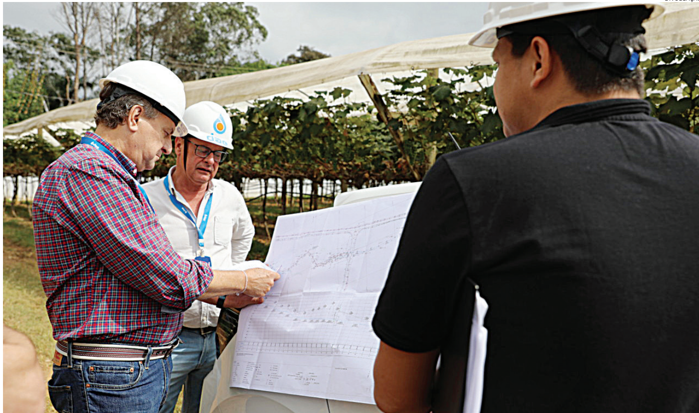
O investimento para a rede foi de quase R$ 17 milhões

Para garantir mais eficiência na execução, o projeto foi dividido em fases estratégicas. A primeira etapa, na região do Retentem, tem conclusão prevista para junho de 2026. Na sequência, a segunda fase, no bairro Poste, deve ser finalizada até dezembro