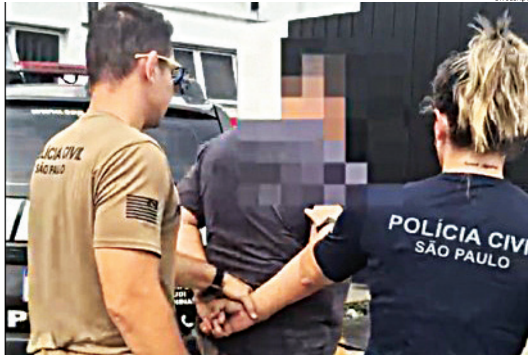
O homem deixou o Centro de Triagem e foi levado para o CDP

A ação foi resultado de um intenso trabalho de inteligência desenvolvido pelas equipes especializadas, que identificaram a possível existência de um indivíduo armazenando conteúdo relacionado à exploração se-