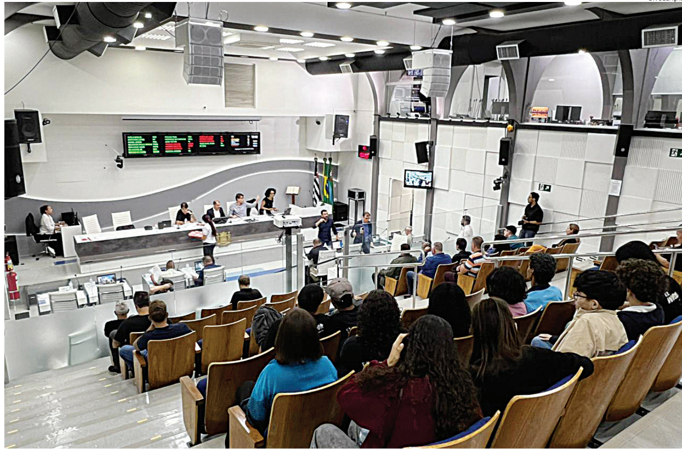
Sessão parlamentar ocorre nesta terça-feira (12), a partir das 16h, na Câmara

O projeto prevê prioridade em atendimentos administrativos municipais ligados à saúde e assistência social, além da possibi-