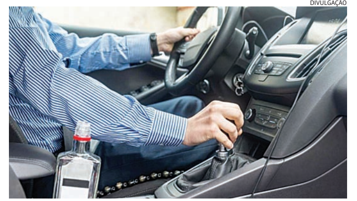
O motorista se recusou a fazer o teste do bafômetro

Ainda de acordo com a ocorrência, exames médicos descartaram problemas neurológicos. Diante dos sinais observados pelos policiais - incluindo dificuldade de locomoção, recusa ao ba-