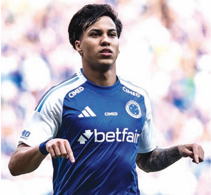
O centroavante atrai a atenção de diversos clubes da Europa

Apesar do interesse, é provável que Kaio Jorge permaneça no Cruzeiro. A exceção seria uma proposta extremamente vantajosa