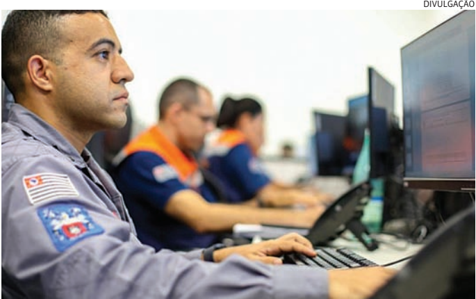
O Gabinete de Crise já foi acionado devido à previsão de ventos fortes

Em caso de emergência, acione imediatamente a Defesa Civil (199) ou o Corpo de Bombeiros (193); Acompanhe atualizações pelos canais oficiais e cadastre seu celular para receber alertas enviando o CEP por SMS para 40199.