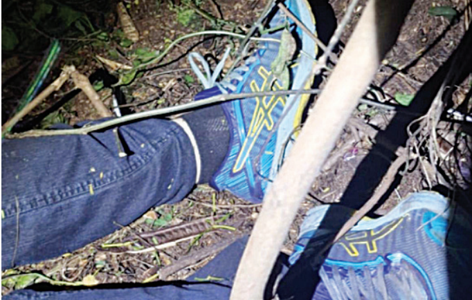
O corpo do motoboy foi encontrado em uma área de mata

vil, que deram início às investigações sobre o caso; após isso o corpo foi encaminhado ao Instituto Médico Legal (IML) de Jundiaí, para exames ne-