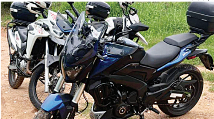
A moto foi recuperada pelos PMs do RPM

acionadas para patrulhamento na região, com objetivo de prender o ladrão, mas ele não foi encontrado.