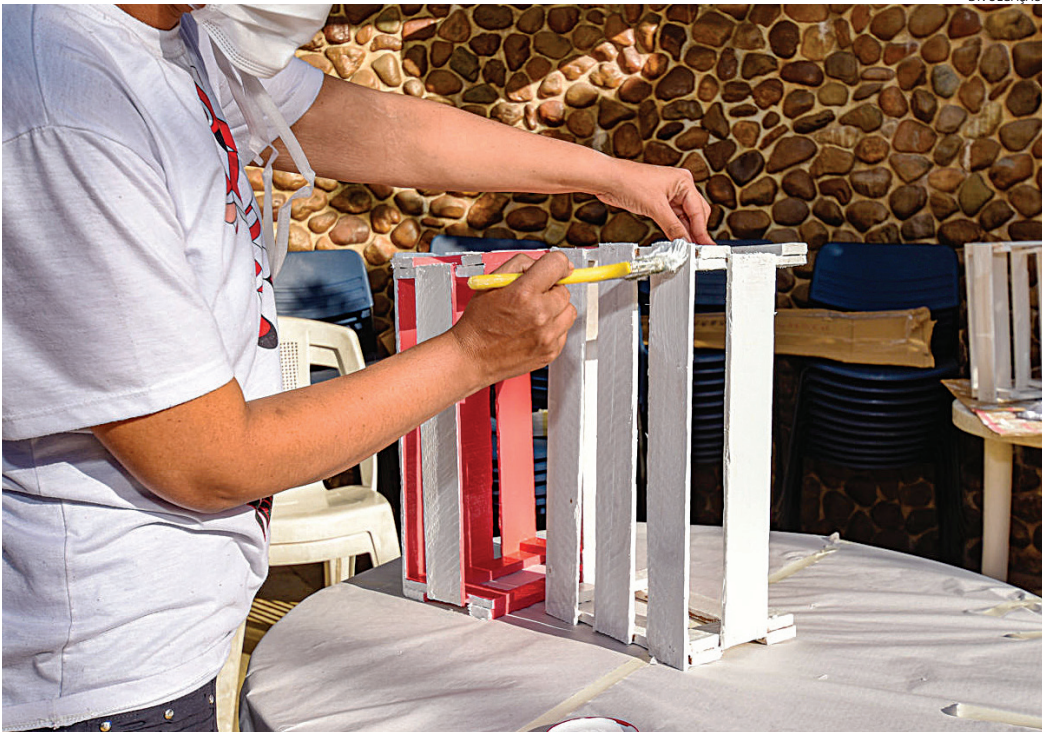
Atualmente 880 adultos frequentam a sede do Caps para serviços médicos e terapêuticos

O trabalho desenvolvido busca a melhoria da qualidade de vida e a reinserção social dos usuários, com abordagens que vão além do tratamento clínico tradicional, além de escuta acolhedora, Práticas Integrativas e Complementares em Saúde, como auriculote-