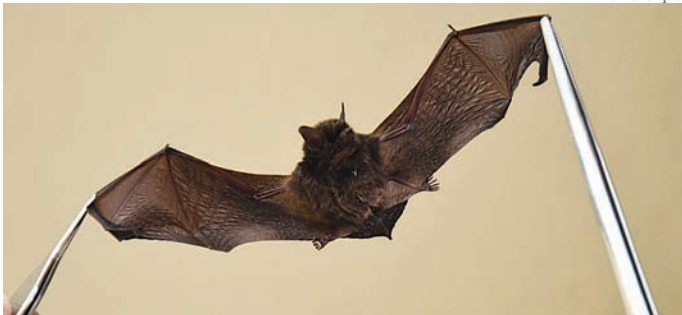
Em Jundiaí foram confirmados cinco casos positivos em morcegos

Nos municípios de Louveira e Várzea Paulista não foram registrados casos da doença em 2024 e 2025. As prefeituras mantêm ações contínuas de vacinação antirrábica como principal forma de prevenção. Em Louveira, a imunização é oferecida mediante agendamento no Serviço de Controle de Zoonoses. Já em Várzea Paulista, a vacinação está disponível no Centro de Bem-Estar Ani-