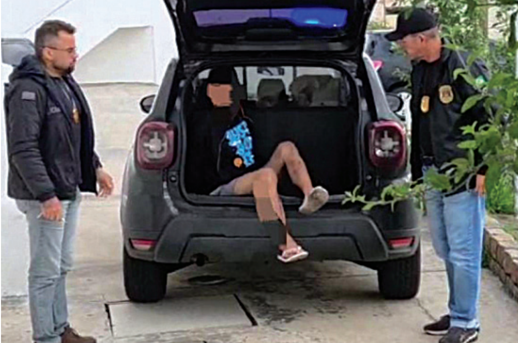
Um homem suspeito de matar o motoboy foi preso pela DIG

A Polícia Militar foi acionada por populares, que encontraram o corpo no matagal, na noite de quarta-feira. No local, os PMs encontraram uma pedra, com manchas de san-