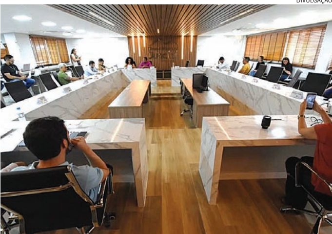
Trabalho segue em andamento com novas ações e reuniões semanais

O governador de São Paulo, Tarcísio de Freitas, exonerou Guilherme Derrite da Secretaria de Segurança Pública do estado. Derrite, que também é deputado federal, volta à Câmara onde será o relator do projeto de lei que busca classificar facções criminosas como células terroristas. No dia 29 de outubro, ainda durante a repercussão da operação policial no Rio de Janeiro, Derrite anunciou que se licenciaria do cargo no governo para ser o relator do PL que modifica a Lei Antiterrorismo. A intenção é incluir milícias e facções criminosas como organizações terroristas.