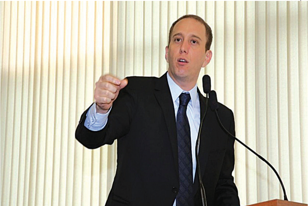
Manga foi afastado do cargo de prefeito do Sorocaba, após decisão da Justiça

Os investigados poderão responder por corrupção ativa e passiva e outros crimes. Dentre eles estão: peculato, fraude em licitação, lavagem de dinheiro, contratação direta ilegal e organização criminosa.