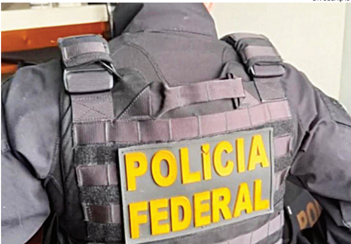
Os agentes cumpriram mandado de busca e apreensão

Embora o termo “pornografia” ainda seja utilizado em nossa legislação (Estatuto da Criança e do Adolescente) para definir “qualquer situação que envolva criança ou adolescente em atividades sexuais explícitas, reais ou simuladas, ou exibição dos órgãos genitais de uma criança ou adolescente para fins primordialmente sexuais”, a comuni-