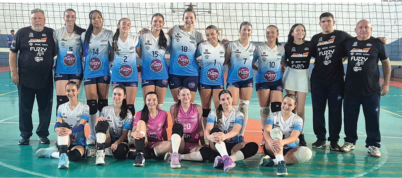
Com as vitórias, Jundiaí sai na frente nas duas categorias

Com as vitórias, Jundiaí sai na frente nas duas categorias e busca confirmar a vaga entre os quatro melhores do Estado.