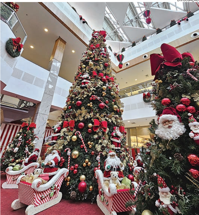
A caravana do Papai Noel chega hoje para inaugurar a decoração natalina

A criançada vai se divertir com atrações gratuitas, como o trenzinho puxado por renas, a piscina de bo-