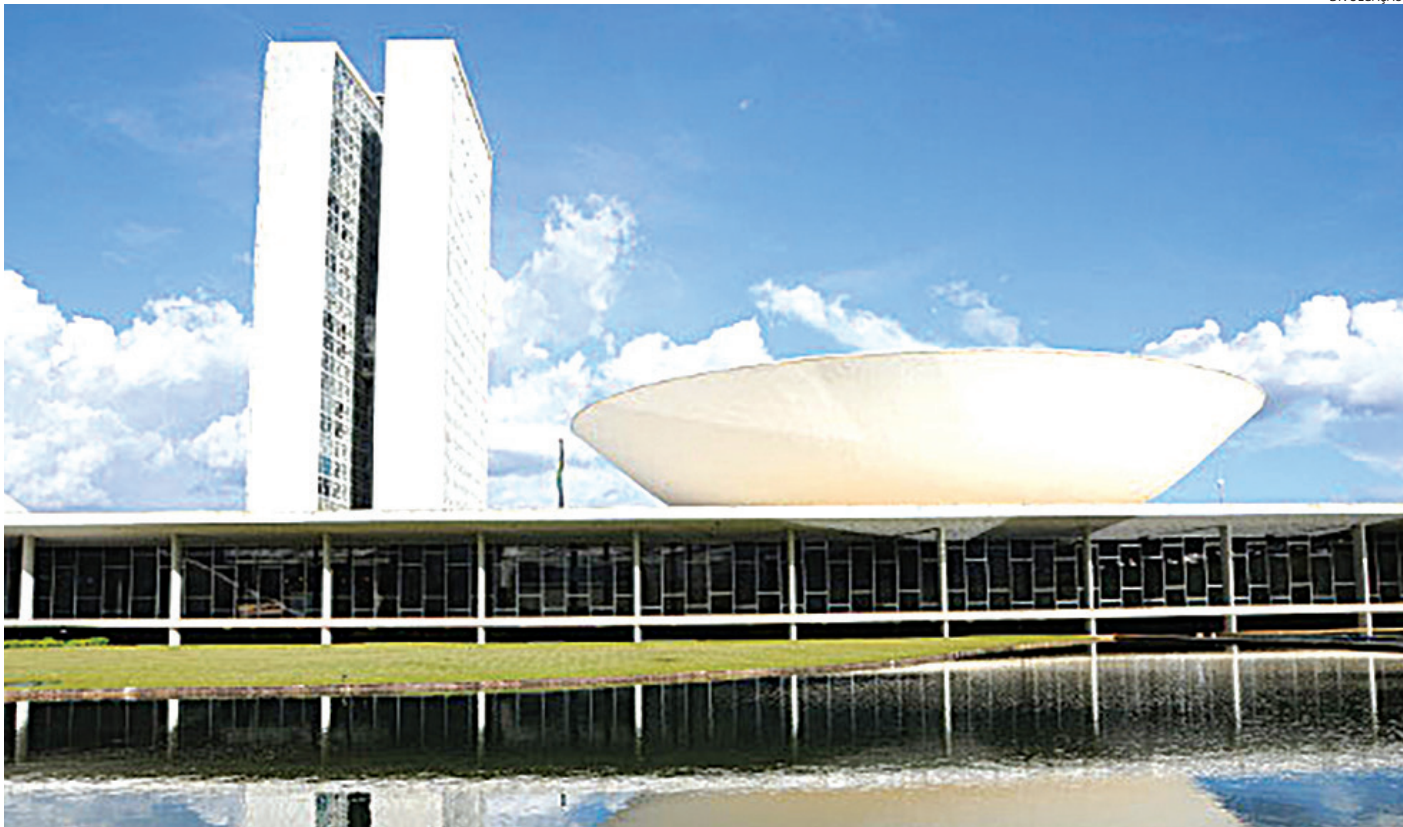
Proposta do voto distrital misto tramita na Câmara dos Deputados e pode ser votada neste ano

Para o doutor em Filosofia do Direito Walter Celeste, a proposta pode baratear as campanhas, mas também pode produzir efeitos indesejados. “A ideia do voto distrital