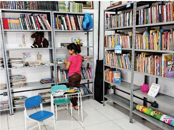
O evento conta com a participação de mais de 40 escritores

A programação contará com encontros com autores e editoras, venda de livros, oficinas criativas, bate-papos temáticos, além de apresentações musicais e teatrais, contação de histórias, sarau de poesias, exposição de arte e antiguidades, artesanato, comidinhas e até flash tattoo. Na ocasião também será apresentado o novo espaço do brechó do Grupo Sol da Cidadania,