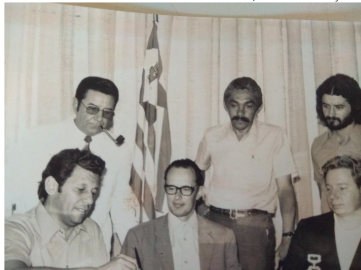
Equipe de gestão do então Prefeito Waldir Felizola De Moraes