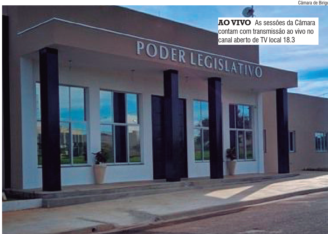
AO VIVO As sessões da Câmara contam com transmissão ao vivo no canal aberto de TV local 18.3

Projeto de Lei Ordinária nº 71 de 2024 – Com autoria do Poder Executivo, o projeto autoriza o município