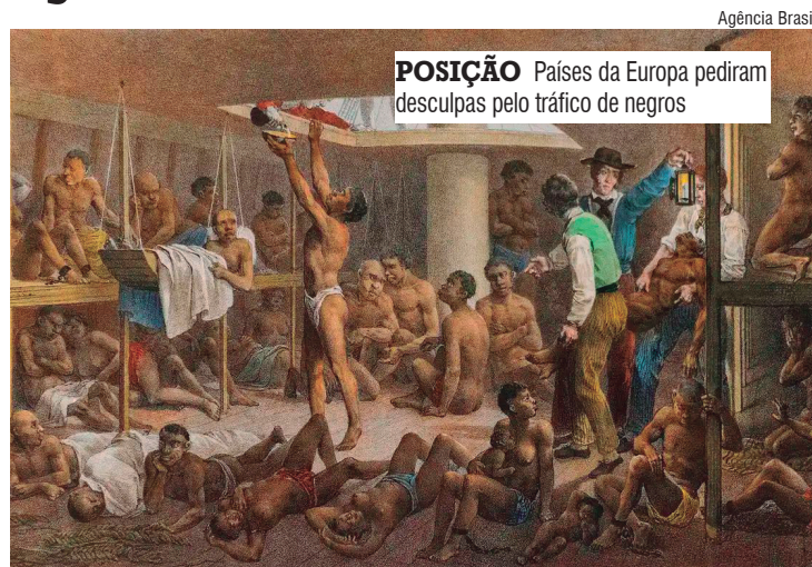
POSIÇÃO Países da Europa pediram desculpas pelo tráfico de negros

Um dos atos mais recentes foi de Portugal. No fim de abril deste ano, o presidente Marcelo Rebelo