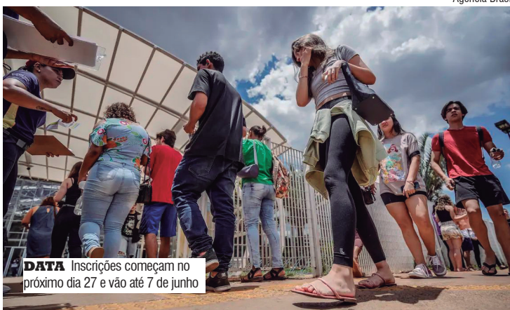
DATA Inscrições começam no próximo dia 27 e vão até 7 de junho

O resultado inicial do pedido de atendimento especializado será publicado em 17 de junho, quando