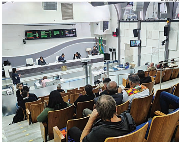
Vereadores vão apreciar 11 itens em 58ª sessão ordinária a partir das 16h

Entre os objetivos do programa estão a promoção da segurança e dignidade das mulheres, o fortalecimento de mecanismos de denúncia e acolhimento, a realização de campanhas educativas e a integração entre políticas de mobilidade urbana, segurança pública e zeladoria urbana. O texto também prevê ações como melhoria da iluminação pública, monitoramento de áreas vulneráveis, capacitação de profissionais do sistema e incentivo ao uso de tecnologias como canais digitais de denúncia