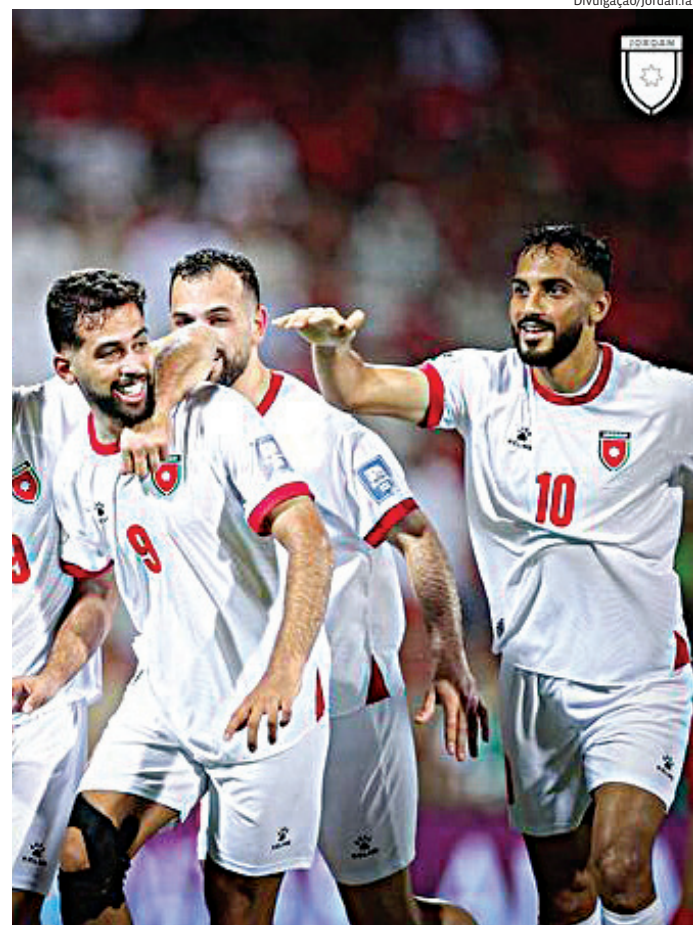
Seleções ajustam equipes antes da estreia no Mundial 2026

Com a Copa prestes a começar para ambas as seleções, o amistoso ganha importância estratégica. O resultado é secundário, mas o desempenho dentro de campo pode influenciar decisões da comissão técni-