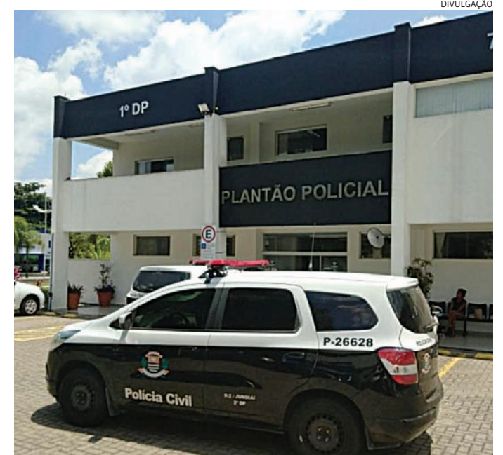
Ambos prestaram depoimento e foram indiciados

A vítima conseguiu recuperar a chave e deixou o local. Posteriormente, retornou acompanhada do