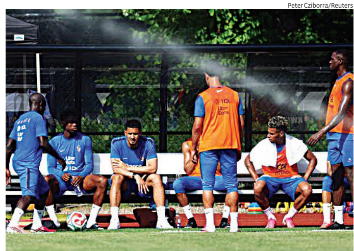
Duelo reedita confronto histórico da Copa de 2002 entre as equipes

A partida está marcada para as 16h (horário de Brasília) e deve atrair grande atenção dos torcedores. Para franceses e senegaleses, uma vitória na estreia pode representar um passo importante rumo à classificação.