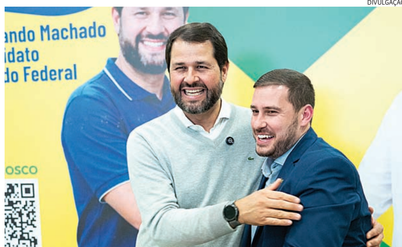
Pré-candidatas participam de encontro com lideranças em Itupeva nesta terça-feira