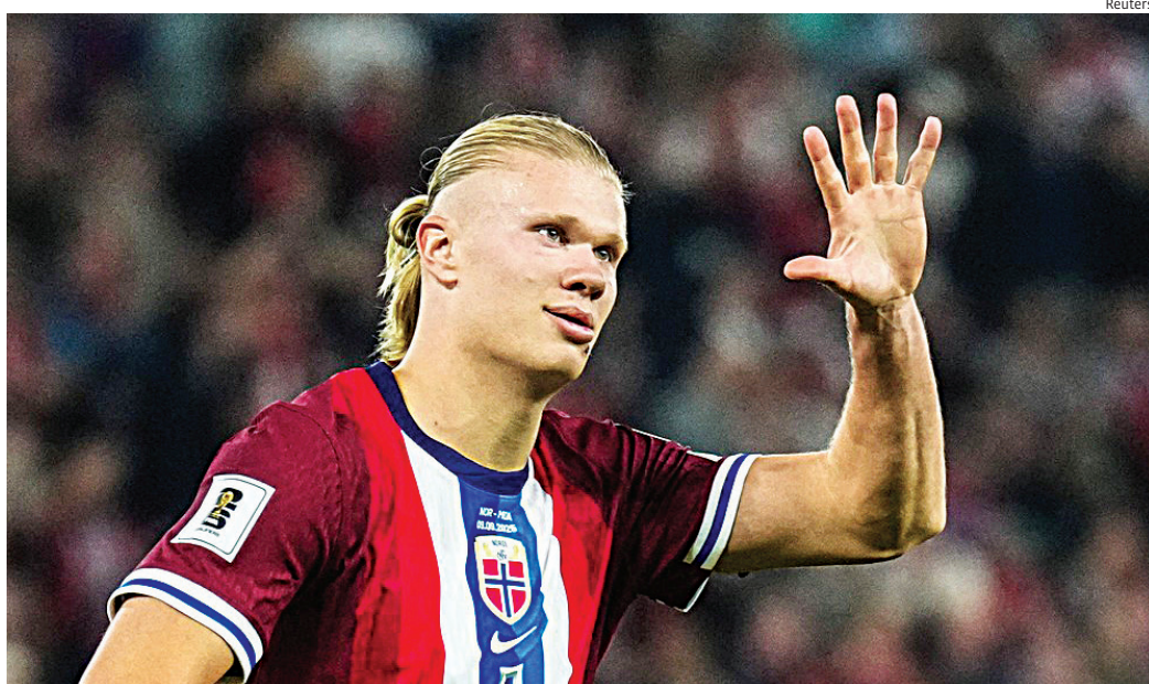
Seleções buscam primeiros pontos na Copa de 2026

fronto também será uma chance para atletas menos utilizados mostrarem serviço na reta final da preparação.