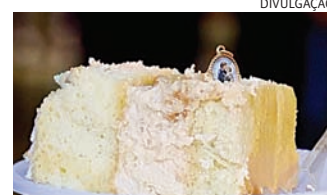
O bolo foi reconhecido por sua relevância histórica e cultural

Com o reconhecimento, o município reforça a preservação de manifestações culturais ligadas às tradi-