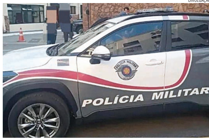
O suspeito foi preso e levado para a Central de Flagrante de Jundiá

A PM informou que a mulher disse ter sido agredida pelo próprio pai. Ao questionar familiares, os policiais foram informados que o homem estava em uma chope-