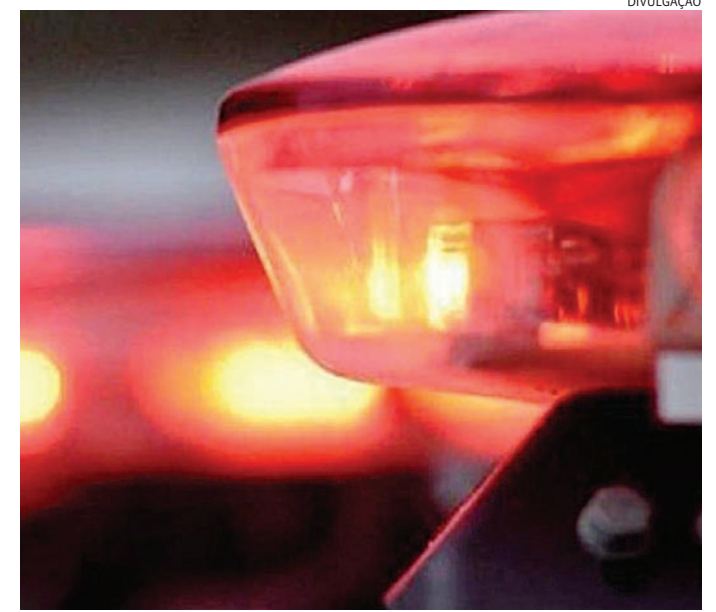
A mulher foi conduzida à Delegacia do Distrito do Jacaré

Nas proximidades do local onde a suspeita estava, os guardas também localizaram uma sacola contendo dezenas de porções de cocaína já prontas para a comercialização.