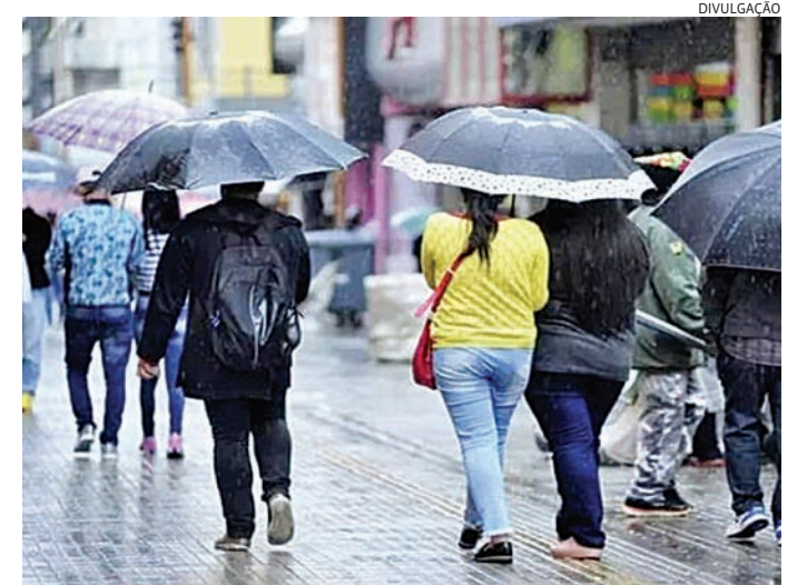
Com inverno oficialmente no dia 21, as temperaturas já tendem a cair

metros entre 10°C e 24°C, também sem chuva. Já na sexta (19), dia do segundo jogo da seleção brasileira na Copa do Mundo, o céu ficará encoberto, mas não deve chover; temperaturas de 11°C a 24°C.