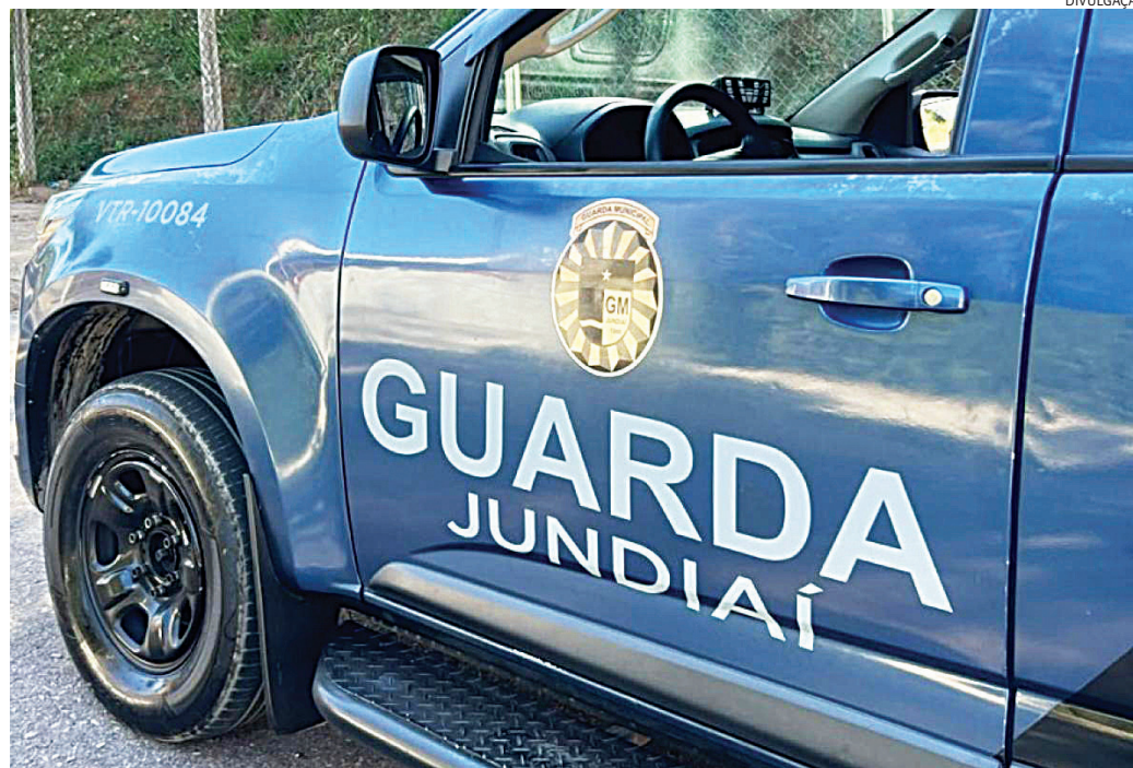
Ele foi conduzido ao DP, onde ficou preso por importunação sexual