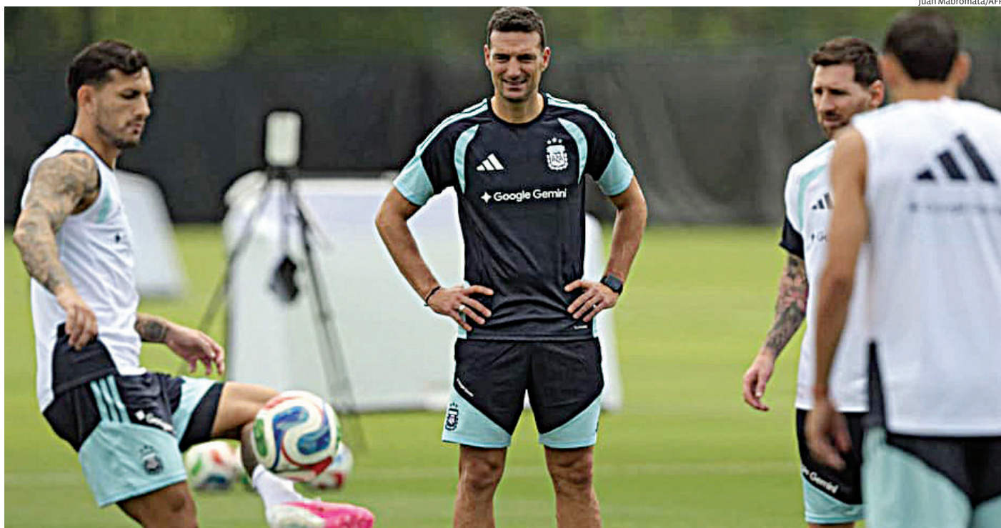
Atual campeã mundial, a equipe argentina mantém boa parte da base que conquistou o troféu em 2022

A partida está marcada para as 22h (de Brasília) e abre a disputa do Grupo J. Um resultado positivo pode ser decisivo para encaminhar a classificação às oitavas de final da competição.