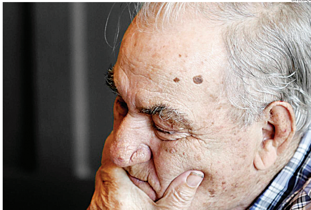
Entre as denúncias protocoladas, violação de direitos como alimentação e saúde

Deste total de denúncias, houve protocolos sobre violação de direitos civis e políticos, como direito à propriedade e ao exercício do poder fa-