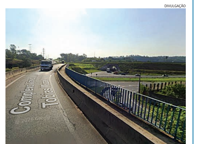
Os motoristas já podem utilizar a nova pista

Do km 68 ao km 73 da rodovia, as pistas duplicadas já estão prontas e o período agora é de implantação dos dispositivos de proteção contínua (barreiras de concreto e defensas metálicas) no canteiro central. A concessionária também realiza neste trecho obras de drenagem e a implantação da nova sinalização de solo.