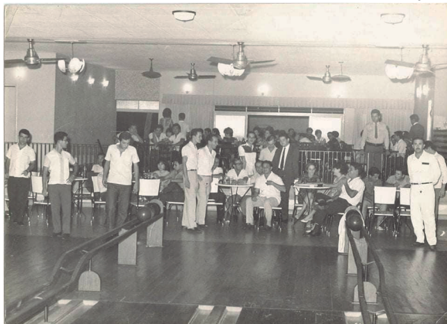
Mais uma imagem dos anos 1970 do Boliche Las Vegas. O espaço de lazer tinha como endereço a esquina das ruas Oscar Rodrigues Alves e Mato Grosso, na Vila Mendonça