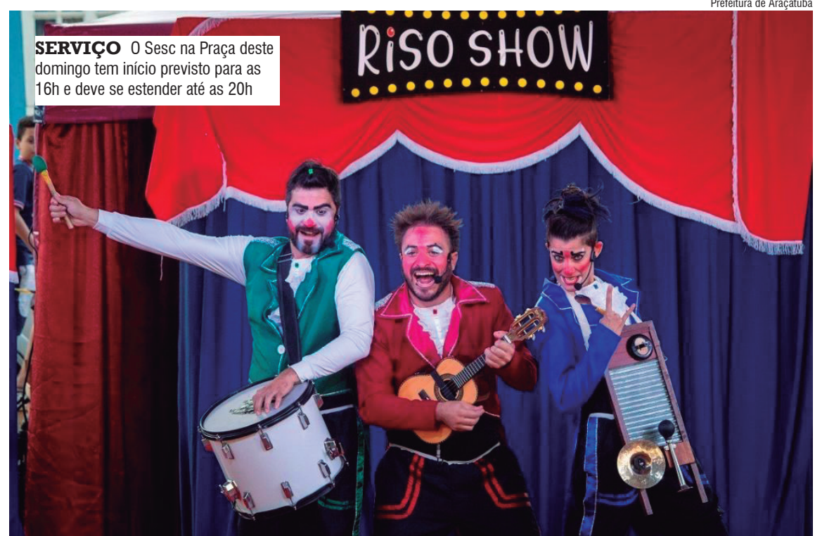
SERVIÇO O Sesc na Praça deste domingo tem início previsto para as 16h e deve se estender até as 20h

A Cia. MB Circo apresenta o espetáculo “Riso Show”. Os palhaços Tico e Polenta se aven-