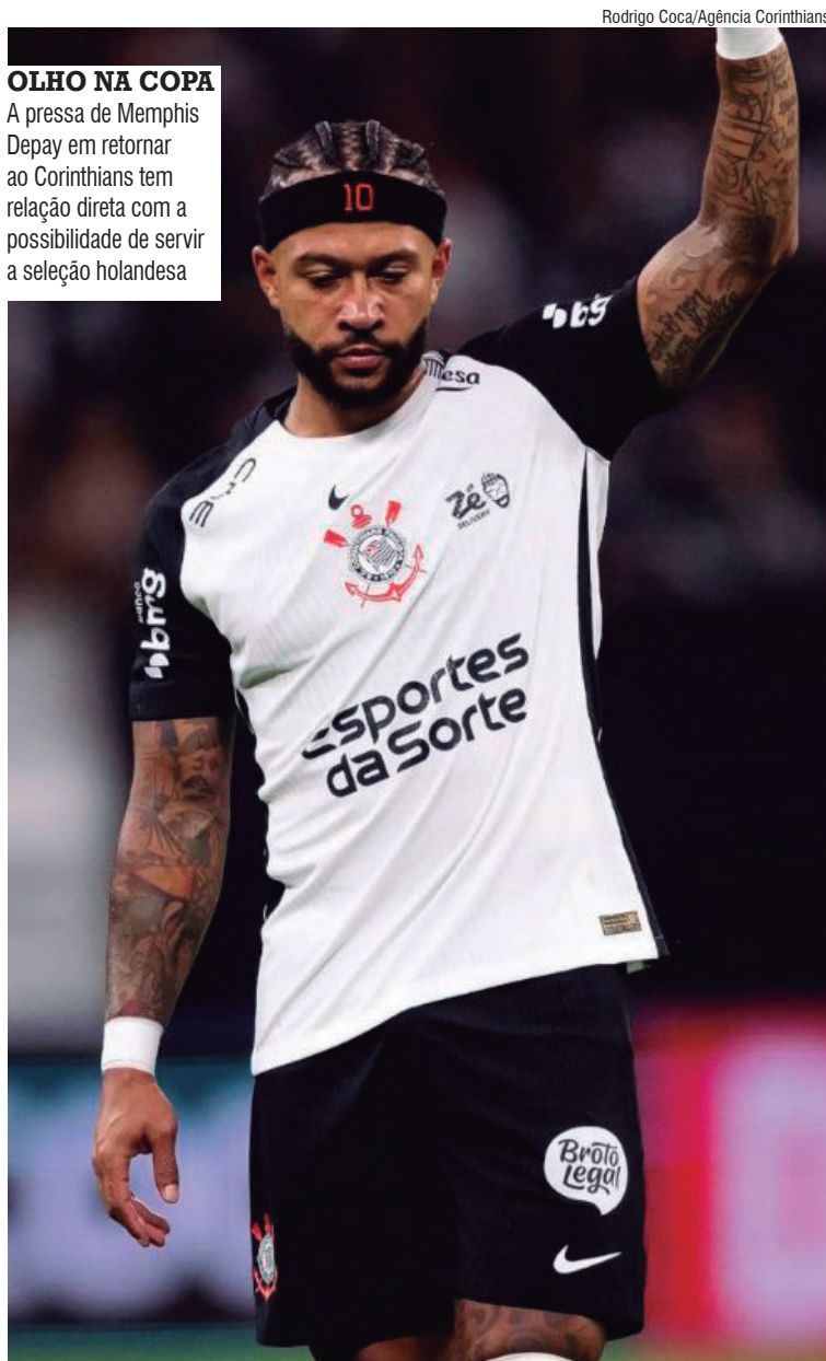
OLHO NA COPA A pressa de Memphis Depay em retornar ao Corinthians tem relação direta com a possibilidade de servir a seleção holandesa

O Galo alcançou a décima posição na tabela com 21 pontos