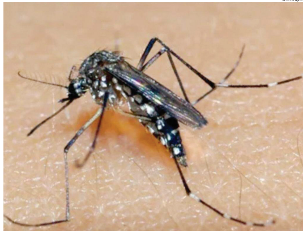
A chikungunya também é transmitida pelo mosquito Aedes aegypti