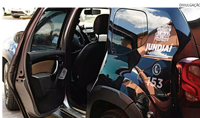
Os GMs detiveram o suspeito e o levaram para a DIG de Jundiaí

Ele também entregou o próprio irmão, que será investigado. As motos foram recuperadas. O suspeito preso ficou à disposição da Justiça.