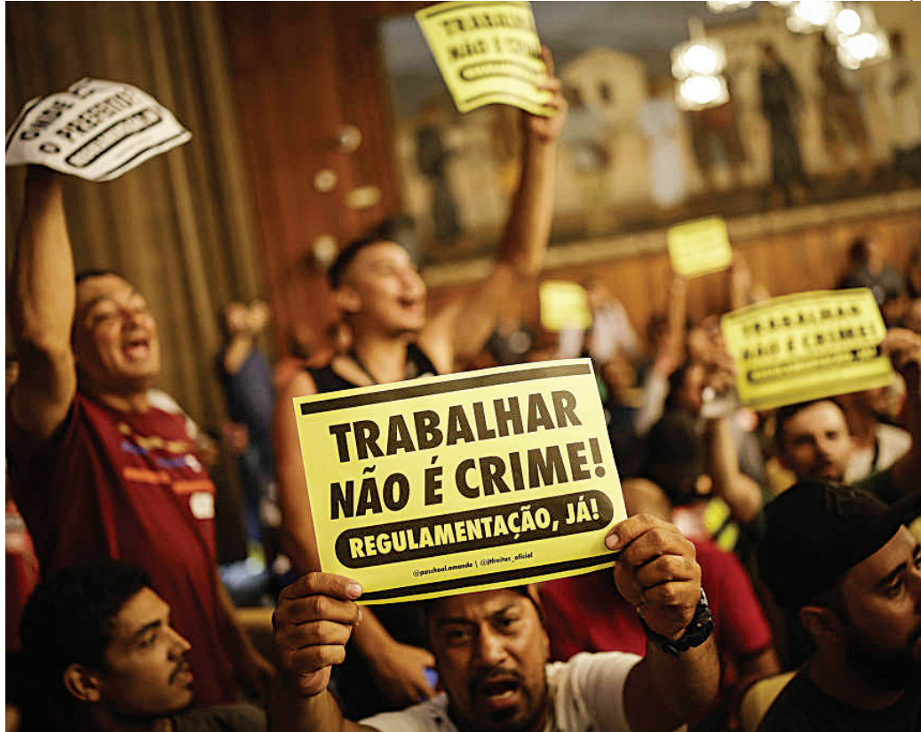
Vereadores defendem a regulamentação para garantir segurança e direitos trabalhistas