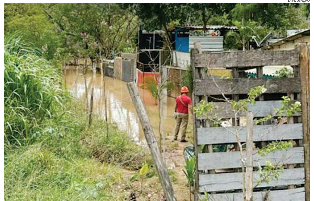
A ocupação irregular gerava preocupações devido à falta de infraestrutura