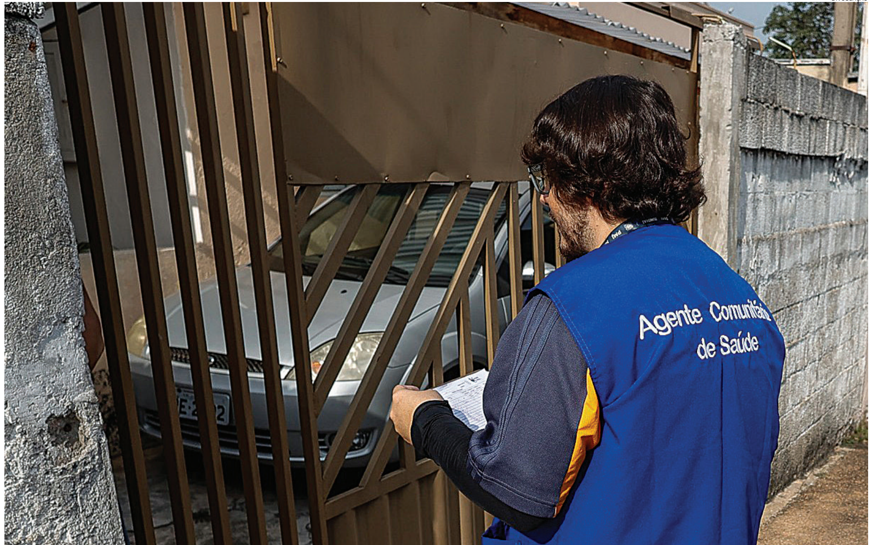
Jundiaí está reforçando as ações contra a doença devido ao aumento da transmissão no país