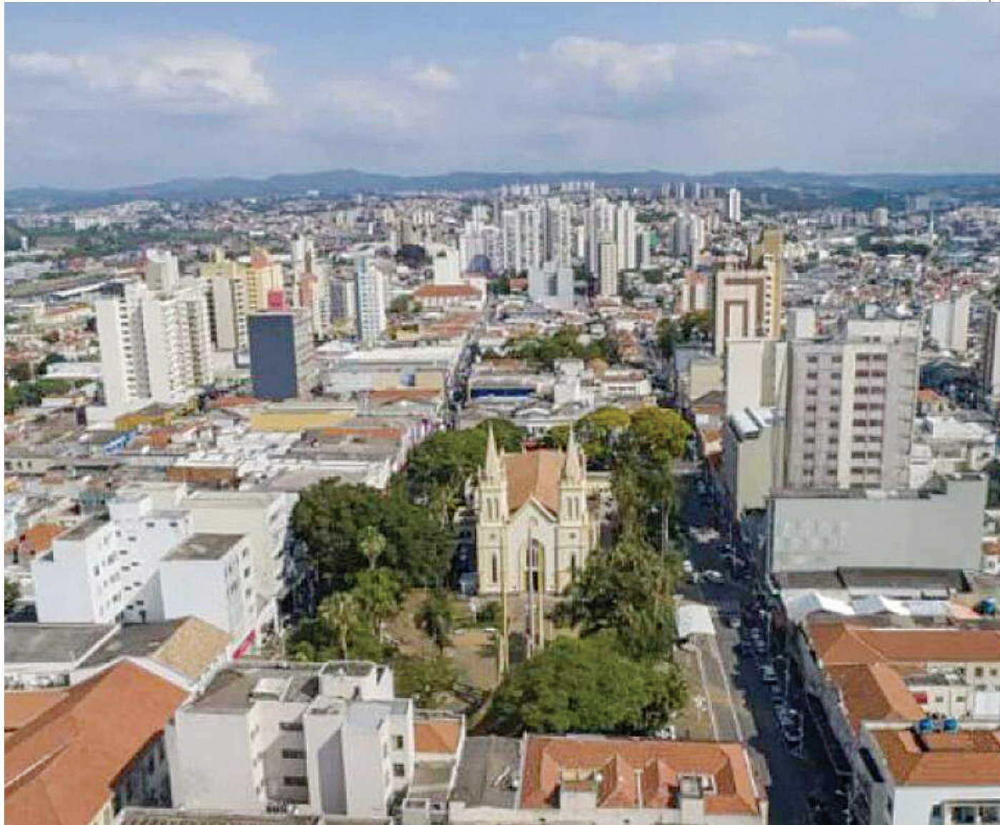
O céu com presença de nuvens, mas sol bastante quente deve continuar pelo fim de semana

Na segunda-feira (10), a previsão aponta temperatura mínima de 18°C e máxima de 26°C e a possibilidade de chuva é maior, com pancadas e trovoadas isoladas. Na terça, a temperatura sobe um pouco, com mínima prevista de 19°C e máxima de 28°C e, novamente, são esperadas pancadas de chuva isoladas em Jundiaí. Para os próximos dias da próxima semana, o tempo permanecerá o mesmo, com mínimas próximas de 20°C e máximas