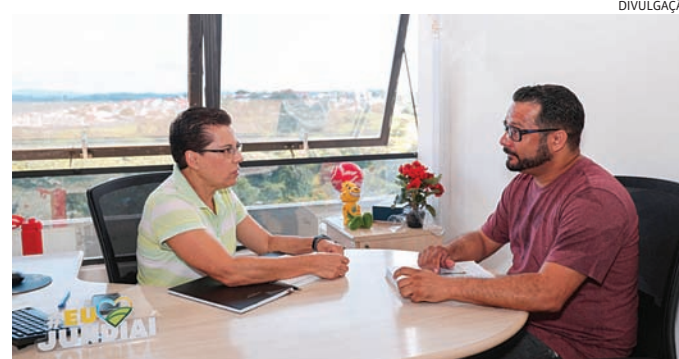
As competições incluem sete modalidades e 71 escolas participantes