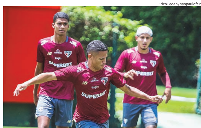
O São Paulo deverá entrar em campo com a equipe reserva