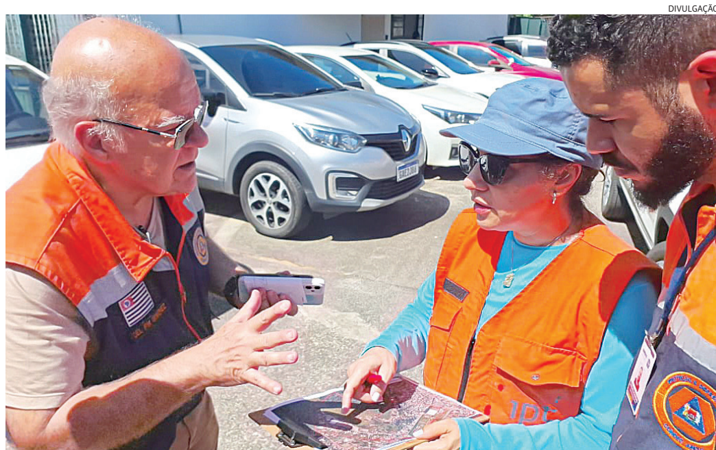
O trabalho envolve visitas de campo, análises geotécnicas e a coleta de dados

O mapeamento está em andamento e, após sua conclusão, será fundamental para a atualização do plano, reforçando as políticas de segurança e resiliência urbana em Jundiaí.