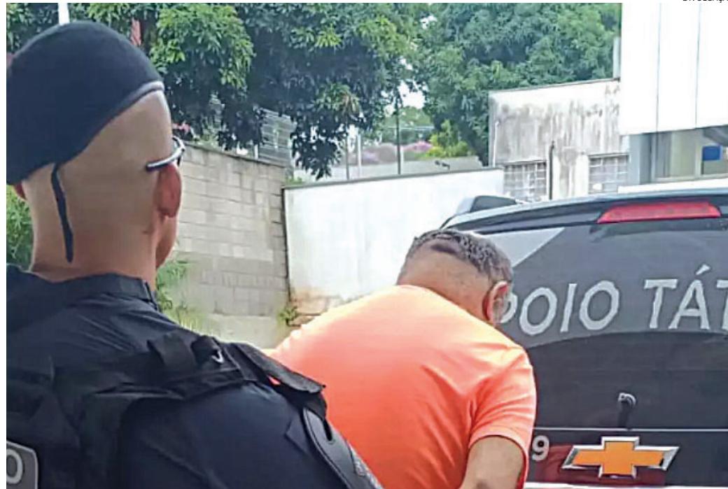
O criminoso disse que paga a um garoto para enviar fotos do irmão

mandado de prisão, ele foi levado ao sistema prisional para cumprir sua pena.