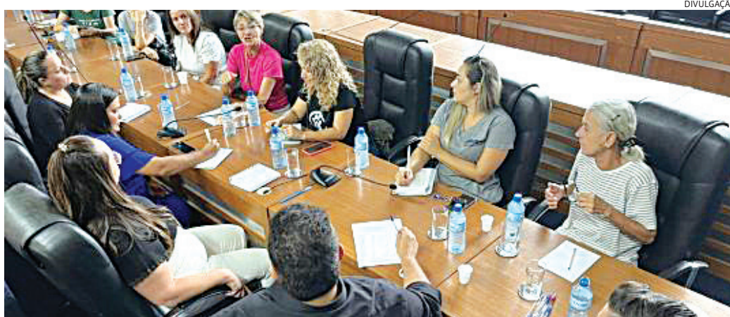
Os parlamentares se comprometeram a buscar recursos e avaliar adequações na legislação municipal