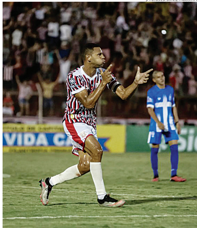
Único invicto da competição, o Paulista vive um início de temporada perfeito