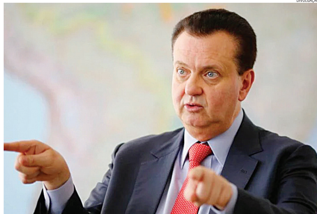
Kassab fez críticas a Lula e o movimento foi considerado apoio a candidatura de Tarcísio

Embora Tarcísio não se lance para a disputa presidencial, defendendo que o candidato do seu grupo é Bolsonaro ou quem ele escolher, as declarações posteriores de Kassab foram vistas como uma adesão a esse possível projeto.