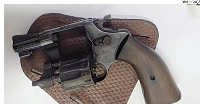
Arma e munições foram apreendidas pelos policiais

informações de que parte de um caminhão furtado na região de Jundiaí, alguns dias atrás, estaria em um desmanche em Ibiúna.