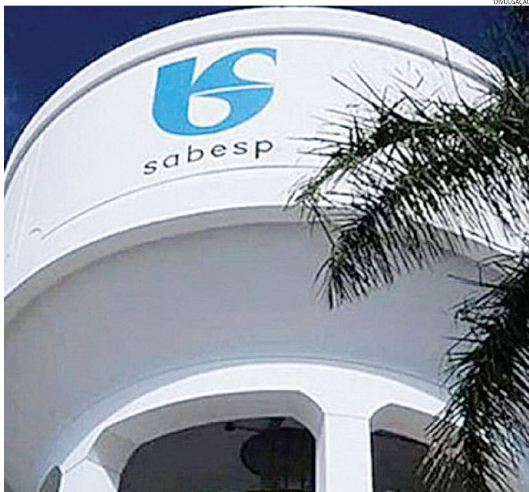
A Sabesp pede uso consciente da água, evitando desabastecimento