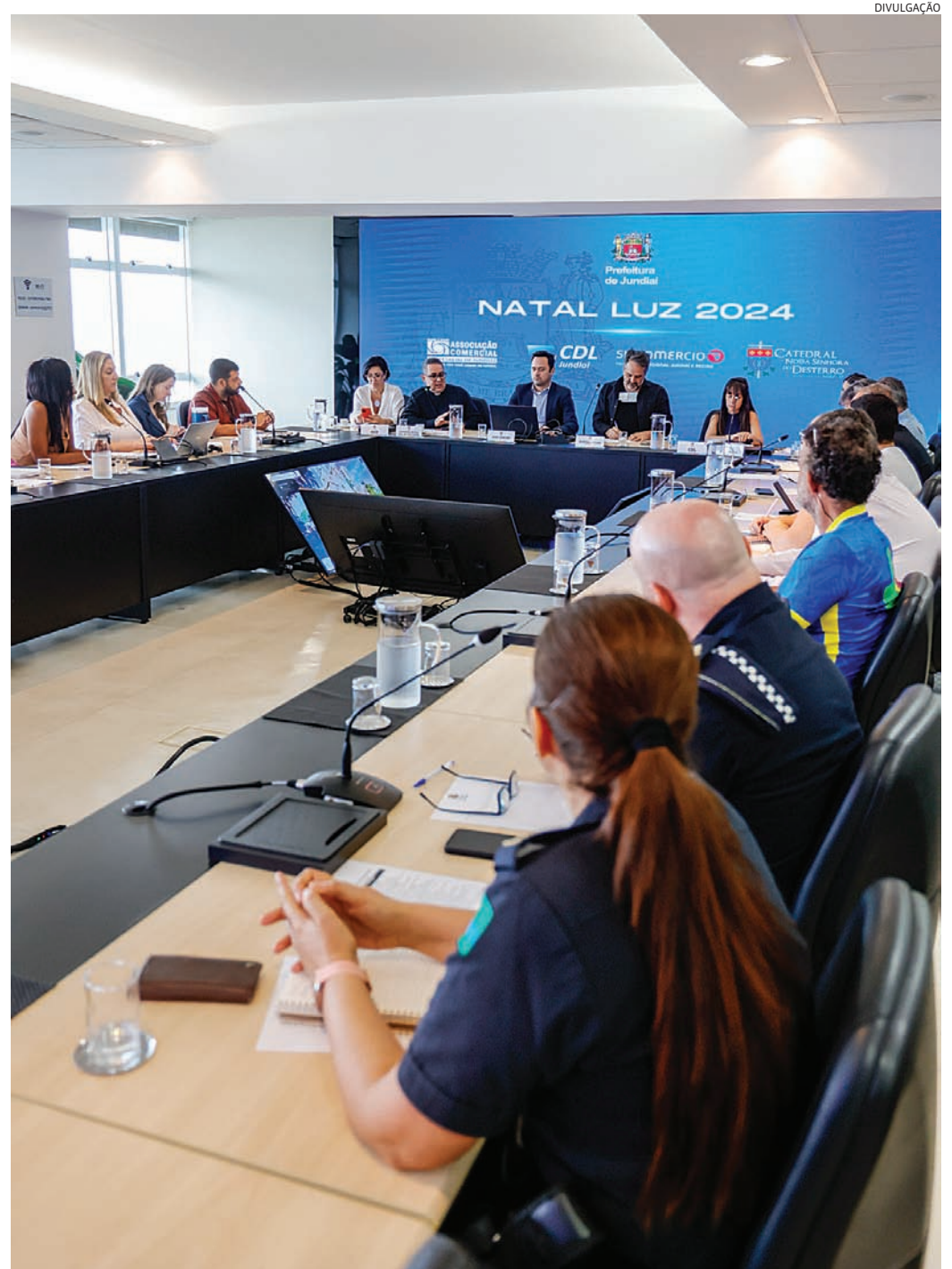
Diferentes representantes e autoridades participaram de reunião no Paço Municipal