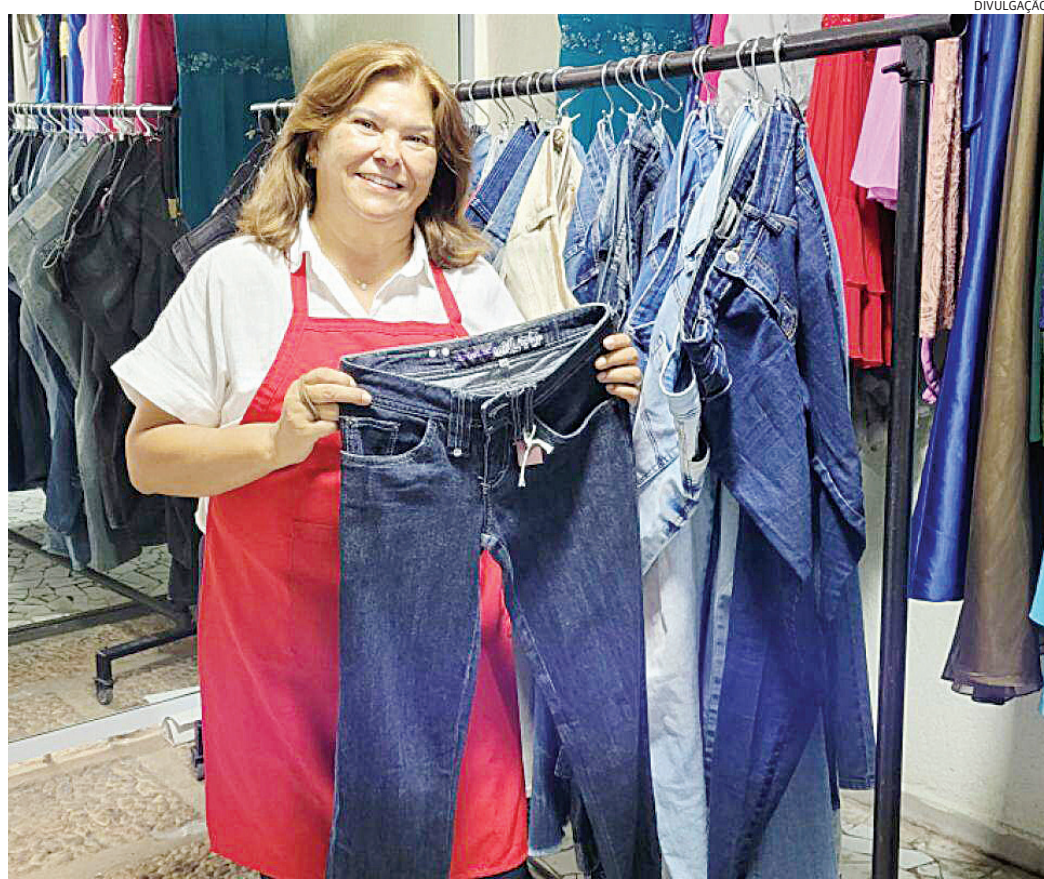
Bazar do HSV conta com opções para toda a família