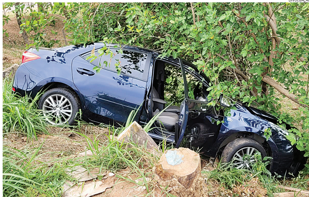
O suspeito caiu com o carro na ribanceira e correu para o mato, sendo perseguido e preso pelos guardas

Durante a tentativa de fuga ele chegou a efetuar um disparo em direção aos agentes, que não foram atingidos - os GMs revidaram e atiraram também. Por outro lado, um cliente de um supermercado que estava no estacionamento do estabelecimento, foi atingido de raspão nas costas.