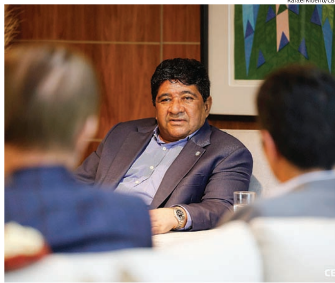
A Justiça chegou a tirar Ednaldo Rodrigues do poder e invalidar a eleição

Foi um TAC firmado entre o Ministério Público e a CBF que serviu de alicerce para a realização da eleição que levou Ednaldo Rodrigues ao poder, em 2022. Quando a Justiça, em dezembro de 2023, decidiu que o MP não tinha a prerrogativa legal de fazer o TAC, declarou inválido o