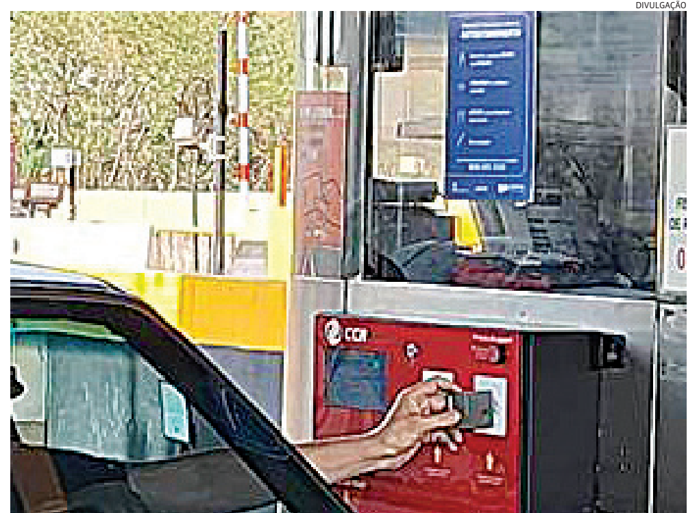
O motorista poderá efetuar o pagamento aproximando seu celular, relógio ou cartão com tecnologia NFC

Mais informações podem ser obtidas pelo Disque CCR AutoBAN no 0800 055 5550, pelo WhatsApp (11) 4589 3999 ou, ainda, pelo site https://rodovias.grupoccr.com.br/autoban . Sobre a CCR AutoBAN