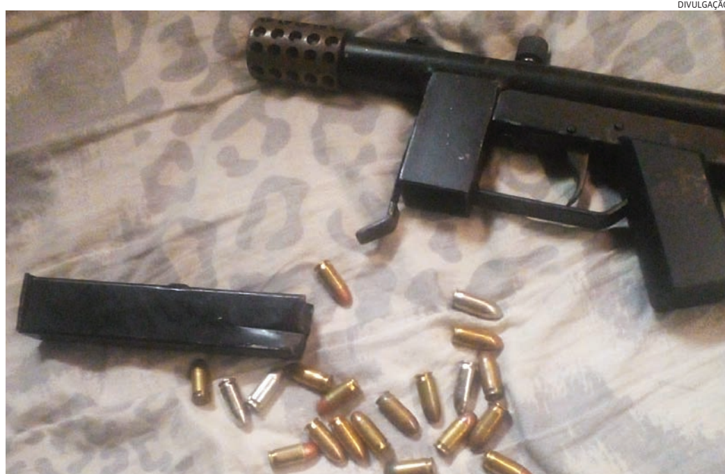
A arma havia sido negociada pela internet e seria entregue ao comprador

Agora a polícia trabalha com objetivo de identificar outros possíveis vendedores e compradores.