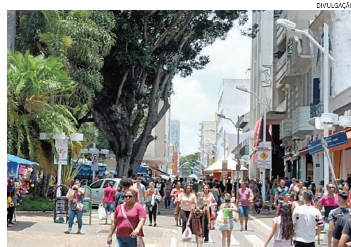
Sábados de horário estendido costumam elevar as vendas em até 30%

O Dia das Crianças apresenta a última festa comemorativa antes do Natal e, por isso, dá ao mercado de