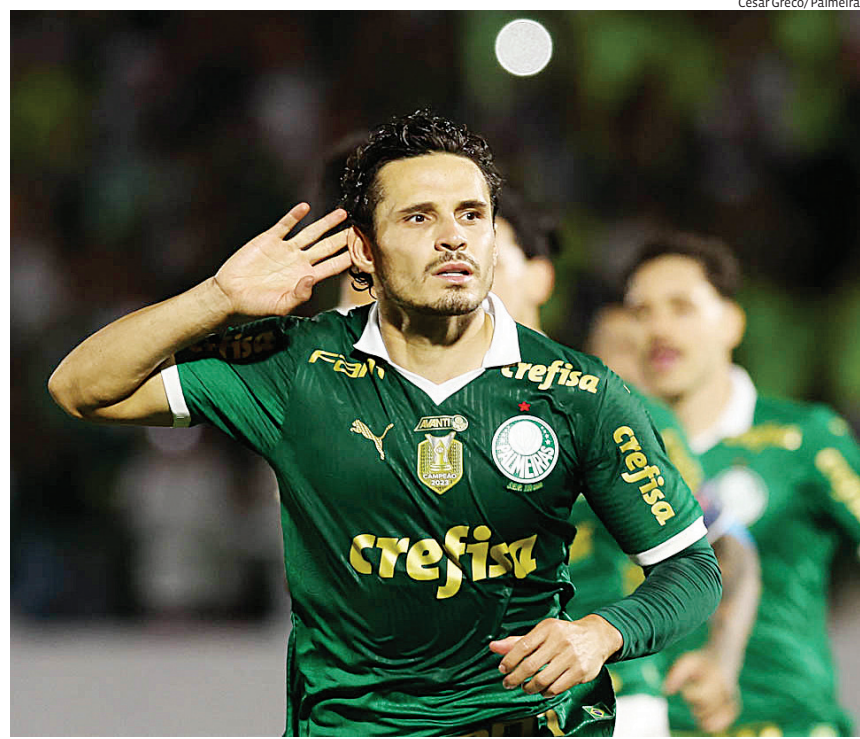
Na vice-liderança, o Palmeiras precisa "secar" o Botafogo

O Corinthians amarga a 18ª posição do campeonato e segue com dificuldades de deixar a zona da degola. O time ainda desceu mais um degrau após vitória do Fluminense por 1 a 0 diante do Cruzeiro, na última quinta-feira (3), no Maracanã. Para conseguir um mínimo alívio