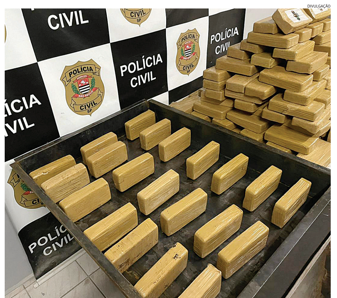
A droga estava em um caminhão, em uma empresa de logística a cidade