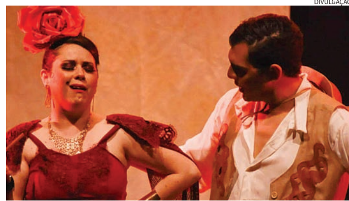
O espetáculo Boa Preguiça, apresentado por grupo de Igu

No sábado, às 18h, a Sala Josette Feres do Centro das Artes recebe a peça “(Des)Espero”, com o Grupo Fannan, pelo Festeju. Livremente inspirado