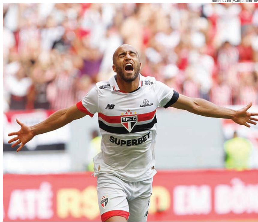
Em caso de vitória, o Tricolor pode alcançar o G4

Posteriormente, às 19h, mais três duelos estão marcados: Bahia x Flamengo, na casa do Bahia, Cuiabá x São Paulo, em Cuiabá, e Corinthians x Internacional, em São Paulo. Apenas um jogo ficou para o último