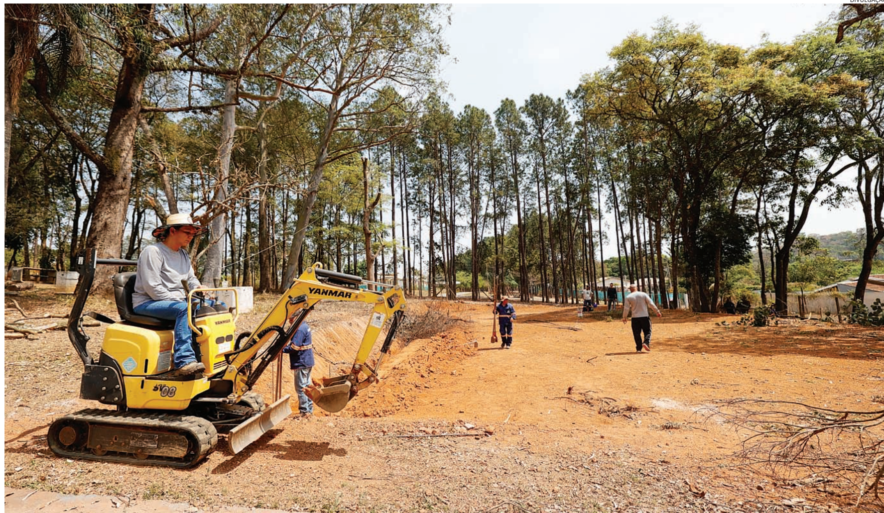
O Parque do Corrupira foi o primeiro parque aberto para o público em Jundiaí