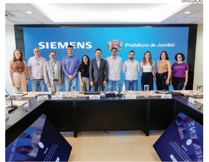
Técnicos da Prefeitura e Siemens discutiram desafios comuns

“Cada secretaria tem um gerente para abaste-