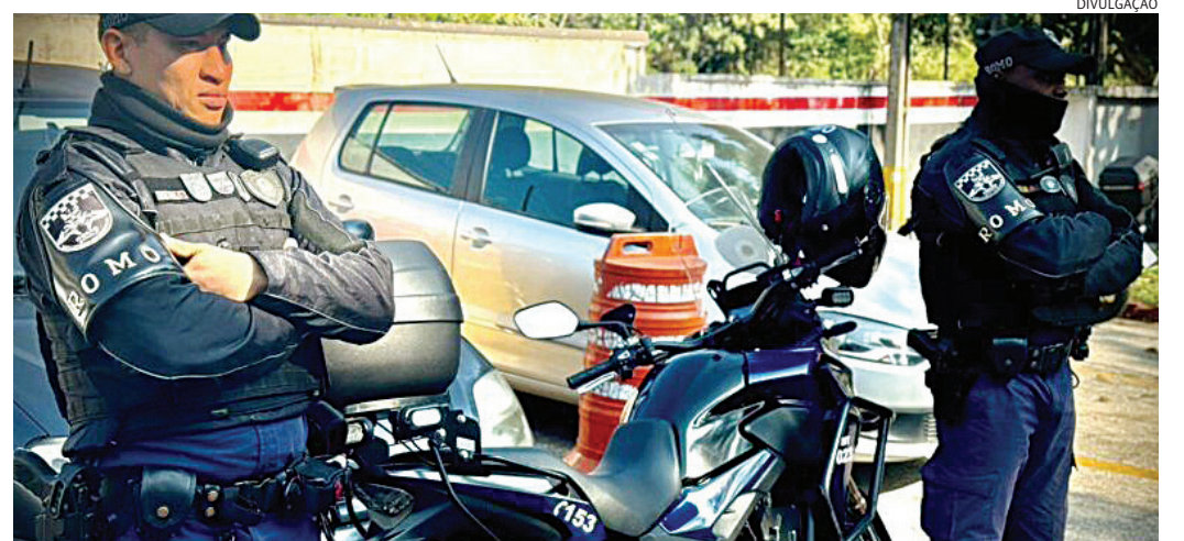
Os guardas conseguiram cercar o suspeito e detê-lo