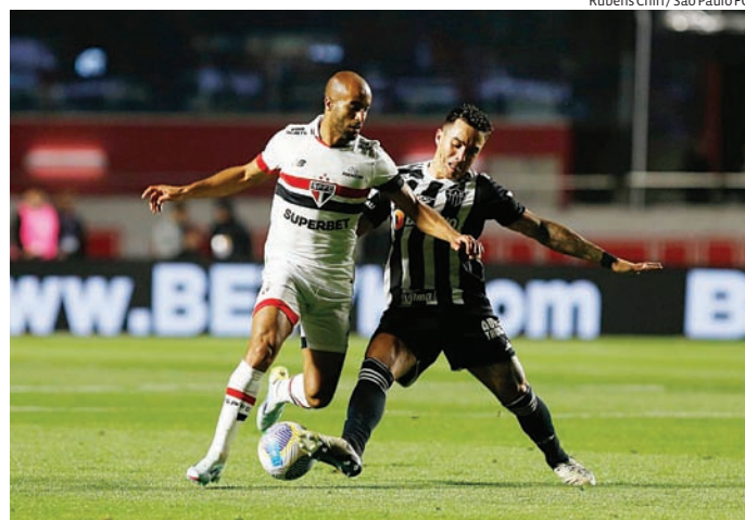
Na ida, o São Paulo sofreu uma derrota amarga, por 1 a 0, em casa

partida, o técnico Luis Zubeldía promoveu uma atividade tática posicional e de bolas paradas. Para outra parte do grupo, houve ainda um jogo em espaço reduzido.