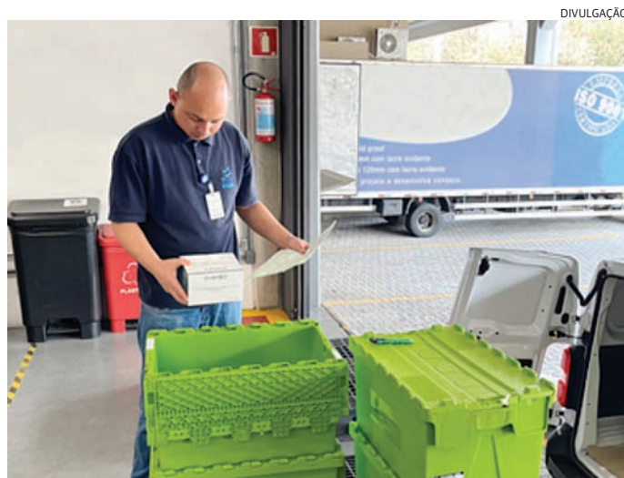
O recurso foi aplicado nos departamentos de Almoxarifado e Farmácia

A ação faz parte da implantação das diretrizes ESG, sigla, em inglês, para Environmental, Social and Governance, que significa Ambiental, Social e Governança – conjunto de critérios pelos quais as empresas são avaliadas em relação aos seus impactos ambientais, práticas sociais e qualida-