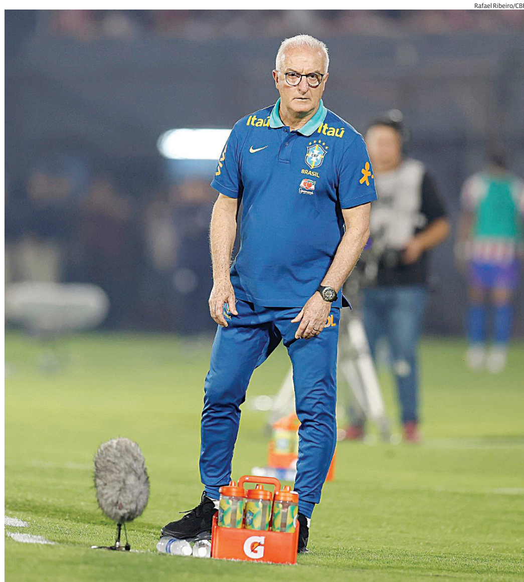
Nos próximos compromissos, a seleção brasileira enfrentará Chile e Peru em outubro

Se não vencer o Chile, o elenco de Dorival Júnior