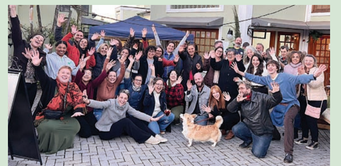
Organizadores e expositores fazem o sucesso da feira

FIQUE POR DENTRO COM A GENTE NAS REDES SOCIAIS: