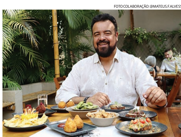
Os pratos são uma explosão de sabores