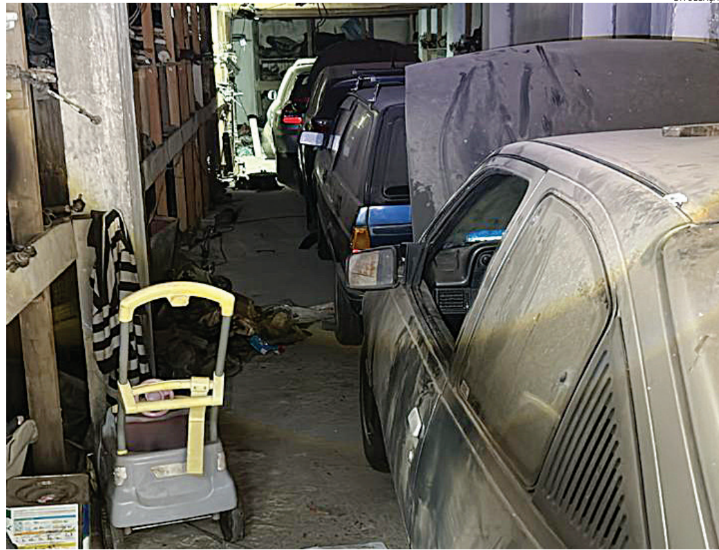
Os carros e peças estavam sem identificação e foram apreendidos pelos detetives

As peças estavam todas sem identificação e sem o selo de rastreabilidade, exigido pelo Departamento Estadual de Trânsito