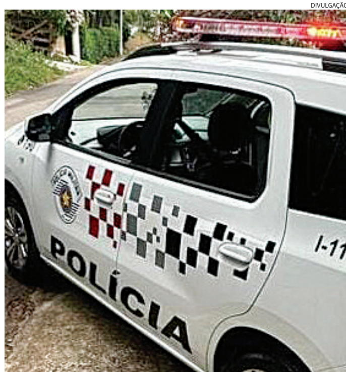
Os policiais o levaram para a delegacia, onde ele ficou preso

Foi realizada a abordagem e, durante revista pessoal, nada de ilícito foi encontrado. Porém, em chegada a seus dados pessoais, os PMs encontraram um mandado de prisão em aberto expedido pela Justiça, por quatro tipos de crimes.