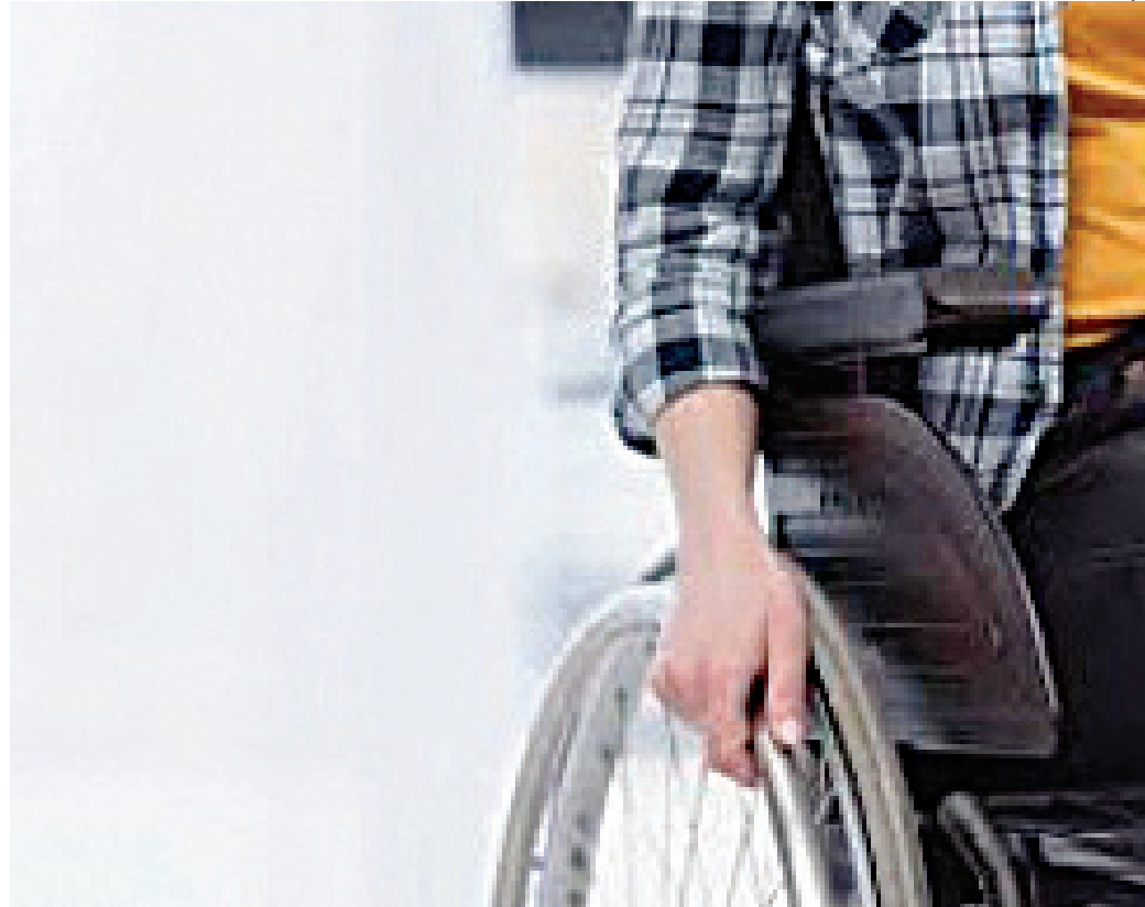
Condomínios residenciais de Jundiaí devem disponibilizar ao menos uma cadeira de rodas em cada torre

Assim, o artigo 1º da lei original tem o acréscimo de um inciso, passando a vigorar com a seguinte redação: “Art. 1º. A Lei nº 4.522, de 20 de fevereiro de 1995, que prevê disponibilização de cadeiras de rodas nos locais que especifica, passa a vi-