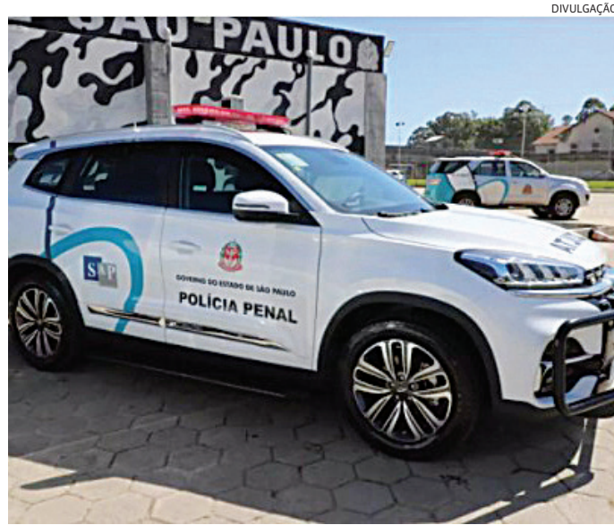
Pela nova lei, duas categorias vão formar a Polícia Penal

A Câmara Municipal de Jundiaí vai realizar, no final do mês de setembro, duas audiências públicas de Prestação de Contas do Executivo. Em 26 de setembro será realizada audiência pública pela Unidade de Gestão de Promoção da Saúde. A pasta apresentará aos vereadores a prestação de contas referente ao segundo quadrimestre de 2024. Já no dia 27 de setembro, será a vez da Unidade de Gestão de Governo e Finanças demonstrar o cumprimento das