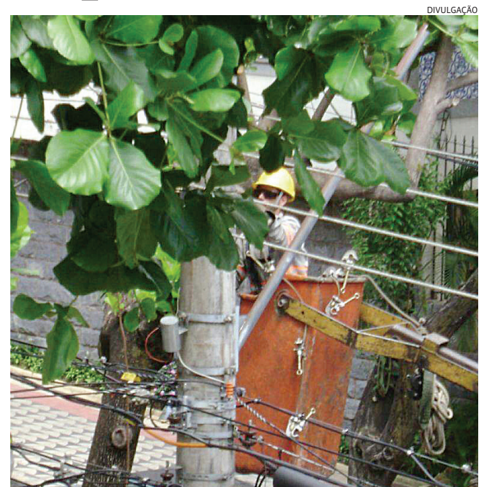
Manter a vegetação sob controle é essencial para evitar acidentes

Além de prevenir choques elétricos, realizar podas de árvores seguindo os procedimentos de segurança adequados garante a integridade do sistema elétrico. Galhos e pedaços de tronco podem cair ou se manter