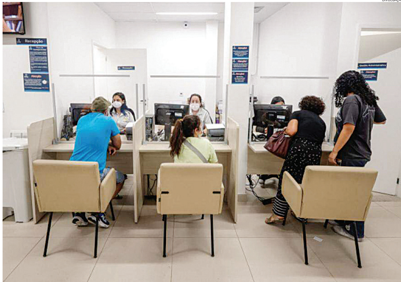
Em Jundiaí, o atendimento às pessoas com sintomas gripais e respiratórios ocorre nos PAs e na UPA do Vetor Oeste