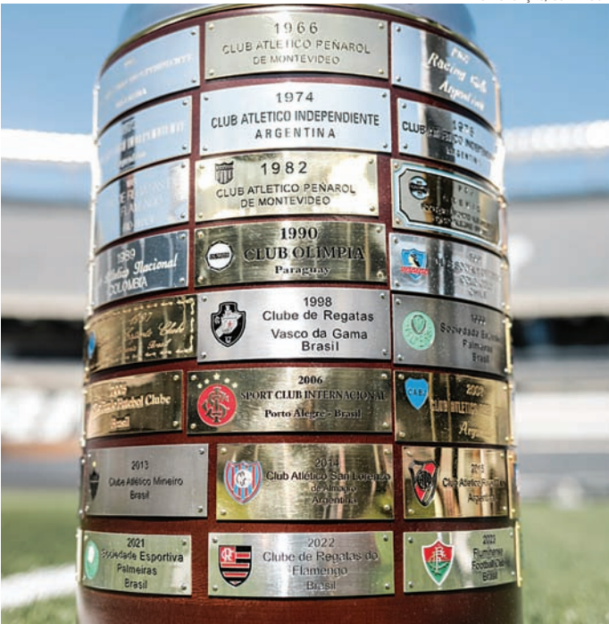
Os times paulistas caíram em grupos que requer atenção

GRUPO A: Botafogo (BRA), Estudiantes (ARG), Universidad de Chile (CHI), Carabobo (VEN); GRUPO B: River Plate (ARG), Independiente del Valle (EQU), Universitario (PER), Barcelona (EQU);