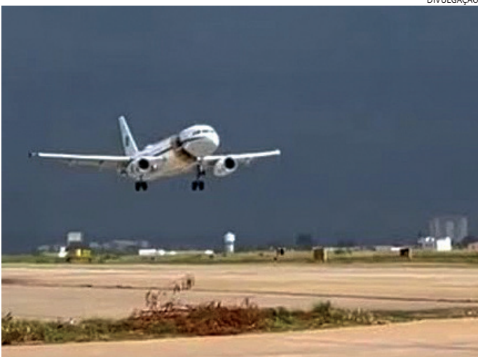
Avião de Lula teve que arremeter em Sorocaba por conta de fortes ventos