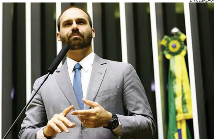
Eduardo Bolsonaro afirma que é melhor lutar dos EUA contra o governo

me de exceção” e “truques sujos de Moraes”. “Não irei me acovardar, não irei me submeter ao regime de exceção e aos seus truques sujos. Assim sendo, da mesma forma que eu assumi o mandato parlamentar para representar a minha nação, eu abdicarei temporariamente dele”, disse. Conversas já tinham ocorrido durante sua participação na conferência de movimentos ultraconservadores, a CPAC, em Washington, no mês passado. Na ocasião, o presidente Donald Trump fez questão de citar a presença do brasileiro, numa sinalização interpretada por muitos como um sinal de apoio. Mas,