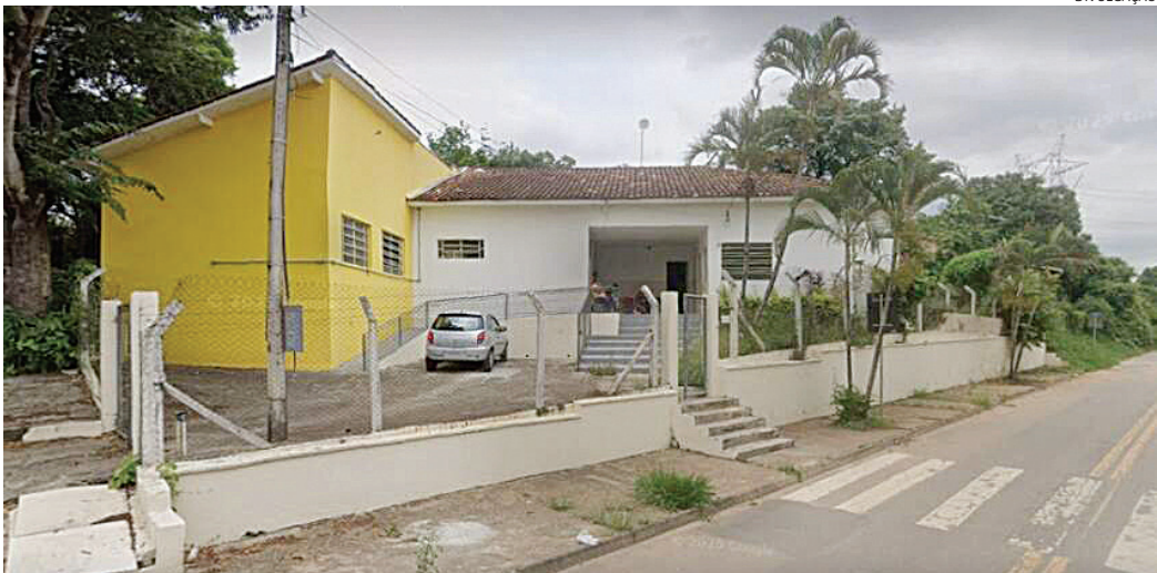
O prédio da antiga Emeb Américo Mendes tinha, até o início deste ano, um centro cultural