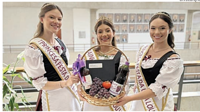
Além de venda e exposição da fruta, tem música na programação

A Corte esteve nas prefeituras de Jundiaí, Várzea Paulista e Cabreúva, onde foi recepcionada pelo pre-