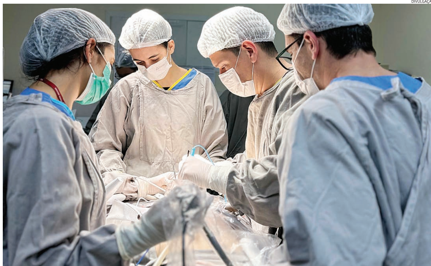
Os leitos são readequados para garantir acesso dos pacientes com conforto

Do total de pacientes atendidos por trauma, 1.202 necessitaram de internação hospitalar, o que representa 41% dos casos. Entre os pacientes vítimas de acidentes de trânsito, o índice de internação é ainda mais elevado: 805 pessoas, correspondendo a 67% dos internados por trauma.