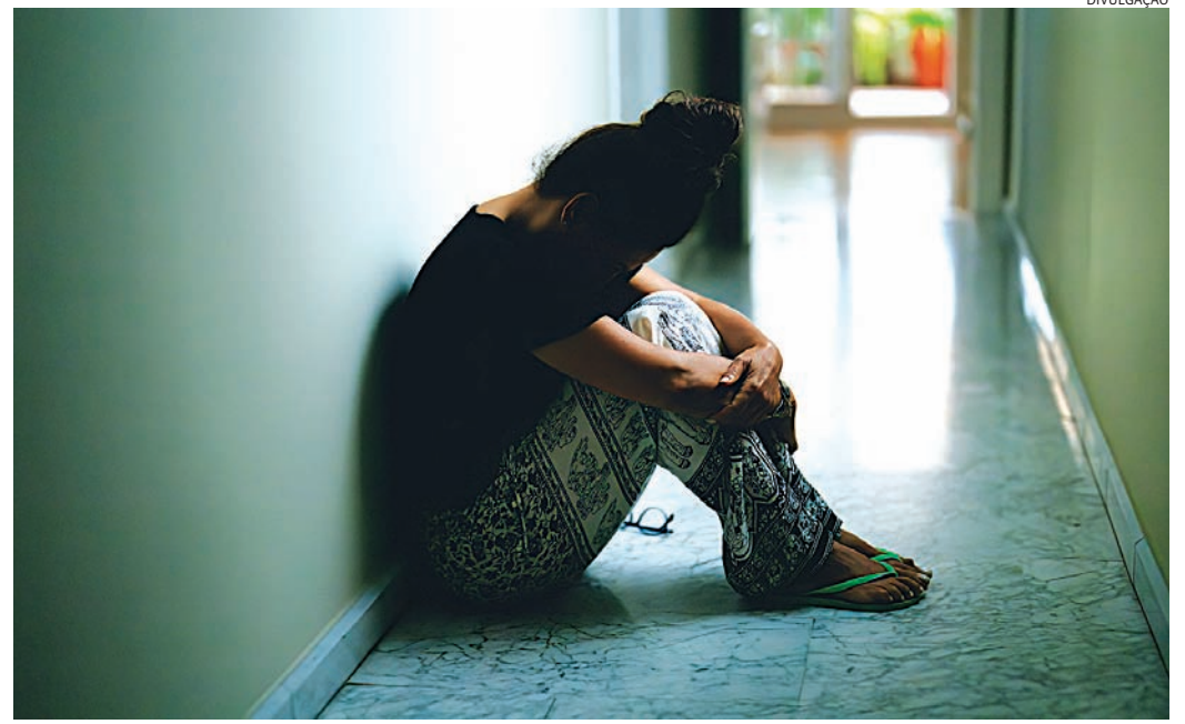
O acolhimento é importante, mas a ajuda profissional é essencial

importante ouvir e tentar entender o que a pessoa está sentindo do que buscar so-