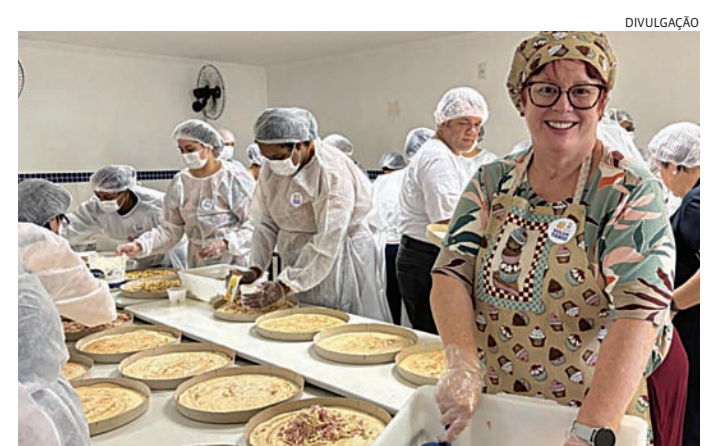
Na ocasião haverá a venda de pizza e feira de variedades

A iniciativa amplia a programação e transforma o momento da retirada da pizza solidária em uma experiência aberta à comunidade, com opções de compras e valorização do comércio local.