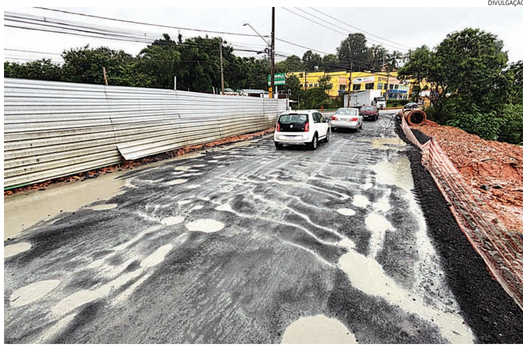
Via está recapeada para melhor trânsito dos motoristas