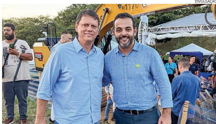
Gustavo Martinelli acompanhou o início das obras ao lado de Tarcísio de Freitas

Nesta quinta-feira (9), o prefeito de Várzea Paulista, professor Rodolfo Braga (PSD), se encontrou com o governador Tarcísio de Freitas (Republicanos) em evento da TIC Trans, em Campinas, e anunciou a liberação de mais R$ 10,5 milhões para investimentos em infraestrutura no município. Com o novo aporte, o volume total de recursos destinados pelo Governo do Estado à cidade já ultrapassa R$ 200 milhões, contemplando obras para segurança hídrica, construção do hospital e projetos de moradia popular. O governador destacou a importância de Várzea Paulista no contexto estadual e reforçou a parceria entre o município e o governo paulista.