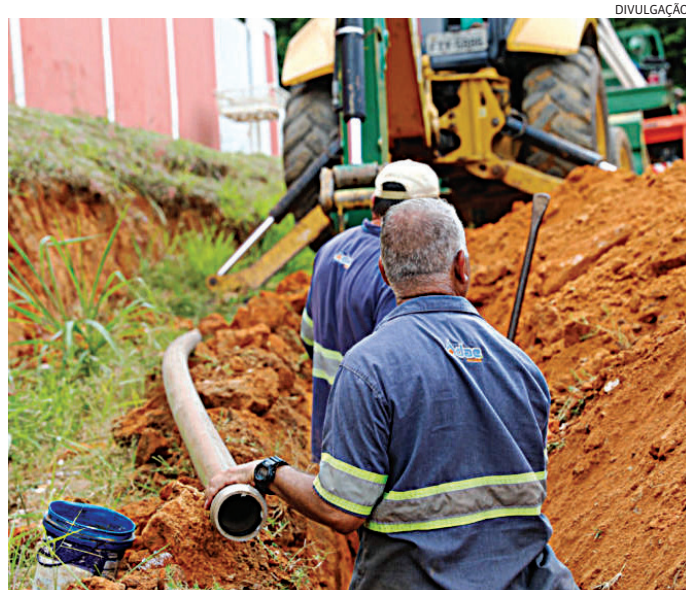
A previsão é que o trabalho seja concluído ainda neste primeiro semestre