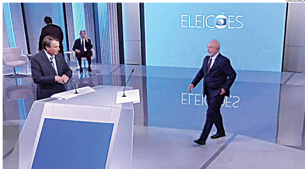
A quantidade de candidatos exigida é a menor desde 2010

O grupo dos que terão direito agora não inclui o folclórico ex-deputado federal Cabo Daciolo, que se filiou ao Mobiliza (antigo PMN, Partido da Mobilização Nacional) para concorrer à Presidência novamente, mas que admite a possibilidade de recuar e disputar o Governo do Amazonas ou uma vaga de senador.