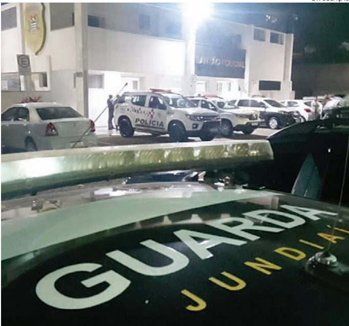
A prisão foi realizada por guardas municipais

De acordo com a apuração da reportagem, os dois saíram de Paulínia com a intenção de furtar celulares em Campinas. Durante parte do dia, eles conseguiram furtar pelo menos seis aparelhos: basicamente, observavam as vítimas falando ao celular, puxavam o aparelho e saíam correndo. Após o arrastão, tentaram deixar a cidade, mas se perderam ao acessar a rodovia Anhanguera, no sentido São Paulo. Quando já estavam chegando a Jundiaí, o carro quebrou. A dupla então solicitou ajuda da Concessionária CCR Autoban, que levou o veículo até a avenida 14 de Dezembro.