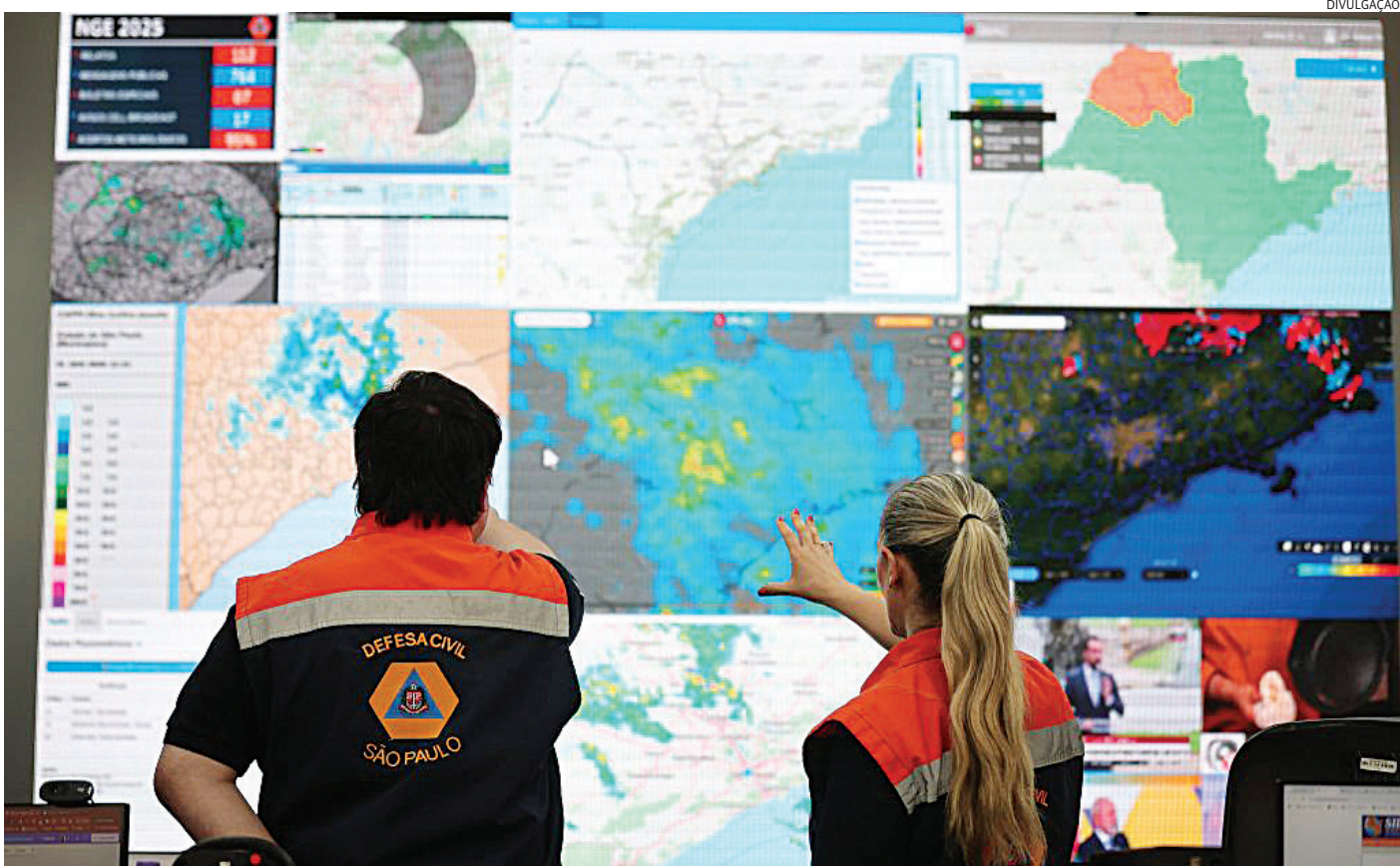
Cada município deve ter suas ações para evitar as tragédias durante as chuvas

O Governo de São Paulo mobiliza um gabinete de crise para coordenar ações de prevenção e atendimento de municípios diante da previsão e da possível ocorrência de chuvas fortes no estado durante o feriado de Ano Novo. Durante a reunião realizada na sexta-feira (26), o governador Tarcísio de Freitas destacou a necessidade de atuação integrada entre Estado e municípios para minimizar riscos e impactos à população. Também participaram da reunião representantes de órgãos estaduais e concessionárias de serviços públicos. Segundo o monitoramento da Defesa Civil, para esta terça (30) há risco de fortes temporais, com acumulados previstos entre 20 e 50 milímetros por dia, ventos fortes no momento da chuva, trovoadas e eventual granizo, especialmente nas regiões de Presidente Prudente, Marília, Itapeva e Registro. No dia 31, a previsão indica muito calor e tempo abafado, com pancadas de chuva típicas da estação. Já no dia 1º de janeiro, o avanço de uma nova frente