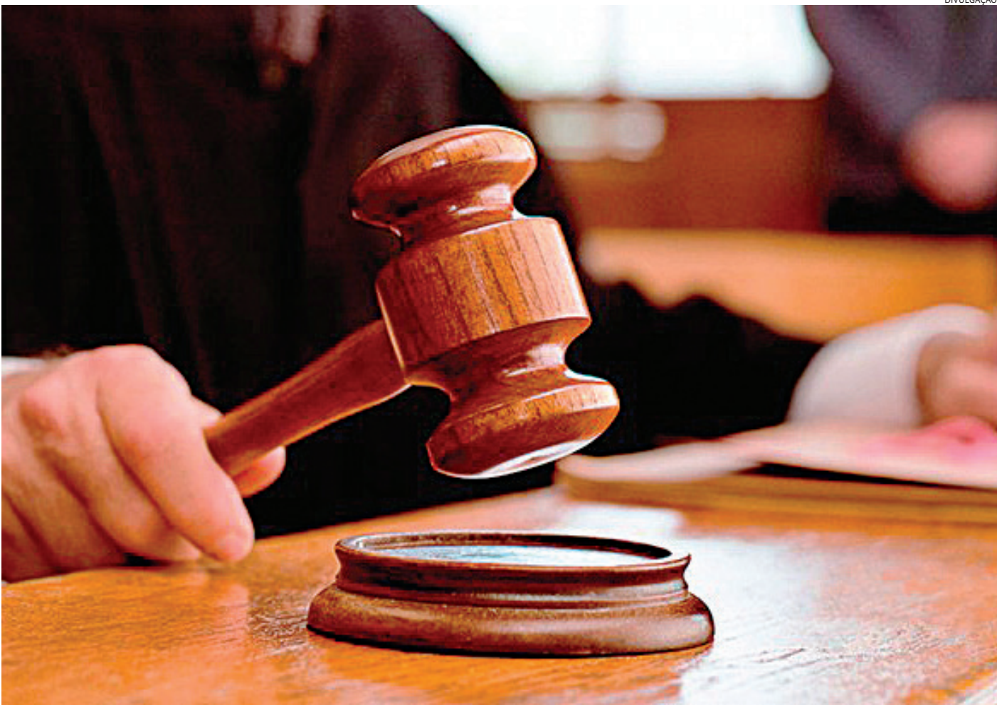
Casos de grande dimensão não foram concluídos e impactam estratégias eleitorais