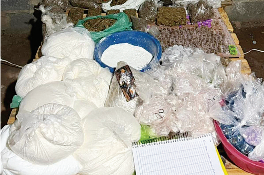
Foi apreendida grande quantidade de material ilícito e utensílios para o tráfico

Policiais militares de Força Tática prenderam três homens em uma chácara localizada entre Campo Limpo Paulista e Várzea Paulista, na madrugada deste domingo (28), enquanto o trio manuseava uma grande quantidade de maconha e cocaína para distribuição e venda em pontos de tráfico. De acordo com os suspeitos, a droga pertence a traficantes do Jardim Tamoio, em Jundiaí. No total foram apreendidos 20 kg de entorpecentes. Durante patrulhamento tático, as equipes da Força Tática receberam uma denúncia sobre a possível ocorrência de um “Tribunal do Crime” em uma chácara na Marginal do Rio Jundiaí.