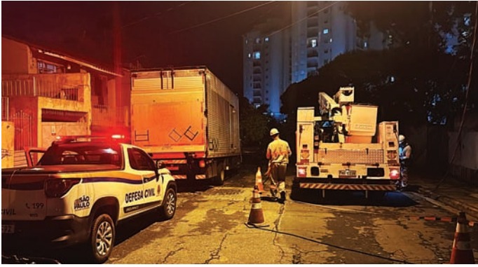
Equipes atuam na retirada de árvores e na limpeza das vias

A forte chuva que atingiu Jundiaí na noite de domingo (28) provocou diversos estragos em diferentes regiões da cidade. Segundo a Prefeitura, na Vila Alvorada, a queda de uma árvore atingiu um caminhão e o muro de uma residência, deixando uma família desalojada, que foi orientada pela Defesa Civil e encaminhada para a casa de parentes. Também foram registradas quedas de árvores sobre veículos no Jardim Guanabara e no Parque Brasília. Segundo a Defesa Civil, choveu 53 mm³ em apenas três horas e o acumulado do mês chegou a 398 mm³. Em 2024 o total foi de 599 mm³. A Secretaria Municipal de Mobilidade e Transporte contabilizou 29 ocorrências relacionadas às chuvas e aos ventos fortes. Do total, oito foram quedas de árvores ou galhos em vias, além de um ponto de alagamento na esquina da rua Jacyro Martiasso com a avenida Luiz Latorre e a queda de uma placa de navegação na avenida da Uva. Problemas em 19 conjuntos semafóricos também foram registrados. De acordo com o coorde-