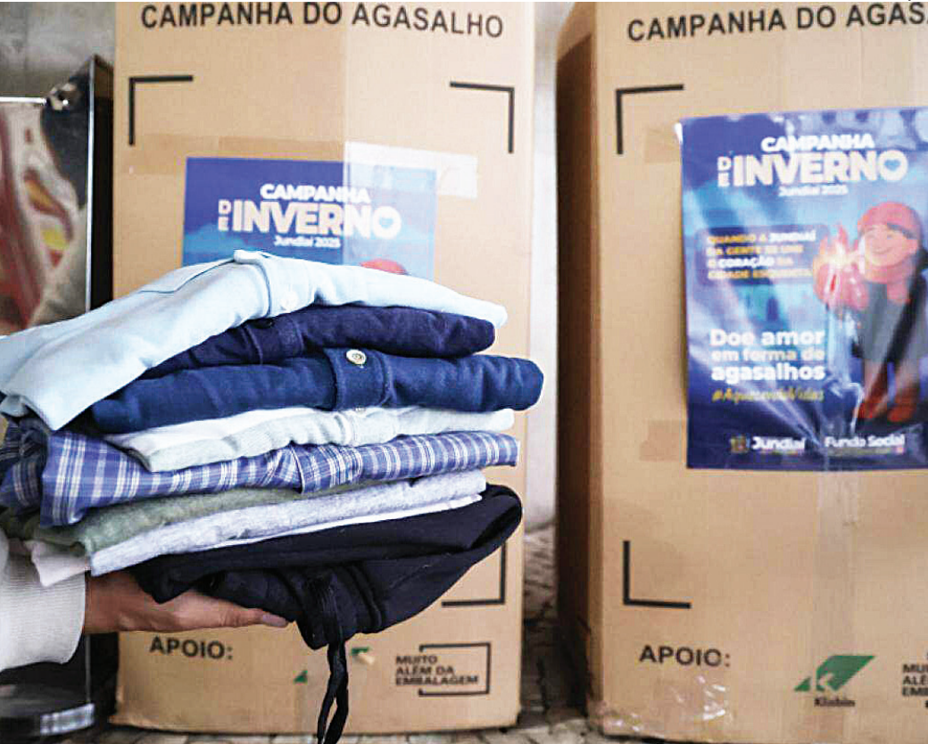
Ação continua mobilizando Jundiaí para arrecadar roupas, agasalhos, cobertores e calçados

Na segunda-feira (21), o alerta retorna para todo o estado, em especial para o extremo norte, que pode entrar em estado de emergência para incêndios.