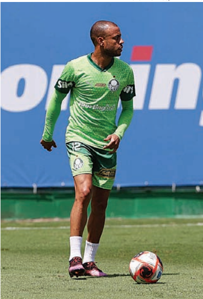
Mayke viu Giay se firmar no Palmeiras e perdeu a vaga como titular

O Palmeiras não tem interesse em perder um jogador de graça para um rival, e Abel Ferreira acredita que a manutenção de Mayke neste meio da temporada é a melhor opção. Outra alternativa seria contratar um jogador,