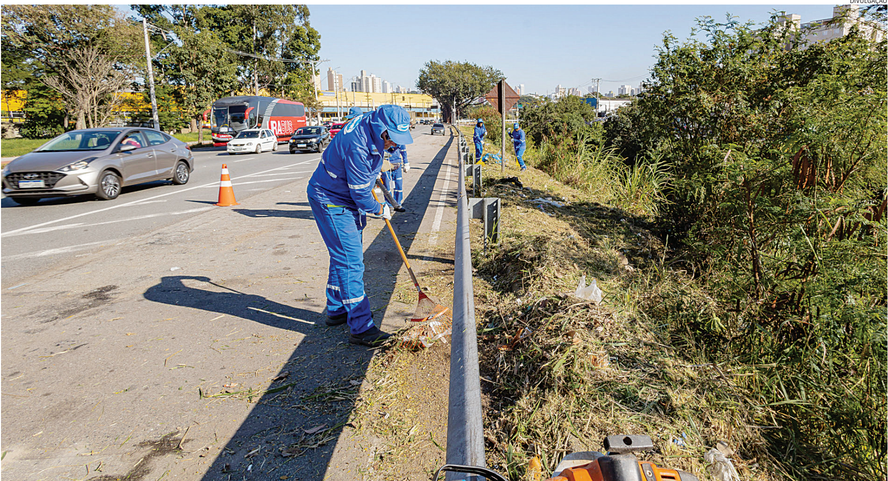
A ação de corte e roçagem tem como principal objetivo garantir a segurança de pedestres e motoristas

prejudica a visualização, principalmente durante a noite. Fazer a remoção completa da vegetação garante segurança para quem trafega nessa região”, afirmou o gestor.