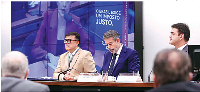
Votação na Câmara dos Deputados deve acontecer em agosto

O Ministério da Previdência Social já contabiliza 1,4 milhão de aposentados aptos a receber o ressarcimento pelos descontos indevidos feitos por entidades associativas. A