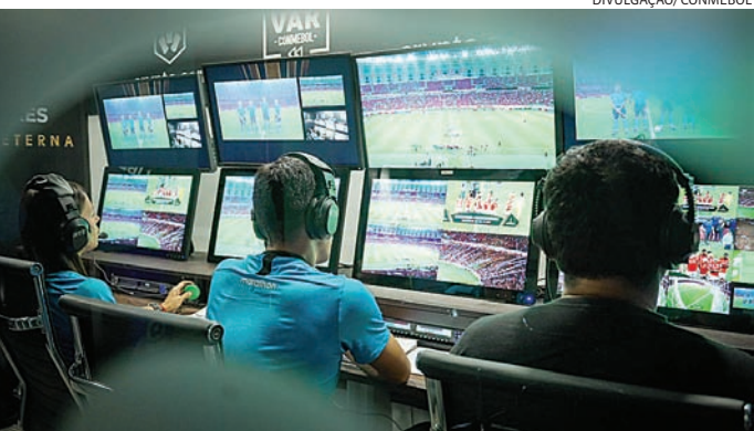
Objetivo é de evitar que árbitros sejam pressionados

A Conmebol entende que essa alteração é um passo importante para dar mais credibilidade ao processo de revisão de jogadas, diminuindo a influência externa nos momentos decisivos das partidas.