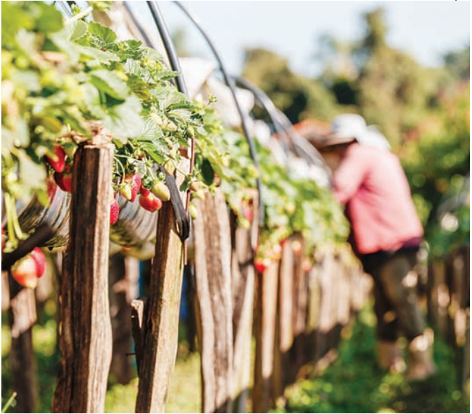
A safra da fruta no ano de 2025 pode chegar a 30 toneladas

Uma das propriedades responsáveis pelo “renascer” da produção em Jundiaí é a da família Michelim, no bairro do Bom