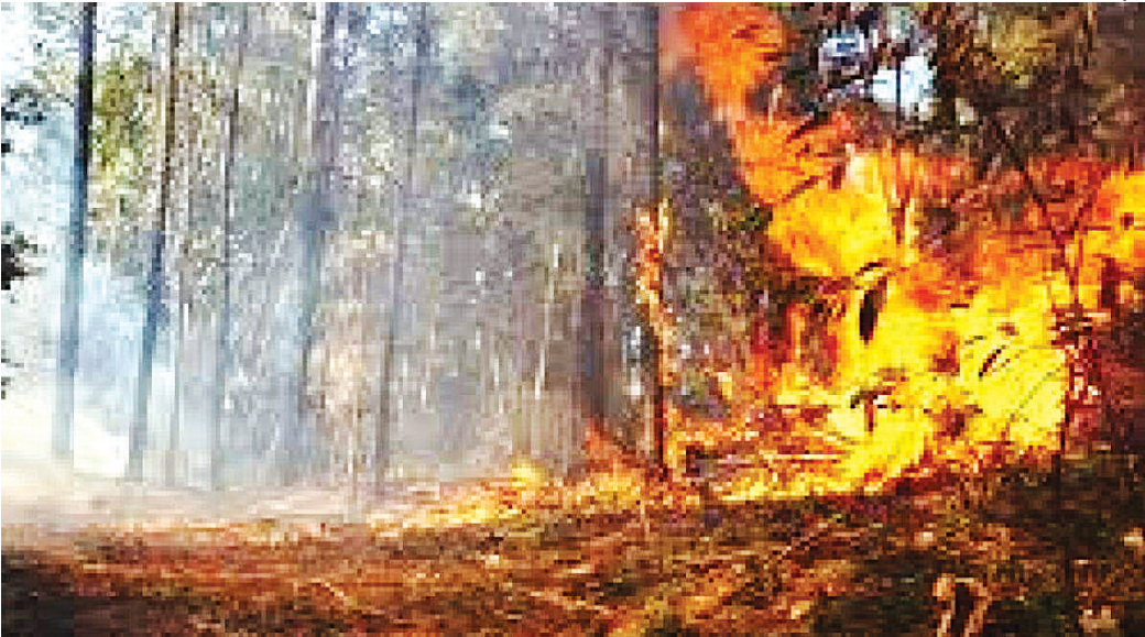
Em quase todo o estado a umidade relativa do ar atingirá níveis críticos e até abaixo dos 30%