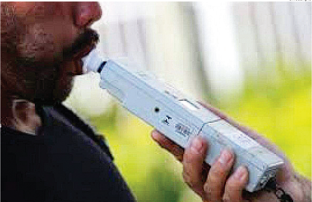
A operação contra alcoolemia registrou 3 recusas de motoristas ao teste do bafômetro

As operações da última semana aconteceram em 30 cidades do estado: Álvares Machado, Araraquara, Barrinha, Bauru, Colina, Cotia, Dracena, Fernandópolis, Guarulhos, Indaiatuba, Itapeva, Itapevi, Itu, Marília, Mongaguá, Ourinhos, Penápolis, Pindamonhangaba, Praia Grande, Registro, Ribeirão Preto, São Caetano do Sul, São José do Rio Preto, São Paulo, Sertãozinho, Sorotiba, Taubaté, Tupã, Vargem Grande do Sul e Várzea Paulista. No total, foram 21.596 veículos fiscalizados, resultando em 467 infrações, sendo 451 recusas ao teste do bafômetro, 14 autuações por direção sob efeito de álcool e outras duas por crime de trânsito - aplicadas quando o condutor dirige embriagado.