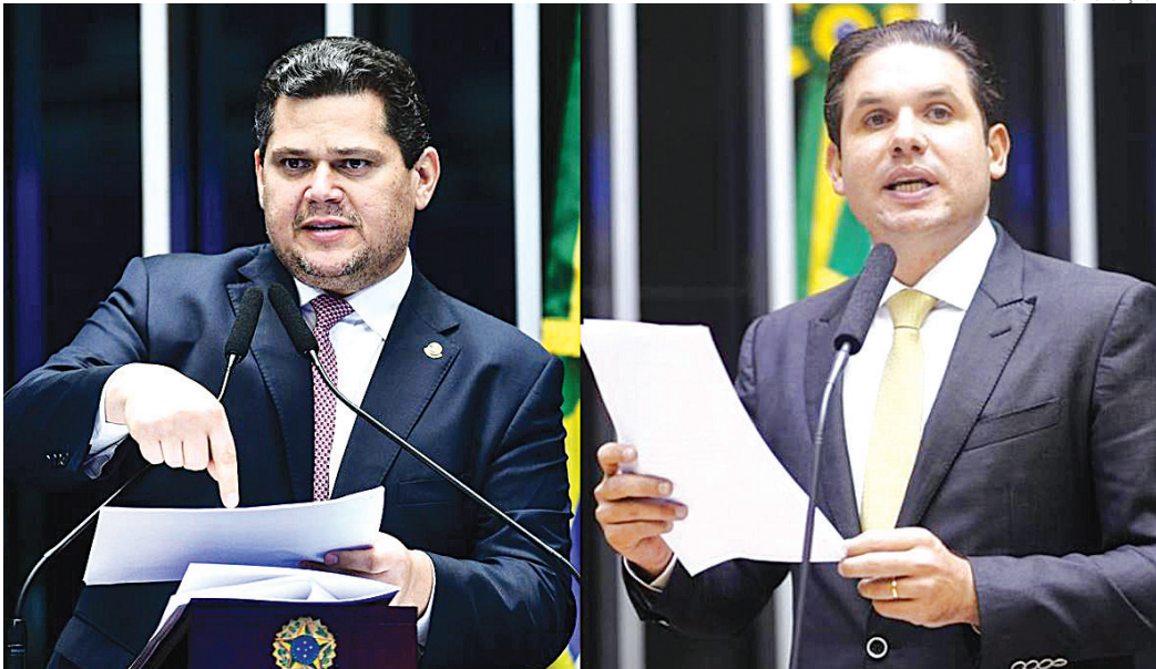
Motta e Alcolumbre defendem a soberania nacional e foram contra as medidas de Trump

“Vejo nesse momento de agressão ao Brasil e aos brasileiros, isso não é correto. E temos que ter firmeza, resiliência, e tratar com serenidade essa reação. Buscar estreitar os laços e fazer as coisas acontecerem em defesa dos brasileiros”, disse Alcolumbre no vídeo.