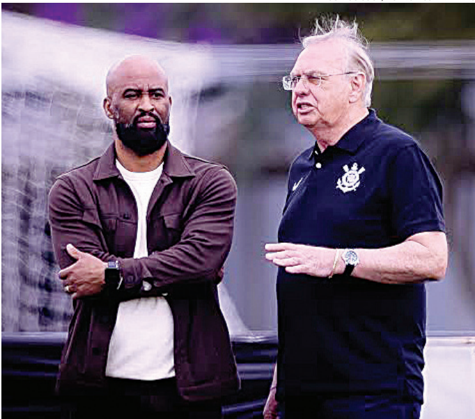
A diretoria defende que essa foi uma solução emergencial

O adiantamento foi feito junto à Globo, detentora