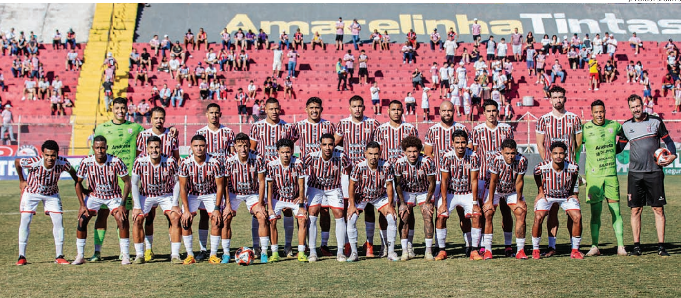
O Galo enfrenta o Guarani em busca da recuperação

Arquibancada R$ 15,00 | Meia-entrada R$ 30,00 | Inteira Cadeira Coberta R$ 25,00 | Meia-entrada R$ 50,00 | Inteira Visitante R$ 30,00 | Inteira R$ 15,00 | Meia-entrada.