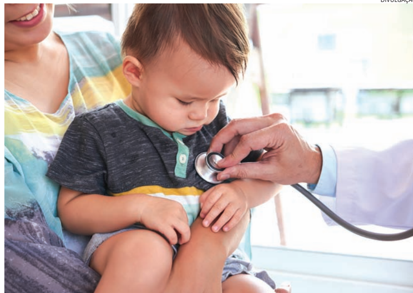
Crianças são mais vulneráveis a doenças respiratórias nesta época do ano

O médico explica que esses casos podem evoluir para a chamada Síndrome Respiratória Aguda Grave (SRAG), condição que pode exigir internação hospitalar e, em situações mais severas, levar à morte. Segundo o especialista, em caso de dúvida sobre a intensidade dos sintomas, a orientação