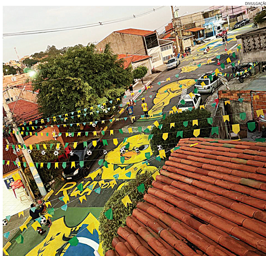
Na Rua Cizídio Soares dos Santos, em Várzea Paulista, os preparos já começaram