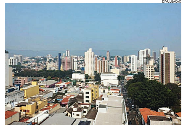
Para esta terça (9), a previsão indica mínima de 11°C e máxima de 23°C

chuva tende a continuar em Jundiaí, ainda de acordo com o Inmet. Os termômetros também devem subir um pouco mais, para mínima de 15°C, mas a máxima deve cair a 18°C. Para a sexta, apesar de haver previsão de muitas nuvens, não deve chover e termômetros ficarão entre 15°C e 23°C.