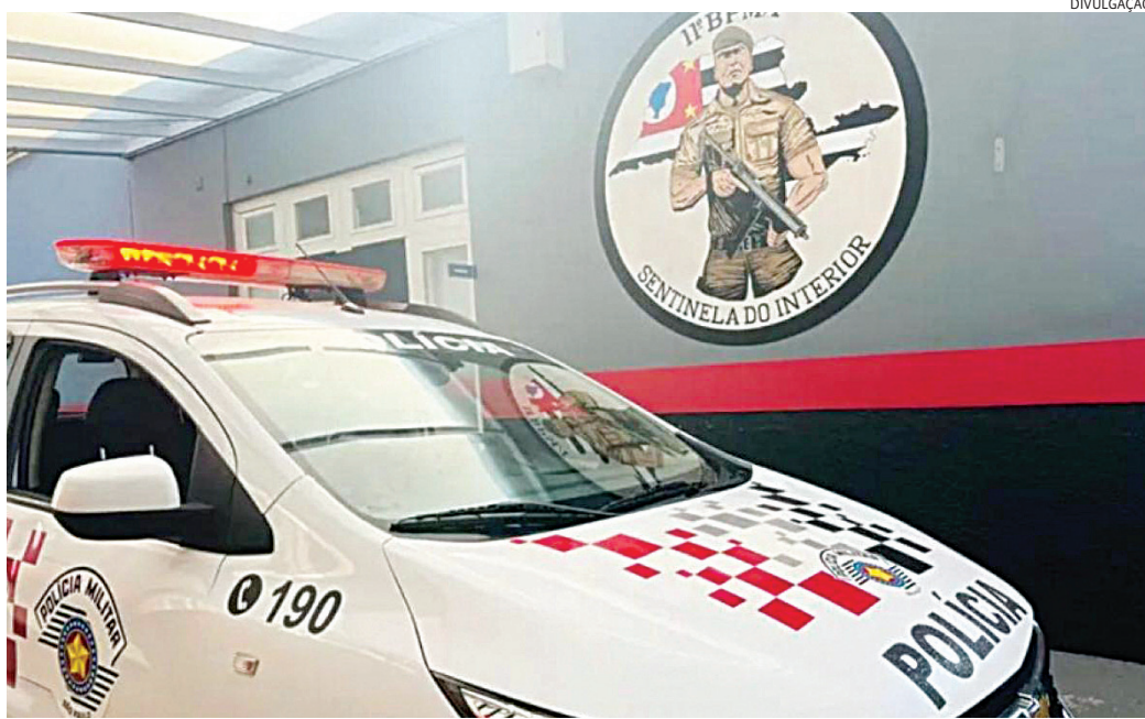
Ele foi preso após trabalho de inteligência do 11º Batalhão de Jundiaí