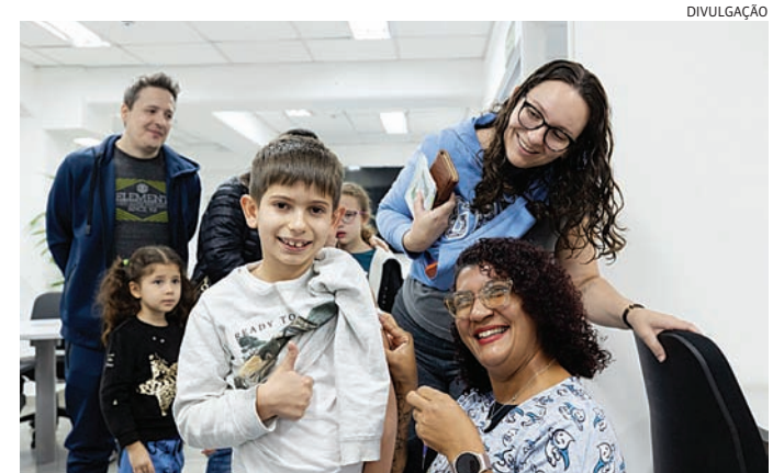
Para receber a dose é necessário apresentar um documento com CPF

A vacina é segura, gratuita e continua sendo a principal forma de prevenção contra casos graves da gripe e suas complicações. A imunização contribui para a redução de internações e ajuda a proteger especialmente os grupos mais vulneráveis, como crianças, idosos, gestantes e pessoas com doenças crônicas.