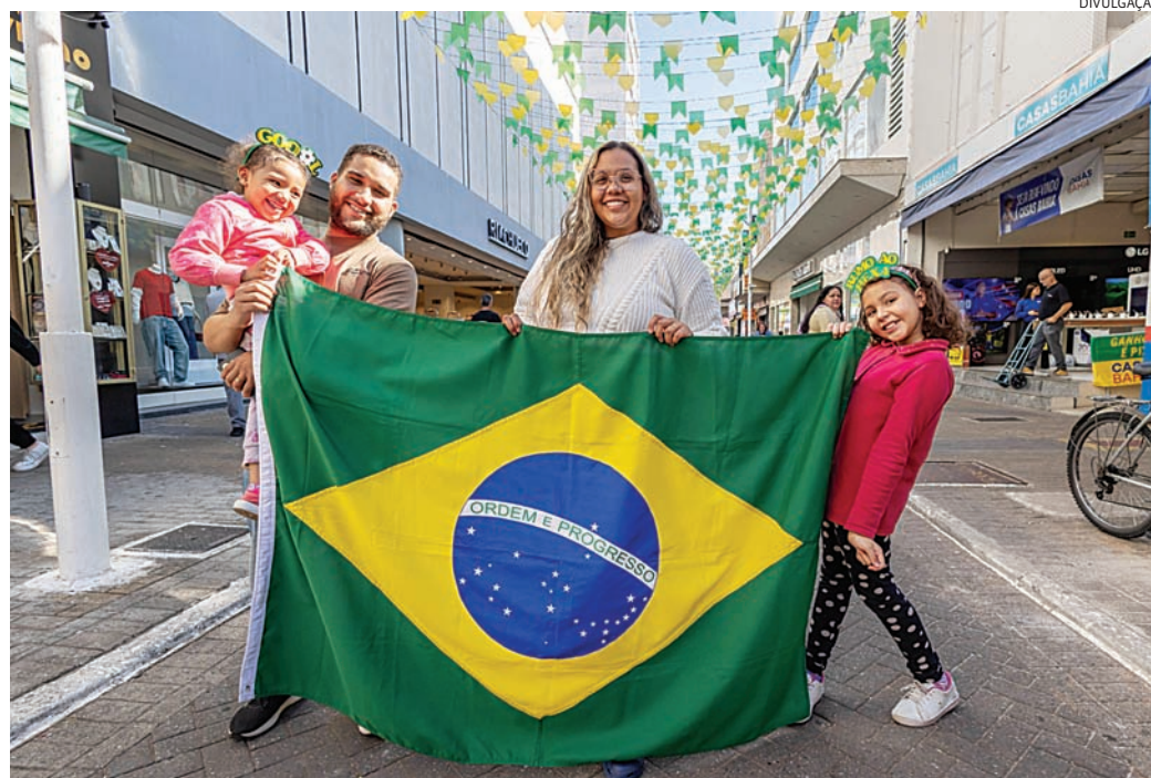
As ruas foram enfeitadas para que o consumidor entre no Clima da Copa