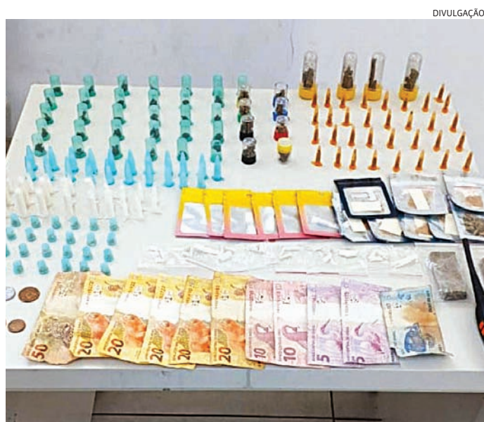
O delegado determinou a prisão do homem e a apreensão das drogas

ções levantadas, as equipes se deslocaram até o endereço e localizaram o suspeito. Ele foi detido e encaminhado à delegacia, onde foi dado cumprimento ao mandado de prisão expedido pela Justiça. O caso segue sob investigação para o esclarecimento completo das circunstâncias do crime.