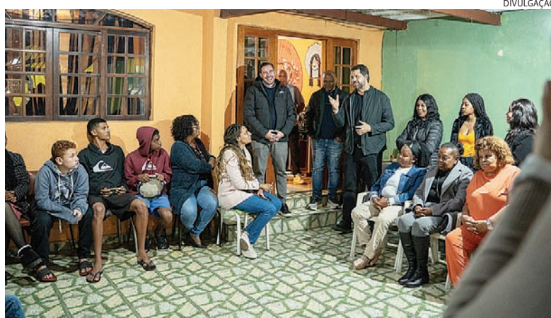
Pré-candidato se reuniu com moradores de Campo Limpo para falar de hospital

A Comissão de Direito Eleitoral da OAB Jundiaí promove hoje a noite (9), às 19h, o lançamento da Cartilha das Eleições 2026. O material reúne informações sobre os principais aspectos jurídicos e práticos do processo eleitoral que será realizado neste ano. O evento será realizado na Casa da Advocacia e Cidadania de Jundiaí, na Rua Rangel Pestana, 636, e é voltado para advogados, estudantes e demais interessados no tema. A participação é gratuita mediante inscrição prévia. Segundo a OAB Jundiaí, a cartilha tem como objetivo reunir orientações sobre os principais aspectos jurídicos e práticos das eleições de 2026, contribuindo para a atualização de profissionais da área e para o fortalecimento da cidadania e da participação democrática.