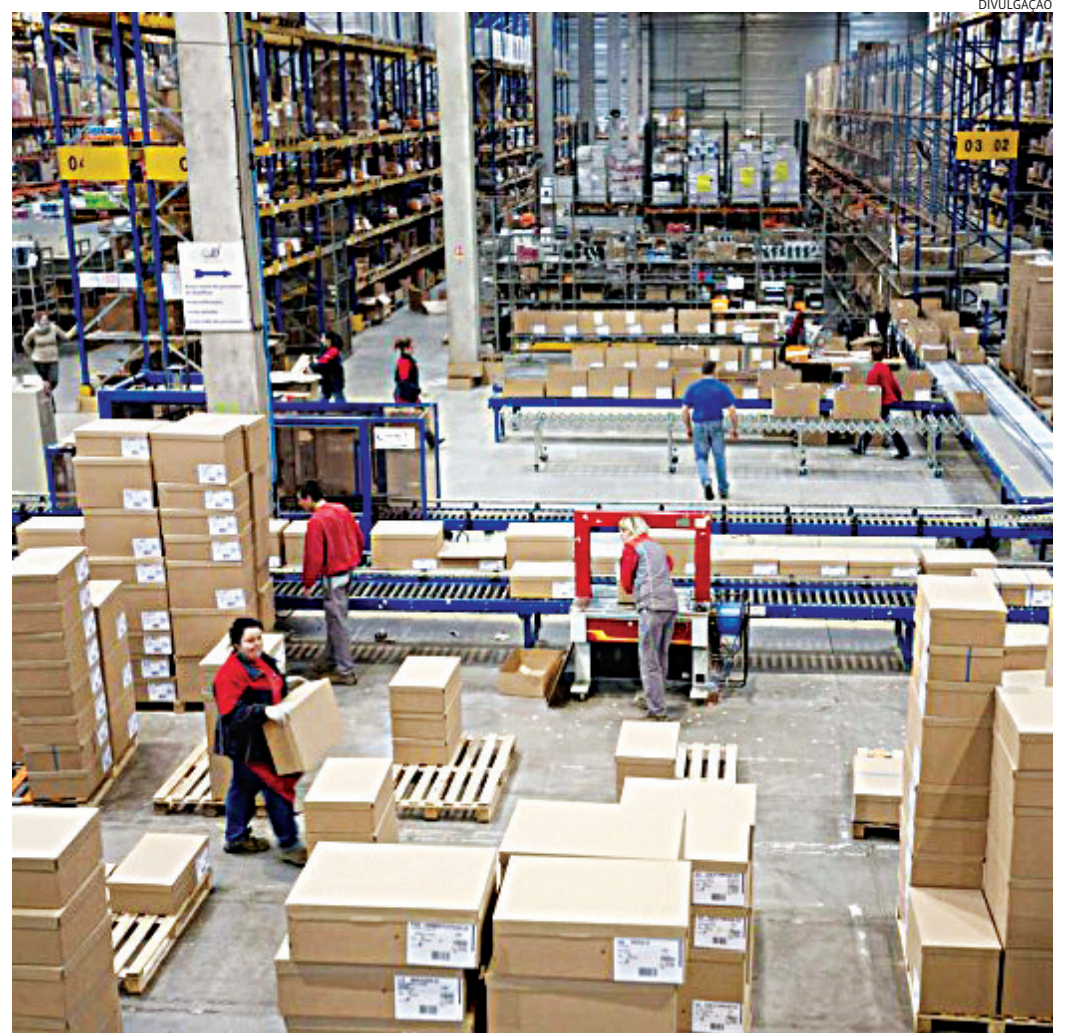
São pelo menos 2.740 que atuam no transporte de cargas e 86 em armazenagem

consumidores e produtores do Brasil, mas o município também conta com conexão ferroviária direta ao Porto de Santos por meio do TIJU (Terminal Intermodal de Jundiaí), um dos equipamentos mais importantes da cadeia logística regional. A integração entre modais permite reduzir custos, aumentar a eficiência operacional e ampliar a competitividade das empresas instaladas na cidade.