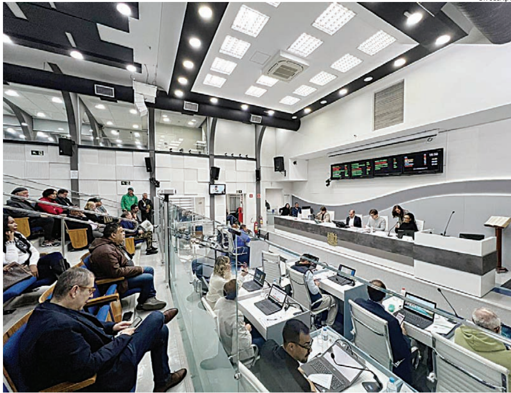
Parlamentares apreciam 19 itens em sessão na Câmara nesta terça-feira (9), a partir das 16h

Segundo a Prefeitura, o projeto busca modernizar os mecanismos de cobrança da dívida ativa e ampliar a recuperação de créditos tributários e não tributários por meio de soluções consensuais. Na justificativa encaminhada à Câmara, o Executivo afirma que a medida pretende aumentar a eficiência arrecadatória, adequar a cobrança ao entendimento recente do Supremo Tribunal Federal sobre execuções fiscais de baixo valor e transformar créditos de difícil recupera-