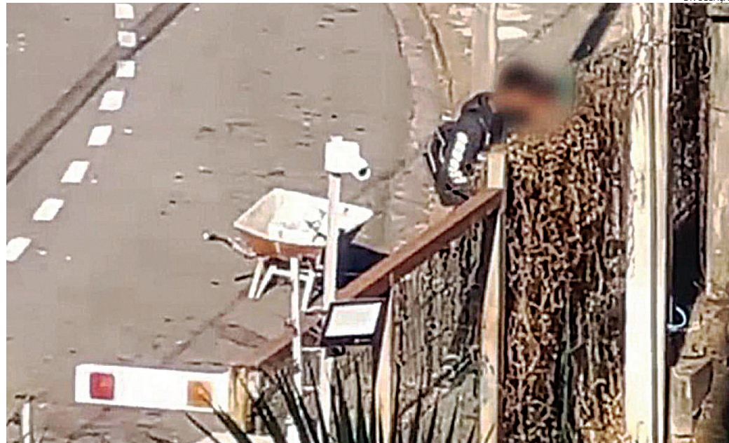
Câmeras de monitoramento flagram a ação criminosa

Após perceberem a movimentação suspeita e verem os homens retirando a fiação, moradores