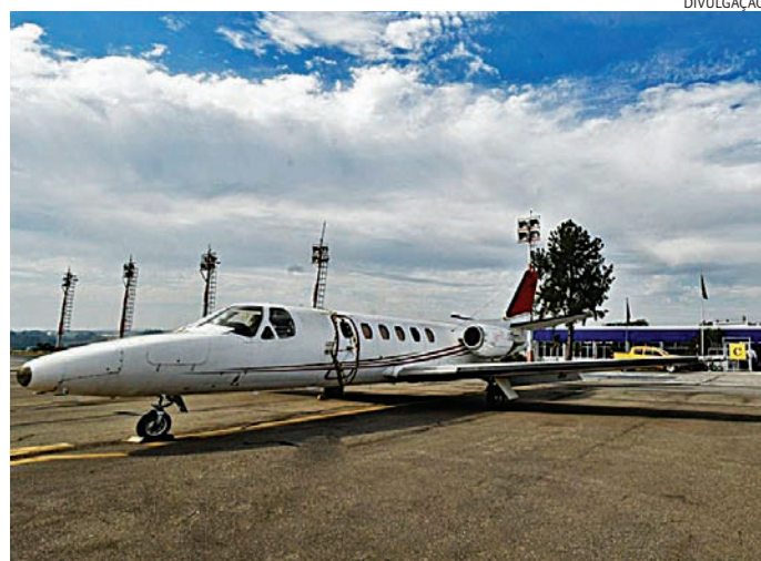
O transporte aéreo ajuda no fortalecimento logístico de Jundiaí

A força do parque industrial impulsiona diretamente outros setores estratégicos da economia, como logística, e-commerce, armazenagem, tecnologia e data