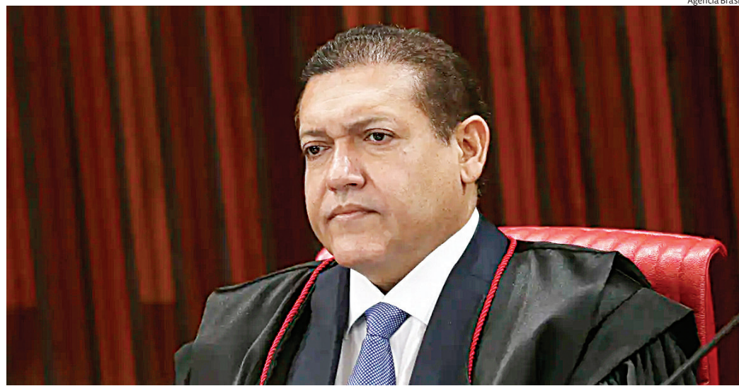
Ministro Kassio Nunes Marques, suspendeu ontem (8) a divulgação de pesquisa Atlas/Bloomberg

ex-presidente Jair Bolsonaro (PL) afirmou que não se trata de discordância metodológica, mas de possível indução