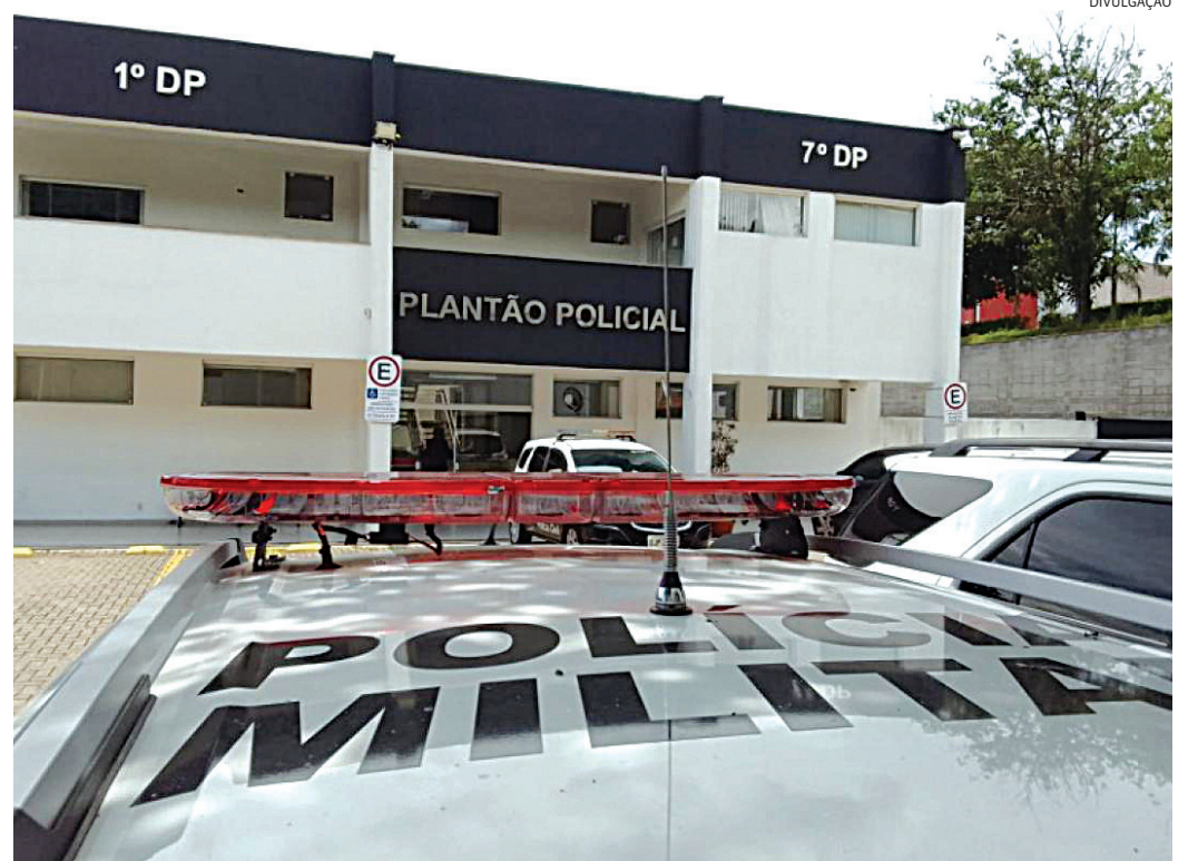
Ambos foram conduzidos ao Plantão, onde o homem foi preso

los e foi necessário entrar na casa com autorização da esposa. Ambos foram conduzidos ao Plantão Policial, onde o homem foi preso em flagrante por violência doméstica.