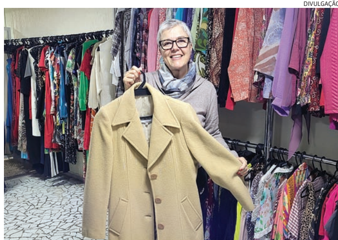
Os produtos passam por uma curadoria cuidadosa das voluntárias

No Bazar, os visitantes encontram uma grande variedade de itens novos e usados em bom estado, como roupas, calçados, acessórios, roupas de cama, mesa e banho, louças, utensílios domésticos, brinquedos, livros e muito mais. Todos os produtos passam por uma curadoria cuidadosa das voluntárias antes de serem disponibilizados para venda. Os preços são a partir de R$ 3 e o pagamento pode ser feito em dinheiro, Pix ou cartão de débito. O