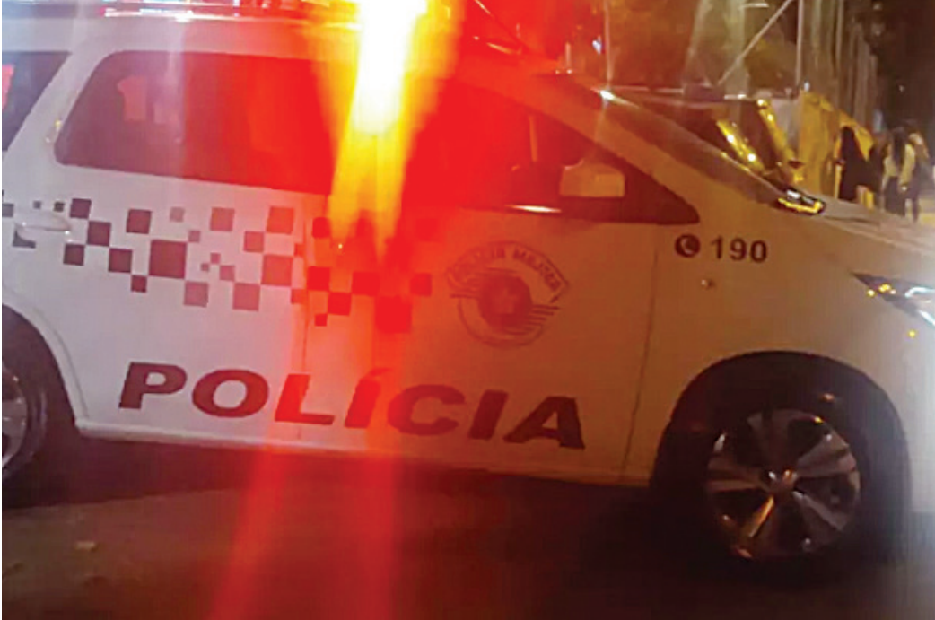
O caso foi atendido pela Polícia Militar, que prendeu o marido

A PM foi acionada pela mulher que, no momento da chegada dos policiais, estava ao lado de fora da casa segurando uma faca. Questionada, ela disse que havia acabado de ser agredida pelo marido e ameaçada com facas, e que isso vem acontecendo há vários anos - eles têm um relacionamento há 10 anos, ou seja, no início ela tinha apenas 12 anos e ele 15. Durante este tempo, segundo seu depoimento à polícia, ele também vem obrigando ela a fazer vídeos de