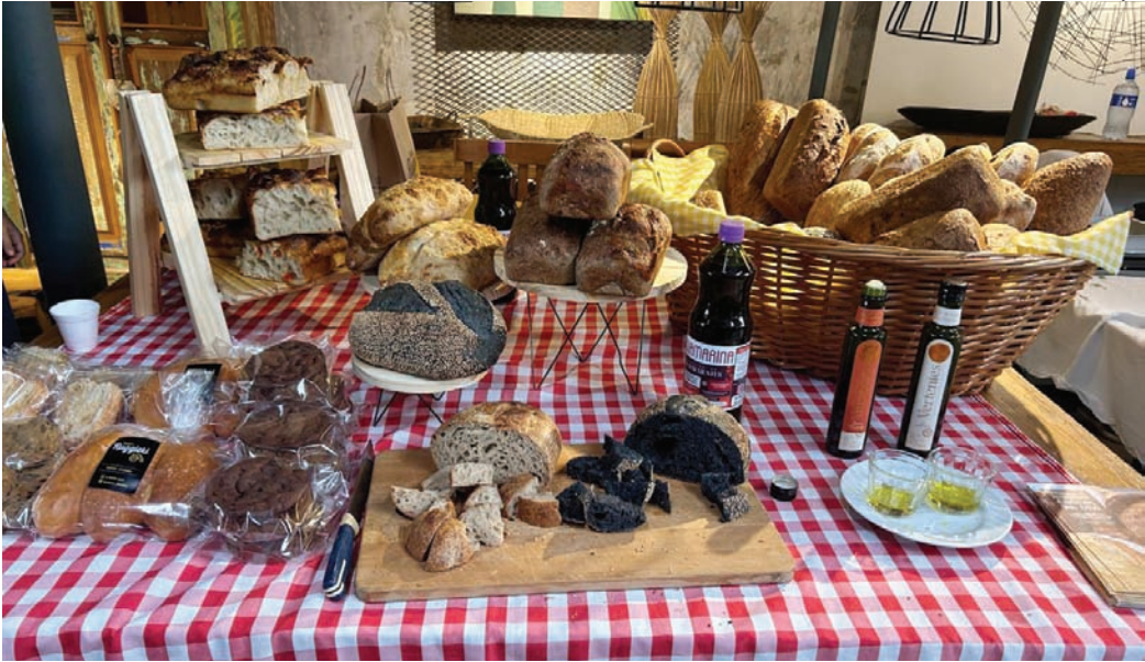
Evento gratuito reúne expositores locais com opções que vão de pães de fermentação natural a cervejas

Por meio do Terraço Gastronômico, o JundiaíShopping reforça seu compromisso