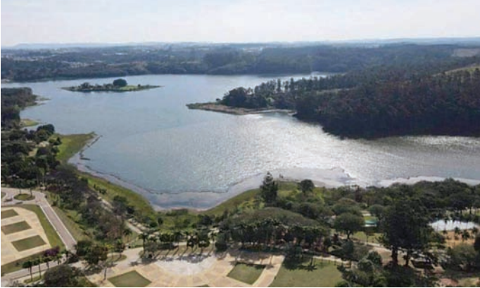
Dia da Água tem foco na preservação dos recursos hídricos

Na quinta-feira (20), o Consórcio PCJ (Consórcio Intermunicipal das Bacias dos Rios Piracicaba, Capivari e Jundiaí) apresentou os resultados alcançados na região e deu início às atividades da 3ª etapa do Projeto Olhos da Serra. Nos quatro anos de execução do Projeto Olhos da Serra, foram identificadas 833 nascentes e 111 cursos d'água na Serra do Japi. A região é conhecida como "Castelo das Águas", por sua grande quantidade de nascentes e cursos d'água. As atividades de conservação da Reserva Biológica (Rebio), plantio de árvores de espécies nativas, educação ambiental e comunicação social com a comunidade, instalação de fossas biodigestoras, monitoramento de invasões na Rebio e da incidência de incêndios florestais, têm propiciado a infiltração de 5.526.245 m³ de água por ano no solo, permitindo o aumento da disponibilidade e da qualidade da água para a região. Na 3ª etapa do projeto, que tem por objetivo a preservação dos recursos hídricos, é prevista a instalação de equipamentos mais avança-