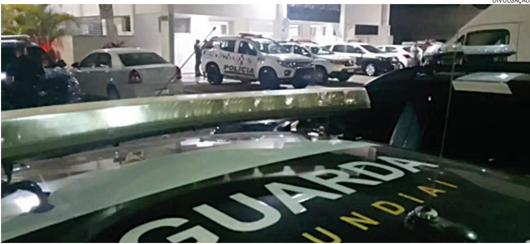
GMs prenderam o ex-namorado por lesão corporal e violência doméstica

A vítima caminhava pela rua, quando se deparou com o ex-namorado. Ele pediu para ir até o apartamento dela para retirar seus pertences, mas, quando entraram no apê, ele a atacou. Ela sofreu várias lesões, inclusive defensivas. Os guardas então o abor-