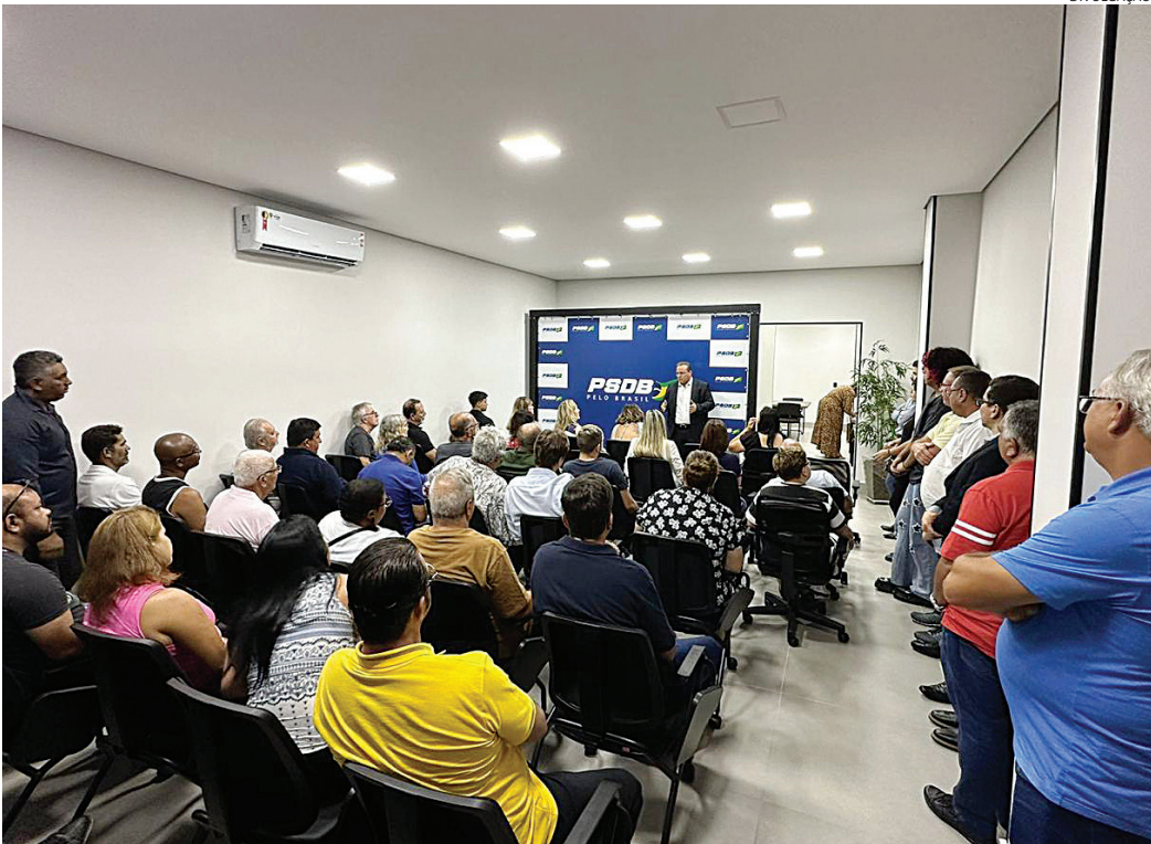
PSDB segue recebendo filiações em Jundiaí e conversando com lideranças