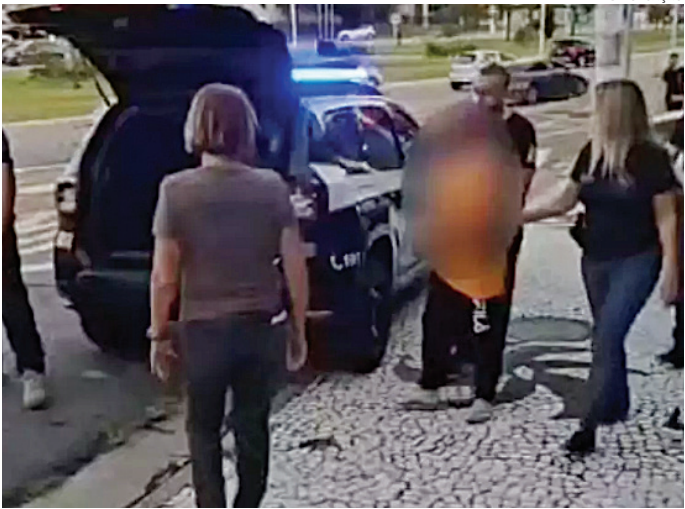
O tio foi preso na quinta-feira e, nesta sexta, foi levado para o CDP

Logo no início desta quinta-feira, foi iniciada a operação Confido, sendo cumprido o mandado de busca, que resultou na localização de vasto material pornográfico infantil