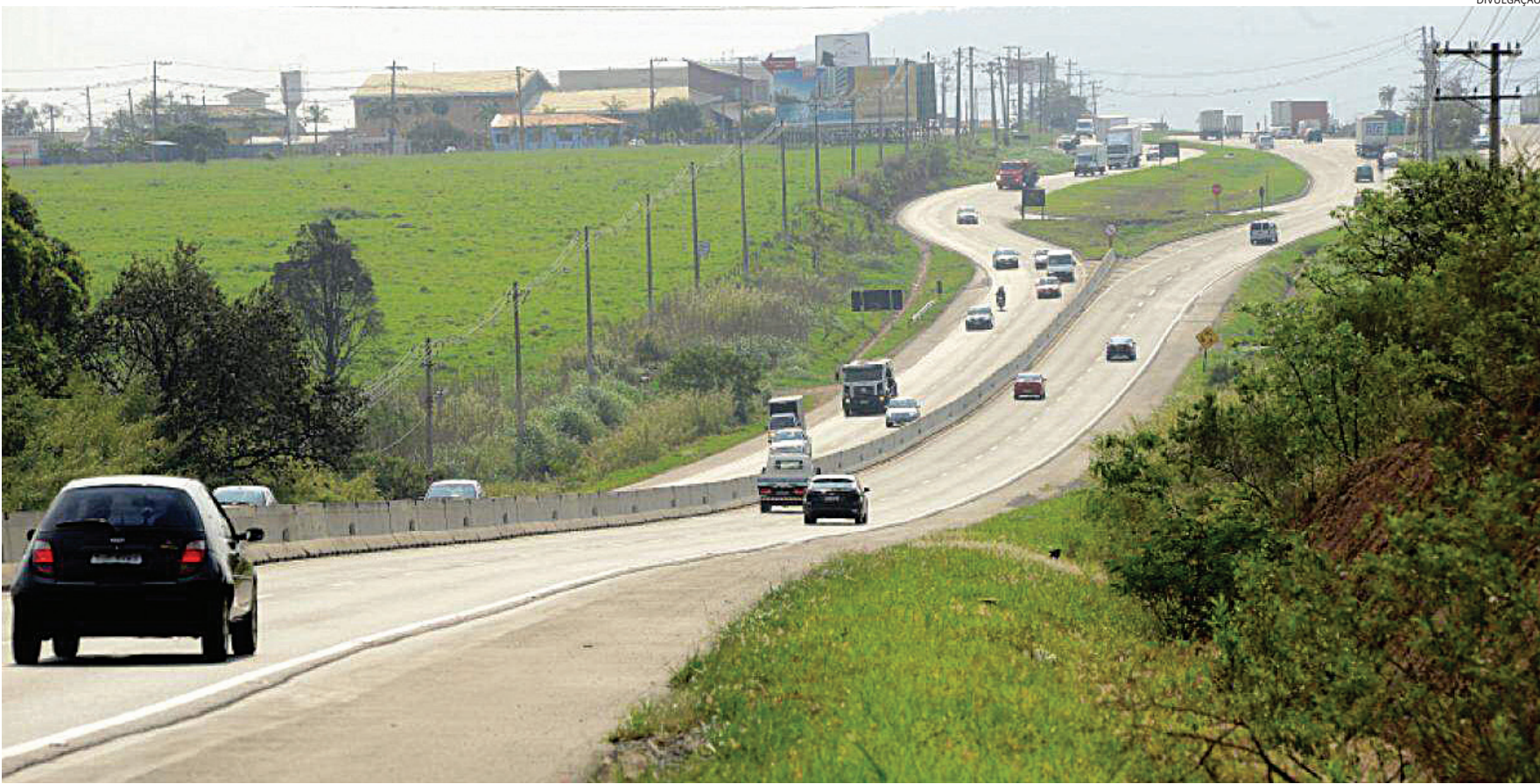
A rodovia Hermenegildo Tonolli é margeada por indústrias e a falta de passarelas leva risco constante aos pedestres que precisam atravessar diariamente

Questionada, a Prefeitura de Jundiaí reforça que a responsabilidade sobre a rodovia é do DER. Em nota, a prefeitura informa que a Hermenegildo Tonolli é uma via sob jurisdição es-