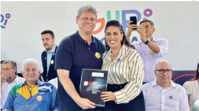
Prefeita de Jarinu foi até Campinas para encontrar governador

O PSB de Itupeva realiza o Congresso Municipal no dia 29 de março, às 10 horas, na Câmara Municipal. Durante o evento será realizada a eleição do diretório e