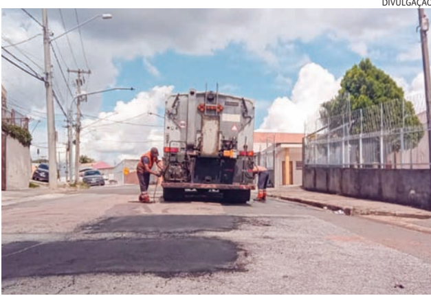
As equipes tapam ao menos 100 buracos por dia

Além da operação tapa-buracos, a administração municipal também executa outras ações de zeladoria, como limpeza de ruas, poda de árvores e manutenção de calçadas. O cronograma das ações pode ser conferido no site da prefeitura.