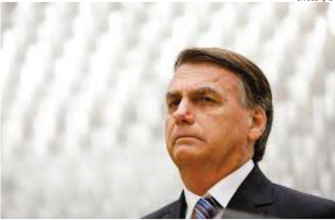
Bolsonaro teria pedido que seu filho Eduardo retornasse ao Brasil

Para a sua decisão, pesaram três pontos: primeiro, a família, ele não queria se afastar dos filhos e da esposa; segundo, temia decisões duras do STF contra ele, caso consiga articular retaliações do governo americano à corte; e, por fim, acredita que sua atuação por essas eventuais