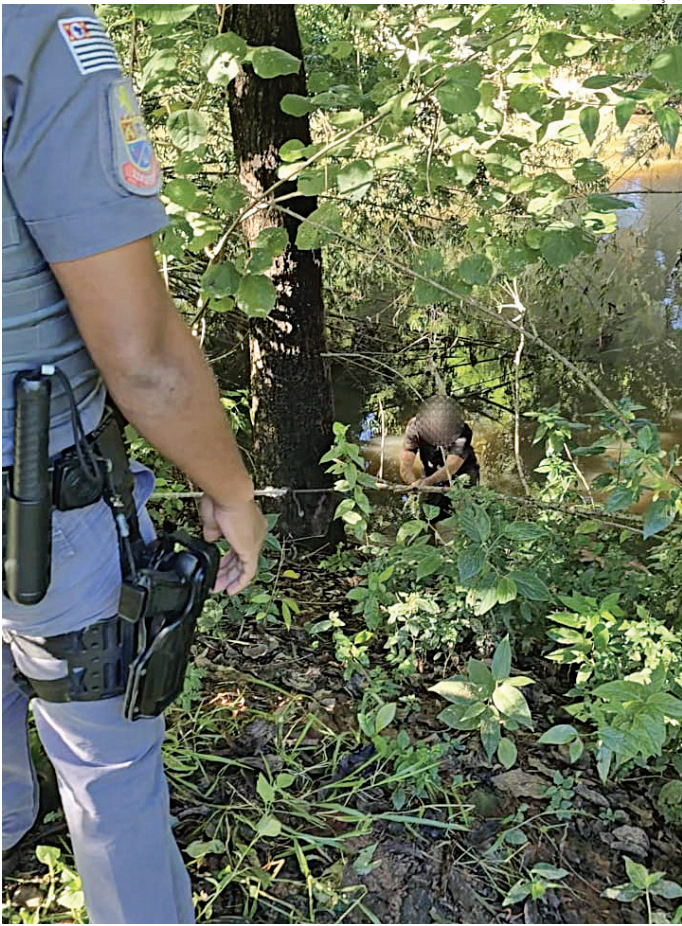
Os PMs o puxaram de dentro do rio utilizando uma corda

Os policiais logo jogaram uma corda para que ele pudesse se segurar e então o puxaram para fora. “Ele contou que havia brigado com o namorado e por isso