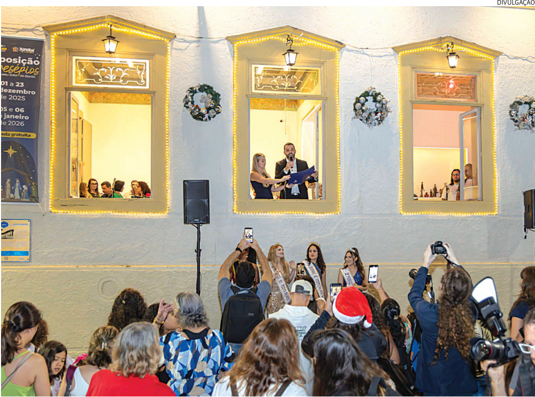
As atrações prosseguem até dia 20 de dezembro incluindo corais e parada natalina