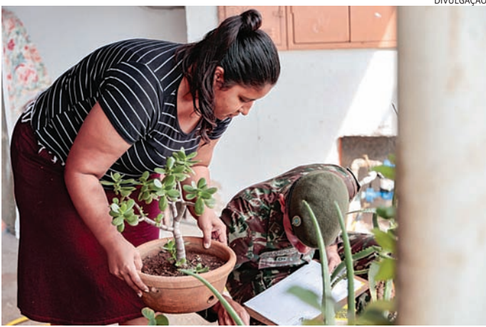
As equipes contam com o apoio da população para fazer as vistorias

clo de vida de apenas 45 dias, uma fêmea pode colocar até 450 ovos. Dentro de uma residência, ela é capaz de picar até cinco pessoas no mesmo período alimentar.