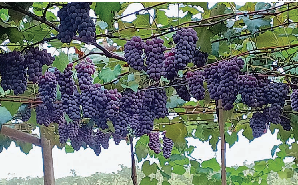
Apesar de atrasada, safra da uva é animadora e deve superar números do último ciclo

quantidade exata, pois quadras mais novas produzem mais as mais velhas produzem menos”, explica.