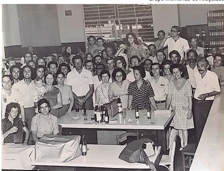
Grupo Memórias de Araçatuba