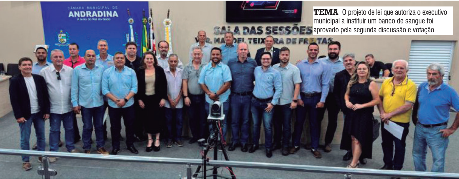
TEMA O projeto de lei que autoriza o executivo municipal a instituir um banco de sangue foi aprovado pela segunda discussão e votação

As Sessões da Câmara contam com transmissão ao vivo no canal aberto de TV local 18.3, no canal Câmara Birigui no YouTube e na página facebook.com/camarabirigui. Também é possível acessar a transmissão na página inicial deste site. Terminada a Sessão Ordinária, a gravação audiovisual do evento fica disponível no YouTube.