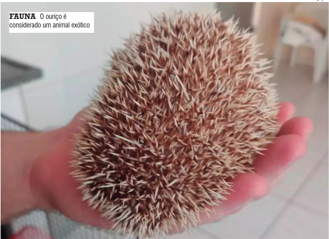
FAUNA O ouriço é considerado um animal exótico

do infrator o Auto de Infração Ambiental com multa simples de R$ 2,8 mil, referente ao ato de introduzir o animal em outro habitat, e valor proporcional à quantidade. O autuado foi orientado quanto à necessidade de comparecer na data e hora agendados para o atendimento ambiental.