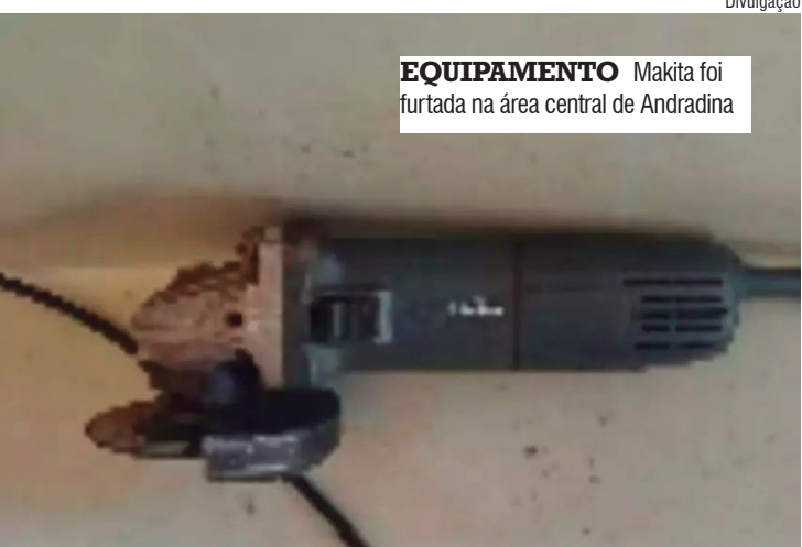
EQUIPAMENTO Makita foi furtada na área central de Andradina

A equipe realizou diligências pela área central e localizou o suspeito na rua Guaraçaí, ainda na posse do objeto furtado.