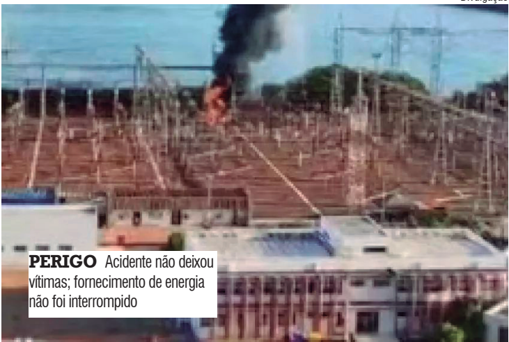
PERIGO Acidente não deixou vítimas; fornecimento de energia não foi interrompido

A explosão ocorreu em um transformador, situado na subestação da usina, pertencente à ISA Companhia de Transmissão de Energia Elétrica Paulista (CTEEP). A CTEEP informou que o fogo foi rapidamente controlado e que todas as medidas necessárias