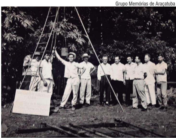
Grupo Memórias de Araçatuba

“A gente quer diversificar geograficamente, projetos nas várias regiões do país. A gente está buscando esse critério de diversidade geográfica, principalmente, porque cada região tem características que exigem soluções diferentes”, explicou o secretário do MME. Agência Brasil