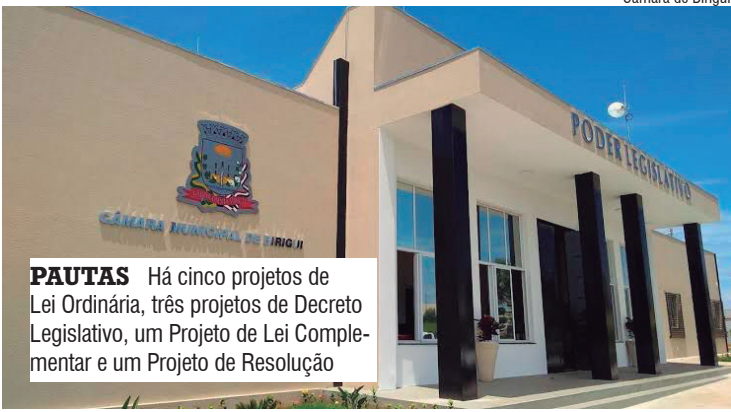
PAUTAS Há cinco projetos de Lei Ordinária, três projetos de Decreto Legislativo, um Projeto de Lei Complementar e um Projeto de Resolução