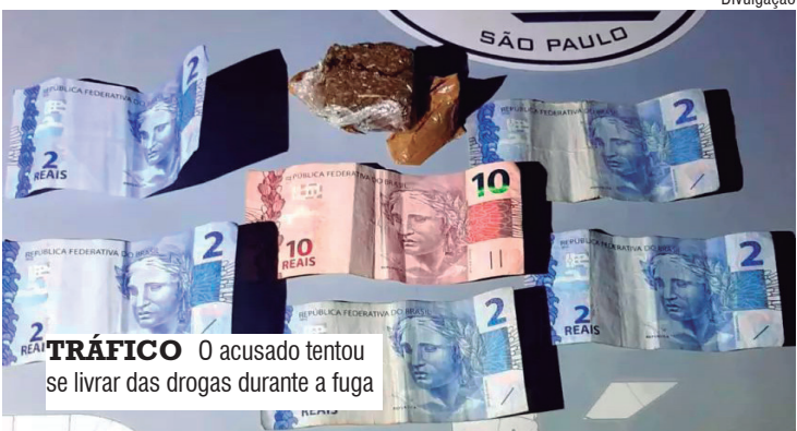
TRÁFICO O acusado tentou se livrar das drogas durante a fuga

Policiais realizavam patrulhamento preventivo quando avistaram dois indivíduos que, ao notarem a equipe, fugiram para lados opostos. Um deles, o pintor, pulou por muros e telhados e entrou em uma residência, onde foi detido. Ele já era conhecido no meio policial pela prática do tráfico.