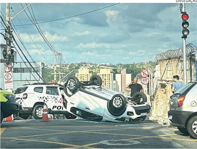
O trânsito não foi afetado pelo capotamento

formou que a via permaneceria interditada até a liberação pela Polícia Militar, que foi ao local para apurar as circunstâncias do acidente.