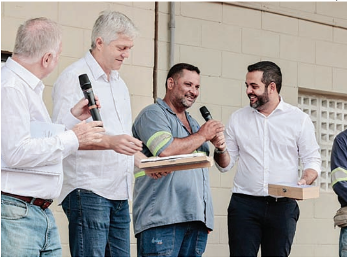
Início de mandato da nova gestão tem sido de diálogo e escuta

A prefeitura de Jarinu vai promover a 1ª Conferência Municipal do Meio Ambiente. Essa é uma das etapas da 5ª Conferência Nacional do Meio Ambiente e tem como objetivo incentivar a ampla participação da população na construção de propostas para enfrentar os desafios climáticos, além de eleger delegados que representarão o município na etapa estadual. Durante a Conferência Municipal, os participantes poderão apresentar propostas contra os efeitos causadores da emergência climática para os cinco eixos definidos pela 5ª Conferência Nacional do Meio Ambiente: mitigação; adaptação e preparação para desastres; justiça climática; transformação ecológica; e governança e educação ambiental. Qualquer jarinuense maior de 16 anos pode participar da conferência e votar nos delegados.