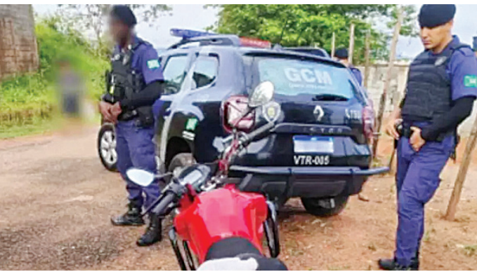
Os guardas localizaram a moto abandonada e ninguém foi preso

os ladrões teriam fugido sentido Campo Limpo Paulista, as viaturas em patrulhamento foram colocadas em ação com vistas aos criminosos. Pela região do Borujuru, os agentes localizaram a moto abandonada. A vítima foi acionada e compareceu na delegacia para reaver seu bem.