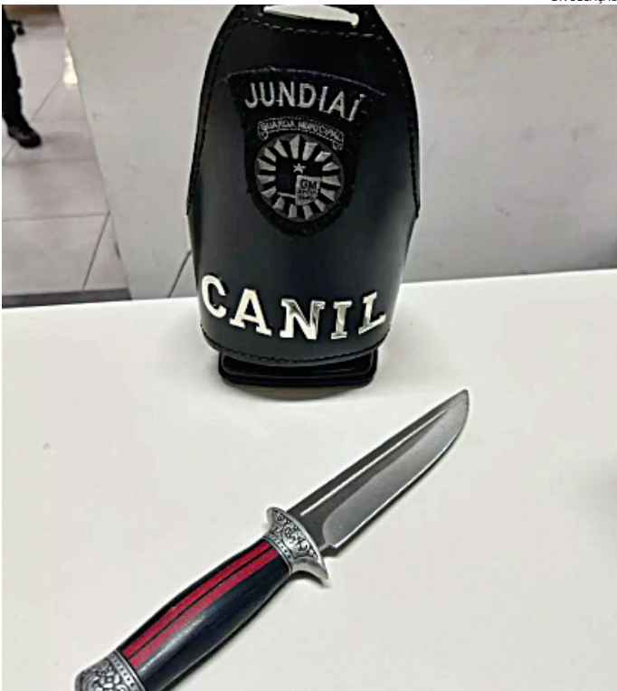
A faca de caça foi apreendida pelos guardas municipais

sido causados por ele. Ainda de acordo com a vítima, ela já estava apanhando há pelo menos três