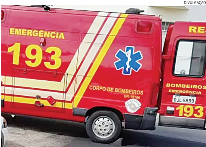
Os bombeiros tiveram dificuldades para resgatá-lo por conta do local

Um homem ficou ferido ao cair de um pé de manga e precisou ser socorrido ao Pronto Socorro, na manhã desta terça-feira (7), em Várzea Paulista. De acordo com o Corpo de Bombeiros, a vítima subiu no pé de manga, próximo a um pesqueiro, por volta das 6h. Pouco tempo depois ele caiu. Não havia ninguém por perto e ele ficou no chão por cerca de três horas pedindo socorro, até