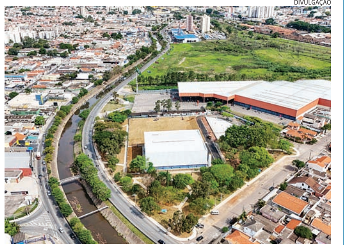
O rio Jundiaí, que corta a cidade, integra a Bacia PCJ

O Conselho de Transição é constituído sempre que há vacância dos prefeitos na presidência e diretoria da entidade devido às eleições municipais. Sua missão é conduzir o processo eleitoral de constituição da nova diretoria e a escolha de um novo presidente, entre os prefeitos das cidades associadas ao Consórcio PCJ, além de propor uma mi-