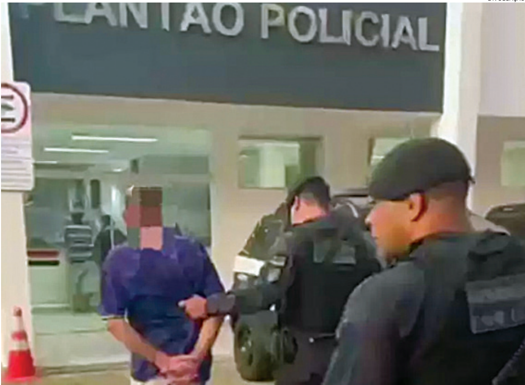
O marido foi conduzido para a delegacia, onde acabou preso em flagrante

Uma mulher com um grande hematoma na testa precisou passar por atendimento no hospital, nesta segunda-feira (6), ao ser socorrida por guardas municipais de Operações com Cães, em Jundiaí. De acordo com ela, o ferimento foi causado pelo marido, que utilizou uma faca para bater nela com o cabo. O marido foi preso em flagrante. A GM recebeu pedido de socorro para atendimento de caso de violência doméstica e, quando os guardas chegaram ao local, a vítima havia saído de casa, sendo encontrado apenas o marido, suspeito de agredi-la. Não muito distante da casa os guardas localizaram a vítima, assustada e com um ‘galo’ na testa, além de várias escoriações e machucados antigos, que ela alegou também terem