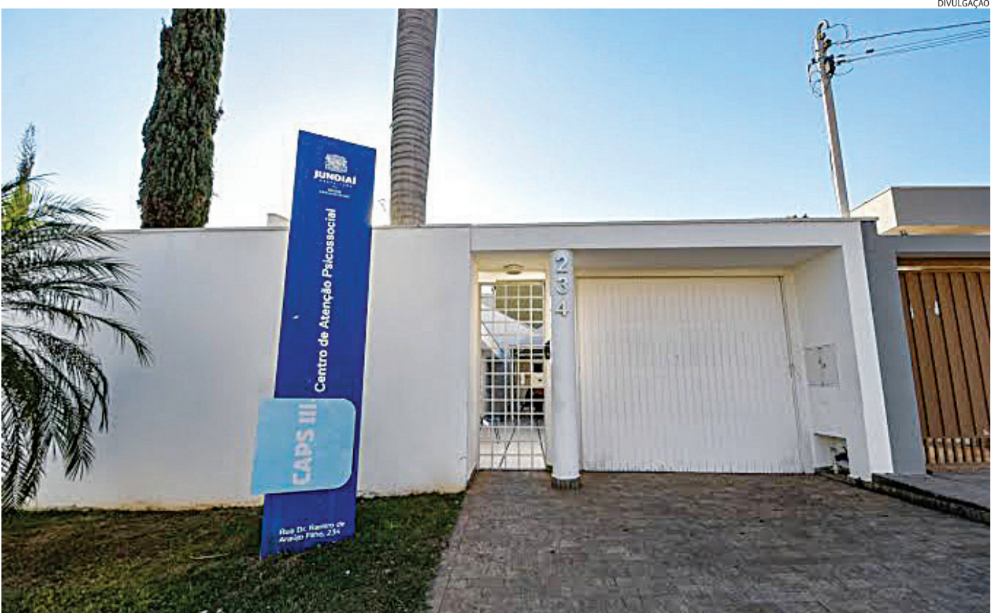
O objetivo dos CAPS é promover a reabilitação psicossocial, integrando a pessoa em todos os aspectos de sua vida