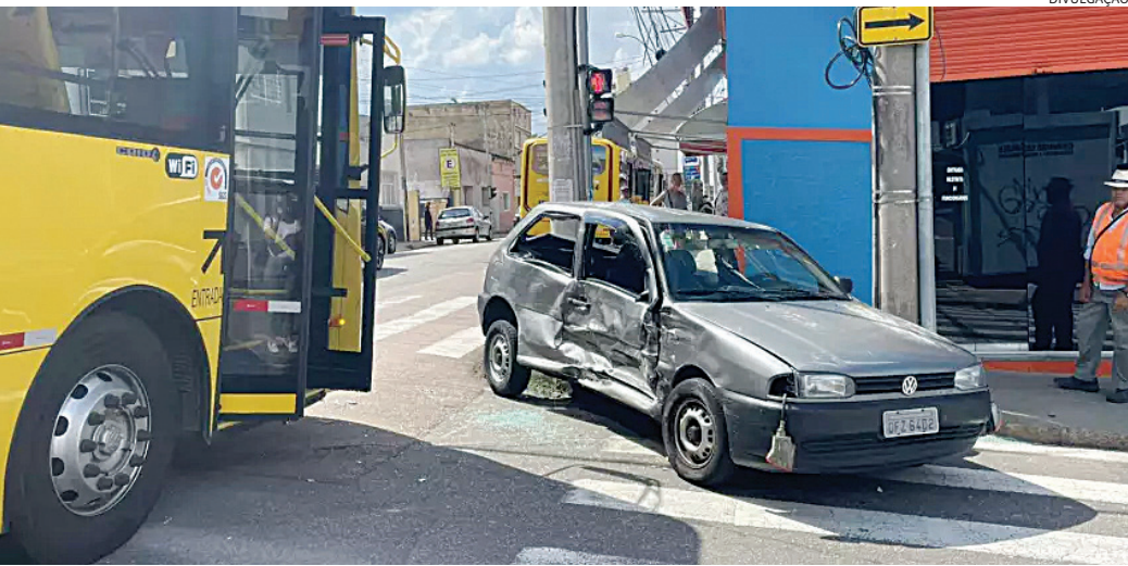
A Rua Marechal Deodoro da Fonseca permaneceu interditada após o acidente