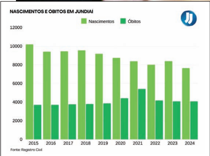
Segundo dados do Registro Civil, no ano passado, apenas 7.645 bebês foram registrados na cidade

40,2% da população de Jundiaí estava na faixa etária de 0 a 24 anos. Já quem tinha 60 anos ou mais era apenas 10,7% do total. Já no ano de 2010, 34,9% dos jundiaíenses tinham 24 anos ou menos, enquanto a população de 60 ou mais já re-