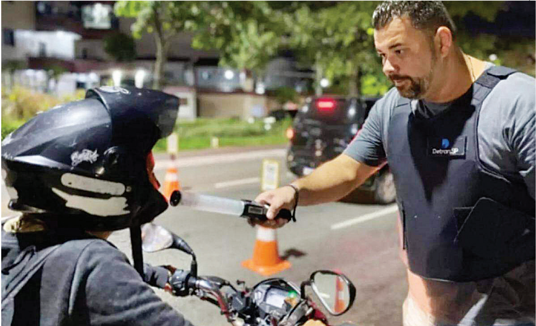
As ações aconteceram durante a última semana e foram promovidas com apoio da Polícia Militar na região; houve 13 recusas

Em ambos os casos, o valor da multa é de R$ 2.934,70 e o condutor responde a processo de suspensão da carteira de habilitação. Se houver reincidência no período de 12 meses, a multa é aplicada em dobro, ou seja, no valor de R$ 5.869,40. Na autuação por direção sob efeito de álcool, quando há nova ocorrência durante o período de suspensão da CNH, além da multa em dobro, o motorista responderá ainda a processo administrativo que poderá culminar na cassação do seu direito de dirigir, se forem esgotados todos os meios de