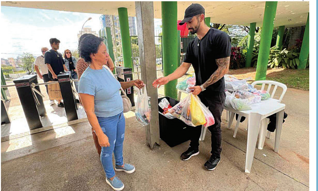
Arrecadações beneficiam famílias em vulnerabilidade de Jundiaí

O ponto fixo de doação é a sede do Funss, localizada na Avenida Manoela Lacerda de Vergueiro, s/n, portão 3, anexo ao Parque da Uva. As doações podem ser feitas de segunda a sexta-feira, das 8h às 17h.