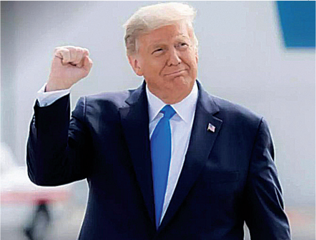
Trump volta a criticar perseguição contra Bolsonaro e censura de Moraes a empresas americanas

Um exemplo é o caso do etanol, de acordo com interlocutores. Os americanos impunham uma tarifa de 2,5% ao produto, elevada a 12,5% após a sobretaxa de 10%. Com o novo anúncio, a porcentagem sobe a 52,5% em agosto. (FP)