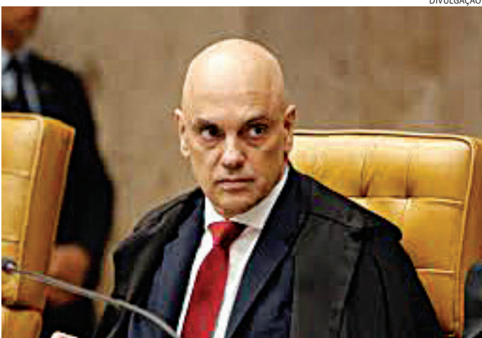
Alexandre de Moraes persegue os Bolsonaros e as big techs, diz EUA

A Prefeitura de Itupeva se reuniu com representantes da CPEL Energia, do CIESP (Centro das Indústrias do Estado de São Paulo), da ACE (Associação Comercial e Empresarial) e empresários do município para de-