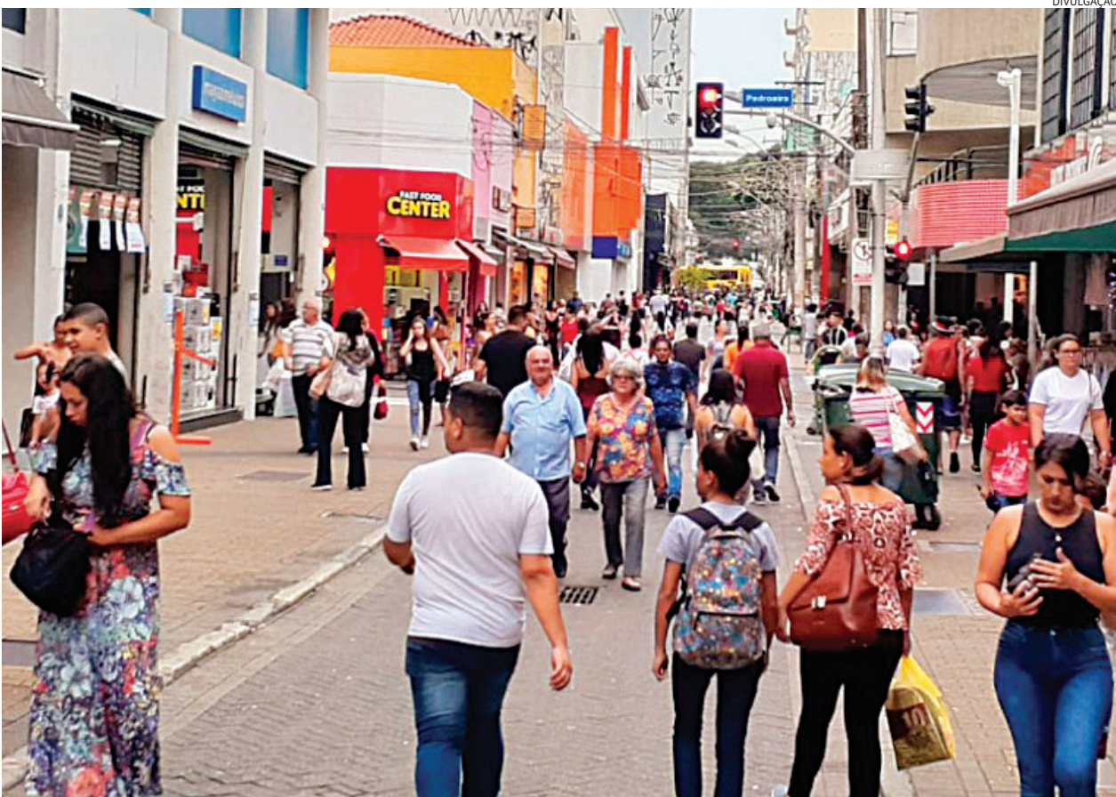
Para a data, no segundo domingo de agosto, indicação é para incrementar vitrines e redes sociais

A expectativa para o Dia dos Pais deste ano é positiva em Jundiaí, com projeção de aumento entre 6% e 8% nas vendas em comparação com 2024. Os produtos mais procurados devem seguir a