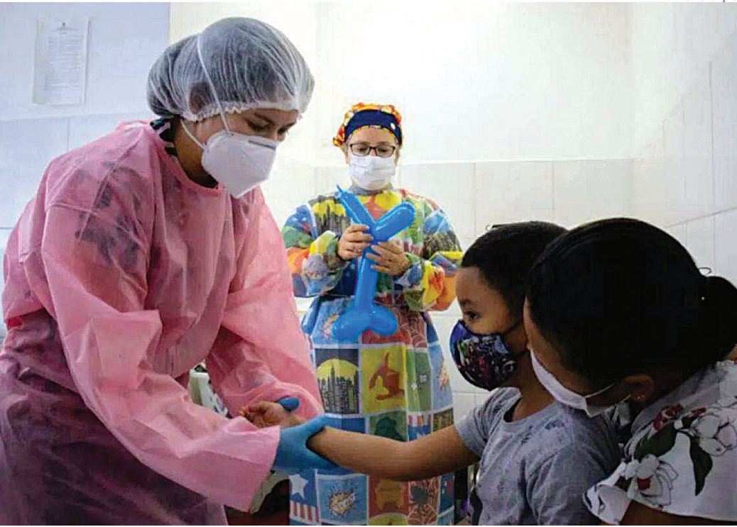
Levantamento aponta evolução dos casos entre 2022 e 2025, com mais de 2,5 mil internações