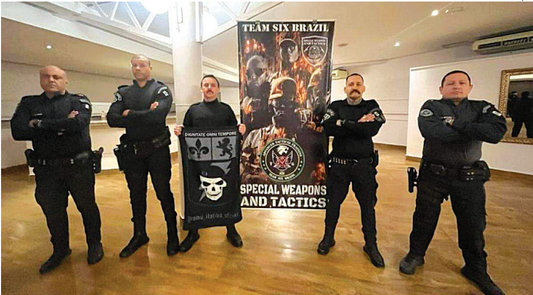
GM's da Romu de Itatiba tiveram cinco dias de treinamento intenso com agentes da polícia de elite