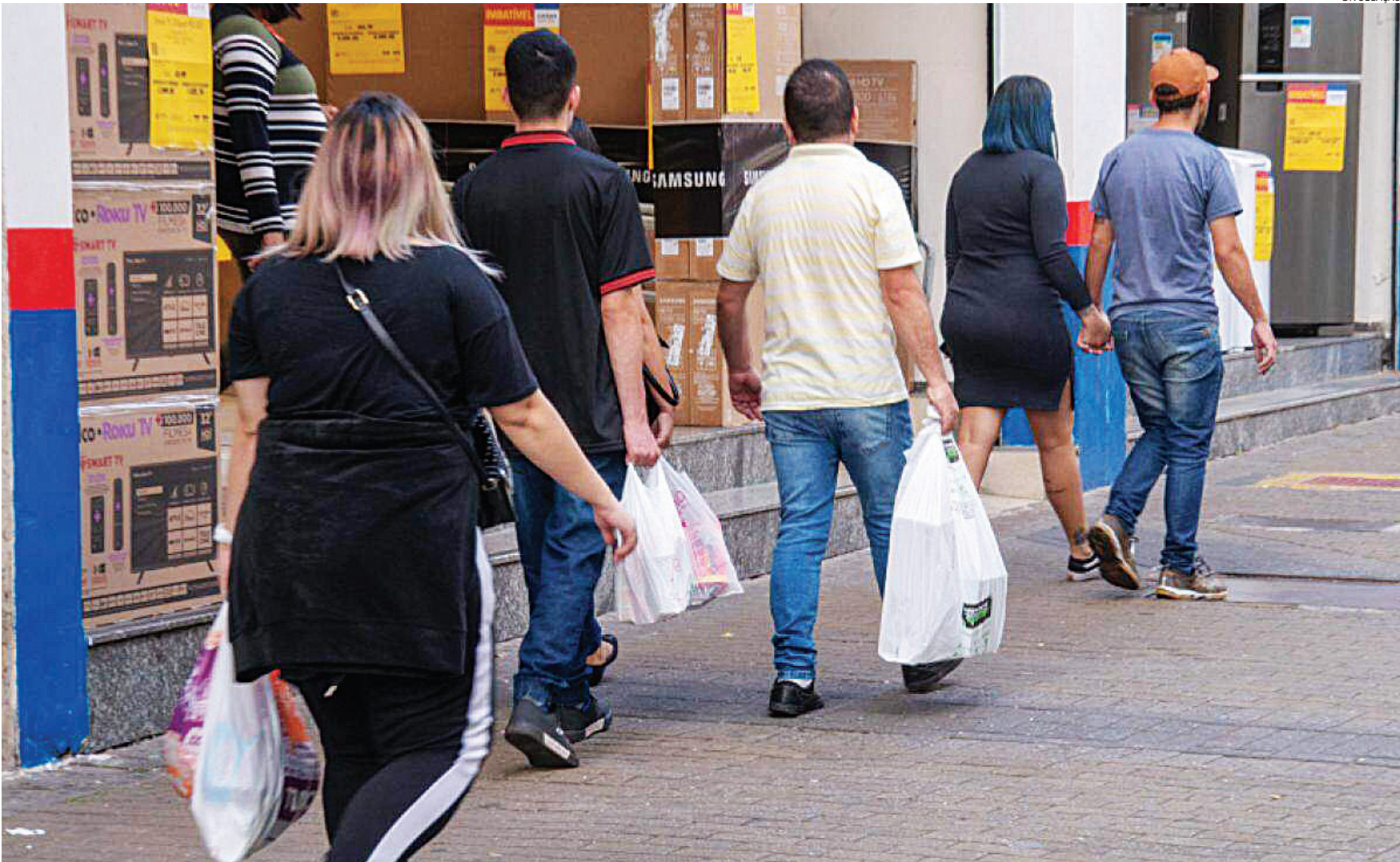
A previsão é que o ticket médio fique entre R$ 160 e R$ 180, superior ao do ano passado

momento, a CDL Jundiaí recomenda que os co-