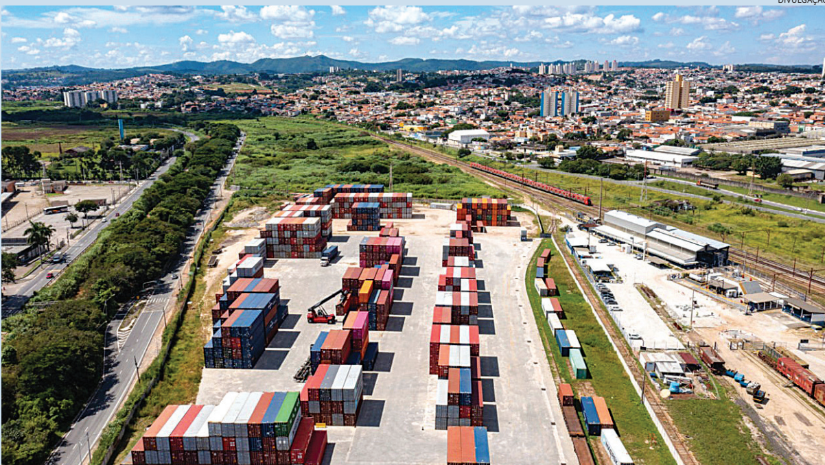
Os destinos mais relevantes das exportações foram Argentina (20,3%), Estados Unidos (19,3%) e Chile (9,3%)

exportações de US$ 1,29 bilhão (+8,5% na comparação interanual) e importações de US$ 4,35 bilhões (+11,8%). Houve déficit de US$ 3,06 bilhões. Cidades 4