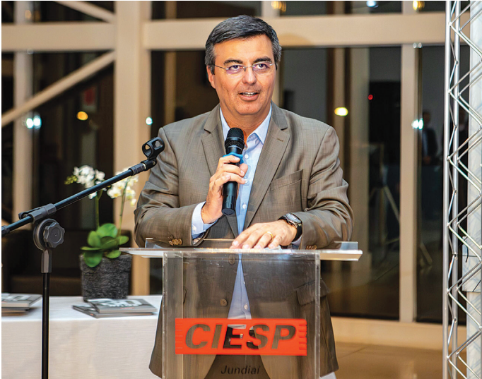
Segundo Rafael Cervone, a Indústria pode contribuir cada vez mais

Os destinos mais relevantes das exportações foram Argentina (20,3%), Estados Unidos (19,3%) e Chile (9,3%). As compras tiveram como principais ori-