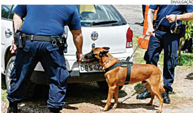
Após ser autuado em flagrante, ele foi levado para o Centro de Triage de Campo Limpo Paulista

anos de maioridade. Desta vez, ele foi pego por guardas municipais de Operações com Cães. Polícia 6