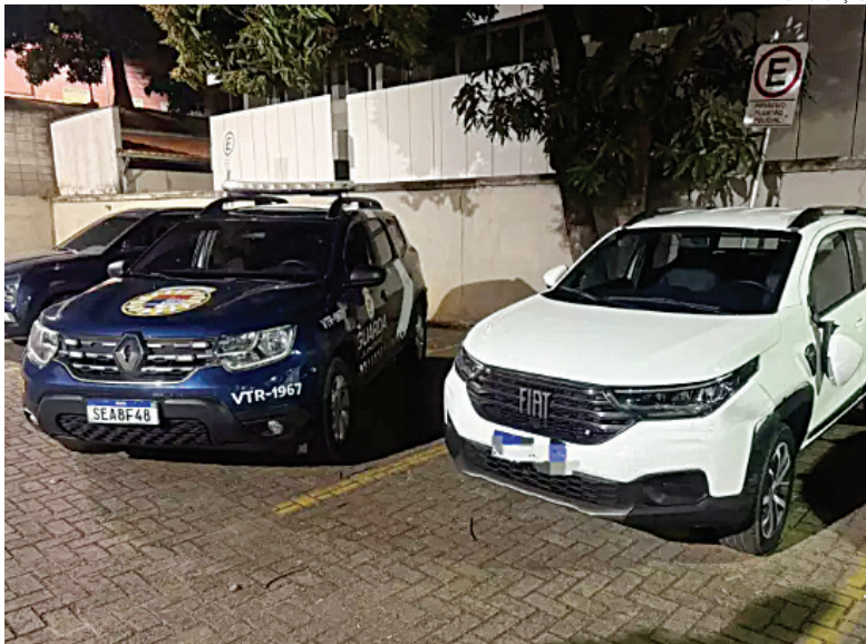
Denúncia afirmou que o carro era produto de crime e estava adulterado

bater em dois carros, nas imediações da rodovia Engenheiro Constâncio Cintra, perímetro de Jundiaí. Na ocasião da fuga, ele chegou a bater em dois carros. A prisão foi feita por guardas municipais. Polícia 6