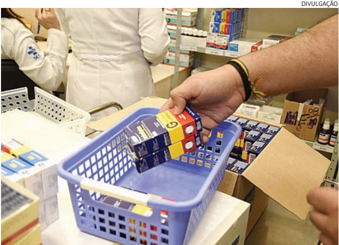
A Prefeitura já solicitou ao Estado a regularização da situação

RESULTADO DAS MATRÍCULAS O mês de janeiro também é o período para fazer a matrícula — para quem hoje estuda em escolas particulares, em outros estados ou quer retornar às salas de aula — e conferir o resultado da pré-matrícula e do pedido de transferência de unidade realizado em setembro. O cadastro e a consulta podem ser feitos na SED (em “consulta pública de matrícula”), nos postos do Poupatempo ou nas escolas. Alunos que estão na rede paulista em 2025 têm a vaga garantida e renovada automaticamente para o próximo ano.