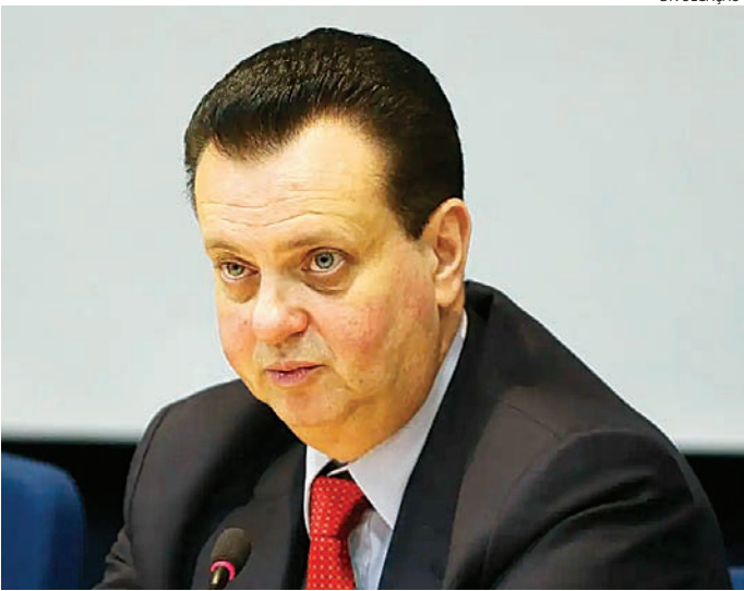
Kassab afirma que o candidato à presidência do PSD é Tarcísio

“Nem no segundo turno o partido fechará a questão. Mas, como eu acredito que o nosso candidato vai para o segundo turno, [...] então