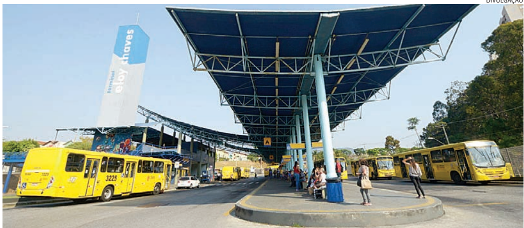
A partir de sábado (13) a nova linha começa a ser experimentada