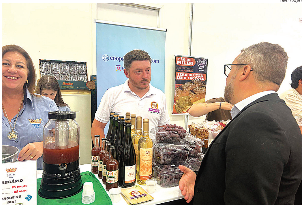
A Niágara foi um dos destaques durante o evento que reuniu empreendedoras da região

As novas tabelas horárias dos ônibus de Jundiá estão disponíveis no site oficial do Sistema Integrado de Transporte Urbano (SITU) e nos aplicativos Cittamobi e Google Maps. Os usuários podem acompanhar, em tempo real, horários, trajetos e localização dos ônibus por meio dessas plataformas. Informes serão afixados nas plataformas das linhas envolvidas e toda a alteração será monitorada para análise dos resultados e possíveis adequações.