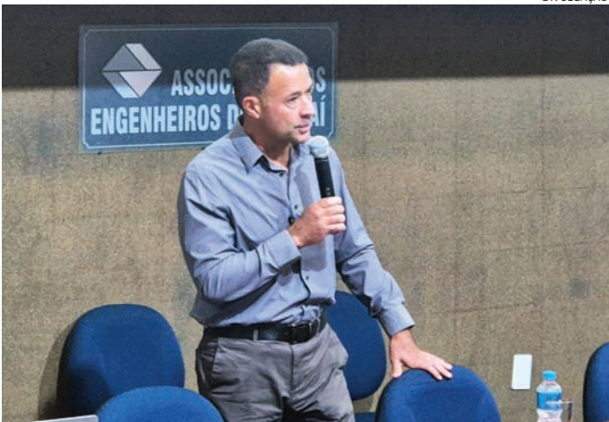
Encontro reuniu os vice-prefeitos da Região e São Paulo para debate

O presidente da Câmara, Hugo Motta (Republicanos-PB), afirmou que a retirada de jornalistas do plenário