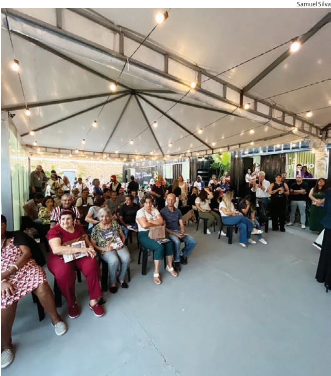
O espaço irá fortalecer a autonomia dos assistidos