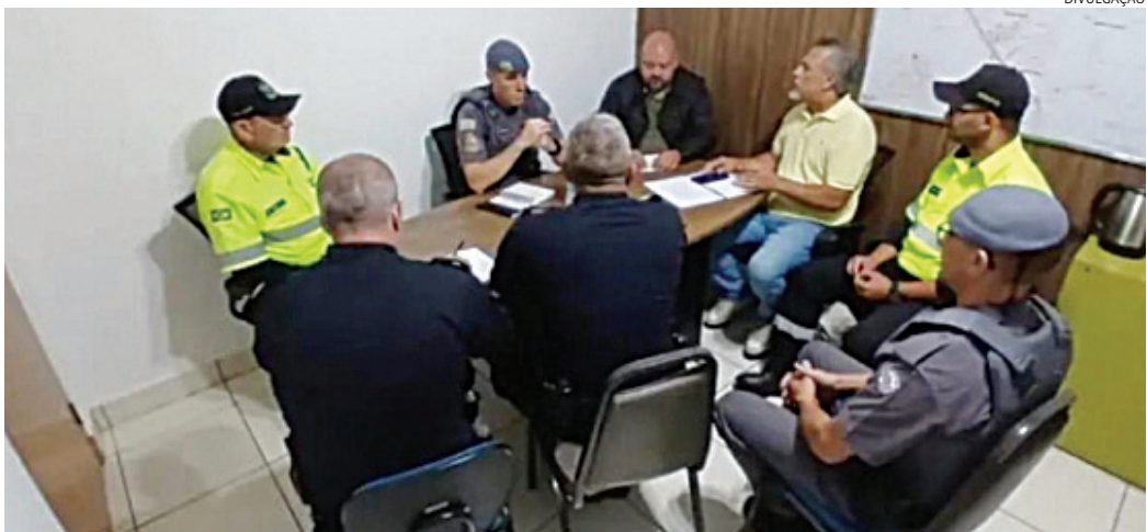
As dicas foram definidas durante reunião para a Operação Natal e Ano Novo

Os dois homens que inicialmente haviam sido detidos para averiguação aproveitaram a confusão para fugir e estão sendo procurados pela polícia.