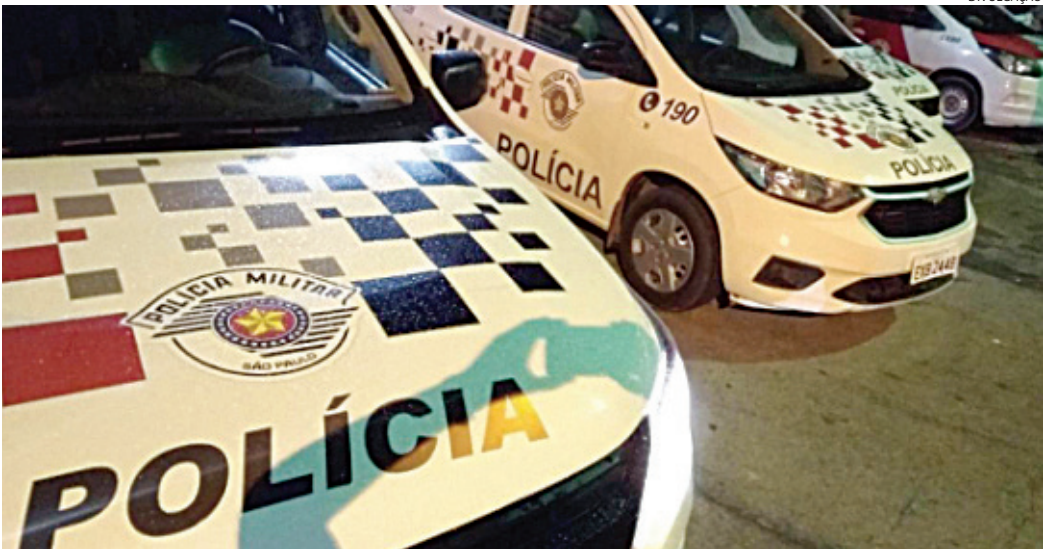
As drogas foram apreendidas pelos policiais militares