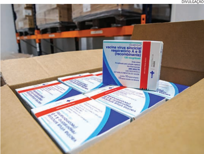
Em Jundiaí são 1.414 doses nesta primeira leva.

A partir desta sexta-feira (12), gestantes de Jundiaí já poderão tomar a vacina contra o vírus sincicial respiratório (VSR), causador da bronquiolite em bebês. O imunizante será ofertado em todas as Unidades Básicas de Saúde (UBSs) e, no sábado (13), será disponibilizado na ação de multivacinação que ocorre no Espaço Jundiaí Empreendedor (Piso G3 do Maxi Shopping), das 10h às 18h. A Secretaria de Estado da Saúde de São Paulo começou a distribuição de mais de 134 mil doses da vacina aos 645 municípios e Jundiaí recebeu 1.414 doses nesta primeira leva. A produção dos imunizantes é do Instituto Butantan, em parceria com a farmacêutica norte-americana Pfizer. A vacina é destinada a gestantes a partir da 28ª semana de gravidez e aplicada em dose única, conforme orientações do Programa Nacional de Imunizações, do Ministério da Saúde. Para receber o imunizante, basta apresentar documento com CPF e cartão da gestante ou documento que comprove a idade gestacional. As doses podem ser aplicadas no mesmo dia de ou-