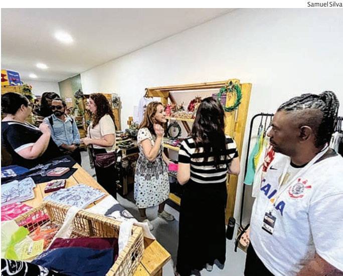
Espaço contará com incubadoras que irão promover conhecimento

Com música, dança e a participação de dezenas de assistidos da rede socio-assistencial, a Prefeitura de Jundiaí inaugurou nesta quinta-feira (11) a Vila de Oportunidades, novo equipamento da Secretaria Municipal de Assistência e Desenvolvimento Social (SMADS). Instalado no Espaço Expressa, o complexo íntegro, em um único local, políticas de geração de renda, qualificação profissional, segurança alimentar e inclusão produtiva. O evento também marcou o lançamento oficial da moeda social Japi, destinada a pessoas em situação de vulnerabilidade cadastradas nos programas municipais. A moeda permitirá a compra de produtos do cotidiano, como roupas e alimentos, em equipamentos da rede, como CRAS e Centro POP. Entre os ambientes que compõem a Vila de Oportunidades está o Banho e Tosa Social, uma incubadora socioprodutiva para pessoas acompanhadas pe-