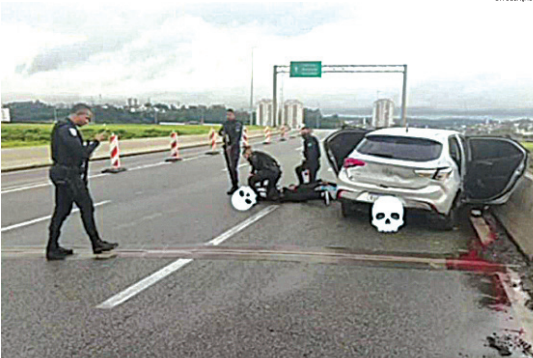
Quase R$ 90 mil em celulares, iPhones e tablets foram recuperados

Além disso, o planejamento do crime envolvia um acordo com integrantes de uma facção criminosa de Jundiaí. O grupo com-