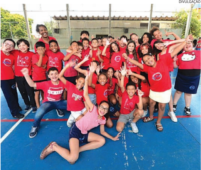
As férias começam nesta sexta e o retorno está previsto para 2 de fevereiro

O ano letivo termina nesta sexta-feira (12) para os mais de 3 milhões de estudantes matriculados nas escolas da Secretaria da Educação do Estado de São Paulo (Seduc-SP). A partir do dia 15 de dezembro, responsáveis e alunos do Ensino Fundamental e Médio podem consultar as notas do quarto bimestre no aplicativo e site Sala do Futuro. Para 2026, a volta às aulas está marcada para 2 de fevereiro. Mesmo sem aulas, pelo terceiro ano seguido, as unidades estaduais permanecerão com as portas abertas no próximo mês e vão oferecer almoço para alunos da rede de segunda a sexta-feira, das 11h às 13h30, entre os dias 5 e 30 de janeiro. Para evitar desperdício, a Seduc-SP orienta que as famílias interessadas registrem o pedido na própria escola ou na SED (Secretaria Escolar Digital) até 12 de dezembro. “O cardápio das férias de janeiro segue o cuidado com os grupos nutricionais oferecidos às crianças, adolescentes e adultos que estudam na rede. No recesso do meio do ano,