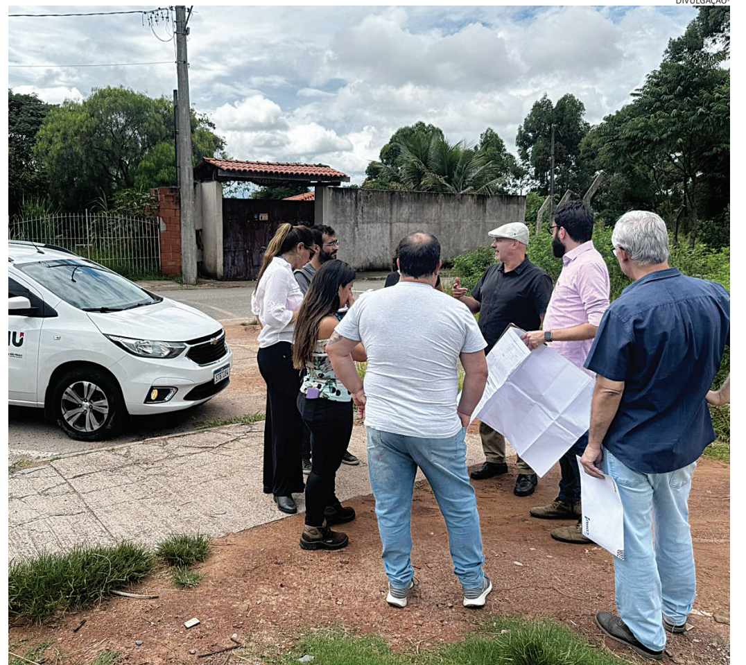
Área já está sendo estudada para criar alternativas habitacionais em Ivoturucaia

A articulação entre municípios e governo estadual segue em andamento para viabilizar a execução das obras e estruturar soluções de longo prazo para o desenvolvimento urbano sustentável da região.