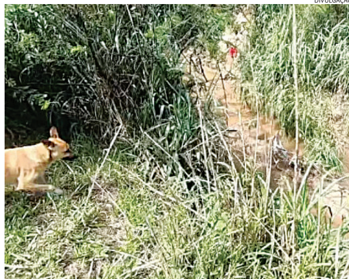
Ele pulou do barranco e caiu no rio, onde acabou preso

Ao receber voz se parada, ele correu para uma área de mata, por onde foi