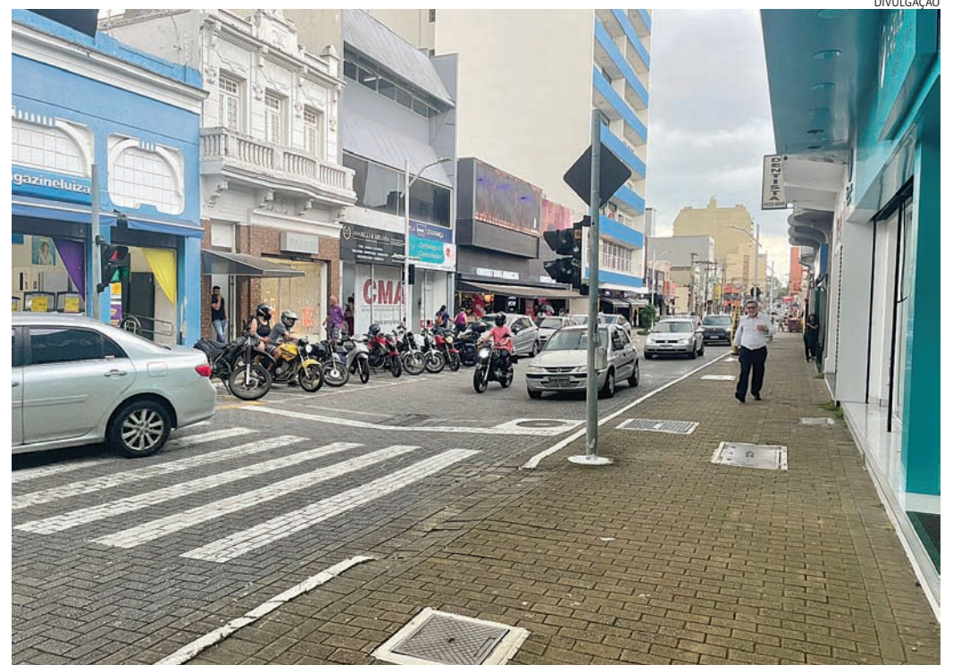
Lojas fechadas e falta de infraestrutura refletem a crise do comércio no Centro de Jundiaí