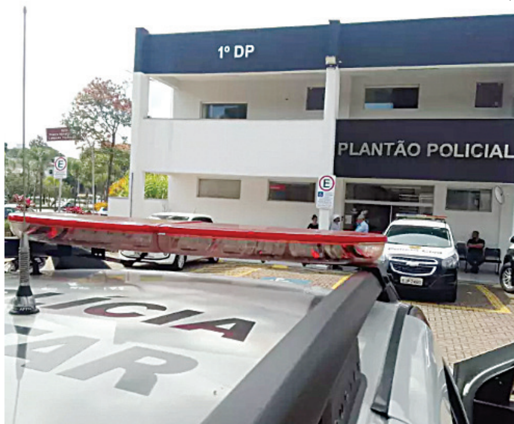
A PM recuperou o caminhão e a GM prendeu um suspeito do crime

Com medo ele parou, e logo foi rendido. Um veículo Uno se juntou ao bando e