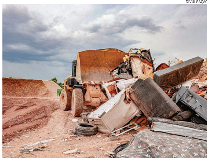
Madeira dos móveis recolhidos pelo cata-treco é triturada