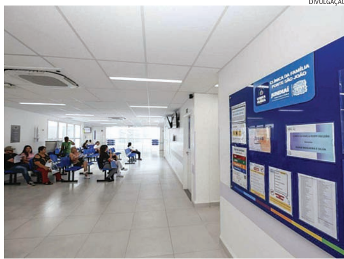
Ao todo, em torno de 12 mil pessoas passam a ser atendidas no local

A Clínica da Família Ponte São João tem cerca de 1,2 mil m 2 de construção. Atualmente, conta com quatro equipes de Estratégia de Saúde da Família (ESF), compostas por multiprofissionais: médicos, enfermeiros, técnicos de enfermagem, odontólogos e auxiliares de dentista, além de equipe Emulti, com psicólogos, nutricionistas, terapeutas ocupacionais, educadores físicos, fisioterapeutas, entre outros profissionais. No prédio também