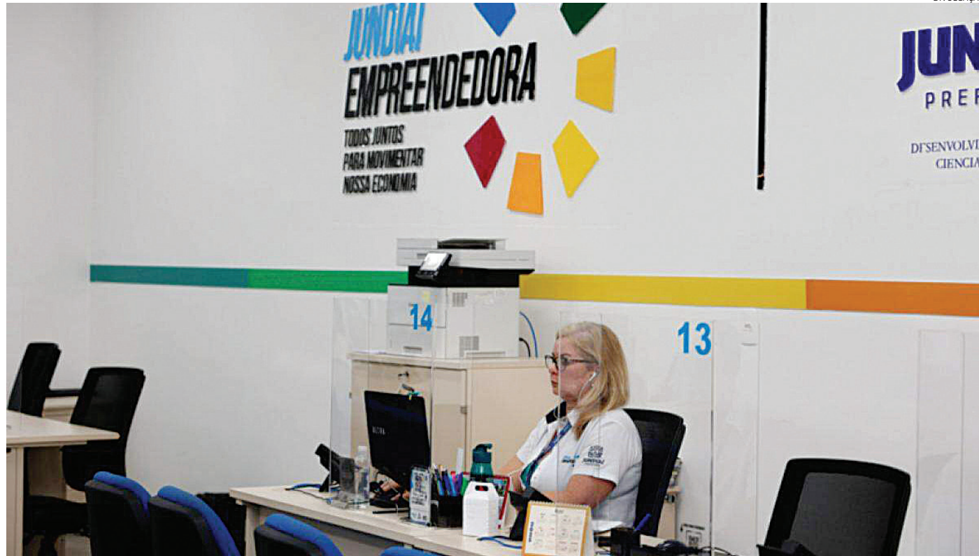
O Espaço Jundiaí Empreendedora, localizado no Maxi Shopping, oferece diversos serviços voltados aos empreendedores

importância da parceria entre o poder público, a iniciativa privada e entidades do terceiro setor. O Programa Jundiaí Empreendedora facilita o acesso dos empreendedores aos serviços públicos necessários para abertura, regularização e crescimento dos seus negócios.