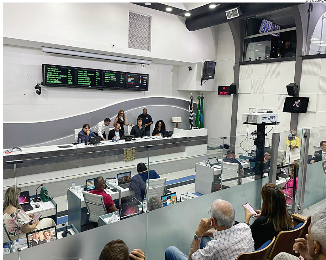
Entre os principais itens da pauta está o veto à lei que cria política municipal de proteção a crianças com TEA