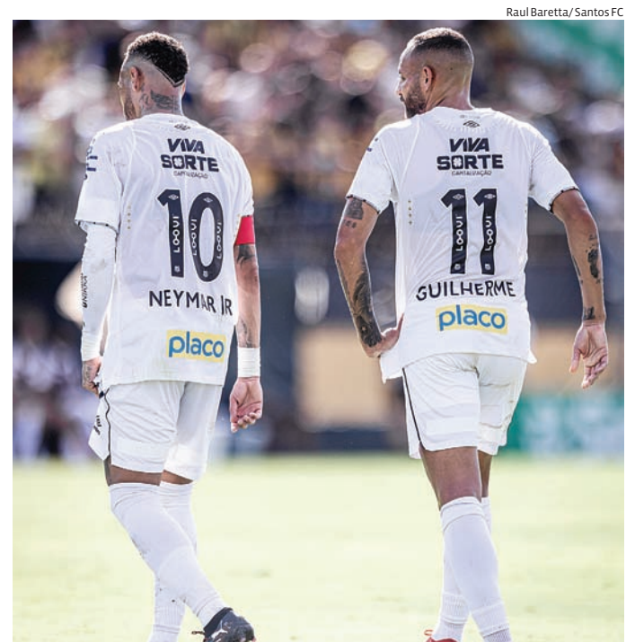
No momento, o Santos está fora da zona de classificação para o mata-mata