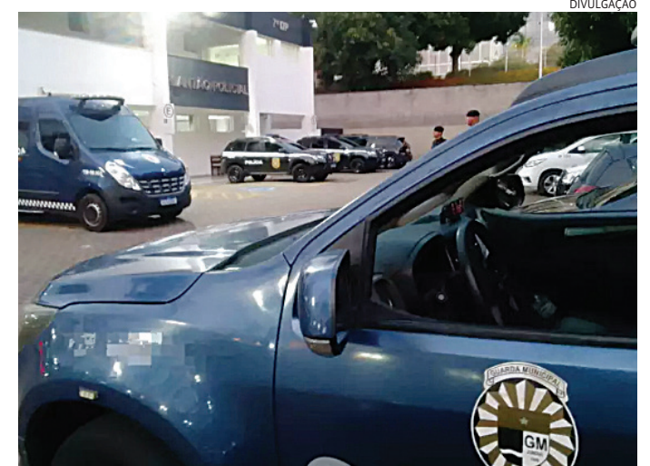
Os agentes levaram o criminoso para o Plantão, onde ele foi preso

Os agentes foram para o bairro e, durante o patrulhamento, localizaram um