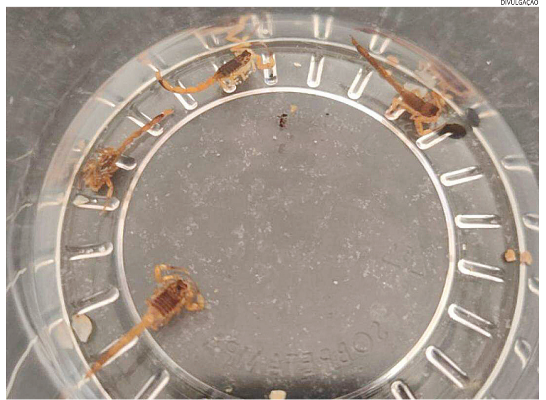
Na casa dos pais de Bruna, na Vila Graff, os escorpiões encontrados são pequenos

A UGPS afirma que a Visam monitora a população de escorpiões e promove