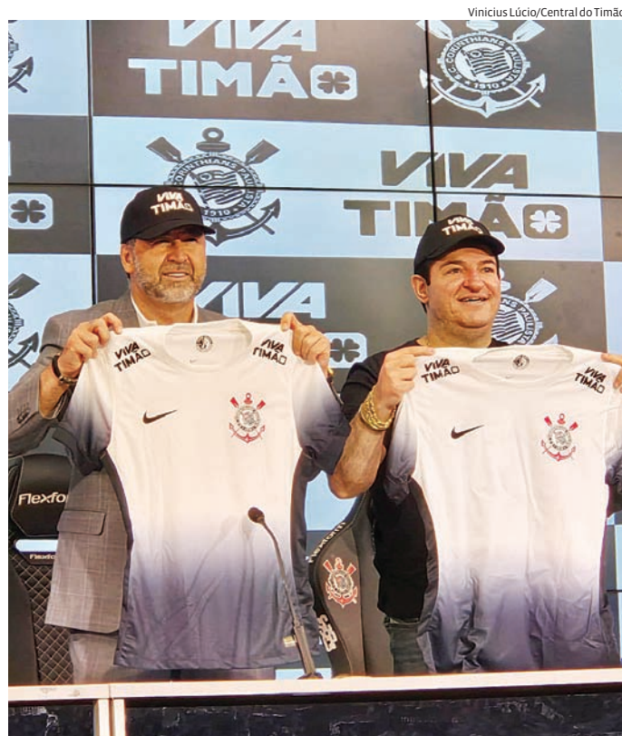
A empresa estampará as partes superiores da camisa

A "Viva Timão" é um produto destinado à torcida do Corinthians que funcionará como um título de capitalização. O