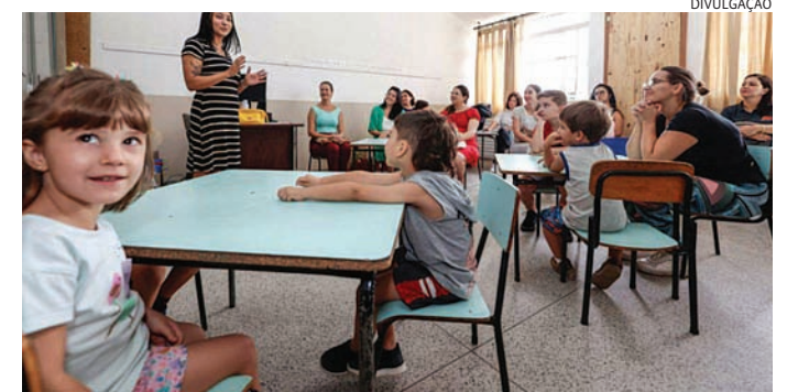
A volta às aulas terá entrega gradual de uniformes e materiais

Acerca dos materiais didáticos, a UGE informa que neste ano letivo os estudantes do Ensino Fundamental conta-