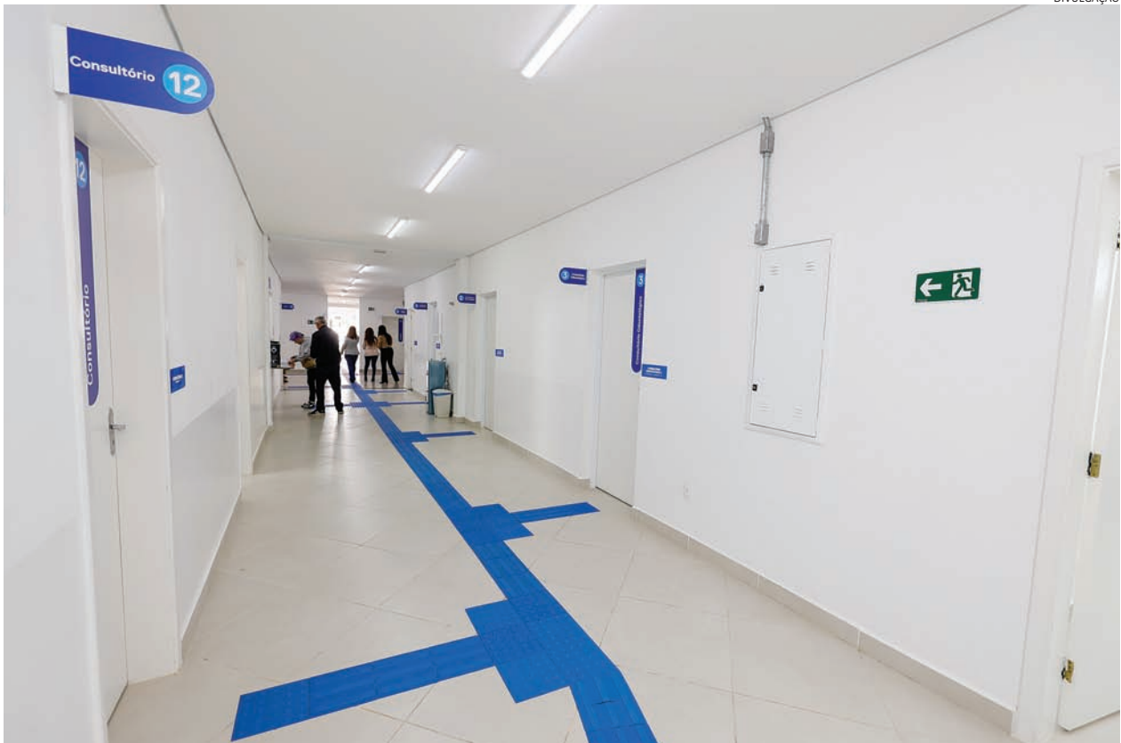
A obra, que ampliou quase 40% o prédio foi finalizada recentemente e estava prevista para ser entregue em dezembro do ano passado

Um bolo de cenoura coberto com brigadeiro, acompanhado de uma xícara de chocolate quente, e uma fornada de pão de queijo pode ser uma opção convidativa para o lanche em dias