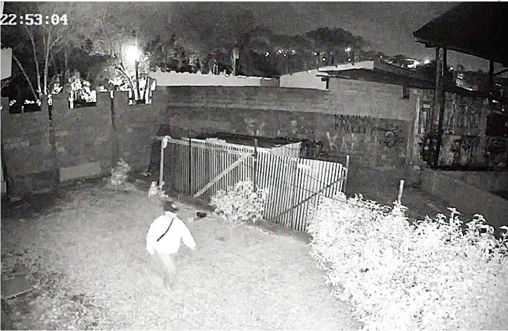
Ele foi flagrado por câmeras de monitoramento invadindo o local

Assim, a equipe deu voz de prisão e o conduziu para delegacia, onde foi apresentado à autoridade policial, que determinou a prisão em flagrante por furto qualificado.