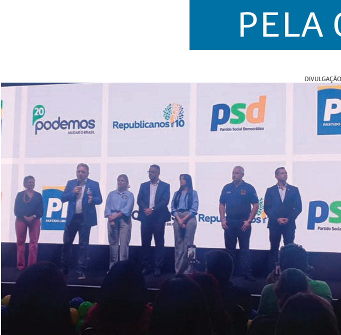
A candidatura foi oficializada durante a convenção realizada quinta-feira

Os Estados Unidos (EUA) reconheceram a vitória do opositor Edmundo González na eleição da Venezuela mesmo sem que tenham sido feito as auditorias dos resultados emitidos pelo Conselho Nacional Eleitoral (CNE) do país. Em resposta, Nicolás Maduro diz que EUA “devem manter o nariz fora da Venezuela”. O Departamento de Estado dos EUA usou como base os documentos divulgados pela oposição. A campanha de Edmundo González publicou na internet as atas eleitorais das mesas de votação que eles tiveram acesso e que