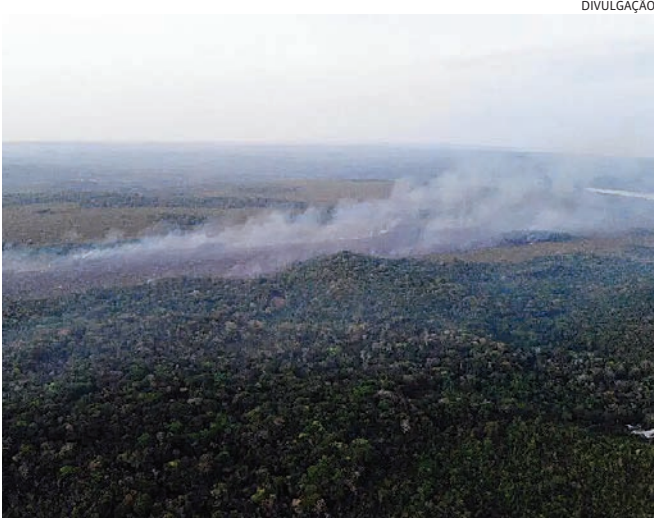
A sala foi criada na última quinta-feira (1) para fazer o monitoramento

O Ministério da Saúde criou a Sala de Situação Nacional de Emergências Climáticas em Saúde. O mecanismo, inédito na pasta, é uma ferramenta de gestão para planejar respostas às emergências como queimadas, escassez de água, chuvas intensas e outras ocorrências relacionadas ao clima. Criada na última quinta-feira (1), a sala passa a monitorar duas situações relacionadas ao clima: queimadas intensas no Pantanal e seca prolongada na Região Amazônica. Entre as atribuições da sala de situação, está a elaboração de um plano de adaptação do setor devido às mudanças climáticas