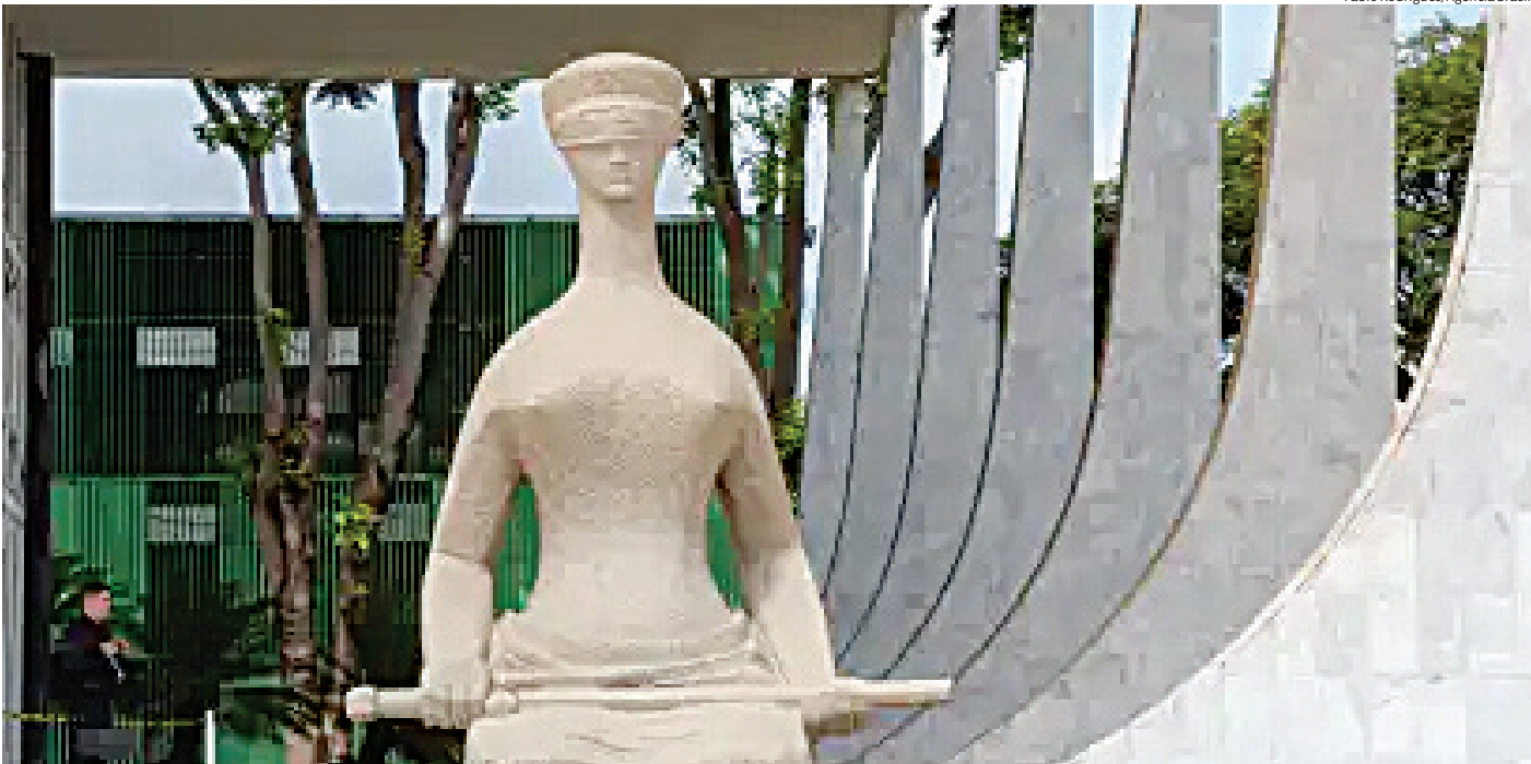
As novas regulamentações incluem desde a proibição do uso de deepfakes até a obrigatoriedade de aviso sobre o uso de IA na propaganda eleitoral

Dois novos artigos foram adicionados à Resolução nº 23.610/2019. O artigo 9º-C proíbe a utilização de conteúdos fabricados ou manipulados para difundir informações falsas ou descontextualizadas que possam prejudicar o equilíbrio do pleito ou a integridade do processo eleitoral, sob pena de caracterizar abuso dos meios de comunicação, re-