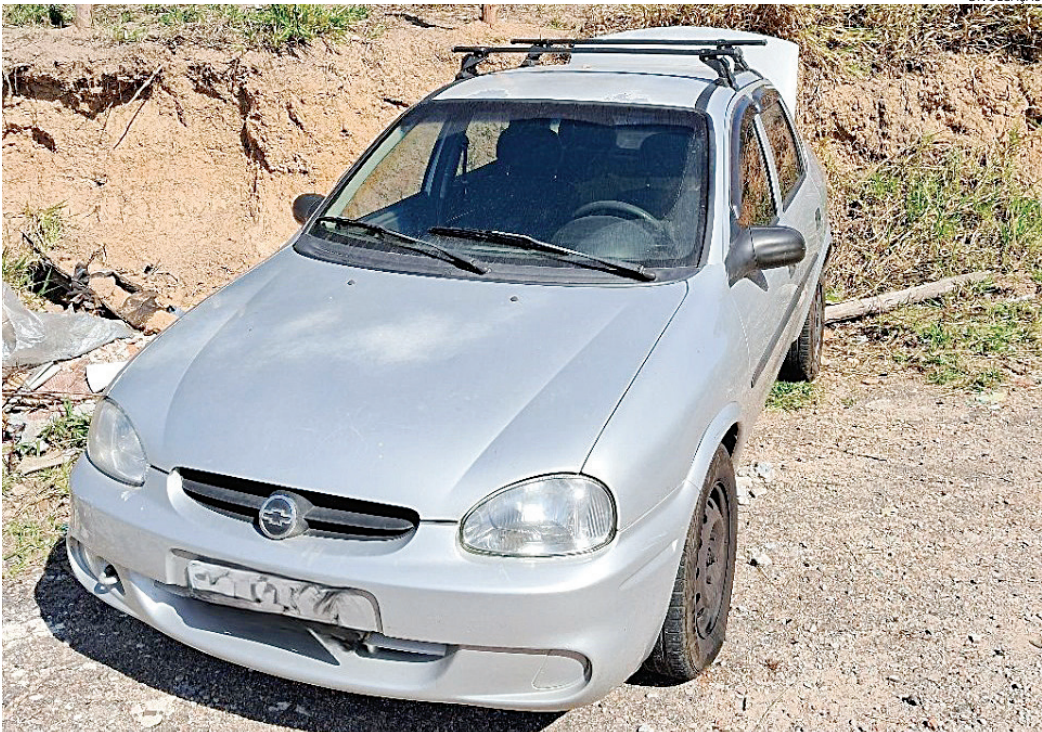
Os guardas localizaram os dois carros abandonados no bairro Cidade Nova

Durante o tempo em que os criminosos permaneceram na residência,