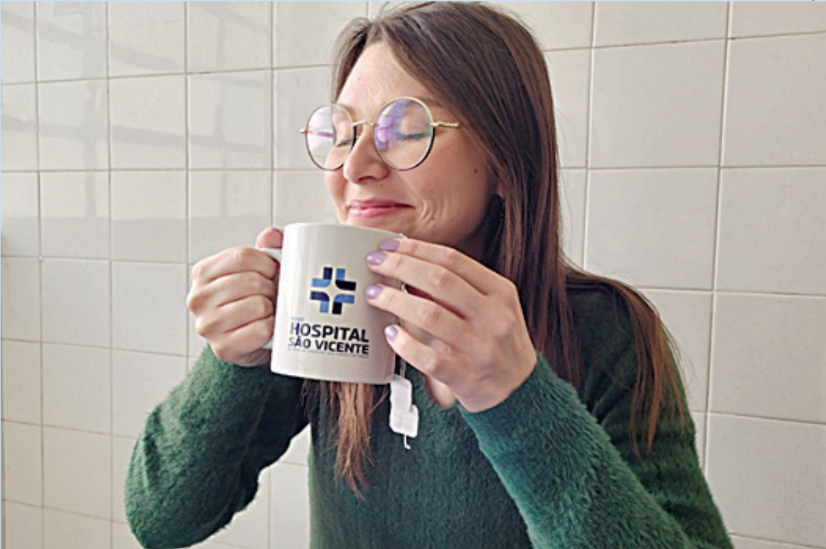
As bebidas quentes, como chás, são alternativas rápidas, acessíveis e aconchegantes

Justamente através do judô que tem o maior número de medalhas olímpicas do Brasil na história, saiu a primeira