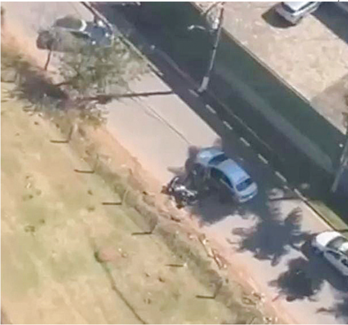
Momento em que ele é fechado pela GM

A PM o localizou e iniciou perseguição, que