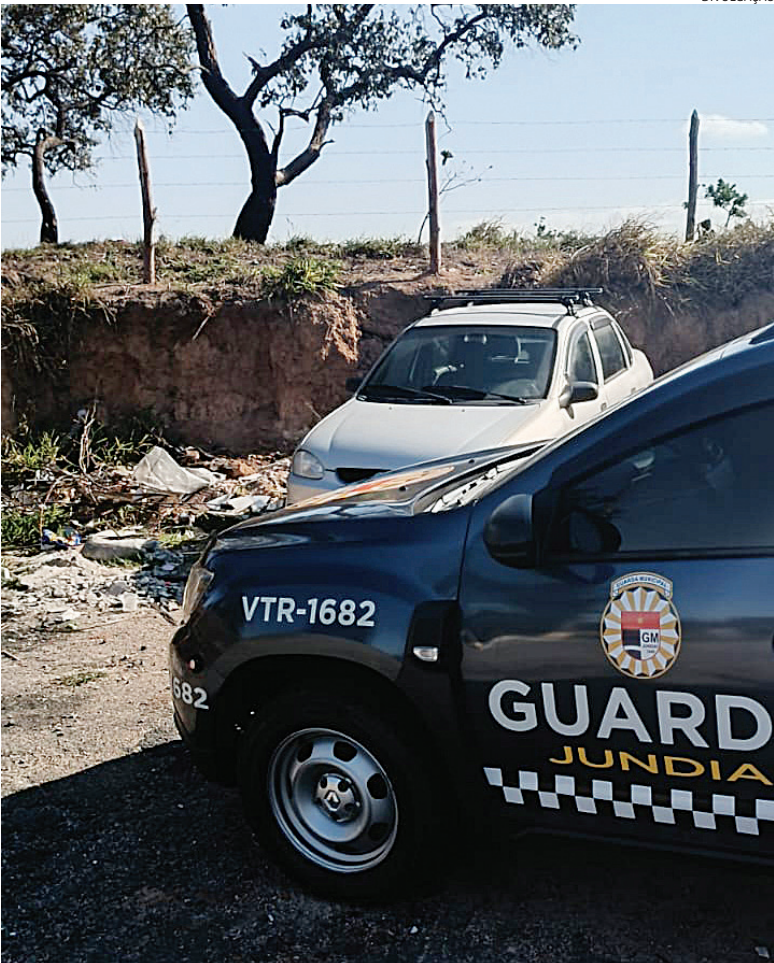
Algumas horas após o crime, guardas municipais recuperaram os dois carros

Ladrões armados invadiram uma casa na Vila Maringá, em Jundiáí, no fim da noite de quarta-feira (31), e roubaram dois veículos, além de outros bens. Não bastasse a violência do assalto, por si só,