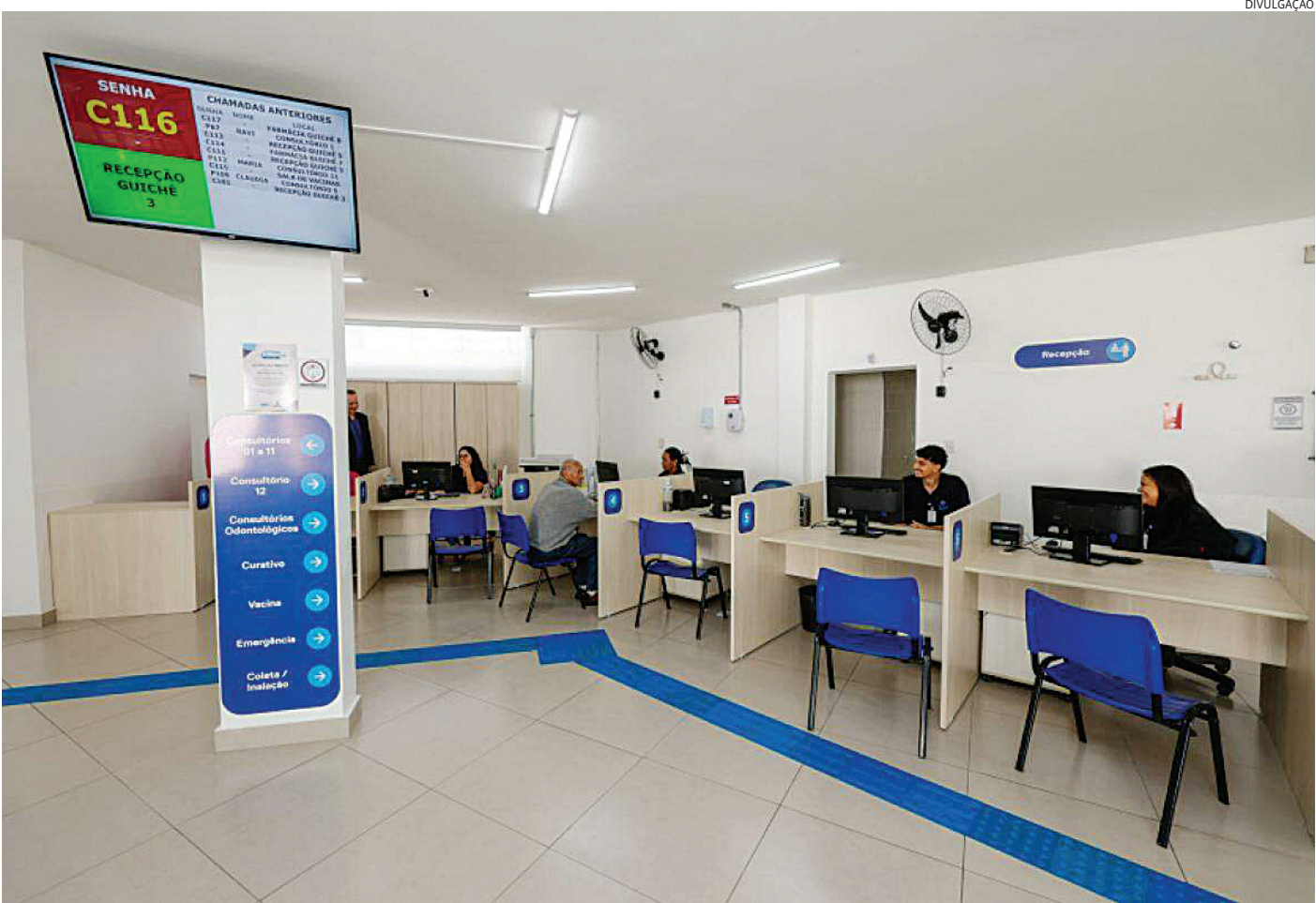
O prédio passa a contar com quase 1.000 m², 15 consultórios, sala de vacina ampliada, farmácia entre outras melhorias

A UBS Morada das Vinhas conta com 14.388 ca-