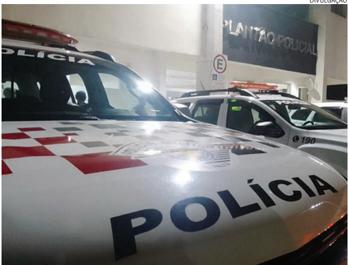
A PM foi acionada e conduziu o caso para ser registrado na delegacia