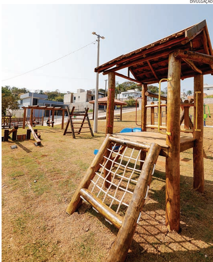
Oferecer áreas de lazer apoia o desenvolvimento infantil

Contar com espaços próximos às residências para as atividades ao ar livre é uma das necessidades indicadas pelas redes internacionais de desen-