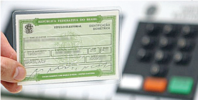
Prazo para obter primeiro título foi até maio e será reaberto após eleições

Quando se compara a faixa etária dos 16 e 17 anos em relação ao eleitoral total das cidades, vem de Louveira o maior percentual de eleitores jovens, com 1,3% de todos os eleitores. O menor percentual de jovens eleitores está em Jundiaí,