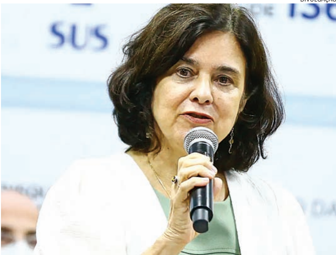
Ministra da Saúde, Nísia Trindade, afirma que pasta vai dar apoio

“Para botar ordem nos casos que se instalou no país com essa verdadeira pandemia”, disse Haddad. “A medida provisória, infelizmente, não foi votada e caducou. Nós aproveitamos um outro projeto de lei e, no final do ano passado, conseguimos incluir nesse outro projeto de lei o texto dessa medida