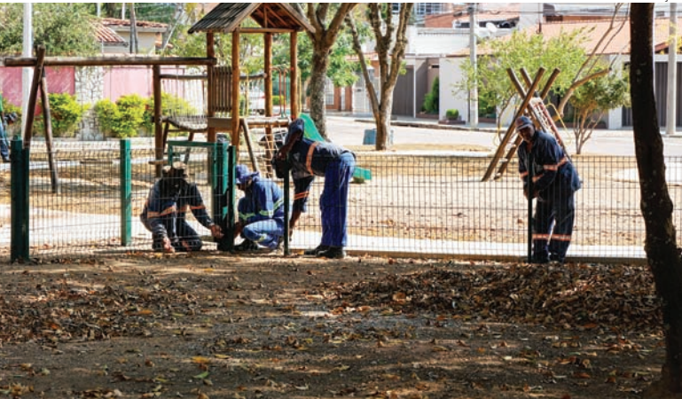
Os pets ganham cercado para salto, rampa inclinada, slalom e gangorra simples

tros nove espaços dedicados e adequados à diversão dos cães e gatos. Além dos brinquedos para os pets, os novos espaços também são dedicados às crianças. Cidades 5