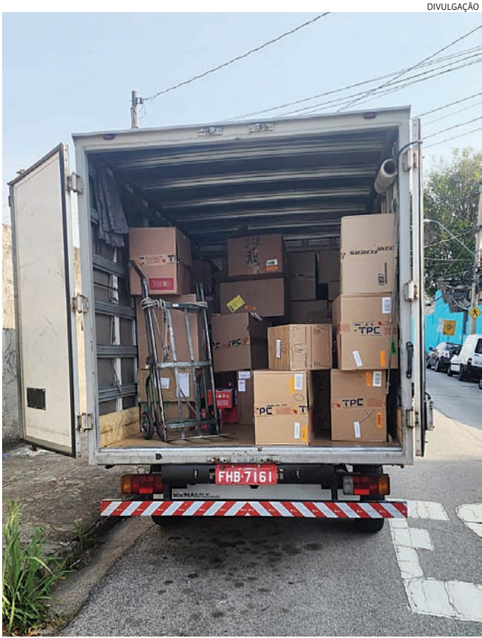
O caminhão e a carga foram recuperados pelos policiais civis

Os quatro suspeitos foram conduzidos à sede da DIG, onde acabaram presos em flagrante. “As investigações prosseguem, pois há fortes suspeitas de que o bando seja responsável por outros roubos na região” completou o delegado.