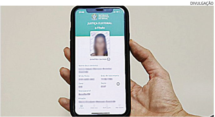
TSE recomenda checar se o aplicativo está atualizado no celular

Com a atualização feita, basta informar os dados pessoais e realizar a conferência biométrica – para quem tem esses dados coletados pela Justiça Eleito-