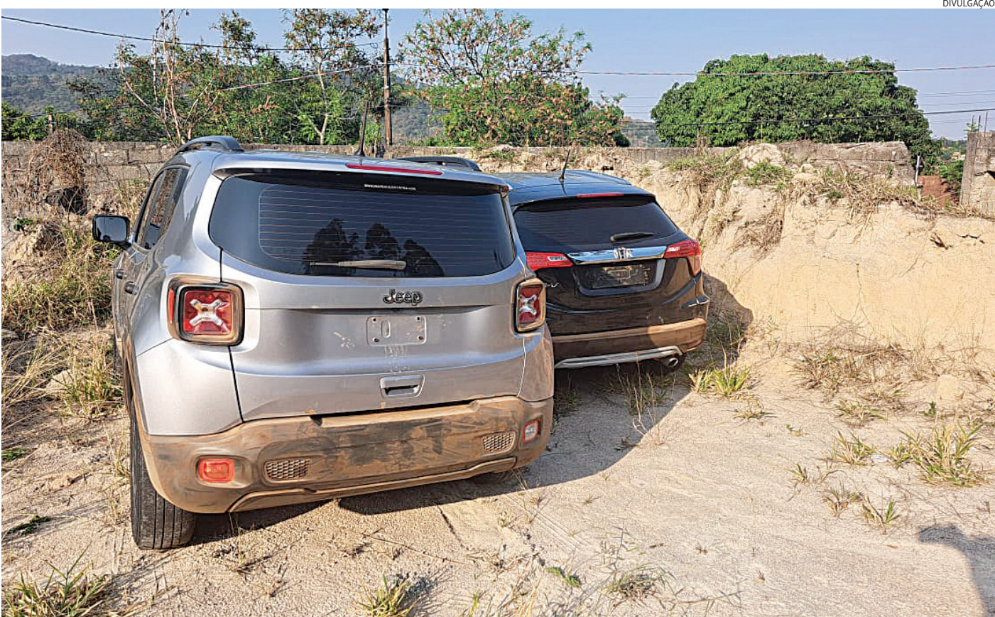
Os dois carros haviam sido abandonados pela dupla e foram recuperados

De posse das características dos funcionários e dos carros, bem como o emplantamento, os guardas saíram à caça. Enquanto patrulhavam, os agentes receberam informações de que os carros procurados, já sem as placas, haviam dado entrada em alta velocidade no bairro Terras de São Sebastião.