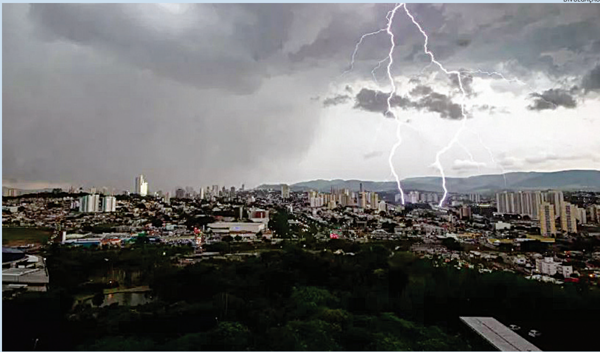
Habitantes têm de se precaver das chuvas intensas da próxima estação

plano preventivo para a chegada do verão e investem em obras de dragagem, limpeza da rede urbana, obras de contenção e retirada de moradores de áreas vulneráveis. Cidades 4