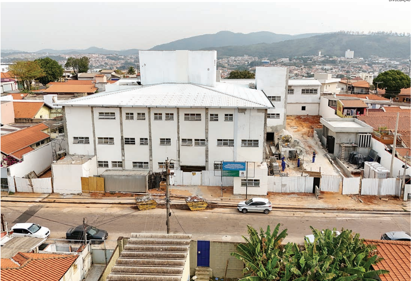
Investimentos foram realizados em toda a cidade, como o Centro de Especialidades na Vila Progresso

Os investimentos foram realizados em todas as regiões da cidade, sendo que a região Noroeste responde por 25% do valor (R$ 245,6 milhões). As demais regiões seguem com valores em torno de R$ 145 milhões investidos em infraestrutura e serviços públicos. A disparada do investimento para a região Noroeste se deve pela obra – em execução – da ampliação da avenida Frederico Ozanam e seus dispositivos (viadutos, pontes e túnel), bem como a obra que complementa o comple-