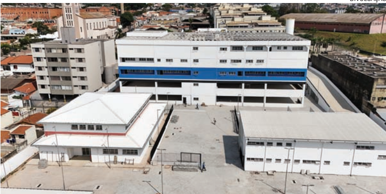
O Centro Integrado de Emergência e Segurança, na Vila Rami, é uma das obras

so - que será entregue no dia 14 de dezembro, aniversário de Jundiáí - e o Centro de Excelência do Basquete, na região da Vila Rio Branco, além da ampliação da avenida Frederico Ozanam. Esta última região foi a que bateu recorde de recursos, com R$ 245,6 milhões investidos no novo complexo viário. Cidades 5