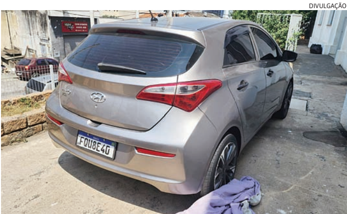
Um dos carros usados pela quadrilha para praticar o roubo

A DIG vinha monitorando a quadrilha e obtendo informações de que pela manhã os suspeitos estavam em pelo menos três carros, circulando nas imediações do Maxi Shopping. Após algum tempo foi detectado que eles haviam deixado o bairro, sendo que logo em seguida houve comunicação de roubo de um caminhão de carga de roupas e sapatos, que seria en-