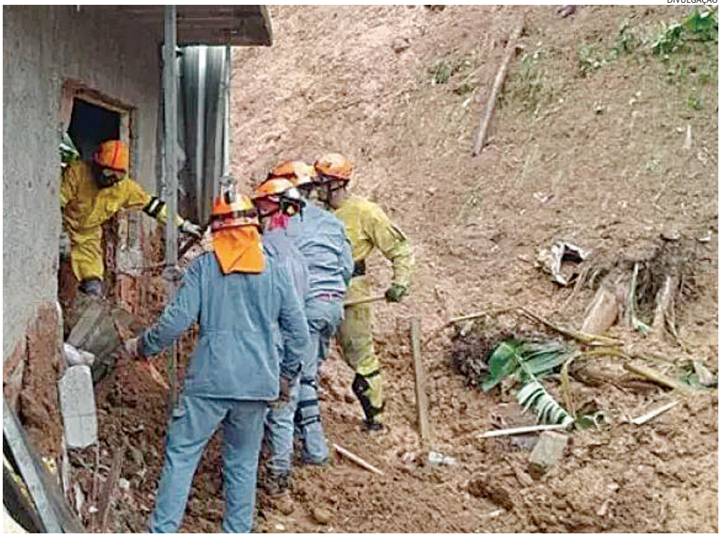
A chuva de 2025 será pior do que anos anteriores e risco aumenta

Em Louveira, a prefeitura informa que faz ações de zeladoria diariamente, com limpeza das galerias de captação de águas pluviais e desassoreamento de cór-