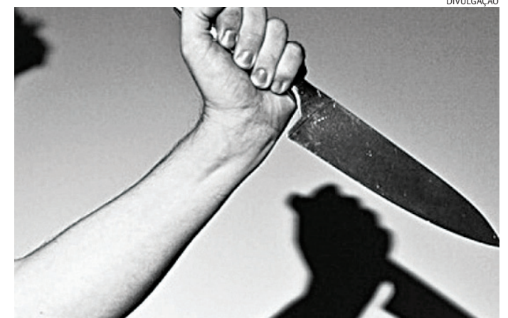
Ambos admitiram as acusações mútuas e foram conduzidos ao DP

Ambos então retornaram para a residência, onde a discussão prosseguiu.