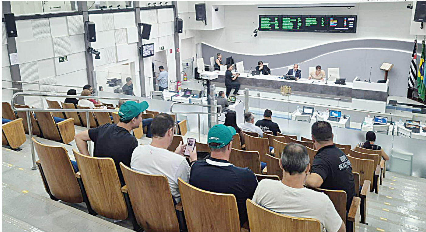
Vereadores analisam hoje mudanças nas gratificações dos secretários municipais

Secretários de Itapeva, no sudoeste paulista, recebem desde 2025 o 13º salário e férias com a apro-