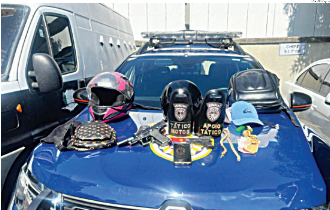
Com a dupla, foram apreendidos uma arma de fogo e um simulacro

Uma motorista de aplicativo foi assaltada por dois bandidos armados, no bairro Vianelo, em Jundiáí, na tarde desta segunda-feira (4). Os criminosos estavam de moto e, após pegarem celular e outros pertences da vítima, eles fugiram. A Polícia Militar foi acionada e compartilhou informações com a Guar-