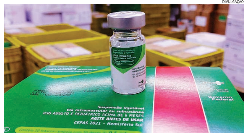
Enquanto casos de gripe avançam, estoques estão mínimos na cidade