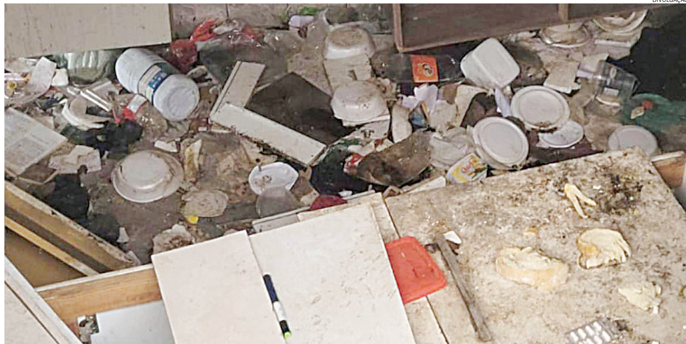
Os grupos de apoios ajudam a identificar a causa do ‘acúmulo’

“Esse acompanhamento em Jundiaí acontece nas