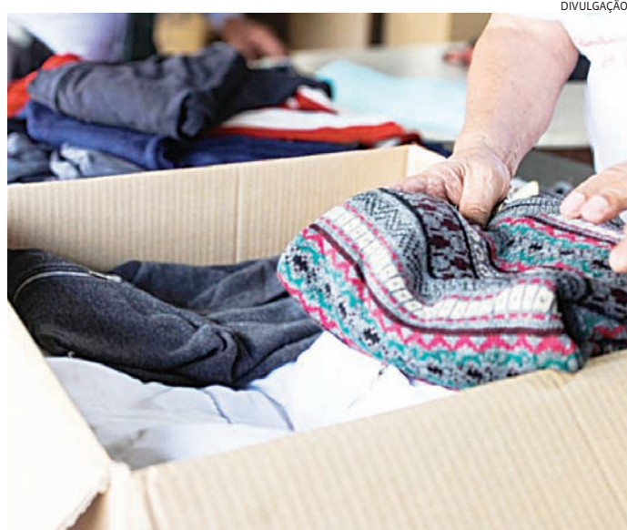
Podem ser doados roupas, cobertores, meias, toucas, cachecóis e calçados

Na capital, as doações também podem ser feitas na estação Sé do metrô, nas estações Tamanduateí, São Caetano e Mauá Linha 10-Turquesa da CPTM e em