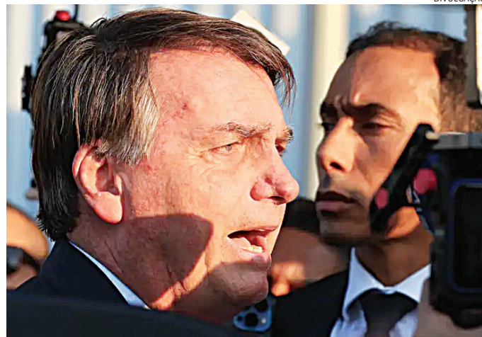
Bolsonaro voltou para prisão domiciliar humanitária, após cirurgia

um procedimento para aumentar o espaço na articulação para o manguito ro-