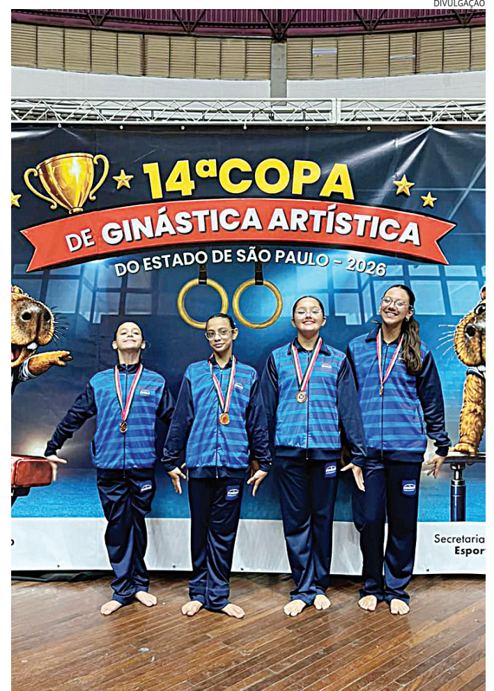
Equipe conquista bons resultados na ginástica artística