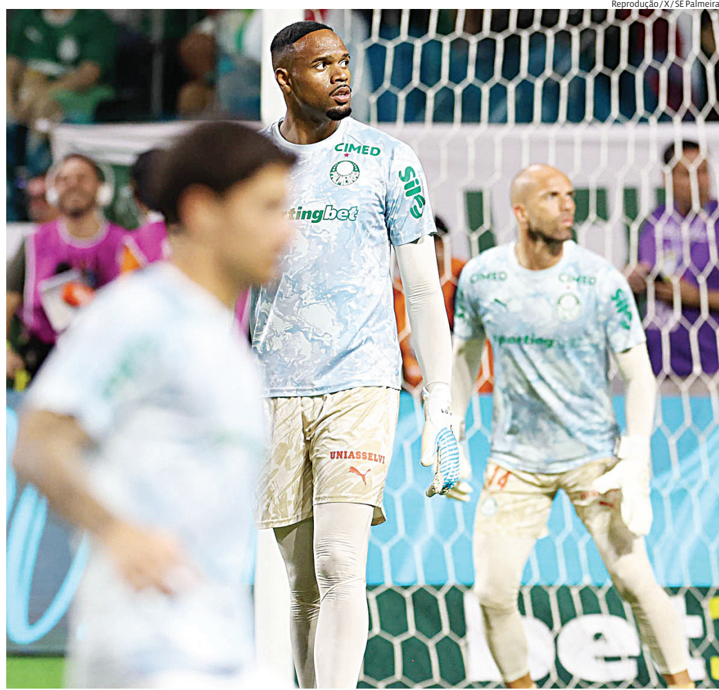
O confronto ganha peso direto na disputa do Grupo F. O Verdão chega à rodada ocupando a segunda colocação

Na partida do primeiro turno, disputada em São Paulo, o Palmeiras venceu por 2 a 1 e assumiu vantagem no histórico recente do confronto. Agora, a equipe brasileira tenta repetir o desempenho fora de casa para ampliar a pontuação e se aproximar matematicamente da vaga. O duelo também marca a volta do clube a Lima em um momento decisivo da competição continental.