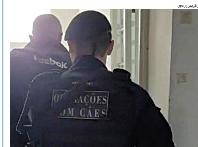
Os guardas municipais prenderam o suspeito

acusações mútuas e foram conduzidos ao Plantão Policial, onde a ocorrência foi registrada como ameaça, injúria, crime de dano e lesão corporal. Ele foi preso em flagrante e ela foi liberada.