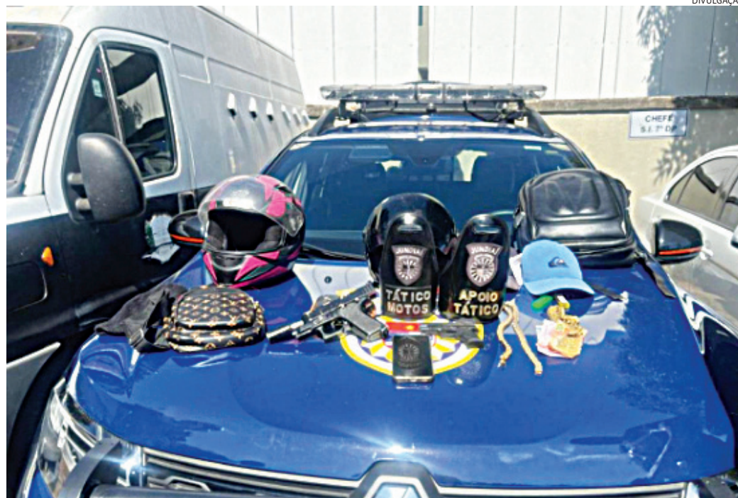
O roubo ocorreu no bairro Vianelo nesta segunda-feira

O crime aconteceu na avenida Odil Campos Saes, onde a motorista havia parado após se sentir mal. Neste momento os assal-