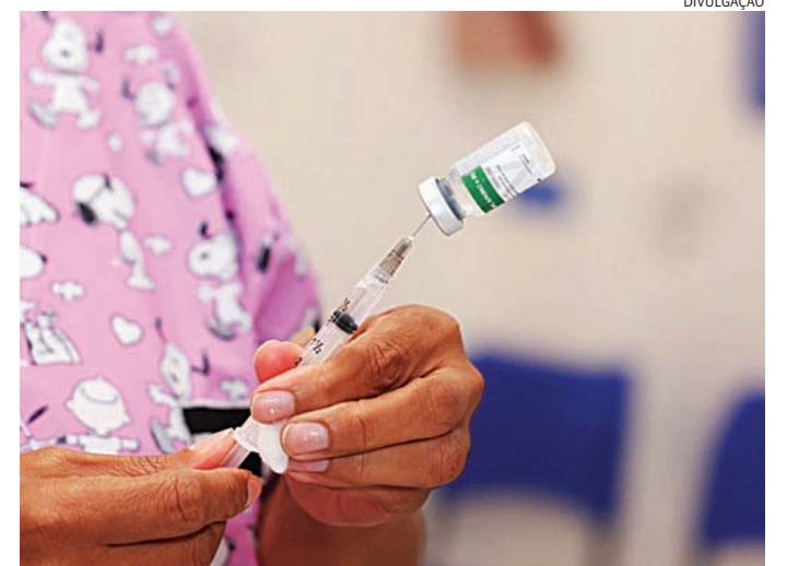
O município conta com cerca de 1,2 mil doses disponíveis

A Prefeitura já solicitou a reposição ao Governo do Estado e deve ampliar a oferta assim que houver a regularização do abastecimento por parte do Ministério da Saúde.