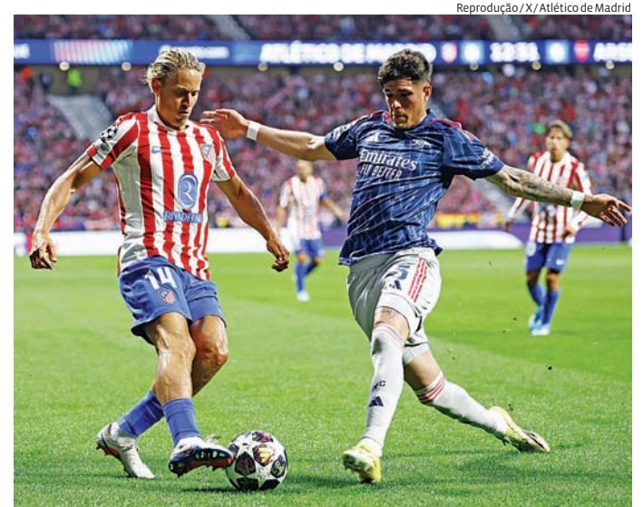
Empate no jogo ida deixa semifinal em aberto em Londres

A partida terá transmissão pelo SBT, TNT e HBO Max. Em caso de novo empate no tempo normal, a decisão seguirá para a prorrogação e, se necessário, disputa por pênaltis para definir o classificado à final da Champions.