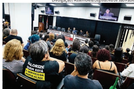
Audiência pública em apoio aos servidores de Louveira ocorreu na última quarta (29)

Servidores municipais de Louveira, em greve desde 23 de abril, levaram à Assembleia Legislativa denúncias contra a gestão local, incluindo demandas por melhores condições de trabalho e reajuste salarial. A mobilização foi tema de audiência pública convocada pelo deputado Carlos Giannazi (PSOL) na última quarta-feira (29), onde representantes do sindicato afirmaram que a prefeitura negou reajuste salarial pelo segundo ano seguido e propôs apenas aumento no vale-alimentação, sem incluir aposentados. Entre os principais pontos, os servidores criticam a elevação da alíquota previdenciária para 16%, onde a mais comum seria 14%; além da contratação emergencial de terceirizados durante a greve o que, segundo o sindicato, pode ferir a legislação. Outro ponto central da pauta é o descumprimento da Lei Federal 15.326/2026, que exige o enquadramento de monitoras de creche como profissionais do magistério, e da Lei 13.935/2019, que obriga a presença de psicólogos e assistentes sociais nas escolas. Durante o evento, foram relatadas substituições ilegais de grevistas por meio de um contrato emergencial de R$ 45 mil por dia com uma organização social (OS), além de denúncias de terceirização irrestrita na educação e saúde, falta de uniformes e atraso em materiais didáticos. As denúncias serão protocoladas no Tribunal de Contas do Estado (TCE) e no Ministério Público. O JJ questionou a prefeitura de Louveira, mas não obteve retorno até o fechamento desta edição.