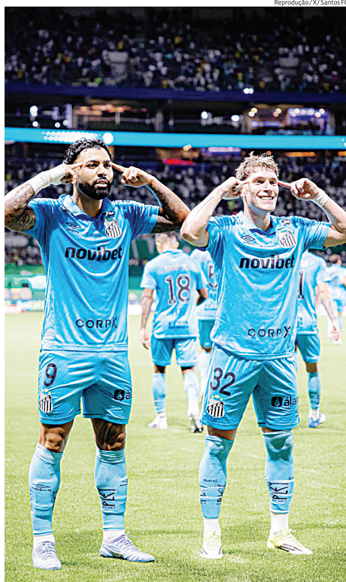
Peixe joga fora e tenta subir na tabela do grupo

A partida terá transmissão pelo SBT, ESPN e Disney+. Um resultado positivo é visto como essencial para o Santos encaminhar a recuperação e seguir competitivo na fase de grupos.