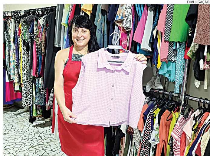
Os preços são a partir de R$ 3 com vendas revertidas para a instituição

O funcionamento do Bazar do Hospital São Vicente depende do recebimento de doações por parte da população. Os interessados