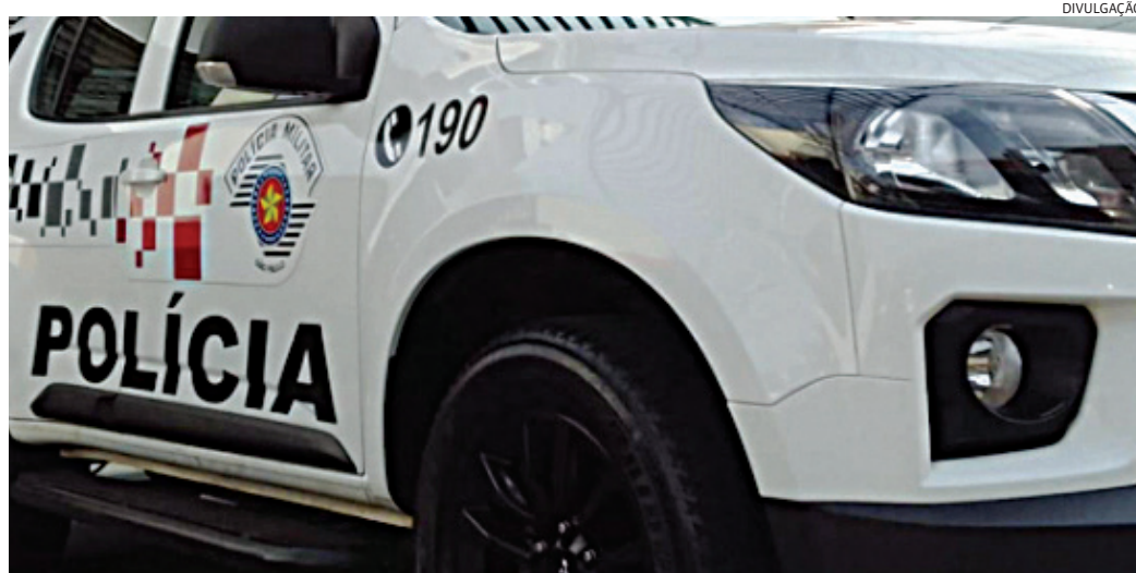
Os policiais o levaram para a delegacia