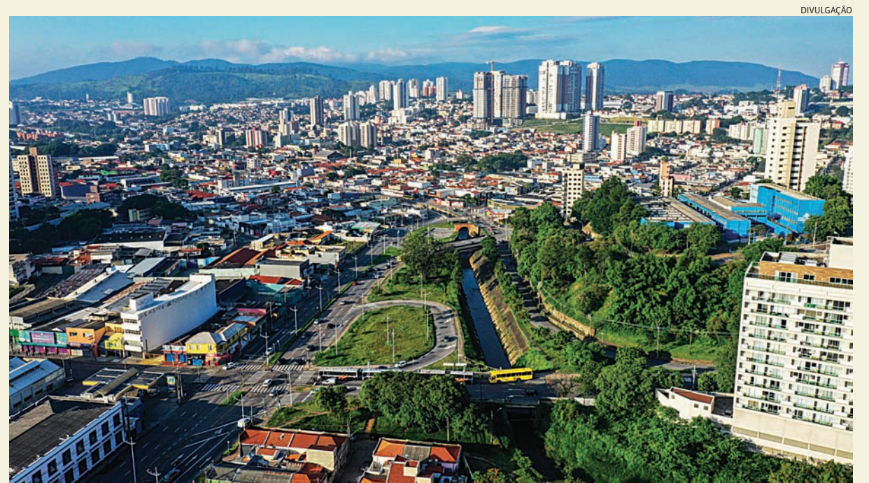
Jundiáí comemora queda no índice de acidentes de trânsito

300 mil habitantes. Nas vias urbanas, o resultado é ainda mais positivo, com Jundiáí no 12º lugar, evidenciando a efetividade das medidas adotadas. Cidades 4