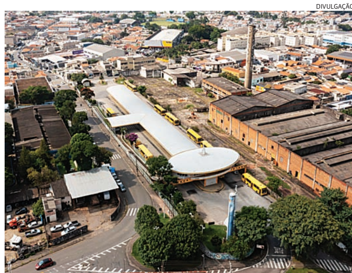
Entre as ações, a revitação de terminais de ônibus

a modernização da frota); articulação para obras estruturantes (estão previstas intervenções como as transposições na Rodovia